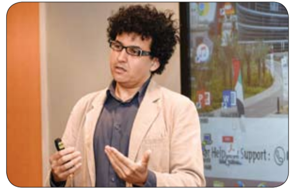
جامعة الإمارات تنظم ندوة حول تكنولوجيا الشبكات