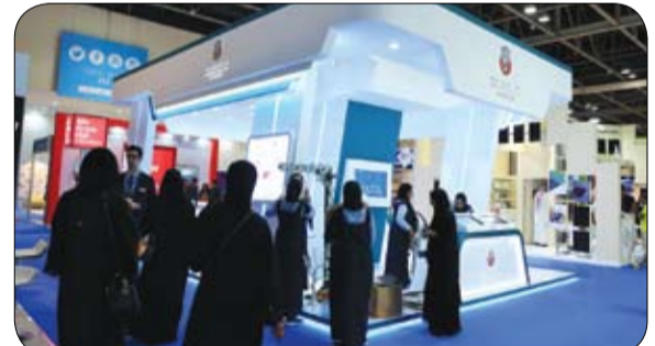
جناح الدائرة يستضيف أبرز المخترعين في مبتكر 2018

ويج محور زايد وبناء المجتمع الإماراتي: العين نموذجاً، تحدث الدكتور حمدان الدرعي رئيس قسم البحوث والدراسات في مركز زايد للدراسات والبحوث بنادي تراث الإمارات، مؤكداً أن مبادرة عام زايد مبادرة كبيرة ومهمة جداً، لأنه باني الإمارات، ومن حقه علينا إبداء التقدير والوفاء له، كونه الأب المؤسس للدولة. وتناول الدكتور حمدان أنه بعض النقاط والمحطات في سيرة الشيخ زايد مشيراً إلى أنه رحمه الله استطاع تجاوز العقبات والصعاب التي مر بها ليصبح هذا الرجل العظيم الذي نعرفه اليوم. ووصف الدرعي الشيخ زايد رحمه الله، بأنه "نموذج الرجل المبكر"، فقد كان همه بناء الإنسان. وقال الدكتور حمدان الدرعي إن هناك نقطة تكشف عن شخصية الشيخ زايد، وهي كيف استطاع أن يدير الواحات الست نياحة من أخيه حاكم أبوظبي، حيث أنقذ مدينة العين من الجفاف. حيث يشير أحد البريطانيين إدوارد هندرسون - إلى أن البساتين في العين كانت لا تسقى إلا مرة كل 70 يوماً، وبعد الشيخ زايد انخفضت المدة إلى 36 يوماً ثم إلى 3 أسابيع. وتحدث الدرعي عن اهتمام الشيخ زايد رحمه الله بالتعليم بوصفه أداة لا غنى عنها للتنمية وبناء الإنسان،