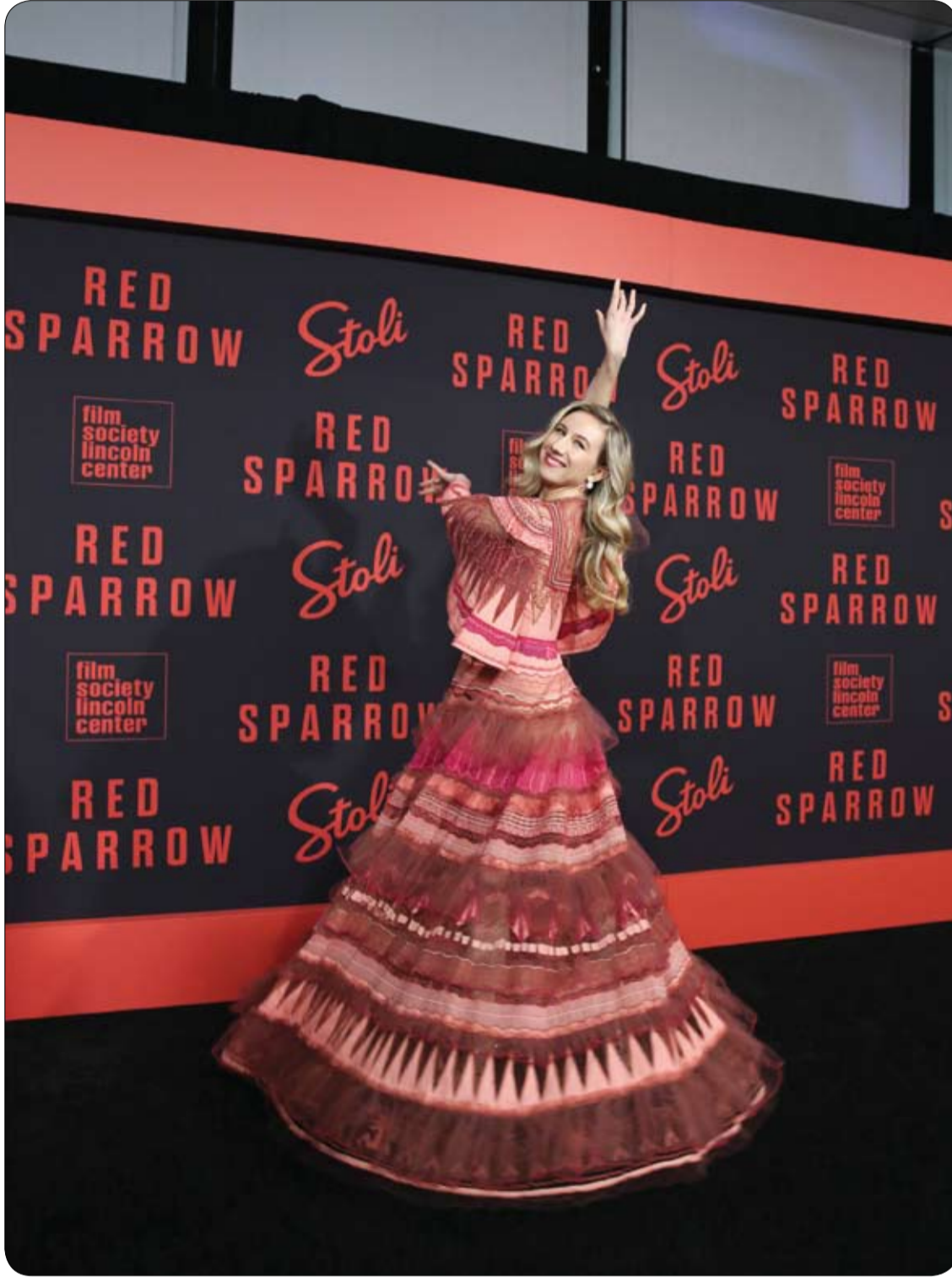
الراقصة إيزابيلا بويستون لدى وصولها لحضور العرض الأول في نيويورك لفيلم "العصفور الأحمر". (رويترز)

قالت دراسة طبية حديثة، أجريت في جامعة بنسلفانيا بالولايات المتحدة: إن زيت اللفت (السلمج) يقضي على الكرش ويذيب شحوم البطن، بنسبة 40% من خلال تناوله في الطعام. وذكرت الدراسة أن زيت اللفت يتفوق على نظيره المصنوع من الزيتون أو عباد الشمس من ناحية قدرته على تقليل الشحم وتحسين الصحة العامة. ويحتوي زيت بذور اللفت على نسبة 4% فقط من الدهون المشبعة مقارنة بنسبة 14% في زيت الزيتون. كما أنه يحتوي على معدلات أعلى من أحماض دهنية مهمة، هي أوميغا 3 و6 و9، مقارنة بمحتويات الزيوت النباتية الأخرى. وقالت الدراسة: إن الدهون غير المشبعة في زيت اللفت تسهل تحلل دهون الجسم، وخصوصاً تلك التي تتراكم في البطن، حيث يحتوي كل 100 جرام من اللفت الطازج، بحسب بيانات وزارة الزراعة الأمريكية، على 50 سعرة حرارية، وعلى 0.7 دهون، و10 جرام كربوهيدرات، و2 جرام ألياف، و3.3 جم من البروتينات. أجرى بيني م. كريس-أثرتون، من جامعة بنسلفانيا، هو وفريقه تجاربهم على متطوعين من البدناء الذين يرغبون في تقليل أوزانهم، وتبين أنه زيت اللفت هو الأكثر فاعلية بعدما تناولوا الخاضعون للتجارب وعددهم 101 أطعمة بمختلف الزيوت النباتية. وأظهرت النتائج أن مجموعات زيت اللفت فقدوا نصف رطل من الشحم مقارنة مع المتطوعين من المجموعات الأخرى. وركز الشحم المتبدد في هؤلاء المتطوعين في منطقة البطن، وفقاً لوكالة الأنباء الألمانية. (رويترز)