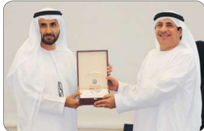
أجمع الباحثون على أن زايد بنى المجتمع الإماراتي من خلال بناء الإنسان