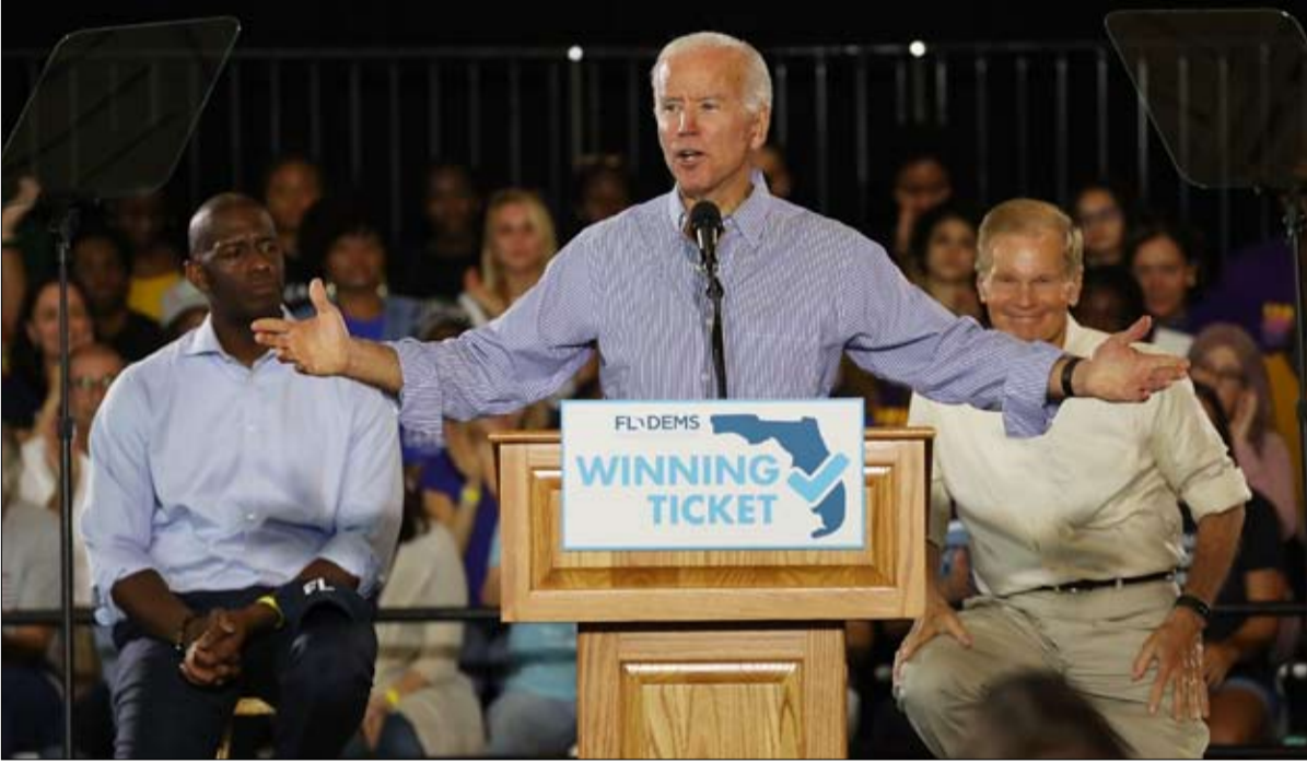
سياسي على الطريقة القديمة