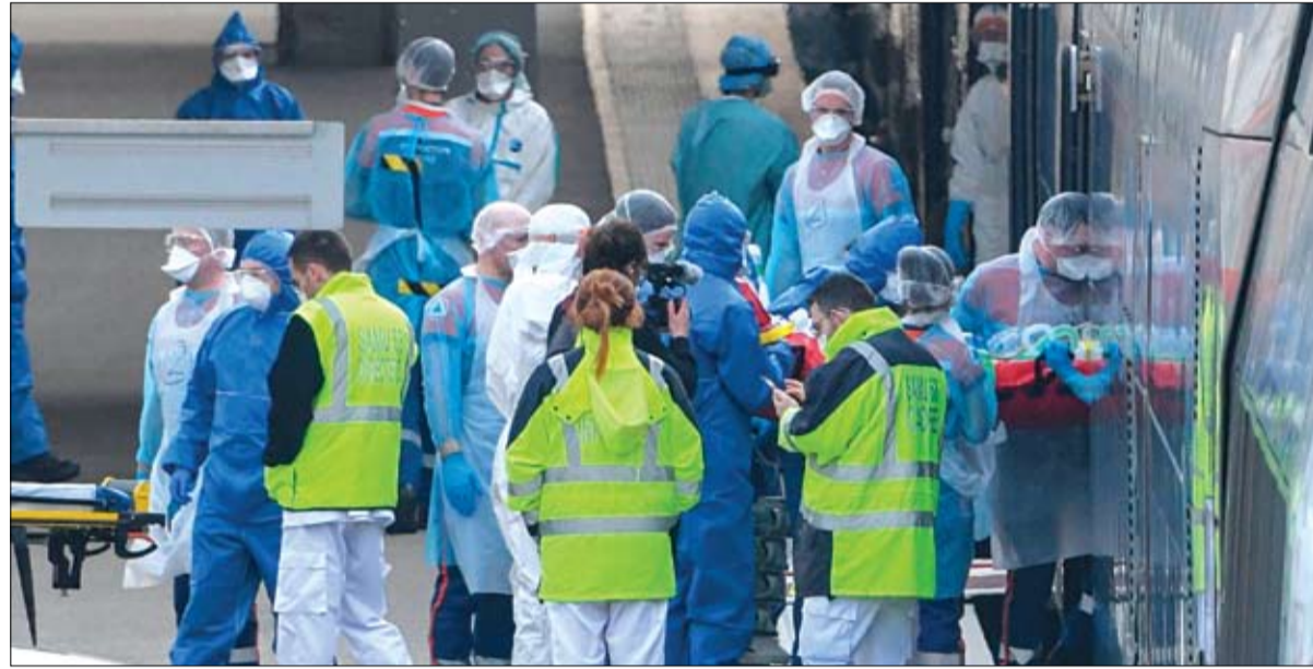
رجال الصحة ينقلون المصابين بفيروس كورونا عبر قطارات سريعة شرق فرنسا

التام في أنحاء العالم. واتخذت الإجراءات وسط تحذيرات بأن معدلات الإصابات تزداد بشكل متسارع بينما كشفت أرقام تفشي فيروس كورونا المستجد، لينضموا بذلك إلى ملايين الناس الذين يعيشون في العزل