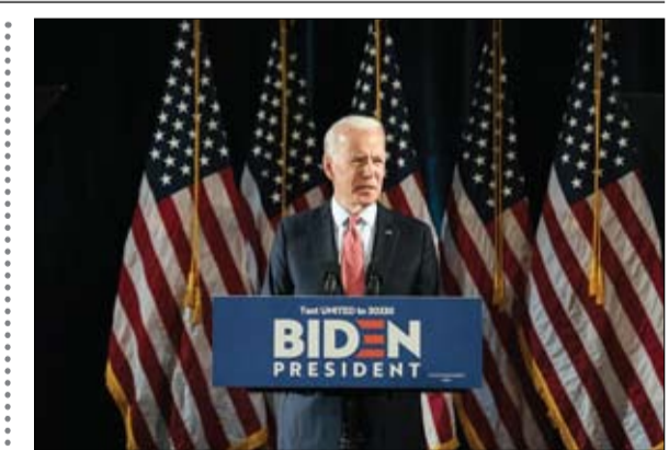
بايدن والبحث عن دور في الأزمة

•• القدس المحتلة-أ ف ب أعلن رئيس الوزراء الإسرائيلي وخضمه السابق بيني غانتس أنها حقا تقدما مهما في المحادثات الرامية إلى اتفاق نهائي لتشكيل حكومة وحدة طارئة، وأكد أنها سيعقدان اجتماعا للتوصل إلى اتفاق نهائي. وقال حزب الليكود بزعامة نتانياهو وتحالف أزرق أبيض الذي يقوده غانتس في بيان مشترك إن الرجلين اجريا محادثات طوال ليل السبت الأحد بهدف تشكيل حكومة طوارئ وطنية للتعامل مع أزمة فيروس كورونا وغيرها من التحديات التي تواجه إسرائيل. وأضاف البيان تم إحراز تقدم مهم خلال الاجتماع.