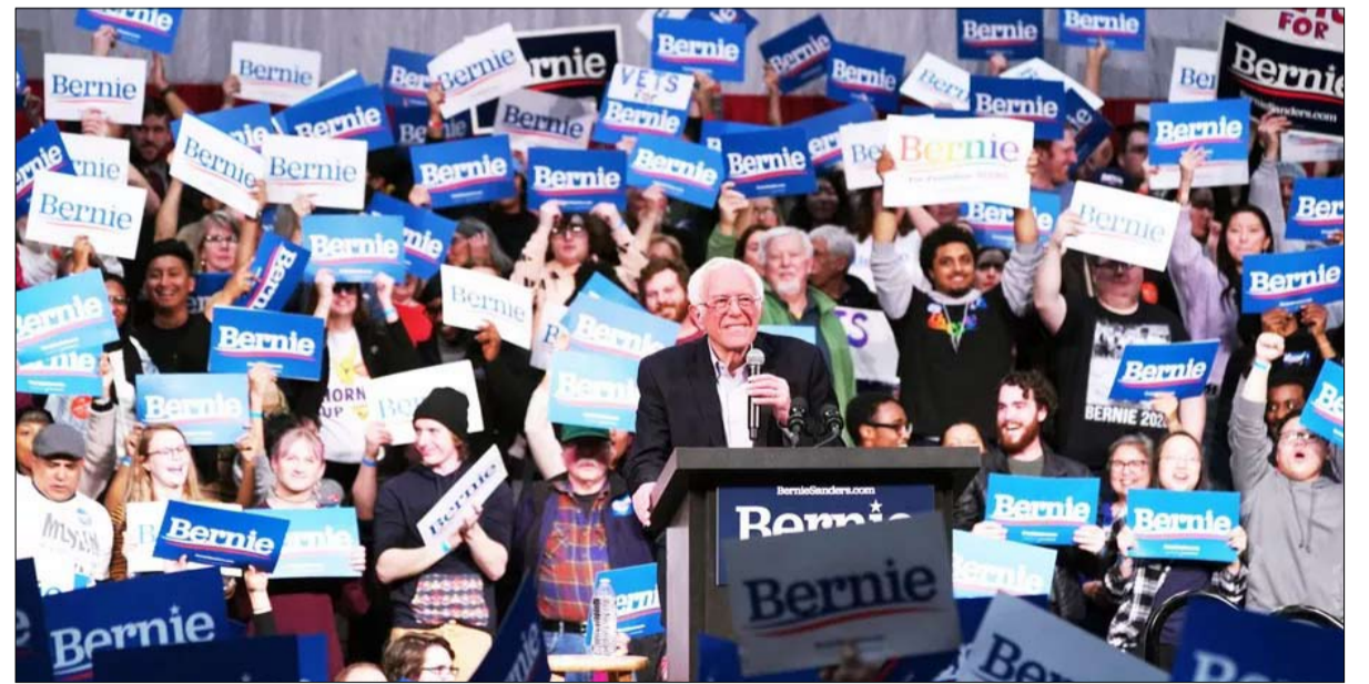
ساندرز أكثر اتقانا للتواصل الافتراضي