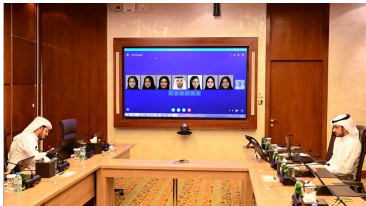
الاجتماع مناقشة بعض مواد مشروع قانون اتحادي بشأن

للخطوات المضرة بصحة الإنسان وتقييمها والعمل على تفاديها أو الحد منها، ورفع مستوى وعي المجتمع بالعوامل والمخاطر التي تؤثر على صحة الإنسان ومسبباتها وترسيخ الشعور بالمسؤولية الفردية والجماعية على زيادة توعية المجتمع بأساليب وقاية صحة الإنسان. كما يهدف مشروع القانون إلى وضع نظام لإدارة المخاطر الصحية واعداد خطط الطوارئ الوطنية اللازمة لمواجهةها أو الحد منها، ووضع آليات رصد أسباب المرض والاصابة والوقاية بشكل كامل ومدقق، والعمل على الحد من المخاطر التي تؤثر أو قد تؤثر على صحة الإنسان والمجتمع، ووضع وتطوير آليات تقييم التأثيرات البيئية والتغيرات المناخية على الصحة العامة والعمل على وضع آليات الحد من تلك التأثيرات.