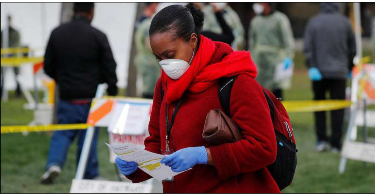
فيروس كورونا يحتكر اهتمام الامريكان

وشوهده عرضه الواضح والتعليقي أمام السبورة، أكثر من 4 ملايين مرة في ثلاثة أيام على تويتر. كما أنهم يدرسون صناعة مقاطع فيديو تسلط الضوء على خبرته، مثل تلك التي قام بها جو بايدن في يناير لشرح الأزمة مع إيران. ويثيرون فكرة «الطواير الافتراضية»، حيث ينتظر الناخبون أمام هواتفهم أو حواسيبهم للحصول على فرصة للتحدث شخصياً مع المرشح، كما لو أنهم في نهاية اجتماع انتخابي. وبالطبع، يخططون لاستغلال فيسبوك الذي تهيمن عليه حتى الآن الإعلانات الممولة لتترامب. وقال جو بايدن في مقابلة: «المفارقة، هي أنه من خلال الحملة الافتراضية، ربما سأصل إلى عدد أكبر من الناس مما كنت أستطيع مصافحتهم».