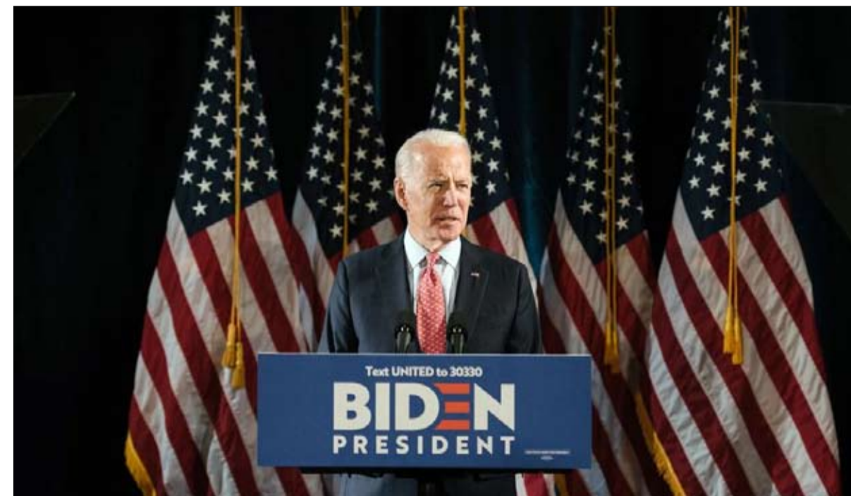
بايدن والبحث عن دور في الأزمة

خطا ومع ذلك، في دفتر اعداد حملته زمن الفيروس، يمكن أن نكتب: