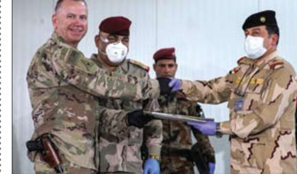
الجانب العراقي والأمريكي يتبادلان وثائق اتفاق التسليم

•• رام الله-رويترز: قال محمد اشتية رئيس الحكومة الفلسطينية إن عدد الحالات المصابة بفيروس كورونا بلغ 106 حالات بعد تسجيل ثمان حالات منذ الليلة الماضية وحتى صباح أمس الأحد، مضيفاً أن الحكومة تحتاج 120 مليون دولار لمواجهة الأزمة. وأضاف خلال مؤتمر صحفي في رام الله صباح أمس تم تسجيل إصابتيين جديدتين بفيروس كورونا في مدينة الخليل وقرية قطة، ما يرفع إجمالي الإصابات في فلسطين إلى 106، بينها تسع حالات في قطاع غزة. وقال اشتية إن حكومته بحاجة إلى 120 مليون دولار لمواجهة أزمة فيروس كورونا. وسجلت الأراضي الفلسطينية يوم الثلاثاء حالة وفاة بسبب فيروس كورونا لامرأة في السيتينات من عمرها من قرية بدو الواقعة شمال غربي مدينة القدس.