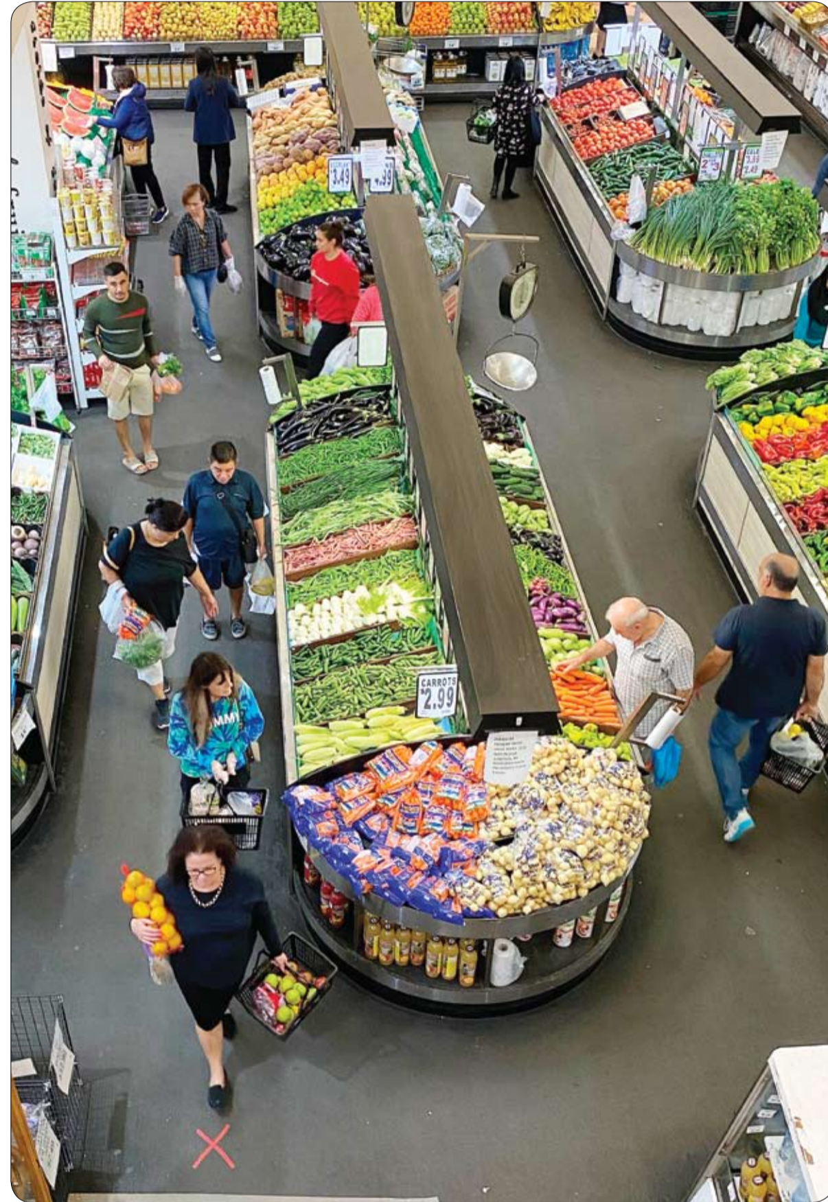
يحاول العملاء الإبقاء على مسافة التباعد الاجتماعي عند شرائهم الخضراوات والفواكه لوقف انتشار فيروس كورونا في سيدني.

نظراً للارتفاع الكبير في عدد حالات الوفاة بفيروس كورونا في إسبانيا، قررت السلطات المحلية تحويل حلبة للتزلج أو ما يسمى قصر الثلج وسط العاصمة مدريد إلى مشرحة لحفظ الجثث بغية تخفيف آلام أسر الضحايا والوضع الذي تواجهه مستشفيات مدريد. وفي وقت سابق ذكرت بلدية مدريد، حيث سُجل أكثر من نصف الوفيات، إن المقابر العامة الـ 14 في المدينة ستوقف عن قبول مزيد من الجثث لأن الموظفين هناك ليس لديهم معدات مناسبة للوقاية. وأضافت هذا إجراء مؤقت واستثنائي يهدف إلى تخفيف آلام أفراد أسر الضحايا والوضع الذي تواجهه المستشفيات في مدريد. ويقع المركز التجاري في حي هورتاليزا شمال مدريد، وليس بعيداً من مركز إيفيما للمؤتمرات الذي تم تحويله إلى مستشفى ميداني لمرضى فيروس كورونا يضم إجمالي 5500 سرير.