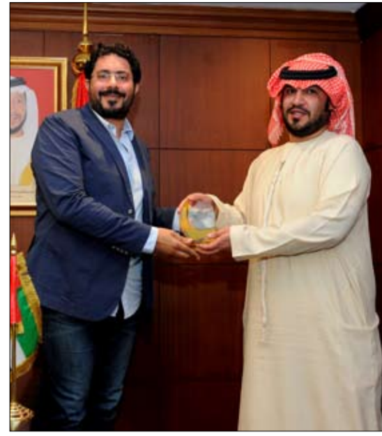
في مركز سلطان بن زايد