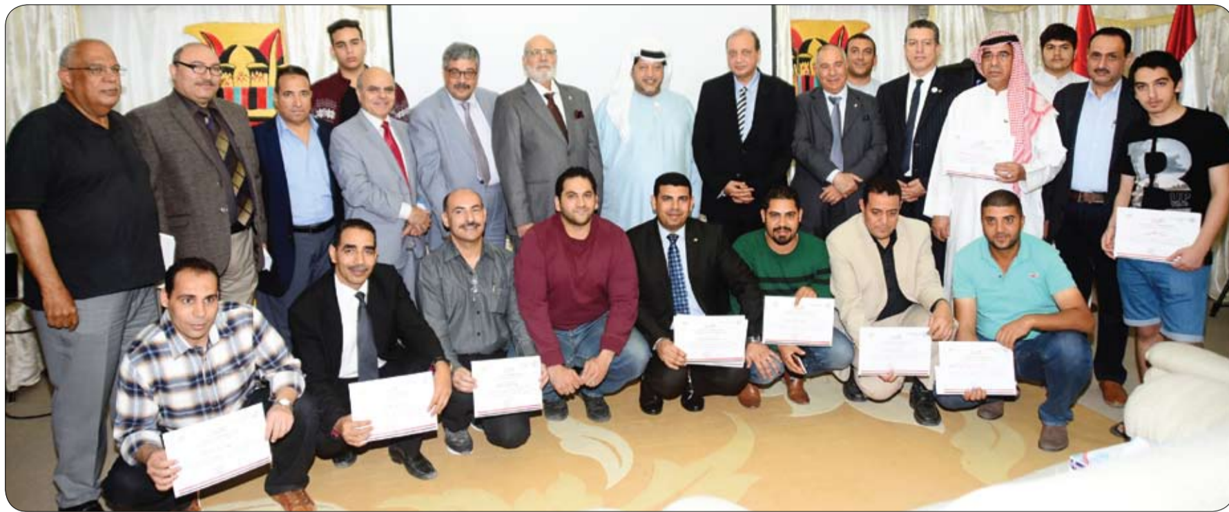
تحت رعاية وحضور سعيد بن طحنون