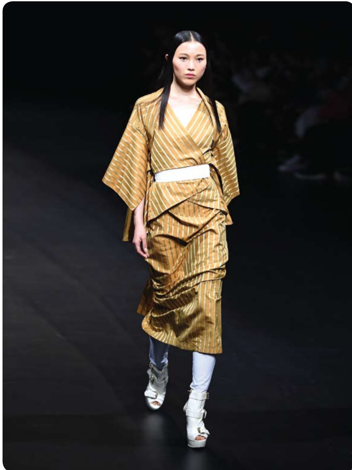
عارضة أزياء تقدم إبداعاً من قبل المصمم الإندونيسي إريداني خلال معرض الأزياء الآسيوية في طوكيو.

الكرم: ثاني المضادات الحيوية النباتية هو الكرم، ويمكنك إعداد شاي الكرم بعد غليه، وخلطه مع بعض الحليب والعسل يكون مستساغاً.