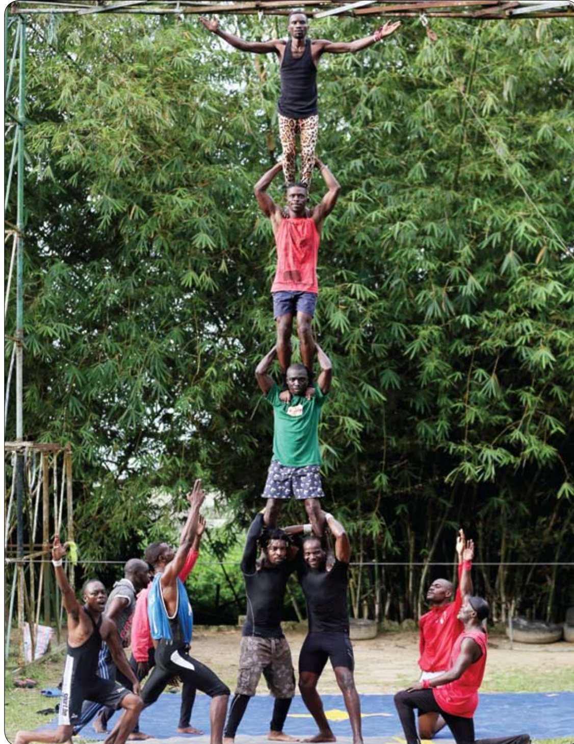
فرقة السيرك الوحيدة في اليابان تتدرب على حركات أكروباتية في ليرفيل. وقد مثلت الدولة الواقعة في وسط إفريقيا في أكبر مهرجانات السيرك في العالم، لكنها مرت منذ ذلك الحين بأوقات عصيبة لصعوبة التمويل لواقبة متطلبات السيرك الحديث.

يظهر مرض التبول في أي عمر، وتتفاوت خطورة ذلك المرض بحسب نسبة نقص الإنزيم في الدم، فقد يصاب المريض بنقص ضعيف في كريات الدم الحمراء، أو قد يصاب بنقص حاد يتطلب تدخلاً سريعاً لنقل دم للمريض. يشخص هذا المرض بعد ظهور الأعراض على المريض؛ عن طريق إجراء تحليل دم للإنزيم ونسبته في الدم. وأهم علاج لهذا المرض هو الابتعاد عن العوامل التي تؤدي إليه؛ كالبقوليات وبعض الأدوية.