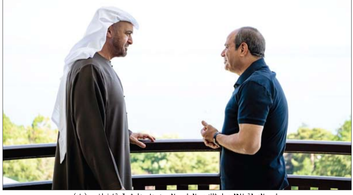
رئيس الدولة خلال مباحثاته مع الرئيس المصري على هامش قمة إيفيان

الإمارات تشارك في النسخة الثانية لـ «نداء باريس من أجل حل الدولتين» المرر: الإمارات ملتزمة بدعم خطة السلام في غزة.. وقلقون إزاء التصعيد المستمر بالصفحة باريس-وام: شاركت دولة الإمارات في النسخة الثانية من «نداء باريس من أجل حل الدولتين» الذي استضافته الجمهورية الفرنسية الصديقة، بوفد ترأسه معالي خليفه شاهين المرر، وزير دولة، وذلك بدعوة من معالي جان نويل بارو، وزير أوروبا والشؤون الخارجية في الجمهورية الفرنسية. وشارك في الفعالية قادة من المجتمع المدني من دولة إسرائيل ودولة فلسطين وممثلون دوليون من دبلوماسيين وخبراء وبرلمانيين وإعلاميين. ويأتي انعقاد النسخة الثانية من نداء باريس في إطار الجهود الدولية الرامية إلى إحياء المسار السياسي لحل الدولتين، وتعزيز فرص تحقيق السلام والاستقرار في المنطقة. وسلّمت الفعالية الضوء على الدور المحوري للمجتمع المدني في جهود السلام وتوفير أفق سياسي للإسرائيليين والفلسطينيين من أجل تحقيق الأمن والاندماج الإقليمي، كما بحثت الخطوات العملية لتنفيذ الخطة الشاملة للسلام في غزة وقرار مجلس الأمن الدولي التابع للأمم المتحدة رقم 2803، والتصدي للتهديدات التي تواجه حل الدولتين، حيث عقدت عدة حلقات نقاشية شارك فيها ممثلو المجتمع المدني وخبراء قدموا مداخلات تركزت على سبل دفع الجهود نحو تحقيق العيش بأمن و سلام جنباً إلى جنب بين الإسرائيليين والفلسطينيين، وضمان تدفق العمل الإنساني، وبحث إعادة إعمار غزة، وتنفيذ حل الدولتين والتصدي لمخاطر الضم، والسرديات الداعمة للسلام والديمقراطية والإصلاح. (التفاصيل ص 7)