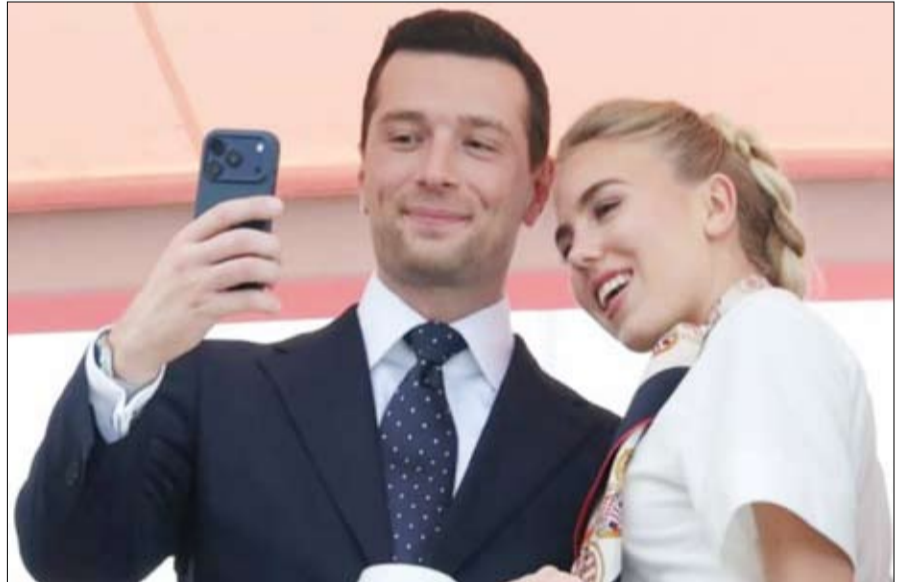
كما تقول العبارة المشهورة. لكن السؤال: هل يكفي ذلك للفوز بانتخابات الرئاسة الفرنسية؟