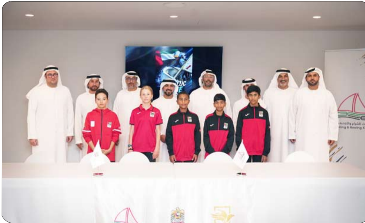
لجنة الإمارات لرعاية المواهب الرياضية ودعم الرياضة الوطنية في توفير البيئة المناسبة لرعاية النوعية التي تساهم في تطوير المنظومة الرياضية الوطنية، مشيداً بالدور الذي تضطلع به

من جانبه، أكد سعادة الشيخ سهيل بن بطي آل مكتوم أن هذه الخطوة تأتي في إطار الجهود المتواصلة للجنة وشركائها في القطاع الرياضي لاكتشاف وتنمية المواهب الرياضية على نطاق واسع في مختلف الرياضات ضمن مسار متكامل لصناعة الأبطال يبدأ من أعمار مبكرة ويمتد عبر برامج شاملة وطويلة المدى لصقل مهاراتهم ورفع التدريب والدعم الفني والإداري حتى وصولهم إلى الاحتراف والقدرة على تمثيل دولة الإمارات ورفع رايته في المحافل الرياضية المختلفة، بما يصب في تحقيق مستهدفات الاستراتيجية الوطنية للرياضة 2031. وأضاف سعادته: "تتبنى اللجنة منهجية مؤسسية متكاملة للاستثمار في تطوير المواهب، تحت إشراف وزارة الرياضة وبالتعاون مع اللجنة الأولمبية الإماراتية ولجنة الإمارات لرياضة النخبة والمستوى العالي، وبالشراكة مع الاتحادات الرياضية وكافة مكونات القطاع الرياضي الوطني، لتمكينهم من المنافسة ضمن أعلى المستويات الرياضية". مشيراً إلى أن توقيع هذه الاتفاقيات سيصب في دعم المواهب في رياضة الشراع الحديث وإعدادهم للمستقبل، وأن انضمام اللاعبين الأشبال والناشئين يمثل إضافة جديدة تصب في صالح تمكين الطاقات الرياضية الواعدة في هذه الرياضات النوعية والتخصصية وبما يعزز التنافسية الرياضية لدولة الإمارات.