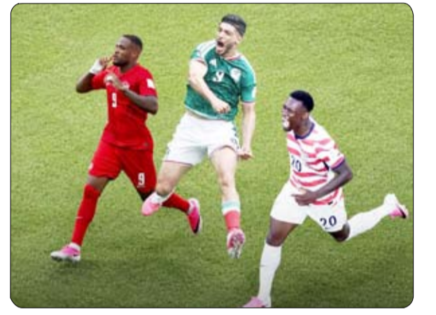
•• أبوظبي- وأم: سجلت بطولة كأس العالم "FIFA 2026" انطلاقاً استثنائية داخل الملاعب وخارجها، بعدما حققت مباريات الافتتاح الخاصة بالدول الثلاث المستضيفة، كندا والمكسيك والولايات المتحدة الأمريكية، أرقاماً قياسية غير مسبوقة في نسب المشاهدة التلفزيونية عبر أمريكا الشمالية.

ونشر الموقع الرسمي للاتحاد الدولي لكرة القدم "فيفا" أمس بعض الإحصاءات الرسمية التي أكدت أن أكثر من 54 مليون شخص شاهدوا مباريات منتخبات الدول المستضيفة في الجولة الافتتاحية، في مؤشر واضح على قدرة البطولة الاستثنائية على توحيد الجماهير واستقطاب المشاهدين في أنحاء القارة. من جانبه أكد جيانني إنفانتينو، رئيس الاتحاد الدولي لكرة القدم "فيفا"، أن ما تشهده البطولة يعد حدثاً تاريخياً بكل المقاييس، مشيراً إلى أن مباراة الولايات المتحدة أمام باراغواي أصبحت الأكثر مشاهدة في تاريخ بث مباريات كأس العالم في الولايات المتحدة، فيما تابع أكثر من 54 مليون شخص مباريات منتخبات كندا والمكسيك والولايات المتحدة في افتتاح مشوارها بالبطولة، ما أسهم في تحطيم العديد من الأرقام القياسية.