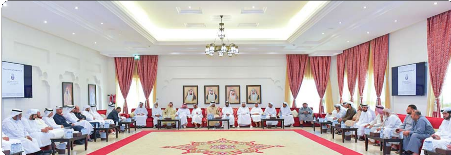
بالتنسيق مع مكتب شؤون المجالس

ويأتي مخيم الفضاء ضمن جهود دائرة التعليم والمعرفة والمركز الوطني لعلوم التكنولوجيا والفضاء بجامعة الإمارات العربية المتحدة في دعم رؤية القيادة الرشيدة الهادفة إلى تحفيز الأجيال القادمة على دراسة علوم الفضاء وتشجيعهم على دراسة التخصصات العلمية المتعلقة بقطاع الفضاء، والمشاركة في المنقبات والندوات والفعاليات الطلابية والاتطلاع على المهام الحالية التي تقوم بها الدولة في القطاع سواء في قطاع المهام الفضائية أو في تصنيع الأقمار الاصطناعية وغيرها من المجالات ذات الصلة.