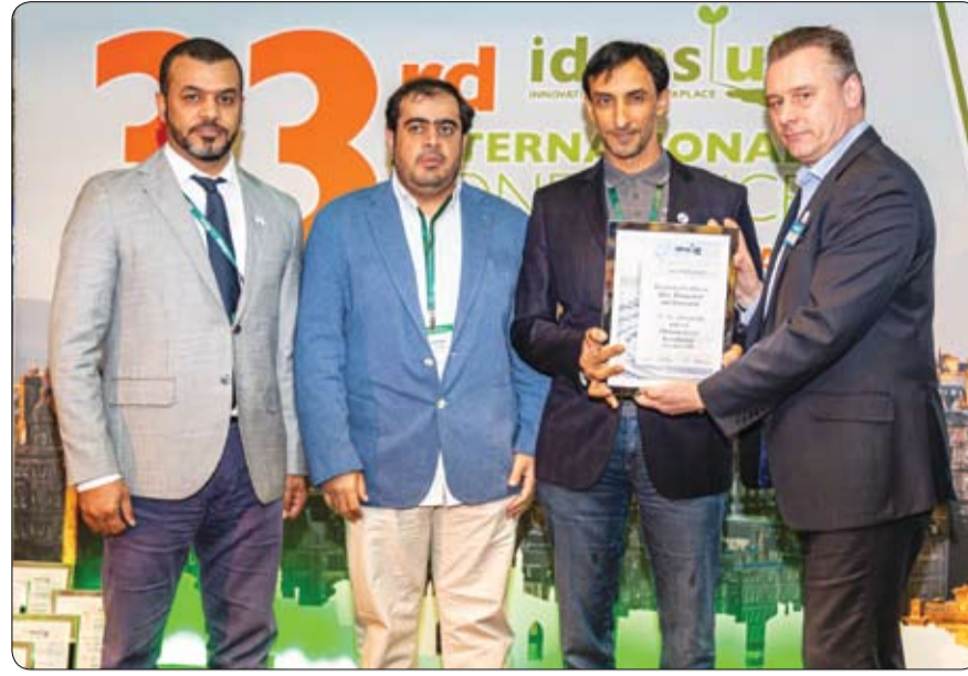
لتطبيق التحول الذكي في البلدية