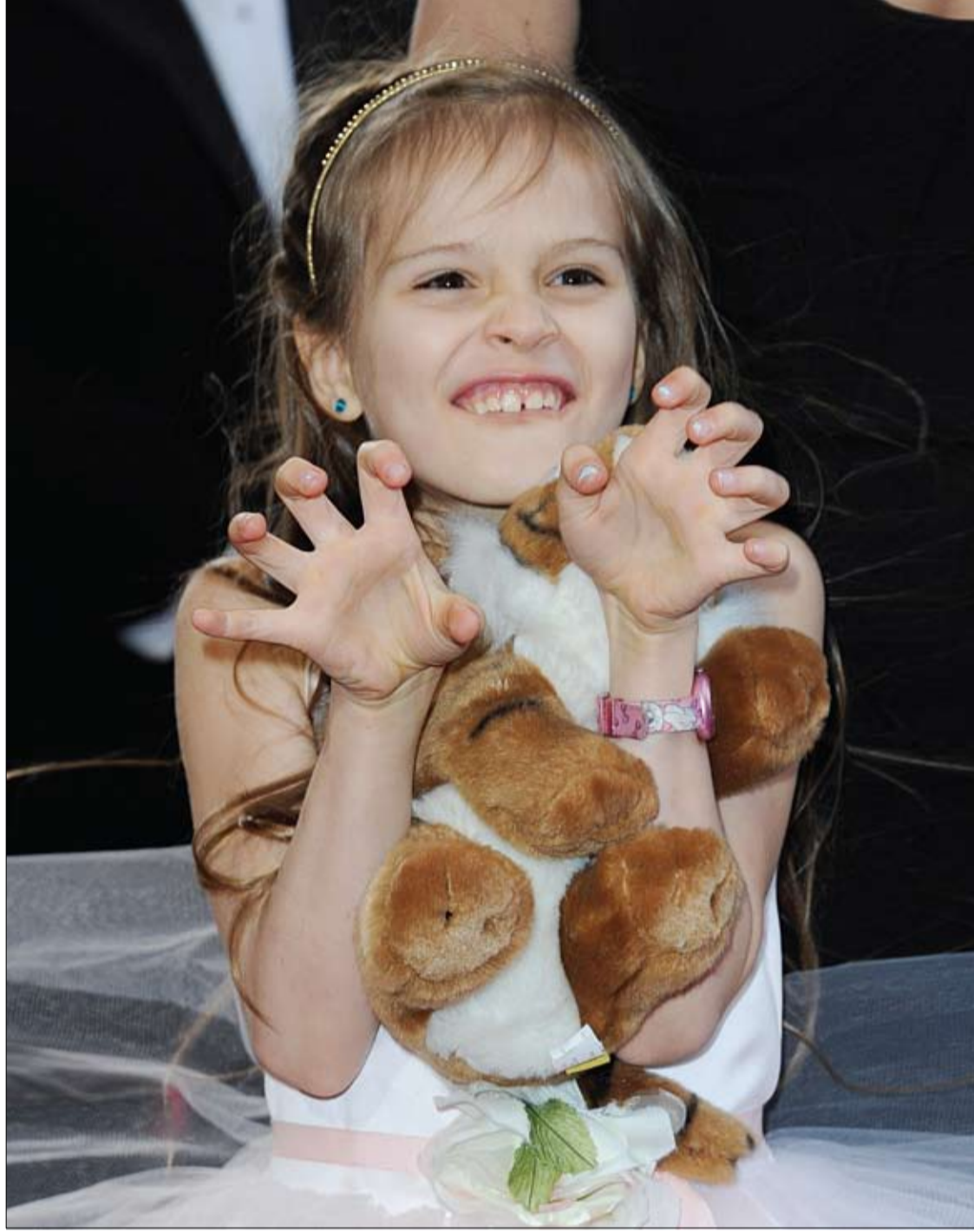
صوفيا ابنة الفائز بجائزة أفضل تصوير سينمائي عن فيلم حياة باي خَمل دمية وتقلد النمر لدى وصولها على السجادة الحمراء لجوائز الأوسكار السنوي في هوليوود.

كشفت أبحاث علمية أجريت مؤخراً ان المواد الكيميائية التي من صنع الانسان تضاف لمنتجات يومية يرجح ان تكون سببا جزئيا على الأقل في ارتفاع المواليد المشوهة وامراض السرطان المرتبطة بالهرمونات والامراض النفسية على مستوى العالم. ووفقا للدراسة فإن هذه المواد التي تعرف اختصارا باسم إي.دي.سي قد تكون أيضا سببا في انخفاض عدد الحيوانات المنوية لدى الذكور من البشر والخصوبة لدى الإناث وايضا بزيادة في سرطانات الأطفال التي كانت نادرة في السابق علاوة على اختفاء بعض أنواع الحيوانات. ونشر الفريق الدولي الذي يضم خبراء أكاديميين يعملون تحت مظلة برنامج الأمم المتحدة للبيئة ومنظمة الصحة العالمية نتائج بحثهم في وثيقة تحديثية لدراسة أعدت في عام 2002 عن المخاطر المحتملة للمواد الكيميائية الصناعية. وأشار فريق الباحثين في تقريره إلى خطر عالمي يستوجب التصدي له وقال إن البشر والحيوانات في أنحاء الكوكب تعرضوا على الأرجح للمئات من هذه المركبات التي لم تحظ في الأغلب بدراسة كافية. وتشمل إي.دي.سي الفضالات التي طالتا تستخدم في صنع المواد البلاستيكية (اللدائن) الناعمة والمرنة. ومن المنتجات المصنوعة منها ألعاب وعرائس الأطفال والعلب والأدوية وايضا مستحضرات التجميل خاصة مزيلات العرق التي يمتصها الجسم. ومن هذه المواد ايضا ثنائي الفينول-A الذي يستخدم في تقوية اللدائن (البلاستيك) ويوجد في علب الأغذية والمشروبات ومنها علب الأطفال وأغلفة العلبات الغذائية. وحظر عدد قليل من البلدان ومنها الولايات المتحدة وكندا وبعض البلدان الأوروبية استخدام بعض من هذه المواد في منتجات معينة ولاسيما المخصصة لاستخدام الأطفال.