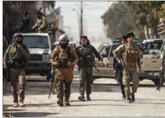
الفصائل الموالية لتركيا في سوريا تتناحر من أجل الحبوب المخدرة

قال المرصد السوري لحقوق الإنسان، أمس، إنه رصد اشتباكات بالأسلحة الرشاشة في مدينة الباب، بين عناصر من الفصائل الموالية لتركيا بسبب خلاف على تجارة حبوب مخدرة. وأضاف المرصد أن مسلحين من مجموعة عناصر يتبعون لما يعرف باسم الجبهة الشامية اشتبكت مع مسلحين يتبعون أحرار الشام ما تسبب بقطع طريق الراعي وحشدت الفصائل المسلحة الموالية لأنقرة عناصرها في المنطقة الأمر الذي نشر حالة من الذعر والخوف بين المدنيين. إلى ذلك، رأى الخبير الألماني في شؤون الشرق الأوسط، في شتاينبرغ، في حوار مع شبكة برلين، وكان مستشاراً لدى رئاسة المستشارية الاتحادية. وأضاف شتاينبرغ: منذ عام 2015 كانت هناك أولوية جديدة في السياسة التركية تجاه سوريا. هدف تركيا قمع فرع حزب العمال الكردستاني هناك، أي وحدات حماية