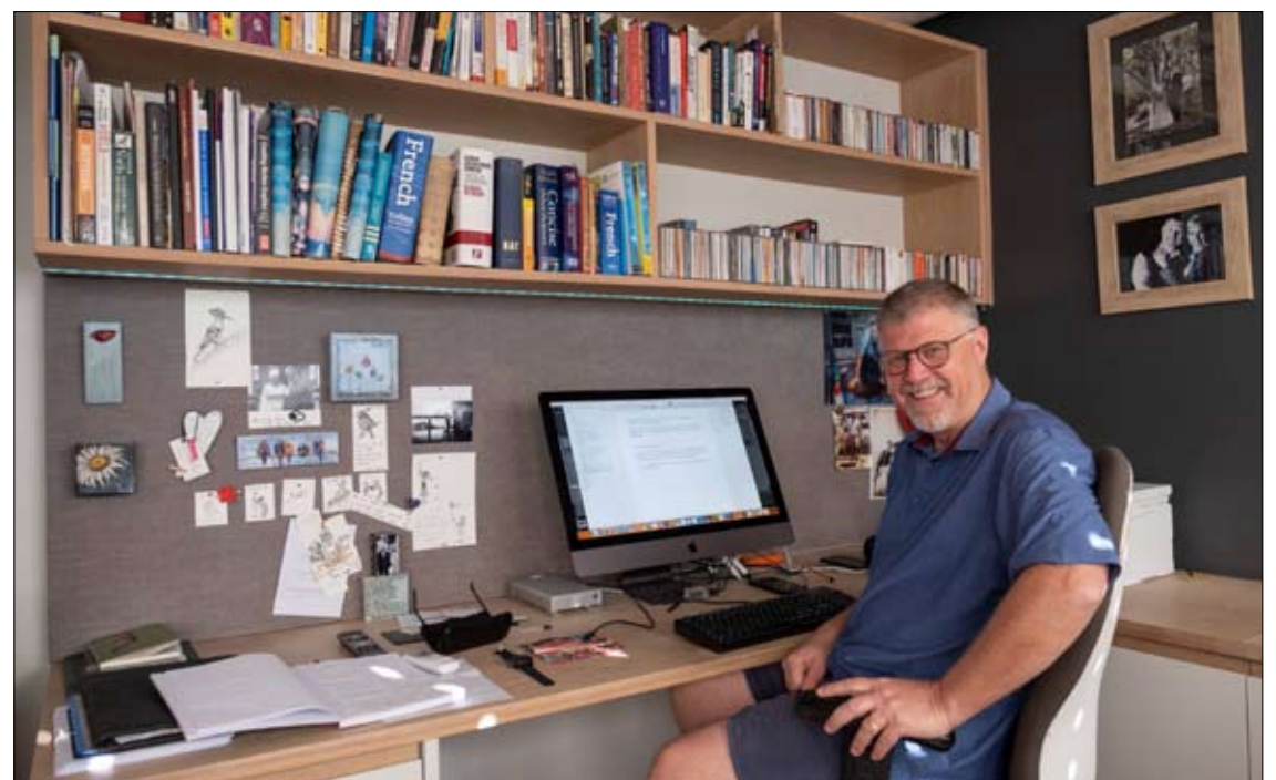
الروائي ديون ماير في مكتبه