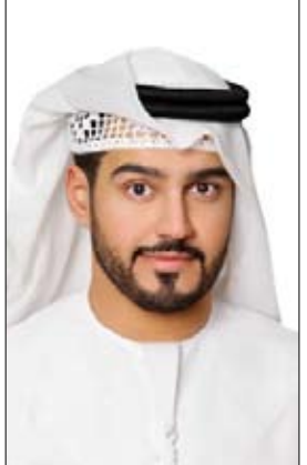
ديبي - الفجر:

والمسؤولية المجتمعية الفاعلة والمستمرة ضمن النسيج المجتمعي في الدولة، استناداً إلى سبعة محاور أساسية هي: الرعاية الصحية، والتواصل المجتمعي والحياة النشطة، استثمار الطاقات والمشاركة المدنية، البيئة التحتية والنقل، الاستقرار المالي، الأمن والسلامة، وجودة الحياة المستقبلية، موضحة أن جميع هذه المحاور تم أخذها بالحسبان عند صياغة الدليل، بما يُحقق الأهداف التنموية الاستراتيجية للدولة بشقيها