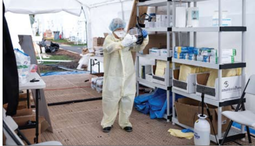
طبيب يعمل في إحدى المستشفيات الميدانية بمدينة نيويورك

النشطة ويقصد بها من يحملون الفيروس في أجسامهم حتى اليوم ويخضعون للعلاج أو يقبعون تحت الحجر الصحي فقط لأنهم لا يعانون أعراضاً من قبيل الحمى والسعال وضيق التنفس. ويصل عدد الحالات النشطة حول العالم، في يومنا هذا إلى مليون و102 ألف، وتوضح البيانات الصحية أن 96 في المئة منهم يعانون أعراضاً خفيفة فقط، بينما تدهورت حالة 4 في المئة المتبقين إلى وضع خطير أو حرج. أما الفئة الثانية من الإصابات فتعرف بالإصابات التي جرى إغلاؤها، أي التي تم الحسم في أمرها، سواء بتلعب المصاب أو بوفاته، ويقدر عدد هذه الشريحة بـ421 ألفاً و756. في غضون ذلك، تعكف مؤسسات علمية حول العالم على تطوير لقاح للوقاية من الفيروس، وتم البدء في تجارب بشرية في عدد من الدول، لكن الموافقة على أي لقاح مستوجب مدة تتراوح بين عام و18 شهراً للتأكد من عدم تسببه بأي مضاعفات جانبية.