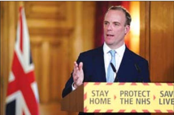
دومينيك راب ريان السفينة البريطانية الجديد

أعلن المتحدث الرسمي باسم الجيش الوطني الليبي، اللواء أحمد المساري، ليل الأربعاء الخميس، إسقاط طائرتين مسيرتين تركيتين، وذكر المساري على صفحته الرسمية في فيسبوك أن قوات الدفاع الجوي العربي الليبي تتمكن من إسقاط عدد 2 طائرة مسيرة تركية. وأوضح أنه جرى إسقاط الطائرة الأولى في أجواء قاعدة عقبة بن نافع الجوية، والثانية جنوب شرقي العاصمة طرابلس فوق محور عين زارة. وتقدم تركيا دعماً عسكرياً كبيراً للميليشيات المتطرفة المرتبطة بحكومة فائز السراج، سواء بإرسال مستشارين عسكريين أو جنود أو أسلحة، أو حتى مرتزقة من سوريا. وتعد الطائرات التركية المسيرة، ضمن أهم الأسلحة التي تستخدمها ميليشيات طرابلس في معاركها مع