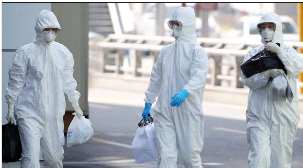
وتحول الخيال الى حقيقة

أستاذ في جامعات لومان حيث يشغل منصب نائب مدير مختبر أبحاث اللغات والأدب واللغويات في جامعات أنجيه ومين. ومتخصص في الأدب المقارن الأفريقي والأفرو أمريكي، وهو مؤلف العديد من المقالات والكتب حول الأدب الأفريقي الناطق باللغة الإنجليزية والفرنسية. ومن مؤلفاته "ويتني ماندبلا: الأسطورة والواقع"،