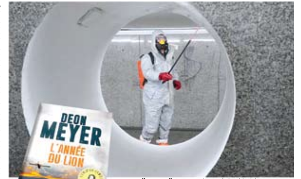
من الخيال العلمي الى حقيقة مرعبة: عام الأسد، رواية توقفت الوفاء العالي!

ويحمل مصطفى الكاظمي المؤلود في بغداد عام 1967، شهادة بكالوريوس بالقانون، وكانت قد تنقل في عدة دول أوروبية خلال فترة معارضته لنظام صدام حسين، قبل أن