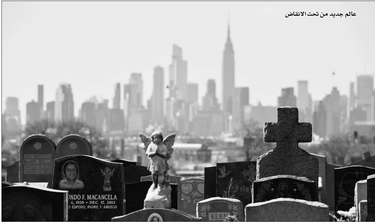
عالم جديد من تحت الانقاض