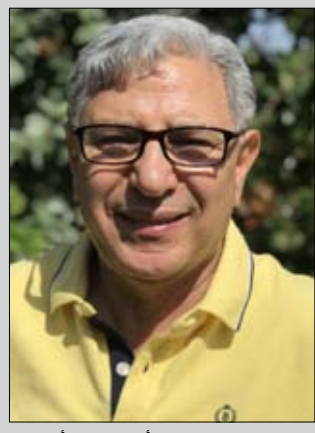
بن عودة المتخصص في الأدب المقارن الأفريقي

كورونا. لقد تصور المؤلف الجنوب أفريقي الوباء الحالي في روايته السابعة المنشورة عام 2017، والمتجمة من الإنجليزية، الحمى، والأفريقية، كورس، المنشورة عام 2016. زمن كتابة هذه الرواية، التي تنتزل في أدب ما بعد نهاية العالم، عاش ديون ماير في عالم تدور مشاكله حول الحروب في أنحاء مختلفة من العالم، ومسائل الهجرة، ومسائل العنصرية، والمشكلات الاجتماعية في أفريقيا، ومسألة الفساد في جنوب أفريقيا، وبعض التفكك للدولة تحت حكم جاكوب زوما. وكان ديون ماير قد استنكر، كموطن، بصوت عال وواضح، فساد تلك الحكومة. وافترض أن الأجواء المؤذية السائدة في ذلك الوقت دفعته إلى تخيل عالم يمكن أن يدمره "فيروس كورونا"، هكذا ورد اسمه في روايته.