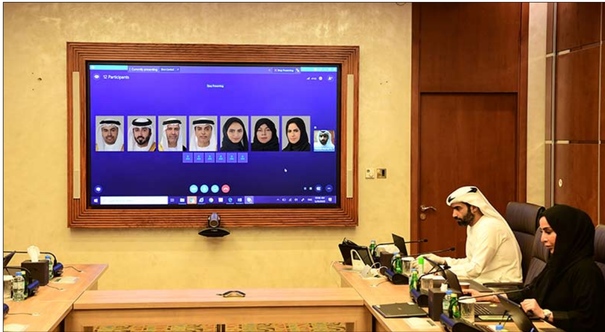
•• أبوظبي- الفجر:

وما يحظر عليهم، والأحكام المتعلقة بحماية حقوق المستهلك، والأحكام المتعلقة بالعقوبات التي تفرض على مخالفة أحكام هذا القانون، والأحكام الختامية المتعلقة بتوفيق الأوضاع، والغاء الأحكام المخالفة للقانون، والتظلم، والضبطية القضائية، وإصدار اللائحة التنفيذية لهذا القانون، بالإضافة إلى نشر القانون في الجريدة الرسمية وتاريخ العمل بأحكامه. وتنص المادة "89" من الدستور على ما يلي: "مع عدم الإخلال بأحكام المادة "110" تعرض مشروعات القوانين الاتحادية بما في ذلك مشروعات القوانين المالية على المجلس الوطني الاتحادي قبل رفعها إلى رئيس الاتحاد لعرضها على المجلس الأعلى للتصديق عليها ويناقش المجلس الوطني الاتحادي هذه المشروعات وله أن يوافق عليها أو يعدها أو يرفضها"، كما نصت المادة "90" من الدستور على ما يلي: "ينظر المجلس في دورته العادية في مشروع قانون الميزانية العامة السنوية للاتحاد، وفي مشروع قانون الحساب الختامي وذلك طبقاً للأحكام الواردة في الباب الثامن من هذا الدستور..