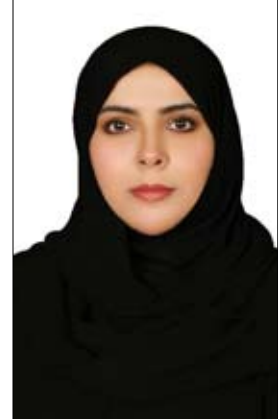
ديبي - الفجر:

وضمن مشاركتهم الفاعلة والمستمرة ضمن النسيج المجتمعي في الدولة، استناداً إلى سبعة محاور أساسية هي: الرعاية الصحية، والتواصل المجتمعي والحياة النشطة، استثمار الطاقات والمشاركة المدنية، البيئة التحتية والنقل، الاستقرار المالي، الأمن والسلامة، وجودة الحياة المستقبلية، موضحة أن جميع هذه المحاور تم أخذها بالحسبان عند صياغة الدليل، بما يُحقق الأهداف التنموية الاستراتيجية للدولة بشقيها