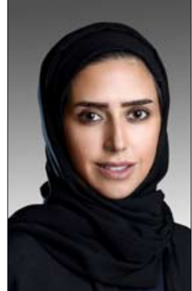
ديبي - الفجر:

وأشارت سعادتها إلى حرص الوزارة على مواكبة الدليل مع مبادرات سياسة حماية الأسرة، وينود قانون حقوق كبار المواطنين، وأهداف السياسة الوطنية لكبار المواطنين، التي تدعم الارتقاء بجودة حياتهم،