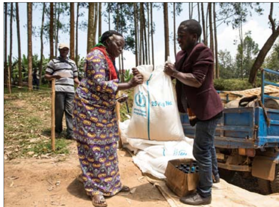
«الأغذية العالمي»: خطر المجاعة يتزايد في زيمبابوي