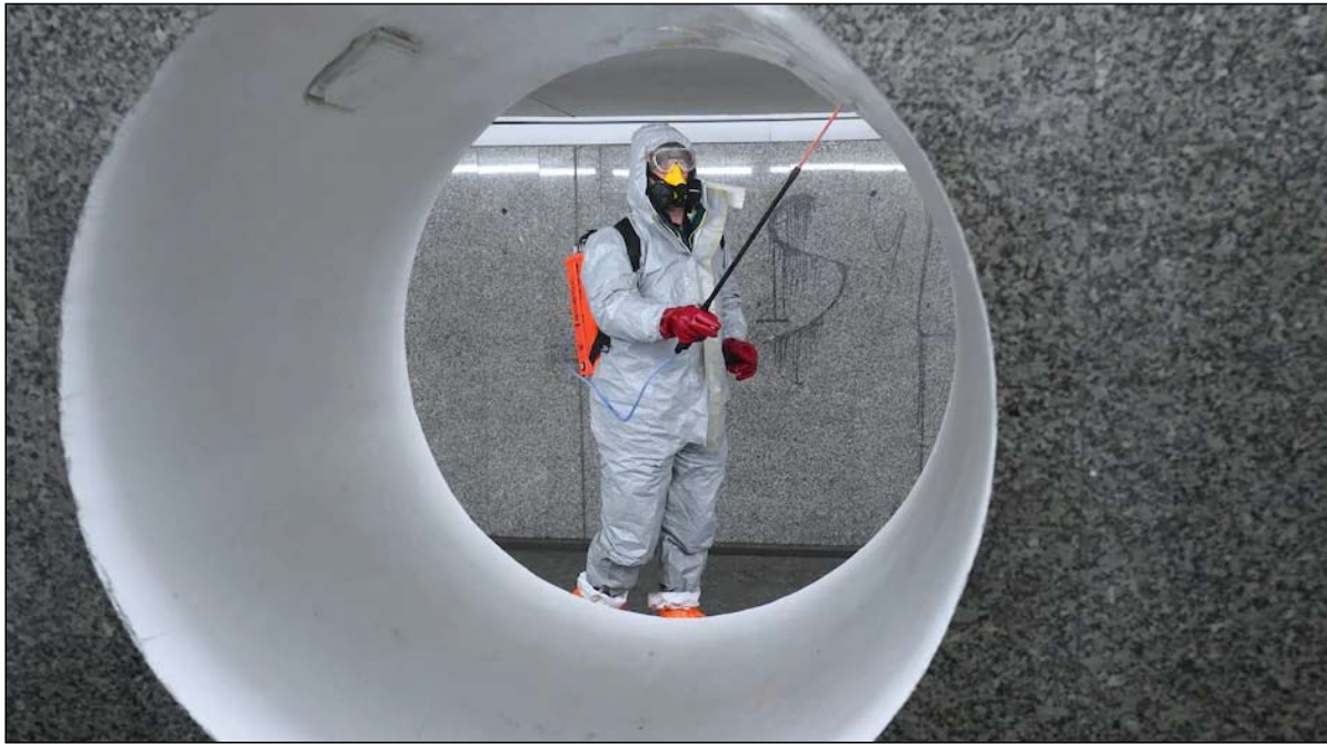
الخيال من حلم الى كابوس

تقريباً رواية استباقية انطلقا من هذا المعنى الفيروسي، تصور رواية من جنس الخيال العلمي، تقطع الانقاس، وتجري أحداثها في جنوب إفريقيا بشخصيتين رنيسيتين، الأب وابنه وفيروس كورونا الذي يقضي على 90 بالمئة من سكان العالم. وفي هذا الصدد، ومقارنة بالوباء الحالي، أعلن ديون ماير في مقابلة أجريت معه في الآونة الأخيرة: "تذكرت روايتي وختفت! فعلا، انه يعيش اليوم ما تخيله قبل ثلاث سنوات. وحتى ان كان سيناريو الكارثي قد ذهب الى الاقصى، فمن المدهش أن يتخيل ديون ماير جانحة فيروس كورونا لعام 2020 كما نعيشها اليوم، مع المشاهد التي نلاحظها من حولنا، كما تنقلها وسائل الإعلام، من الصين، من إيطاليا أو إسبانيا أو فرنسا أو الجزائر أو جنوب إفريقيا أو زيمبابوي أو الولايات المتحدة الأمريكية. ويخشى الروائي من ان يعيش عام 2020 ما كان مجرد خيال عام 2016، اي الموت، والحجر الشامل، والانفصاح المجنون من أجل الاحتياجات الغذائية، والقلق، والخوف من فقدان حياته، ورحيل اقاربه، وأن يخاف.