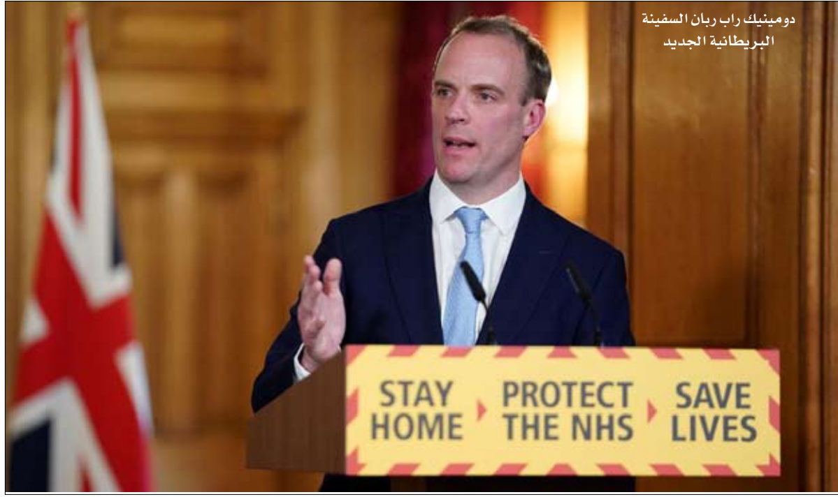
دومينيك راب ريان السفينة البريطانية الجديدة

مرشح لمنصب رئيس الوزراء بعد استقالة تيريزا ماي في ربيع