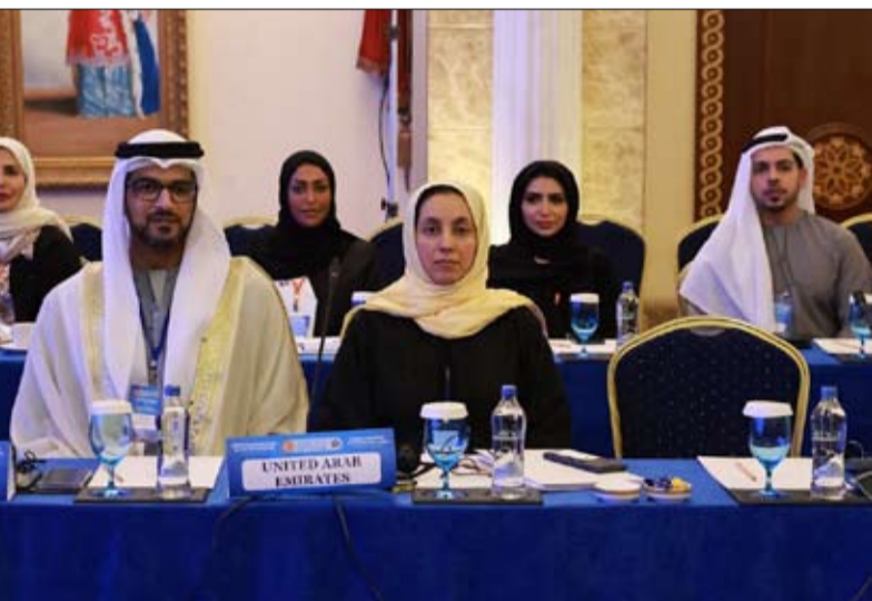
بالمشورون الاقتصادية والتنمية واستعرض الأمين العام للمجموعة البرلمانية الآسيوية تقرير اللجنة ومشاريع القرارات ذات الصلة وتم اعتماد التوصيات بشأنها.