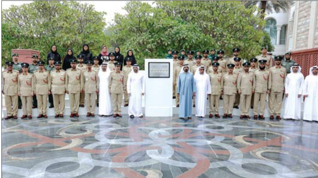
محمد بن راشد خلال تكريمه مركز شرطة المرقبات، أول مركز خدمات في دبي يحصل على تصنيف 6 نجوم

ويحضر فخامة يون سوك يول فعاليات القمة العالمية لطاقة المستقبل التي تعقد ضمن أسبوع أبوظبي للاستدامة بجانب لقاء عدد من المسؤولين في الدولة وزيارة بعض المشاريع التنموية الاستراتيجية.