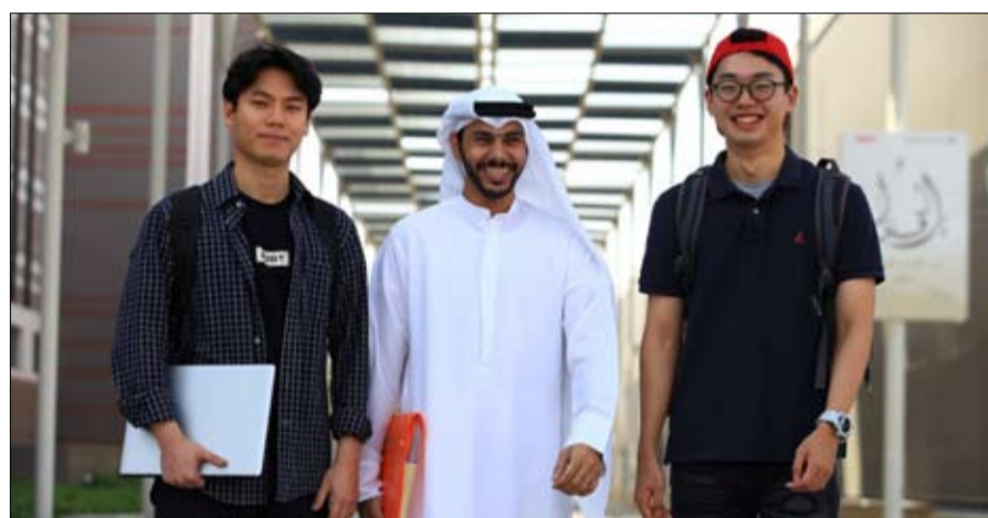
عند دخولهم السكن لتحفيزهم على بذل جهودهم وبدء الفصل بكل همة وتميز.

يقف حي عجمان التراثي بشموخ وفخر كشاهد على تاريخ إمارة عجمان براويا بدقة متناهية قصة حقبية مهمة من تاريخ الإمارة وتطورها خلال القرنين الماضيين وصولاً إلى حاضرها المزدهر الذي تعيشه اليوم. ويمنح الحي زواره بعداً عميقاً للتعرف على ماضي الأبناء والاجداد الذين وضعوا وبكل جهد وتفان اللبنات القوية الراسخة لإمارة عجمان الأمر الذي حوله إلى واجهة سياحية وبوصلة تاريخية تنبض بالحياة والذكريات الخالدة وتبرز الهوية الأصيلة للإمارة. ويشهد الحي التراثي كذلك أبرز الفعاليات التي تنظمها إمارة عجمان في المناسبات الوطنية والدينية والمحلية كالأحتفال بعيد الاتحاد، والاعراس الجماعية وفعاليات ثقافية وفنية متنوعة. ولم تغفل حكومة إمارة عجمان عن الجانب الاستثماري عبر توفيرها المساحات التي تتناسب مع تطلعات المستثمرين في الإمارة، حيث يحتوي الحي مساحات مخصصة للاستثمار ولتختلف الاستخدامات وبأسعار تنافسية وامتيازات مختلفة