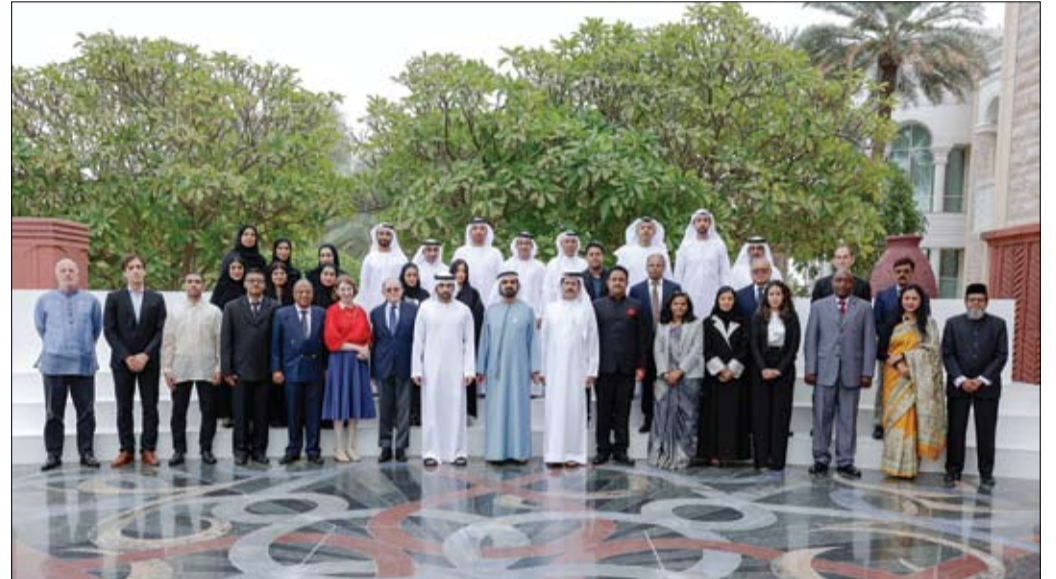
نائب رئيس الدولة خلال استقباله الفائزين في الدورة الثالثة من جائزة محمد بن راشد آل مكتوم العالمية للمياه (وام)