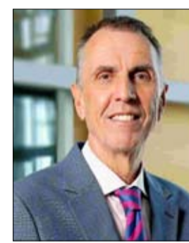
الأفكار التي سيقدّمها جيل المستقبل والمشاريع التي يعمل عليها لبناء مستقبل مشرق". وذكر أن شروط التسجيل في المسابقة تتضمن تصوير الفيلم وإنشاؤه من قبل المشاركين، ولا تتجاوز مدته 4 دقائق ويمكن