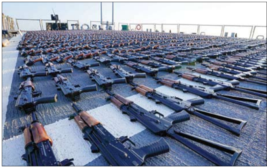
البحرية الأمريكية تنشر كمية ضخمة من البنادق الهجومية المهربة من إيران إلى اليمن عبر خليج عُمان (ا ب) عندما اعتراضنا السفينة كانت على طريق تستخدم لتهريب البضائع غير المشروعة إلى اليمن. إلى ذلك، هز انفجار عنيف معسكر تخزين صواريخ جدير بالذكر أن حظرا للأسلحة

أعلنت البحرية الأميركية، أمس الثلاثاء، اعتراض سفينة صيد كانت تهرب بنادق من إيران إلى اليمن. وأكد المتحدث باسم الأسطول الخامس المتمركز بالشرق الأوسط والتابع للبحرية الأميركية، تيموثي هوكينز، مصادرة أكثر من 2100 بندقية هجومية من سفينة في خليج عُمان، يعتقد أنها قادمة من إيران، ومتوجهة إلى اليمن. ووفقاً ذكرت الأسوشيتد برس، فقد تمت مصادرة الأسلحة يوم الجمعة بعد أن صدق فريق من زورق الدوريات الساحلية يو إس إس شينوك، على متن السفينة. وبحسب هوكينز فقد عثر على بنادق من نوع كلاشنيكوف ملفوفة في قماش على متن السفينة. وقال هوكينز للأسوشيتد برس: أعلنت البحرية الأميركية، أمس الثلاثاء، اعتراض سفينة صيد كانت تهرب بنادق من إيران إلى اليمن. وأكد المتحدث باسم الأسطول الخامس المتمركز بالشرق الأوسط والتابع للبحرية الأميركية، تيموثي هوكينز، مصادرة أكثر من 2100 بندقية هجومية من سفينة في خليج عُمان، يعتقد أنها قادمة من إيران، ومتوجهة إلى اليمن. ووفقاً ذكرت الأسوشيتد برس، فقد تمت مصادرة الأسلحة يوم الجمعة بعد أن صدق فريق من زورق الدوريات الساحلية يو إس إس شينوك، على متن السفينة. وبحسب هوكينز فقد عثر على بنادق من نوع كلاشنيكوف ملفوفة في قماش على متن السفينة. وقال هوكينز للأسوشيتد برس: عندما اعتراضنا السفينة كانت على طريق تستخدم لتهريب البضائع غير المشروعة إلى اليمن. إلى ذلك، هز انفجار عنيف معسكر تخزين صواريخ جدير بالذكر أن حظرا للأسلحة البحرية الأمريكية تنشر كمية ضخمة من البنادق الهجومية المهربة من إيران إلى اليمن عبر خليج عُمان (ا ب) عندما اعتراضنا السفينة كانت على طريق تستخدم لتهريب البضائع غير المشروعة إلى اليمن. إلى ذلك، هز انفجار عنيف معسكر تخزين صواريخ جدير بالذكر أن حظرا للأسلحة