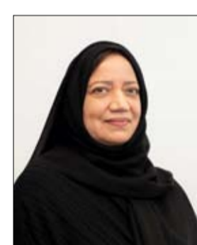
نوعية تلبى حاجة سوق العمل من كافة التخصصات الأكاديمية. وأوضحت أن إدارة الجامعة عملت على إعداد الخطط والبرامج

لاستقطاب الطلبة الجدد للفصل الدراسي الثاني، حيث أنهت إدارة القبول والتسجيل إجراءات قبول 1120 طالباً وطالبة مستجداً في كافة التخصصات الأكاديمية، حيث تم إنجاز طلبات واستقبال الطلبة على بعد، من خلال تنظيم برنامج لتعريف بمرافق الجامعة والكلية وكيفية تسجيل المساقات عبر موقع الجامعة، بحيث يستطيع أي طالب الدخول للموقع والحصول على كل ما يحتاج إليه من معلومات وخدمات وإرشادات أكاديمية. وأضاف: "بالنسبة