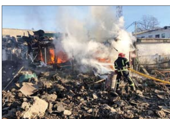
رجل إطفاء يخدم حريقاً في موقع أصابته الصواريخ الروسية في منطقة خاركييف الاعتداءات هناك. كذلك أوضحت أن روسيا نشرت عدداً كبيراً من الوحدات الهجومية المؤلفة من أفضل احتياطي مجموعة فانتز. يذكر أن الرئيس الأوكراني فولوديمير زيلينسكي كان أعلن أن قواته تصمد أمام هجمات جديدة وأكثر شدة على سوليدار قرب باخموت شرق البلاد التي تحاول موسكو السيطرة عليها منذ أشهر. وأوضح زيلينسكي في خطابه اليومي، أن تلك الهجمات تعد الأكثر شدة منذ بدء الحملة الروسية على تلك المناطق. وتقع سوليدار في منطقة دونيتسك على مسافة حوالي 15 كيلومتراً من مدينة باخموت، التي كان يبلغ عدد سكانها قبل الحرب 70

ألف نسمة وأصبحت الآن مركزاً للقتال. وفي وقت سابق من الإثنين، أعلنت القوات الأوكرانية أنها صدت محاولة للسيطرة على سوليدار، لكن القتال استؤنف. كما أكدت أن القوات الروسية شنت خلال الـ 24 ساعة الماضية 31 ضربة جوية و72 هجوماً من منظومات الصواريخ. هذا وأعلن وزير الدفاع الروسي، سيرغي شويغو، الثلاثاء، أن روسيا ستواصل تطوير الدرع النووي كضامن رئيسي لسيادة ووحدة أراضيها. وقال شويغو خلال مؤتمر عبر الفيديو: ستواصل تطوير الثالوث النووي والحفاظ على جاهزيته القتالية، لأن الدرع النووي كان ولا يزال الضامن الرئيسي لسيادة دولتنا وسلامة أراضيها. مؤكداً على أن القوات المسلحة الروسية ستقوم بتطوير ترسانة الأسلحة الهجومية في المستقبل القريب.