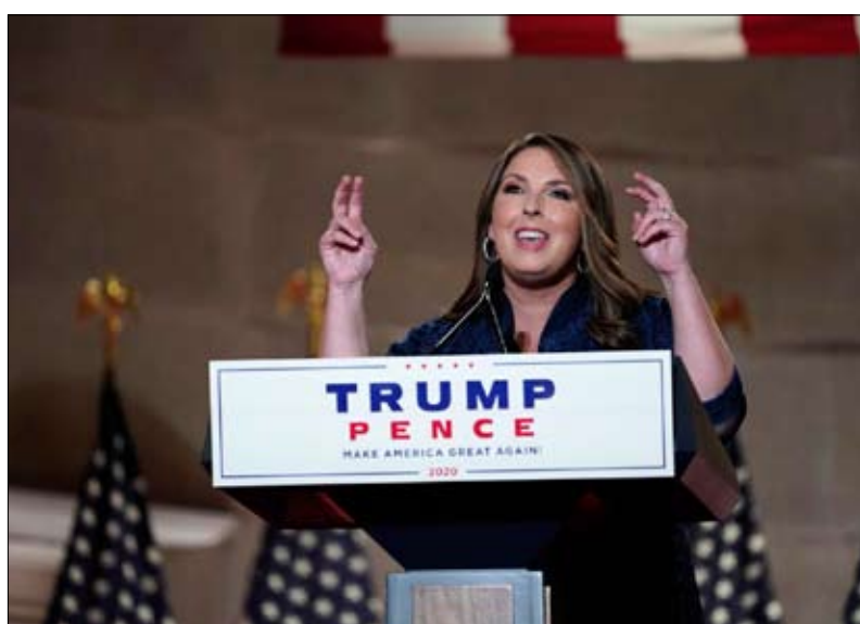
رونا مكدانيل، عن مؤتمر طموح