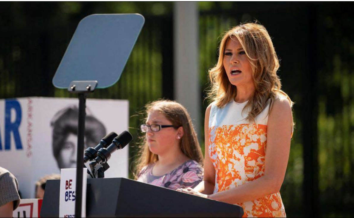
السيدة الأولى المطلوبة لدور أكبر

عام 2016، لم تظهر سوى بضعة مرات بدون زوجها، وبقيت معظم الحملة في الخلف. فهل ستعمل المزيد قبل بضعة أشهر من الاقتراع؟ وفقاً للمصاحبة ماري جوردان الحائزة على جائزة بوليتسر لعام 2003 ومؤلفة سيرة ذاتية نشرت في يونيو، فإن