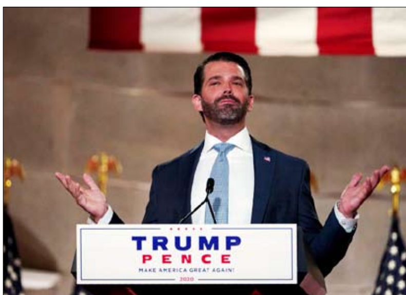
ترامب الابن خطاب شديد ال لهجة