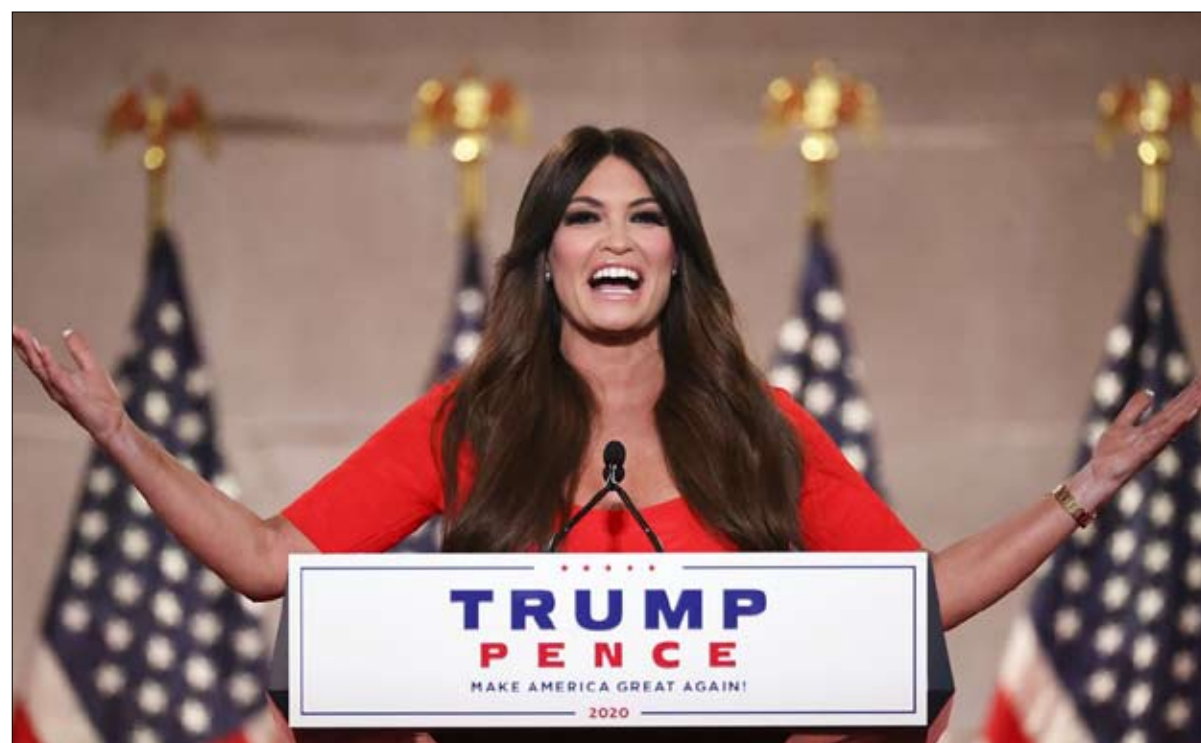
كيمبرلي جيلفويل ترامب رئيس القانون والنظام

وفي أمريكا أسيرة الاستقطاب في زمن ترامب، وشكلها وباء كوفيد-19 الذي أودى بحياة أكثر من 177 ألف شخص وأوقف ملايين الأمريكيين عن العمل، وفي ظل حركة تاريخية غاضبة ضد العنصرية والعنف، هكذا قدم دونالد ترامب الابن البديل للناخبين الأمريكيين، مساء يوم 3 نوفمبر: «الكنيسة».