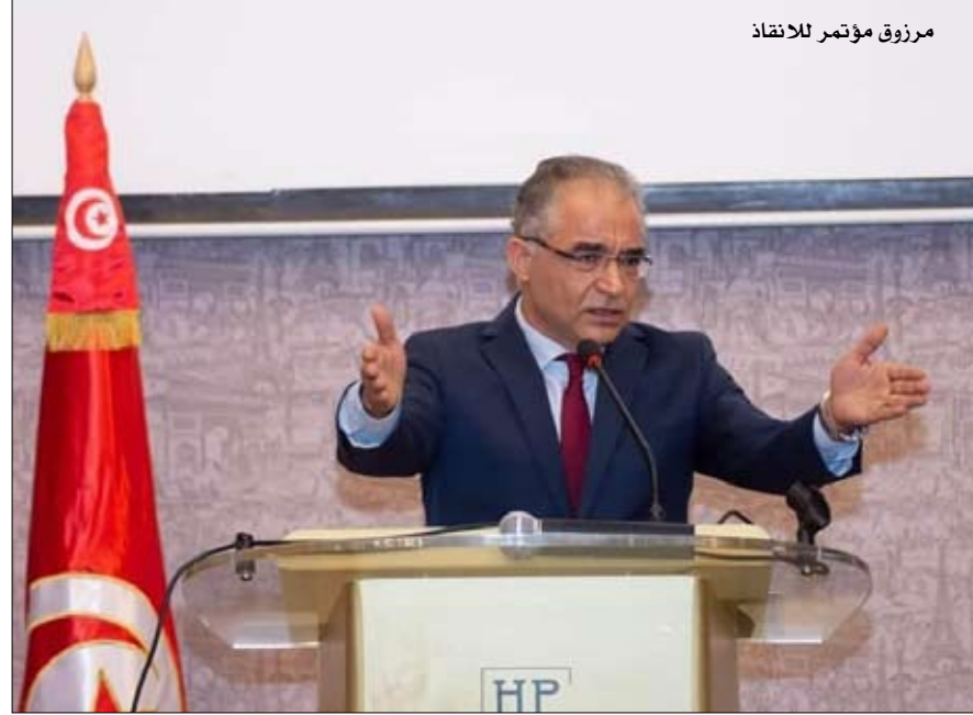
مرزوق مؤتمر للإنقاذ

المشيشي كان وفيها لتعهداته، وأن الحكومة المقترحة قريبة جدا بالنظر للشخصيات التي اختارها من مفهوم حكومة الكفاءات المستقلة، وإن اختلفت التقييمات حول الكفاءات، منذ أن كتلته ساندت منذ البداية توجه المشيشي، وبأنها كانت مع ان يختار المكلف بتشكيل الحكومة فريقه حتى يتحقق الانسجام.