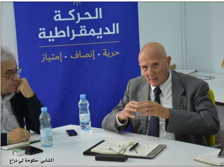
الشابي حكومة لي ذراع