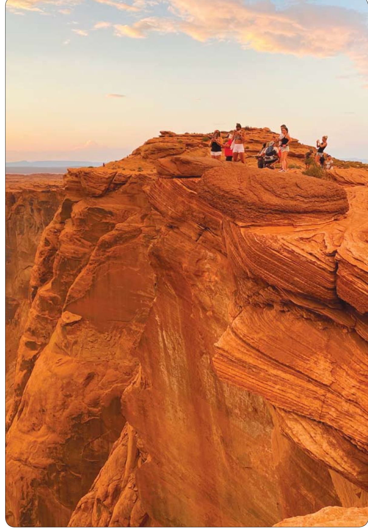
سائحون يسيرون إلى حافة الجرف للاستمتاع بمنظر رائع لجبل متعرج محفور الشكل لتهر كولورادو، في بلدة بيج - أريزونا.

أعلنت شركة غوغل عن إطلاق تطبيق الخرائط Maps على ساعة أبل ووتش مرة أخرى بعدما تم إيقافه في عام 2017. وأكدت الشركة الأمريكية أنه سيتم طرح الإصدار الجديد خلال الأسابيع القليلة المقبلة في جميع أنحاء العالم. وأوضحت شركة غوغل أن تطبيق Maps الجديد للساعة الذكية يوفر وظيفة الملاحة للسيارات والدراجات الهوائية والمشاة، وكذلك خطوط المواصلات المحلية بما في ذلك إرشادات الاتجاه وبيانات المسافة والوقت المتوقع للوصول إلى الوجهات المحرّنة.