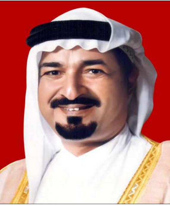
توفير المزيد من قنوات التعاون المثمر والتواصل فيما بين الجهات الخيرية وصناديق الأوقاف العاملة في إمارة عجمان لتحقيق أهدافها الخيرية.

يذكر أن مجلس تنسيق العمل الخيري والأوقاف تأسس بموجب مرسوم أميري رقم 9 لعام 2012 بقرار من صاحب السمو حاكم عجمان بهدف