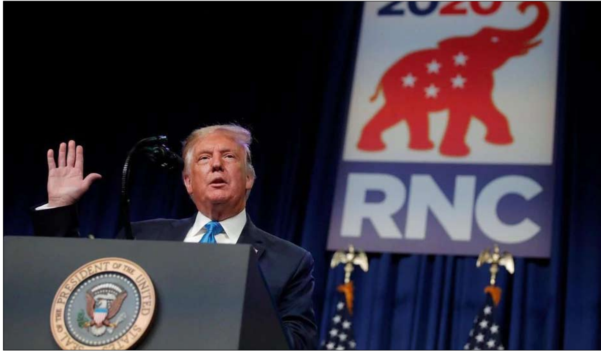
ترامب سيد الجمهوريين بلا منازع

في بداية القداش الكبير للحزب الجمهوري، لعب الرئيس وأنصاره ورقة الخوف، مستحضرين جو بايدن، شبه الماركسي، الذي يسعى لإغراق أمريكا في الفوضى.