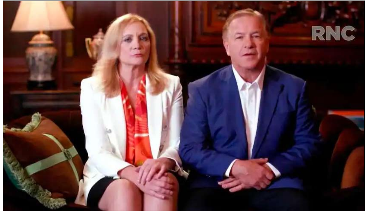
التخويف سلاح المعركة

لترامب، حيث خاطبه المتحدون مباشرة، وشكروه، أو سردوا حكايات عنه. وكما أشار كريس والاس، أحد الصحفيين القلائل في فوكس الذين بقوا على مسافة انتقادية من الرئيس؛ «يطلق عليه المؤتمر الجمهوري، لكنه في الحقيقة مؤتمر ترامب».