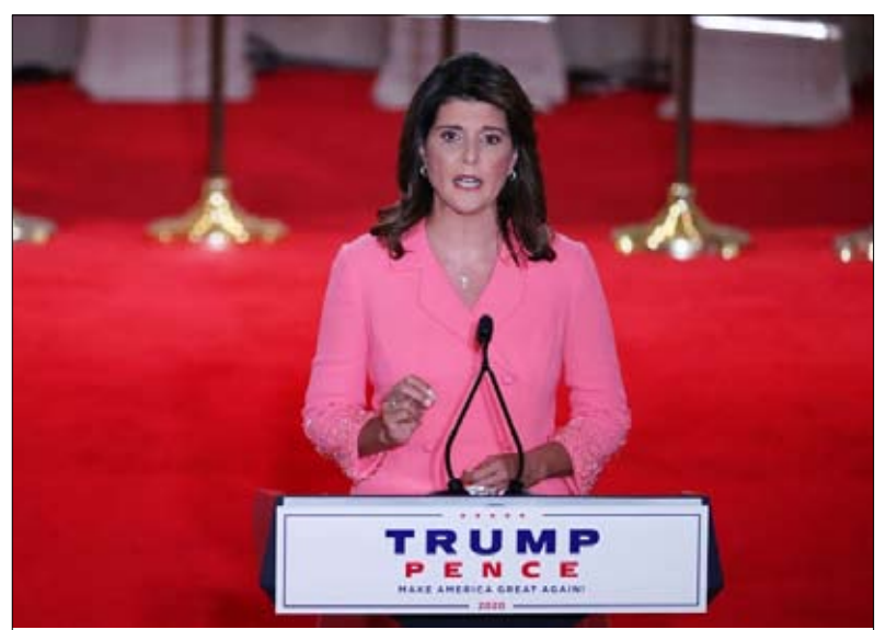
نيكي هاييلي بايدن كارثة على الاقتصاد

مؤكدين أن جو بايدن كان مدعوماً من قبل «الناضلين الماركسيين» السامعين إلى «إلغاء الضواحي»... وهذا الثنائي الحامى من سانت لويس (ميسوري)، أصبح من الأيقونات عند المحافظين الموالين لترامب بعد تهديدهما بالسلاح. للمتظاهرين السود الذين ساروا بالقرب من منزلهما الفاخر في يونيو الماضي.