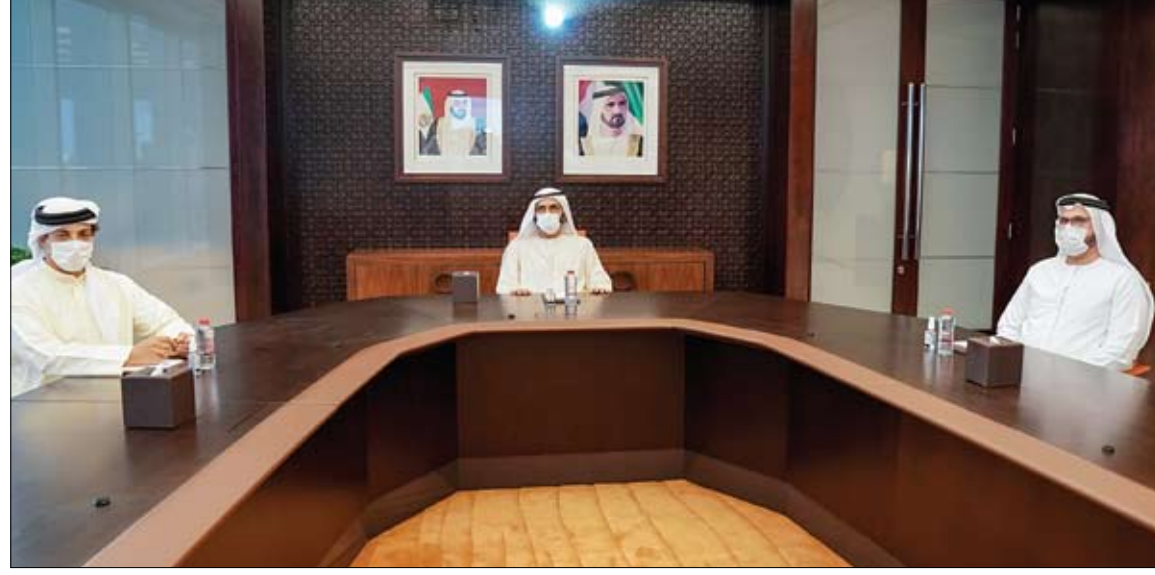
محمد بن راشد خلال اطلاعه على خطط العمل المستقبلية لوزارة الثقافة والشباب

عززت هيئة الهلال الأحمر الإماراتي، مبادراتها لمحاربة العطش وتوفير مصادر المياه في اليمن، حيث نفذت خلال السنوات الماضية مئات المشاريع في مجال إمدادات المياه الصالحة للمناطق والمحافظات اليمنية التي تعاني شحاً في هذا المرفق الحيوي، والتي استفاد منها مئات الآلاف من السكان في المناطق الجبلية والصحراوية، ودشت الهيئة في هذا الإطار مشروعاً تنموياً جديداً لتوفير مصادر المياه في صحراء حضرموت، تمثل في افتتاح بئر ارتوازية في منطقة حورام بمديرية القف في حضرموت، بعمق 470 متراً، ستفيد منها أربعة آلاف نسمة، لتلبية احتياجات سكان المناطق الصحراوية في محافظة حضرموت. (التفاصيل ص3)