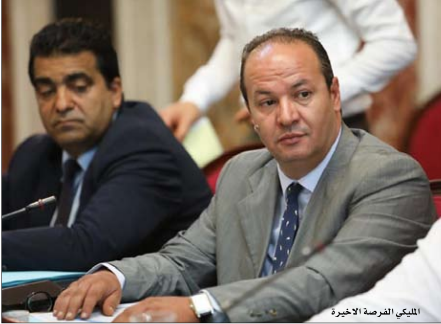
المليكي الفرصة الأخيرة

مرة الأولى منذ دخولها المدينة نهاية عام 2015 بعد اتفاق الصخيرات الذي رعته بعثة الأمم المتحدة، تتعرض الحكومة لظهورات حاشدة يشارك فيها بضعة آلاف من المتظاهرين الذين عكست هتافاتهم إلى حد كبير النوايا الحقيقية للقائمين على تدبيرها. وقالت صحيفة "الشرق الأوسط" إن منظمي الحراك الذي يتوحدون مظاهرات طرابلس، أمهلوا السراج والمجلس الأعلى للدولة الموالي