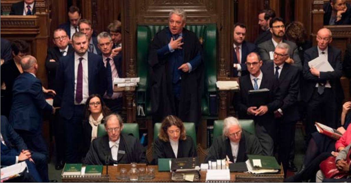
هل يجتمع البرلمان في مكان آخر؟

حاول آلاف المتظاهرين المؤيدين للديموقراطية أمس قطع المنافذ المؤدية لمطار هونغ كونغ، وذلك غداة يوم جديد من الاحتجاجات التي كانت من بين الأكثر عنفاً منذ بداية التحرك. وعلق مشغلو إيربورت إكسبرس خط المطار السريع الذي يصل بين ثامن أكثر المطارات الدولية في العالم ازدحاماً ومركز المستعمرة البريطانية السابقة، خدماتهم بدون أن يقدموا تفسيرات. وقام متظاهرون يرتدون الأسود ويختبئون خلف أقبعة ومظلات للتحفي من كاميرات المراقبة بتسييد حواجز في محطة حافلات المطار. وتشهد المستعمرة البريطانية السابقة منذ ثلاثة أشهر أخطر أزماتها السياسية منذ إعادتها إلى الصين عام 1997، حيث تشهد تحركات شبه يومية للتنديد بتراجع الحريات والتدخل المتصاعد لبكين في هونغ كونغ. وخارج إحدى محطات المطار، قام متظاهرون بصنع حواجز من عربات نقل الأمتعة وحطموا كاميرات المراقبة قبل أن تقوم الشرطة بمطاردتهم.