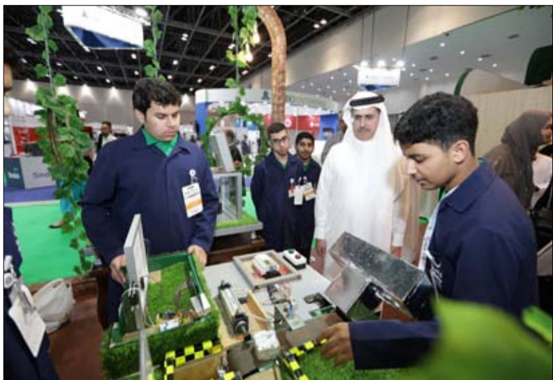
وقال سعادته: "تعزيز مشاركة الجامعات في "ويتيكس"، من موقعه الرائد عالمياً ليصعد الى المراتب الأولى ضمن نخبة المعارض المتخصصة في العالم في مجالات المياه والطاقة والبيئة

والنفط والغاز والطاقة المتجددة والنظيفة. كما تدعم مشاركة الطلاب والأسس التي تشجع والمشاركة والإبداع والابتكار، وهي من أهم الدعامات لاستضافة دبي لمعرض اكسبو 2020، وتحويل دبي إلى المدينة الأذكى والأعلى عالمياً. وستشهد القاعة حلقات نقاشية مفتوحة للمجتمعات لتقديم نظرة موسعة عن أبرز الابتكارات والاختراعات في قطاعات الطاقة التقليدية والمتجددة والمياه والبيئة والنفط والغاز والمجالات ذات الصلة على مدى ثلاثة أيام. كما سيكون للجامعات دور هام في تسليط الضوء على أحدث التوجهات العلمية والبحثية في هذه القطاعات.