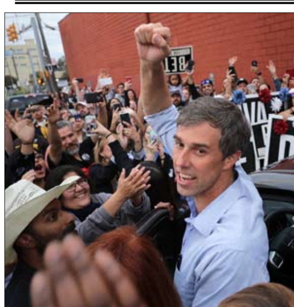
بيتو أورورك يتراجع

لم تعرف كامالا هاريس، نجمة المناظرة الأول، كيف تبقى في صدارة الاستطلاعات؟ تم تشديد شروط المشاركة إلى حد كبير مقارنة بالمناظرتين السابقتين المجموعة الأوفر حظا عمقت الفارق ووسعت الفجوة، ولا يزال جو بايدين في الصدارة