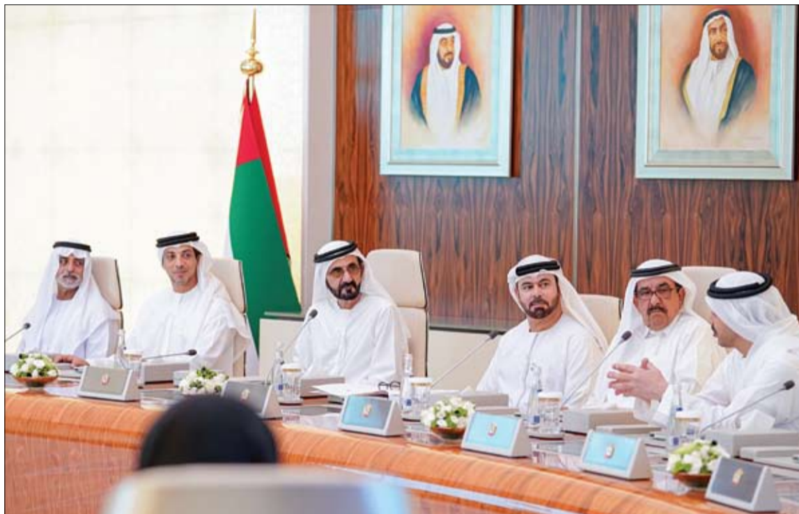
محمد بن راشد خلال ترؤسه اجتماع مجلس الوزراء

اعتمد مجلس الوزراء تشكيل لجنة برئاسة سمو الشيخ منصور بن زايد آل نهيان نائب رئيس مجلس الوزراء وزير شؤون الرئاسة، تضم مجموعة من الوزراء والمسؤولين، وذلك لتفعيل توجيهات صاحب السمو الشيخ محمد بن راشد آل مكتوم نائب رئيس الدولة رئيس مجلس الوزراء حاكم دبي رعاه الله للحكومة الاتحادية ومجلس الوزراء، وذلك بما يعكس الرسالة التي وجهها صاحب السمو لأبناء الإمارات وكافة المسؤولين في الدولة بمناسبة بدء موسم جديد من العمل والإنجاز، بحيث تعمل اللجنة على توفير الأطر القانونية والإجرائية لترجمة توجيهات سموه على الأرض، ورفع خطة أول 100 يوم لسموه، على نحو يكفل الارتقاء بأداء المؤسسات الحكومية والخاصة في الدولة، ويسهم في تعزيز الأداء الاقتصادي والاجتماعي، ويحقق رضا المواطنين وسعادتهم، وينتقل بالحراك التنموي في الدولة في كافة القطاعات إلى آفاق جديدة. جاء ذلك خلال اجتماع مجلس الوزراء امس في قصر الوطن بأبوظبي، بحضور سمو الشيخ منصور بن زايد آل نهيان نائب رئيس مجلس الوزراء وزير شؤون الرئاسة. وأكد صاحب السمو الشيخ محمد بن راشد آل مكتوم: الرسالة التي بعثناها وصلت.. والأفعال أهم من الأقوال.. وستابع ما وعدنا به.. وأجدت فتى في كافة الوزراء والقادة لتحمل مسؤولياتهم أمام شعبنا. وأضاف سموه: أحلامنا في السماء.. ولكن أقدامنا على الأرض.. ولدينا استعداد للتحديات العملية والواقعية في كافة قطاعاتنا الحيوية.. حكومتنا ستبقى مسخرة لخدمة المواطنين.. ورفاهية المواطنين.. وتوفير حياة عزيزة للمواطنين.. هكذا تعلمنا من زايد. (التفاصيل ص2)