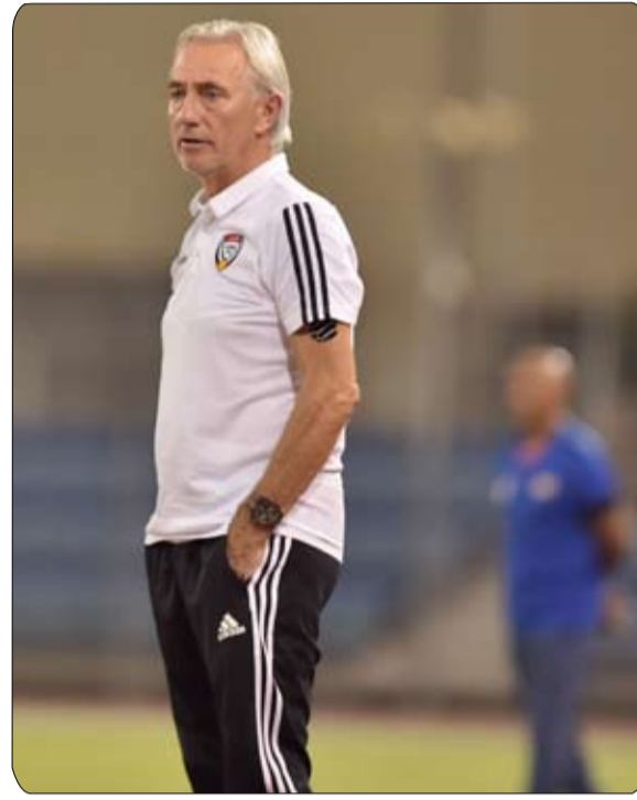
الكرة بطريقة سلسة من الدفاع قدرات وامكانيات اللاعبين حيث عادت الخطورة الهجومية وانتقال