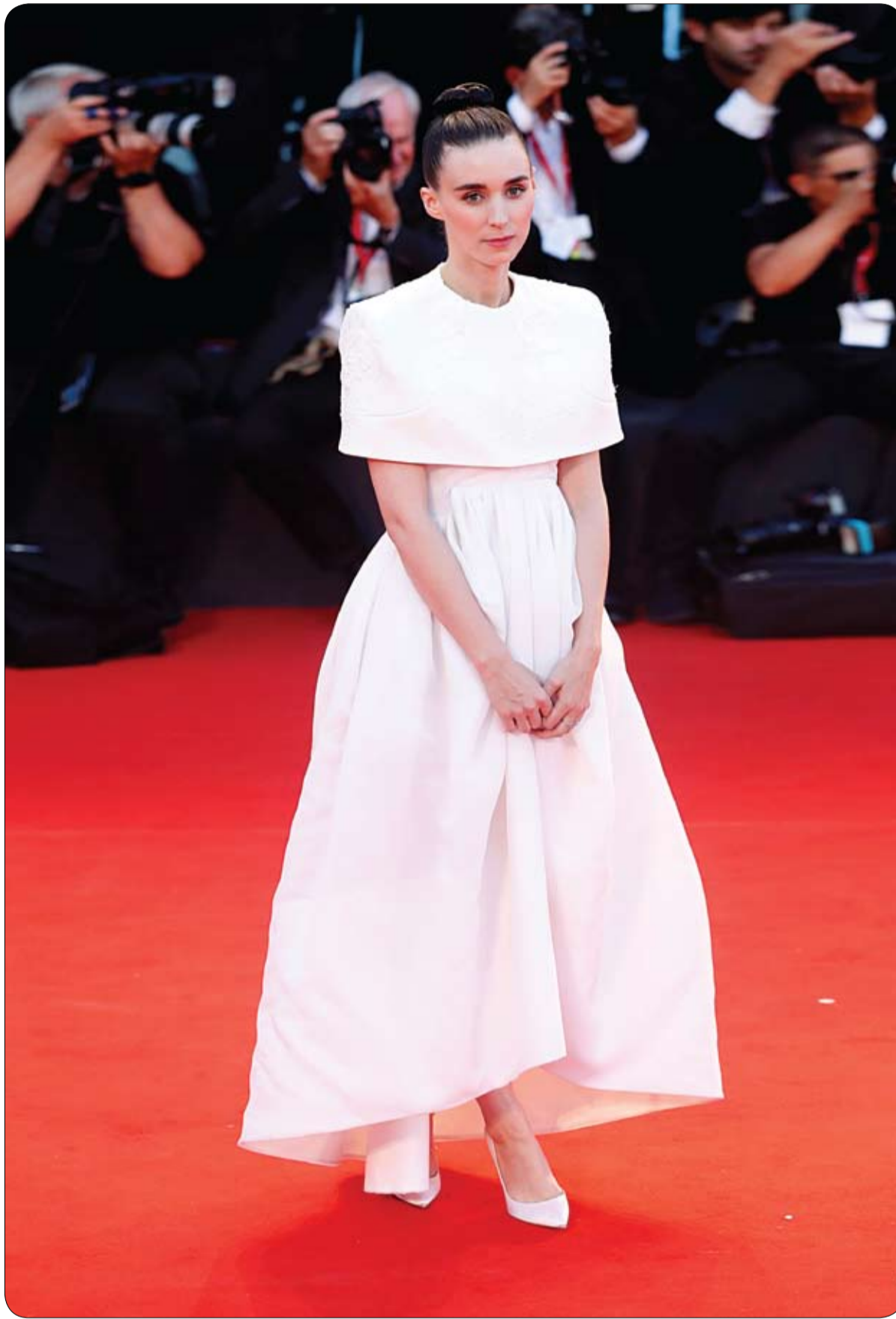
روني مارا خلال حضورها عرض فيلم «الجوكو» في مهرجان البندقية السينمائي السادس والسبعين في إيطاليا.

كثيرا ما يلجأ الناس إلى هواتف أبل، وأجهزتها الإلكترونية، بدعوى أنها واحدة من أكثر الأجهزة أماناً، وأكثرها تحصيناً من إمكانية الاختراق، فهل هذا صحيح؟ وكشفت باحثون مختصون في الأمن الخارجي لشركة "غوغل" أن عملية اختراق غير مسبوقه طالت هواتف أيفون، إذ وقع الألاف من المستخدمين ضحية لهجمات، نجح مسؤولو أمن أجهزة الشركة في تعطيّلها بعد ذلك. وتشير تفاصيل عمليات الاختراق تلك، إلى أنها استمرت على مدى عامين ونصف، وأن مجموعة من المواقع الإلكترونية ساهمت في العملية من خلال تحميل تطبيقات ضارة على هواتف أيفون. وتم تسلل أحدث أجهزة أيفون وأكثرها تطوراً لمواجهة هذه النوع من عمليات الاختراق، إذ أن عيوباً أمنية كشف عنها الباحثون في أنظمة تشغيل الهاتف الشهير، انضالقا من IOS10 وصولاً إلى IOS12. ورغم محاولات الشركة طمأنة مستخدمي جهاز "التفاحة المقصومة" الشهير، بأن هذه البرامج الضارة تختفي بمجرد إعادة تشغيل الجهاز، ما لم تتكرر عملية زيارة تلك المواقع الخطيرة، إلا أن باحثين أمنيين في شركة "غوغل" شكوكا في ذلك.