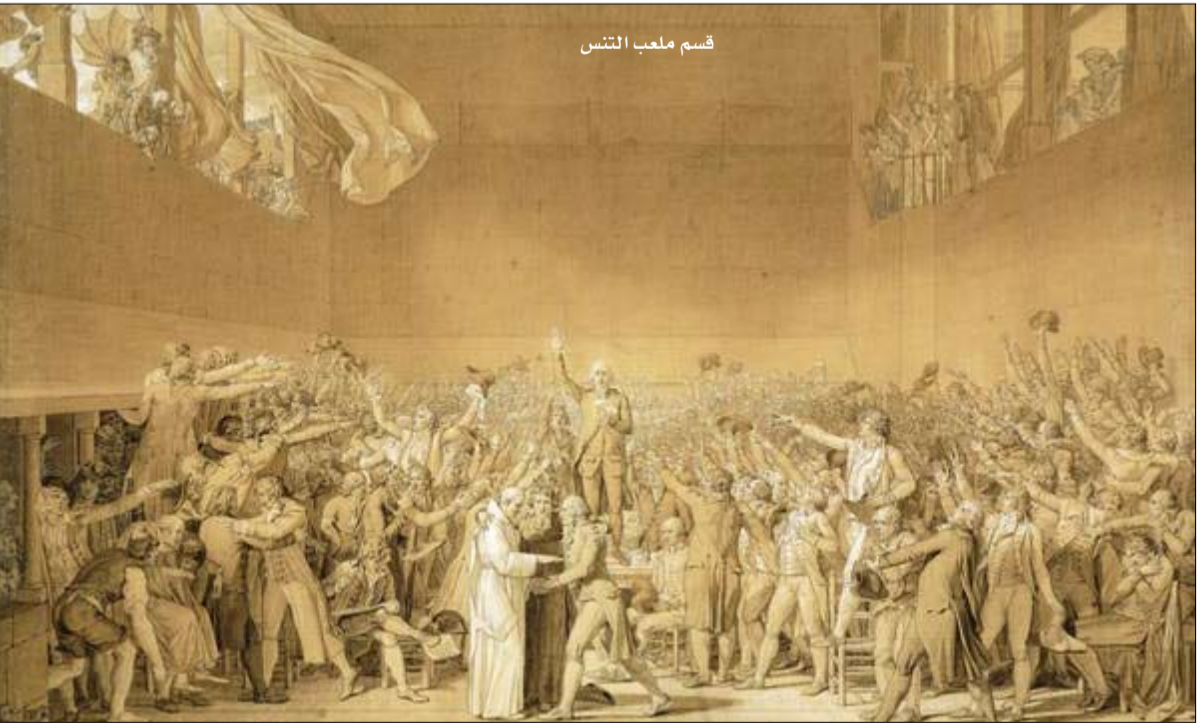
قسم ملعب التنس