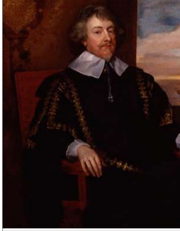
الرئيس جون فينش

كثيرون يرون في طلب جونسون محاولة لفرض البريكسيت دون اتفاق