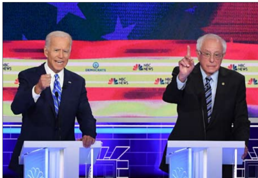
بايدن وساندرز.. ثنائي الطبيعة