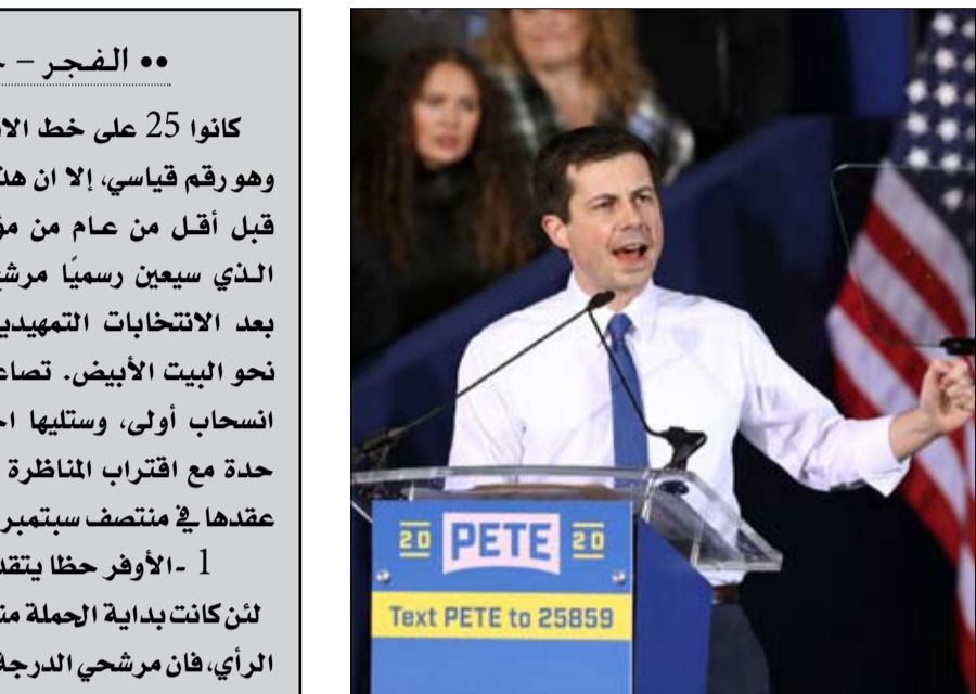
بيت بوتيجيج.. من الصعود الى الانحدار