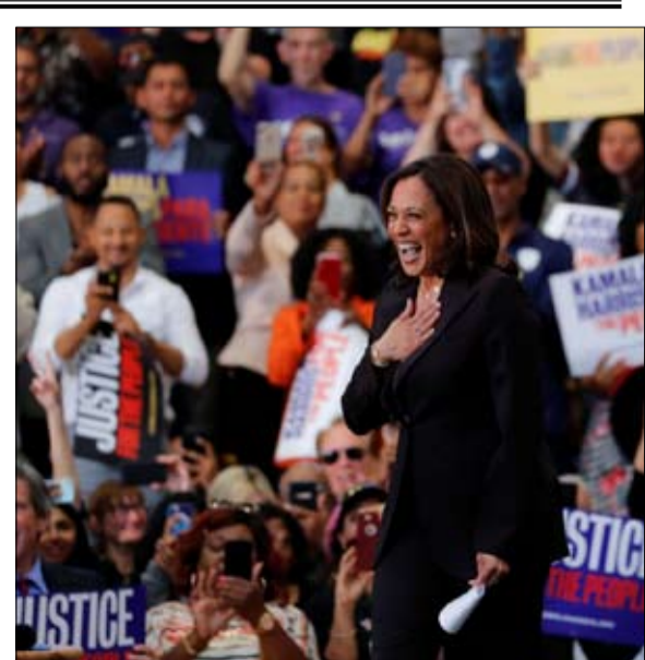
كامالا هاريس لم تعرف كيف تحافظ على تقدمها

لم تعرف كامالا هاريس، نجمة المناظرة الأول، كيف تبقى في صدارة الاستطلاعات؟ تم تشديد شروط المشاركة إلى حد كبير مقارنة بالمناظرتين السابقتين المجموعة الأوفر حظا عمقت الفارق ووسعت الفجوة، ولا يزال جو بايدين في الصدارة