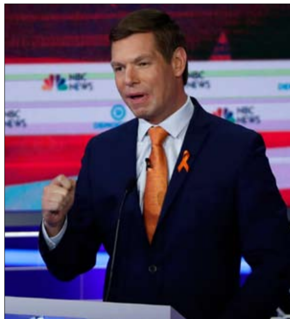
إريك سولهايم غادر السباق

طردت قوات الأمن الأفغانية مقاتلي حركة طالبان من قندوز غداة هجومهم على المدينة الواقعة في شمال البلاد، وفق ما أعلن مصدر رسمي أمس. واندلع قتال أيضاً في مدينة بول-اي خمري عاصمة ولاية بغلان المجاورة، لكن مسؤولين قالوا إن الوضع "تحت السيطرة". وأطلق المتمردون هجماتهم من جهات عدة ليل الجمعة السبت محاولة السيطرة على هذه المدينة الاستراتيجية الواقعة على الحدود مع طاجيكستان، في تكرار لاستيلائهم على المدينة في العام 2015. وأطلق هذا الهجوم في حين أن متطرفي طالبان والولايات المتحدة يجرون مفاوضات في الدوحة حول ملامح اتفاق سلام مستقبلي قد يترجم عبر تخفيض كبير للوجود العسكري الأمريكي في أفغانستان مقابل ضمانات في ما يخص مكافحة الإرهاب. ودارت معارك عنيفة في قندوز السبت حصل الجيش الأفغاني خلالها على دعم جوي أمريكي، حسب ما أفاد متحدت باسم وزارة الداخلية نصرت رحيبي وكالة وكالة فرائس برس. وأضاف "تم تطهير مدينة قندوز وطُرد (متمردو طالبان من المناطق التي كانوا سيطروا عليها" بحلول ظهر الأحد، مشيراً إلى مقتل 56 "إرهابياً". إلا أن المتحدث باسم طالبان ذبيح الله مجاهد نفى هذا التصريح مؤكداً أن المتمردين لا يزالون يسيطرون على مواقعهم. وقال للصحافيين "دعاية العدو التي تقيد بأن المجهدين طُردوا أو قُتلوا خاطئة.. وقالت الوزارة إن 20 من عناصر القوات الافغانية قتلوا بالإضافة إلى خمسة مدنيين. وذكر مسؤولون إن 65 مدنيًا جرحوا في الهجمات.