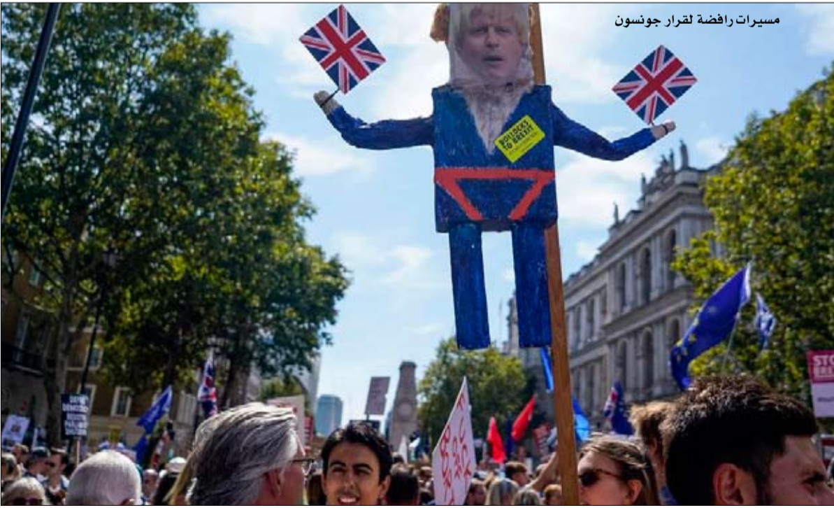
مسيرات رافضة لقرار جونسون

البلدين الألماني يواكيم فون ريبنتروم والسوفيياتي فياتشيسلاف مولوتوف، وقتل في الحرب العالمية الثانية بين أربعين وستين مليون شخص بينهم عشرة آلاف يهودي كانوا ضحايا المحرقة التي قام بها النازيون. وفي الثالث من أيلول/سبتمبر، أعلنت فرنسا وبريطانيا حليتهما بولندا الحرب على ألمانيا، لكن بدون إطلاق عمليات مهمة. في 17 أيلول/سبتمبر هاجم الاتحاد السوفيياتي شرق بولندا. انتهى التعاون بين النازيين والسوفييات مع هجوم هتلر على الاتحاد السوفيياتي في 22 حزيران/يونيو 1941. واستمرت الحرب بين الحلفاء الذين انضم إليهم الاتحاد السوفيياتي والولايات المتحدة من جهة، والمحور الألماني الإيطالي الياباني الذي هزم في 1945. ويلقي نائب الرئيس الأميركي مايك بنس بعد ودنا وشاتينماير، خطاباً في قصر بيلوسدسكي أمام قبر الجندي المجهول في وارسو.