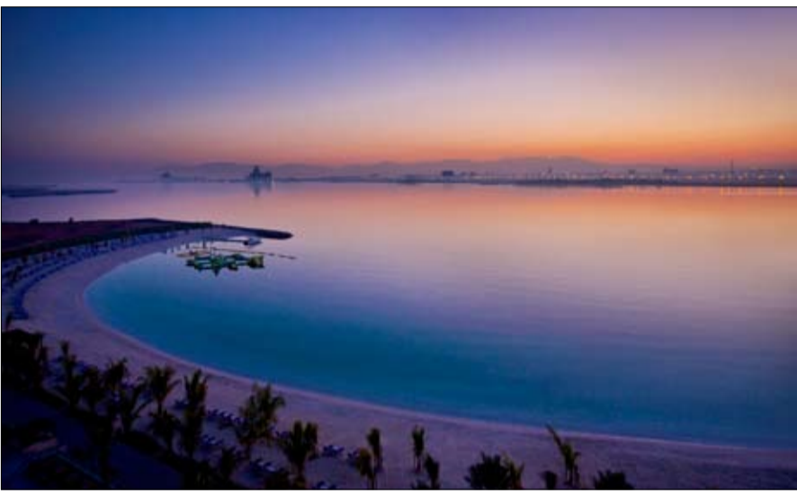
أما النصف الآخر من المخلفات، الزائرون القادمون إلى شواطئ الإمارة، والذين يتكونون النفايات البلاستيكية والمعلبات وغير ذلك وراهم.

بالتسوية للسكان في الإمارة والزائرين القادمين من كل مكان. وأضاف: لا تقتصر أهمية شواطئ إمارة رأس الخيمة على كونها من أروع الوجهات في الإمارات، ولكنها تشمل أيضا موطن الكثير من الأحياء المائية، والتي تواجه المخاطر والتحديات نتيجة للتصرفات غير المسؤولة لبعض الأشخاص، ولا شك أن دور مبادرة إمارتي بيتي لتنظيف شواطئ إمارة رأس الخيمة لا يتوقف على مجرد إزالة كميات كبيرة من المخلفات والنفايات البلاستيكية من الشواطئ، وإنما تهدف لنشر الوعي بين أفراد المجتمع حول فضائل الاستدامة. نحن نلهم الأشخاص