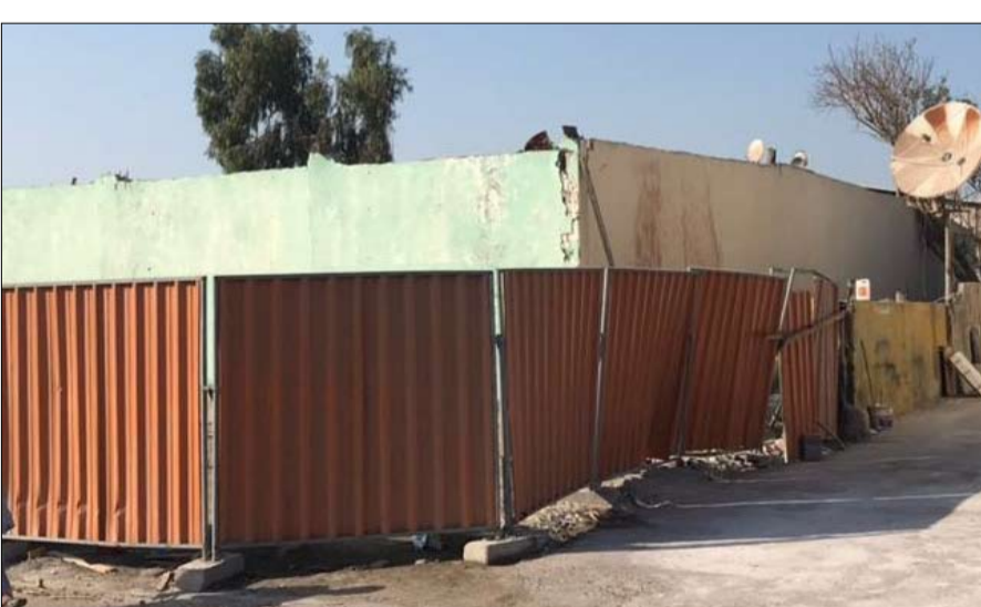
الصاح ومثبتاً على إطار حديدي ومركباً على قواعد خرسانية غير ثابتة، وأن يُصبغ السور باللون البرتقالي الفاتح اللازمة له.

الاصطناعي" في 22 من فبراير الجاري كما تقيم الهيئة فعاليات في خيمة الابتكار في مقرها الرئيسي ومراكزها في القوز وجبل علي وورسان، وفعاليات مبتكرة أخرى ضمن ركن واحة زايد للابتكار. وينطلق اليوم "معرض إنترنت الأشياء" الذي تنظمه "الإدارة العامة للإقامة وشؤون الأجانب بدبي ليستعرض أبرز الخدمات الابتكارية المقدمة بأسلوب جديد يهدف إلى كسر الحواجز وتعزيز التواصل بين المؤسسات الحكومية والجمهور. وتشارك الإدارة أيضاً في فيلم بعنوان "مضات من فكر 2018 - بناء مهارات فرق العمل عن طريق علوم الروبوتيات" والذي يقدم رؤى استشرافية حول الابتكار والإبداع والإدارة والمجتمع والثقافة مستوحاة من كتاب "مضات من فكر" لصاحب السمو الشيخ محمد بن راشد آل مكتوم نائب رئيس الدولة رئيس مجلس الوزراء حاكم دبي "رعاه الله". وتتمتع "كلية محمد بن راشد للإدارة الحكومية" في الابتكار عبر مختبر التفكير الإبداعي الذي يستهدف تمكين فرق العمل في المؤسسات من تبني منظور يركز على العملاء من خلال الأدوات والأطر والتقنيات التي تهدف إلى مساعدتهم على التفكير بشكل خلق حول المنتجات والخدمات. ويتيح المختبر حول مواضيع رئيسية تدور حول فهم جوانب التفكير الإبداعي والتحقق من احتياجات وإهتامات المستخدمين الفعليين للخدمات فضلاً عن إيجاد حلول مبتكرة للمشاكل التي تواجههم ومن ثم تصميم واختبار وتطبيق نماذج مختلفة للحلول الممكنة.