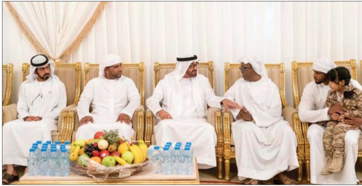
محمد بن زايد خلال تقديمه واجب العزاء إلى أسرة شهيد الوطن علي خليفة هاشل السماري

أبوظبي-وام: تحت رعاية صاحب السمو الشيخ محمد بن زايد آل نهيان ولي عهد أبوظبي نائب القائد الأعلى للقوات المسلحة .. كرم سمو الشيخ حامد بن زايد آل نهيان رئيس ديوان ولي عهد أبوظبي الهيئات والإساعات والشركات الفائزة بجائزة الشيخ خليفة للامتياز في دورتها 16 والتي بلغ عددها 33 هيئة وشركة. جاء ذلك خلال الحفل الذي أقامته غرفة تجارة وصناعة أبوظبي صباح أمس بحضور عدد من كبار المسؤولين وكلاء الدوائر وسفراء الدول الشقيقة والصديقة لدى الدولة وأعضاء مجلس إدارة غرفة تجارة وصناعة أبوظبي. (التفاصيل ص3)