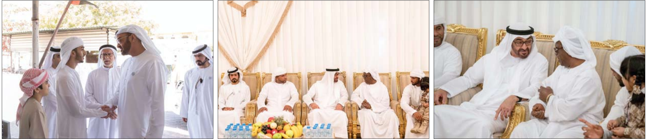
قدم واجب العزاء في شهيد الوطن علي المسماري وعبدالرحمن الأحمد

وسيتم تدشين «صرح زايد المؤسس» من خلال الكشف عن العمل الفني الذي يتوسط الصرح والذي يأتي تزامنا مع مرور 100 عام على ميلاد المغفور له الشيخ زايد بن سلطان آل نهيان «رحمه الله». ويأتي هذا الصرح التذكاري تخليدا لذكرى باني الوطن المغفور له الشيخ زايد بن سلطان آل نهيان «طيب الله ثراه» وما قدمه من مبادئ سامية ورؤية ثاقبة وترسيخا لقيمه النبيلة وإنجازاته العظيمة على مستوى الدولة والمنطقة والعالم أجمع. ومن المقرر أن يفتح الصرح أبوابه أمام الجمهور في ربيع 2018 وسيقدم عددا من التجارب الشخصية مع الأب