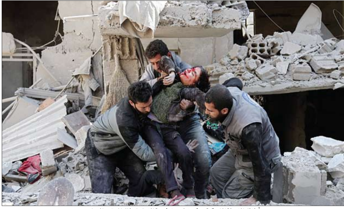
أطفال الغوطة الشرقية يدفون ثمن غطرسة القوة وتحالف المجتمع الدولي

وكثرت عسكرية للمليشيات الانقلابية في صنعاء ومواقع وتجمعات في جهات شمال غرب محافظة تعز مخلفة قتلى وجرحى في صفوف المليشيات وتدمير عتاد عسكري. وأكدت مصادر أمنية في صنعاء أن الغارات استهدفت مخازن أسلحة في جبل النهدين، ومعسكراً تدريبياً في منطقة عمد بمديرية سحان جنوب العاصمة. وأفضل القصف، بحسب المصادر نفسها، محاولة للمليشيات نقل صواريخ وأسلحة من مخزن في جبال النهدين وسقوط قتلى وجرحى. وفي تعز، أفادت المصادر أن طائرات التحالف العربي استهدفت خلال ساعات الليل بعدة غارات مواقع وتحركات للمليشيات في مناطق موزعة والبرح ومرفق الوازية والعرف على خط حيس شمير شمال غرب تعز. وأكد جهود عيان أن طائرات تحالف دعم الشرعية تقصف على مدار الساعة كل تحركات وتعزيزات المليشيات عبر خطوط الإمداد الرابطة بين أب والحديدة، مؤدية سقوط عشرات القتلى من عناصر المليشيات قبل وصولهم إلى خطوط المواجهات.