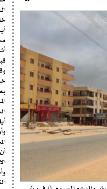
الدخان يتصاعد في جنوب الخرطوم وسط القتال الدائر بين قوات الجيش والدعم السريع

الخرطوم-وكالات: دخلت الأزمة في السودان يومها الخامس والعشرين، أمس الأربعاء، وسط استمرار لجهود إنهاء الصراع والوصول إلى وقف دائم لإطلاق النار، إلا أن غياب أرضية للتفاهم ترك الوضع على حاله لتتجدد الاشتباكات وتواصل حصد الضحايا، وسط ترددي الأوضاع المعيشية من انقطاع مياه وكهرباء وإنترت، فيما قالت السعودية إن المفاوضات في جدة يعملون على وقف قصير المدى لإطلاق النار. وفضل كل من الجيش السوداني وقوات الدعم السريع في الالتزام باتفاقات الهدنة المتكررة حيث تتواصل الممارك بين الجيش والدعم السريع الدامية وإفادة شهود عيان في الخرطوم، فيما أكدت قوات الدعم السريع بأن القصر الرئاسي أصيب بضريرة قوية خلال غارات الجيش. وفي آخر التطورات، سجع دوي غارات عنيفة للطيران الحربي، صباح أمس وسماع دوي انفجارات