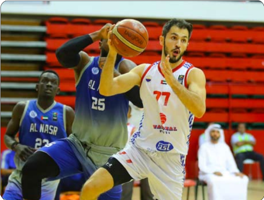
النهائي، مع الفائز من مباراة النصر مع الظفرة. ويتم تحديد ملاعب نصف النهائي لاحقا، فيما بني ياس الحادي عشر (23 نقطة) على

أعلن اتحاد الإمارات لكرة السلة عن المواعيد الجديدة لمباريات الأدوار ربع النهائي ونصف النهائي، بطولة كأس صاحب السمو رئيس الدولة لكرة السلة لمرحلة الرجال، والتي تنطلق فعاليات يوم السبت المقبل، بمشاركة 7 فرق هي شباب الأهلي، والشارقة، والوحدة، والوصل، والبطائح، والظفرة، والنصر. وتقام جميع المباريات في توقيت واحد (الساعة 7:30 مساء)، بنظام خروج المغلوب. ويلتقي يوم السبت المقبل في ربع النهائي، شباب الأهلي مع البطائح على ملعب الوصل، والوصل مع الوحدة على ملعب النصر، والنصر مع الظفرة على ملعب الجزيرة. وتقام مباريات نصف النهائي يوم الجمعة، 19 مايو الجاري، حيث يلتقي الفائز من مباراة شباب الأهلي والبطائح، مع الفائز من مباراة الوصل مع