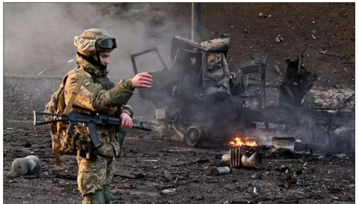
قوات فاغنر تحارب في مالي