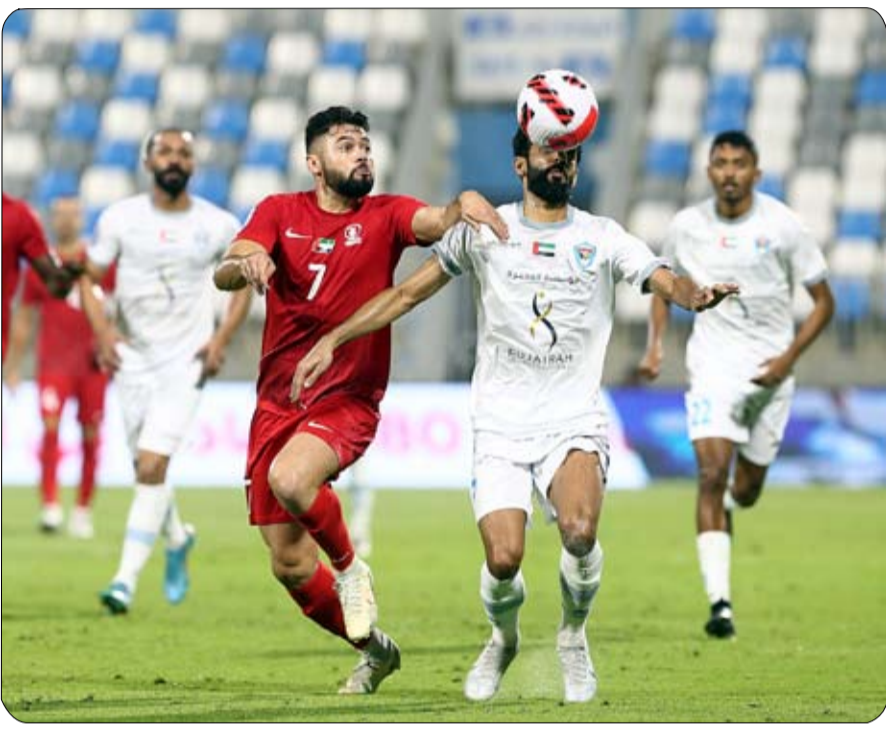
الثالث (51 نقطة) مع بني ياس الوحيد، ويأمل الوحدة في حال تعثر العين، فيما بني ياس الحادي عشر (23 نقطة) على

البقاء. ويشهد اليوم الأخير من هذه الجولة (السبت) لقاء شباب الأهلي مع عجمان الرابع (44 نقطة) على استاد راشد في دبي، بعدما توج شباب الأهلي بطلا للمرة الثامنة في تاريخه، والرابعة في عصر الاحتراف، بغض النظر عن نتيجة اللقاء. وبالعودة ذاتها، يلتقي اليوم الخميس فريق الجزيرة السادس (43 نقطة) مع اتحاد كلباء الثامن (33 نقطة) وكلاهما يرغب في الفوز لتحقيق مركز أفضل، ويستضيف خورفكان التاسع (25 نقطة) فريق الوصل الحادي عشر (23 نقطة) على استاد