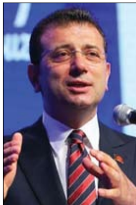
أكرم امام أوغلو

(49 عاماً) زعيم حزب الشعوب الديمقراطي المؤيد للأكراد سابقاً واحداً من الشخصيات السياسية المهمة على الرغم من أنه يقبع في السجن منذ عام 2016. ويواجه ديمرداش عقوبة يحتمل أن تصل إلى السجن المؤبد في قضية أتهم فيها بالتحريض على احتجاجات عام 2014 التي أسفرت عن مقتل العشرات. وسيخوض حزب الشعوب الديمقراطي، الذي أعلن دعمه لحزب اليسار الأخضر للحزب، الانتخابات باسمه في الانتخابات.