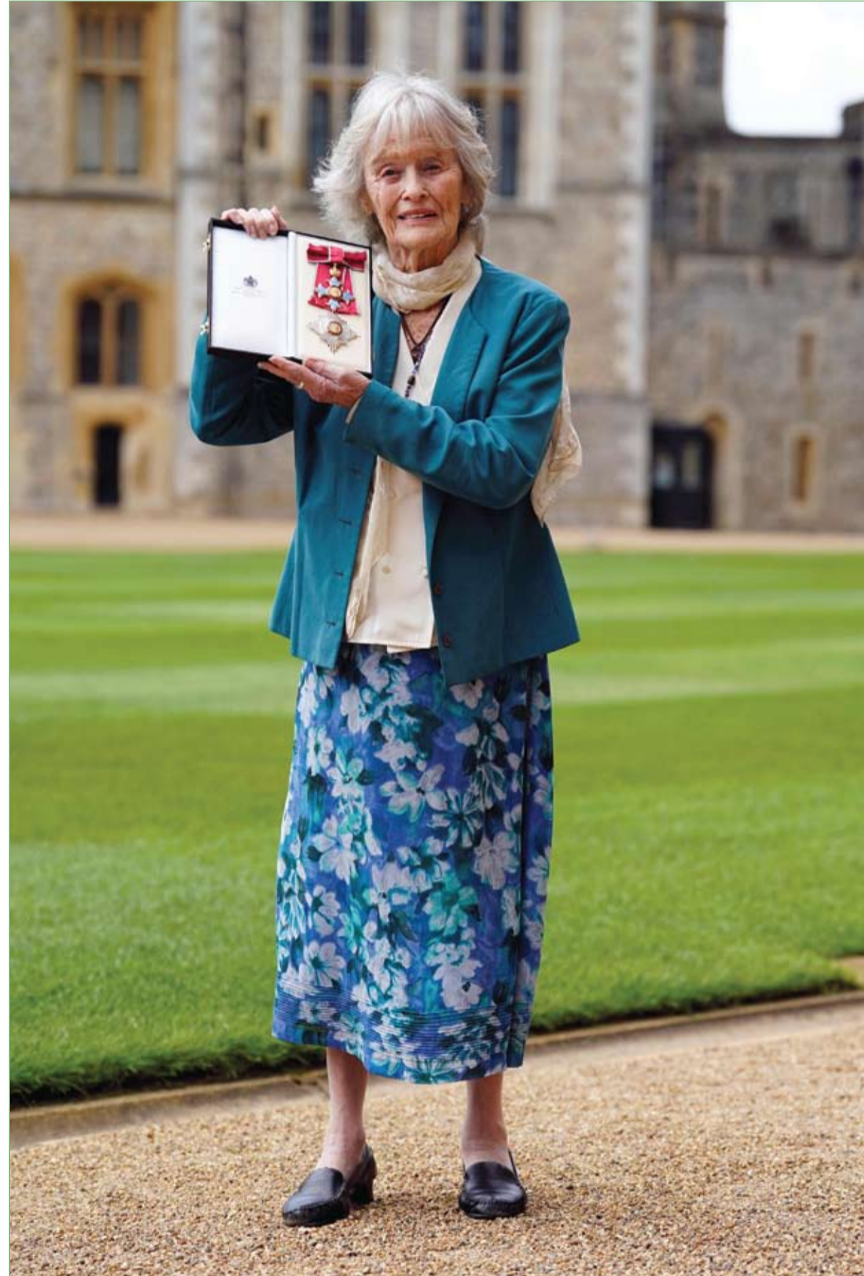
الملكة البريطانية فيرجينيا ماكينا بعد حصولها على وسام الامبراطورية البريطانية من قبل أمير ويلز خلال حفل تنصيب في قلعة وندسور

عندما يستعد الباحث عن وظيفة، لمقابلة عمل، من الضروري أن يفكر بالأساسيات التي تسير عليها المقابلات والتحضير لكل الطوارئ التي يمكن أن تحدث أثناء إجراء المقابلة لتجنب ما يمكن أن يفاجئه على حين غرة بأي شيء قد يؤدي إلى رفضه. أمامنا هنا قصة رجل ارتكب خطأ فادحاً في مقابلة شهدت رفضه على الفور للوظيفة التي تقدم إليها ولم يكن لسبب الرفض علاقة بالمقابلة نفسها، حيث اتضح أن الرجل ترك انطباعاً سيئاً قبل أن تتاح له الفرصة لإثبات قدراته، حيث أخفق في معاملة موظف الاستقبال بلطف عندما دخل المبنى.