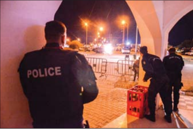
عناصر الشرطة أثناء تبادل لإطلاق النار بالقرب من الكنيس

صباح أمس، أصبح بذلك عدد القتلى الأمتين 4، بينهم منفذ الهجوم. كما قتل في الهجوم زائران يهود أحدهما تونسي والآخر تونسي يحمل الجنسية الفرنسية، وفق وزارة الخارجية التونسية. وقالت وزارة الداخلية في بيان إن هجوم الثلاثاء كان على مرحلتين. وأوضحت أن عنصراً من المركز البحري للحرس الوطني، أقدم مساء الثلاثاء على قتل زميله بسلاحه الضروي والاستيلاء على الذخيرة، مضيفة أنه حاول الوصول إلى محيط معبد