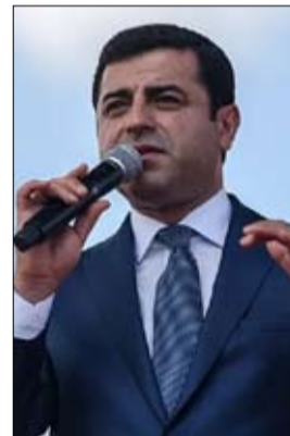
صلاح الدين ديمرداش

ترك علي باباجان (55 عاماً)، نائب رئيس الوزراء سابقاً الذي كان حليفاً مقرباً لأردوغان ذات يوم، حزب العدالة والتنمية في عام 2019 بسبب خلافات حول سياسات حزب العدالة والتنمية في القانون والديمقراطية. ويحظى السياسي الذي تولى منصب وزير الاقتصاد وكذلك