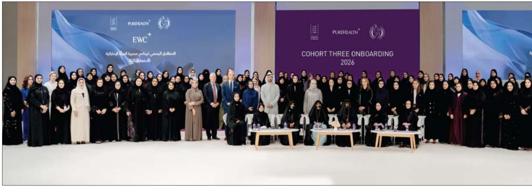
تحت رعاية فاطمة بنت مبارك «أم الإمارات»