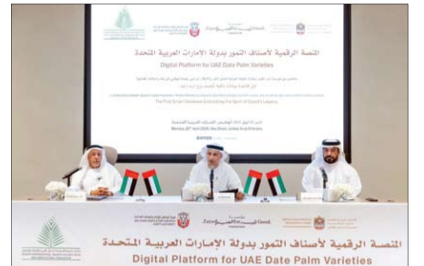
أول قاعدة بيانات رقمية ذكية ومتكاملة لأصناف التمور في الدولة