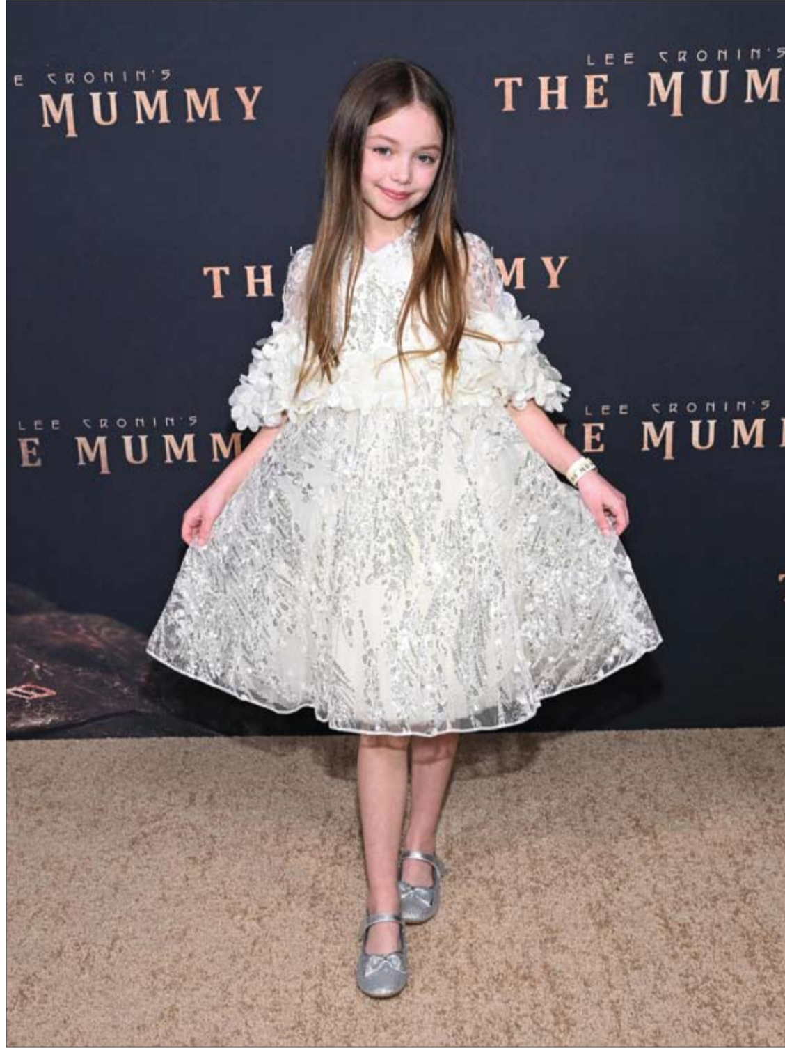
الممثلة الكندية إميلي ميتشل لدى حضورها العرض الخاص لفيلم «المومياء» للمخرج لي كرونين في هوليوود.