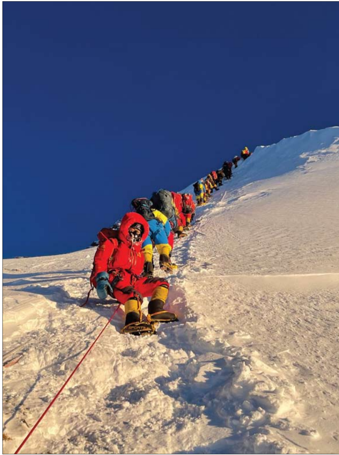
متسلي الجبال أثناء قمة جبل إيغرس 8848.86 مترا في نيبال.

يوجد في الفلفل الأحمر، فيتامين سي المفيد لإنتاج الكولاجين، بالإضافة إلى عدد من مضادات الأكسدة القوية.