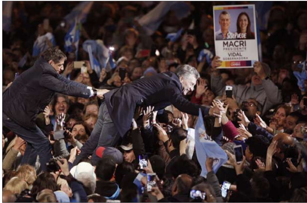
الرئيس المنتهية ولايته... ماكري

ووفق القوانين الانتخابية الأرجنتينية، التي عفا عليها الزمن - إن لم نقل سريالية - يكفي أن يفوز البروتو فرنانديز اليوم الأحد بنسبة 45 بالمئة من الأصوات، أو بنسبة 40 بالمئة على الأقل بفارق 10 نقاط على موريسيو ماكري، ليتم انتخابه في الجولة الأولى. خلال الانتخابات التمهيدية، في 11 أغسطس الماضي، وهي نوع من البروفة العامة، تقدم أليبرتو فرنانديز بـ 15 نقطة على رئيس الدولة الليبرالي اليميني 47 بالمئة، مقابل 32 بالمئة من الأصوات.