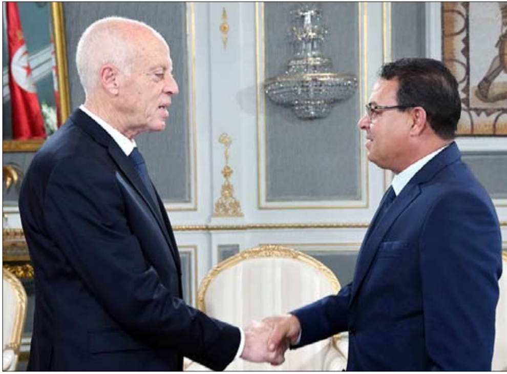
قيس سعيد يلتقي رؤساء الأحزاب

قال رضا المكي عضو الحملة التفسيرية لبرنامج الرئيس التونسي قيس سعيد في تصريح إعلامي أمس السبت، إن كل السيناريوهات المتداولة حالياً لتشكيل الحكومة سابقة لأوانها، ويجب في هذه المرحلة الاحتكام فقط إلى النص الدستوري، وفق تقديره. وتابع "النصوص القانونية في الدستور واضحة وتشرّح مراحل تشكيل الحكومة وفرضياتها وحفاظاً على هذا المسب لا بد من المرور بما يقتضيه النص". وأضاف "من السابق لأوانه الحديث حالياً عن حكومة الرئيس مثلا والحزب الفائز في الانتخابات التشريعية من مسؤوليته تقديم رئيس حكومة منه أو من خارجه وتشكيلها وإن عجز عن ذلك نمر إلى نص آخر".