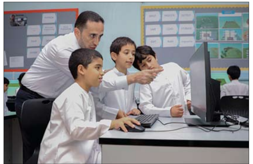
بمشاركة أكثر من 500 طالب وطالبة في 6 مدارس