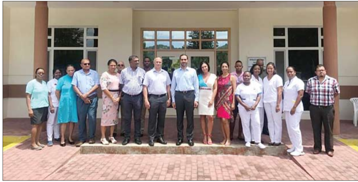
خليفة بن زايد آل نهيان للأعمال الإنسانية بهدف تقديم المساعدات الطبية ودعم القطاع الصحي في جمهورية سيشل.

وأوضح أن الإمارات قدمت الكثير في القطاع الصحي واهتمت بجلب الكادر الطبي المتميز في تخصصات لم تكون موجودة في البلاد من قبل، مشيراً إلى أن بلاده تتطلع لتعزيز العلاقات مع الإمارات إلى أعلى مستويات خدمة لشعبها البلدين.