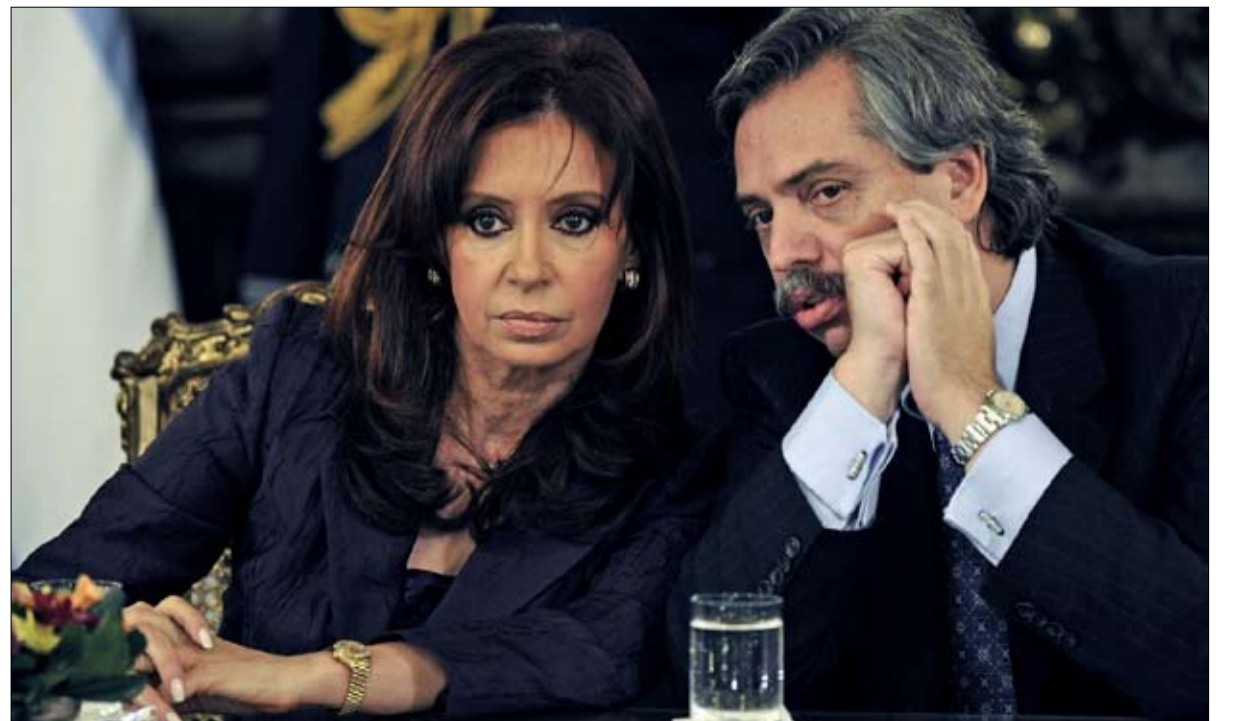
الثنائي البيروني على درب التتويج