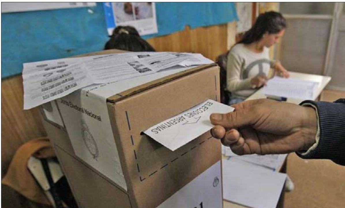
اقتراع محسوب قبل أن يجري

لم تكن حكومة ماكري محظوظة، مع وجود بيئة دولية متقلبة منذ تولي ترامب السلطة