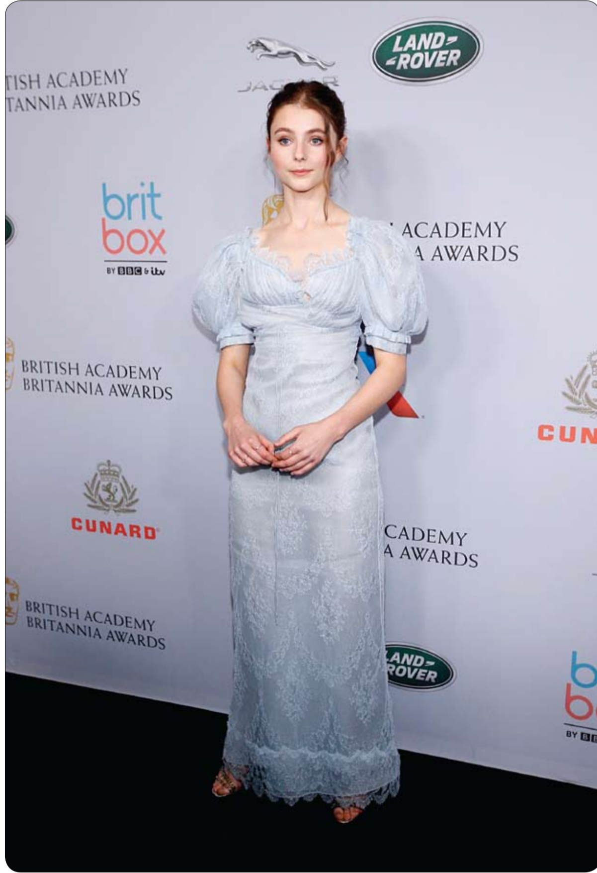
توماسين ماكنزي لدى وصولها لحضور جوائز الأكاديمية البريطانية 2019 في فيضلي هيلز، كاليفورنيا.

أعلنت الشرطة الإيطالية أنها تفككت من تفكيك شبكة مافيا لإعادة تدوير البلاستيك، يتزعمها مجرم خطير، حيث كانت تقوم شحن مواد بلاستيكية سامة إلى الصين لتحويلها إلى أفضية يتم بيعها لاحقا في إيطاليا. وأوقفت الشرطة 10 أشخاص ووضعت 5 آخرين قيد الإقامة الجبرية، كما جمعت أعمال 5 شركات في صقلية، بعد الكشف عن عملية إعادة تدوير البلاستيك المصنوعة بالأسود والسموم والمبيدات الحشرية. ووجهت إلى المحققين تهم الابتزاز وحياسة أسلحة غير قانونية، والتسبب بأذى جسدي خطير وتهريب النفايات. وقالت الشرطة إن الشبكة يتزعمها كلاوديو كاربونارو، وهو رجل عصابات كان وراء جرائم بشعة في الثمانينات والتسعينات تشمل أكثر من 60 جريمة قتل. وبعد أن تحول إلى شاهد لدى الشرطة، عاد كاربونارو عام 2013 إلى صقلية حيث تزعم عصابة تابعة للمافيا، وبدأ عمله في تهريب البلاستيك الملوث الذي يدر الكثير من المال، وتأتي هذه العملية التي قامت بها الشرطة بعد تحقيق دام 4 سنوات، أثر ضيق أحذية في روما مصنوعة من مواد سامة. وكشف التحقيق أنه كان يتم تجميع النفايات البلاستيكية في مستودعات في صقلية قبل أن تشحن إلى الصين لتعود إلى إيطاليا كأفضية.