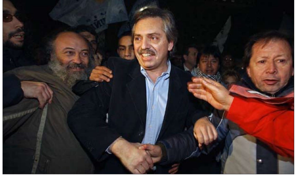
البروتو فرنانديز الرئيس المرقب