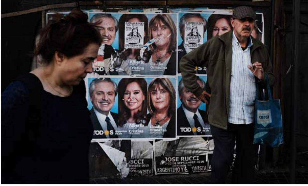
الاقتصاد عامل حاسم في الاختيار