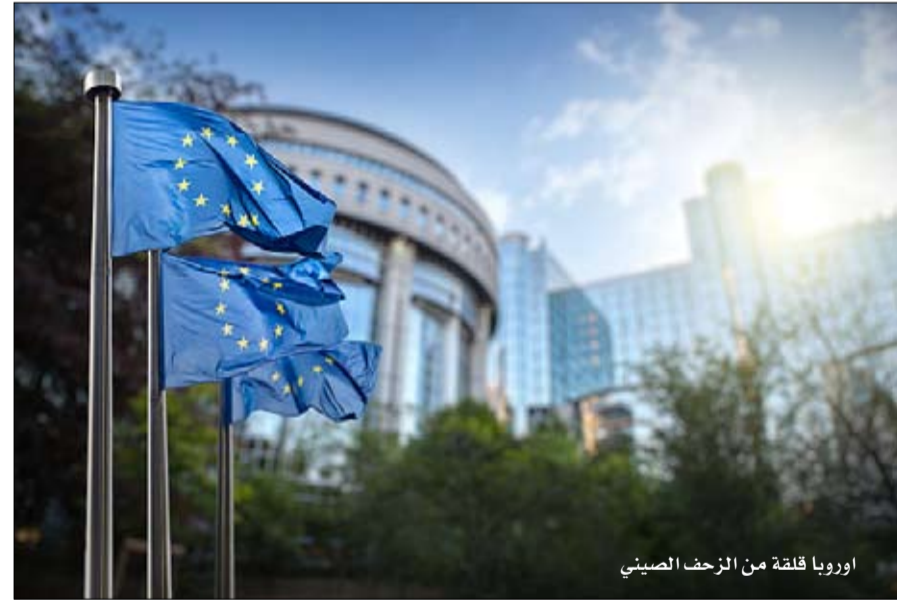
أوروبا قلقة من الزحف الصيني