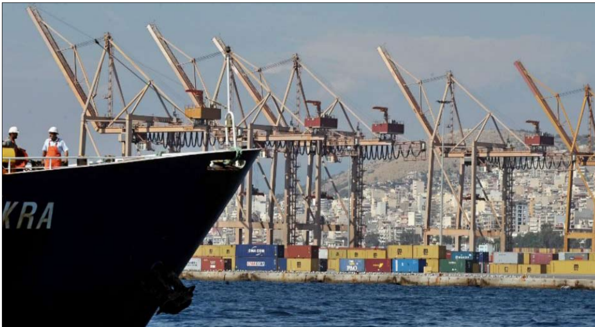
اليونان... جسر عبور لاوروبا