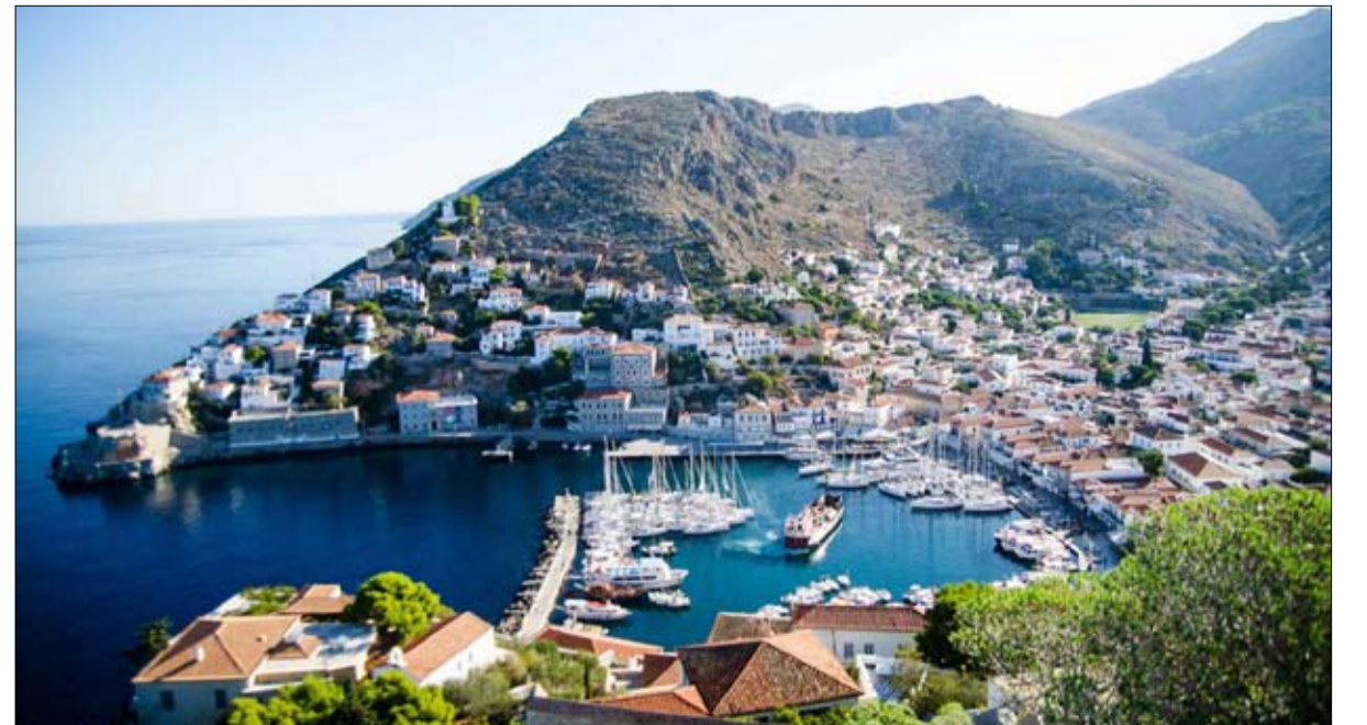
سوق العقارات صيني بامتياز