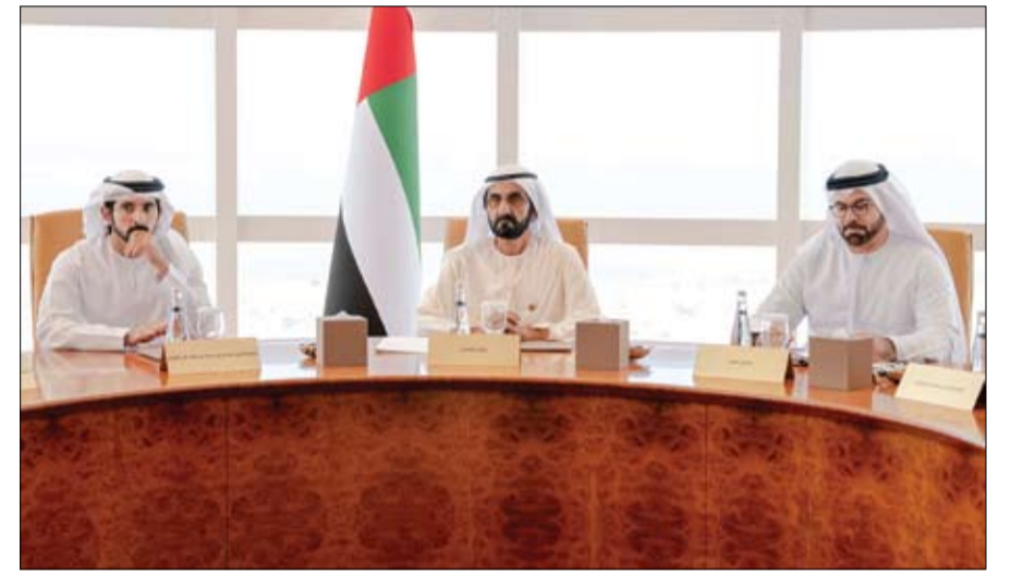
محمد بن راشد خلال ترؤسه الاجتماع الأول لمجلس دبي

أعلن الجيش الليبي، أمس الثلاثاء، أن قواته تقدمت إلى ما بعد مدينة سرت، للسيطرة على مواقع جديدة، وأكدت شعبة الإعلام الحربي التابعة للقيادة العامة للقوات المسلحة الليبية على فيسبوك، أن الوحدات العسكرية تتقدم إلى ما بعد مدينة سرت وتسيطر على مواقع جديدة غرب المدينة. من جهته، أعلن رئيس أركان القوات البحرية الليبية، فرج المهدي، بدء تقدم قوات الجيش الليبي نحو مدينة مصراتة التي تسيطر عليها أقوى الميليشيات المسلحة التابعة للوفاق وأكثرها عدداً، وذلك بعد سيطرته، أمس الأول الاثنين، بالكامل على مدينة سرت الاستراتيجية. سياسياً، أكدت المتحدثة باسم الرئاسة التونسية رشيدة التيفر أمس الثلاثاء أن بلادها ترفض