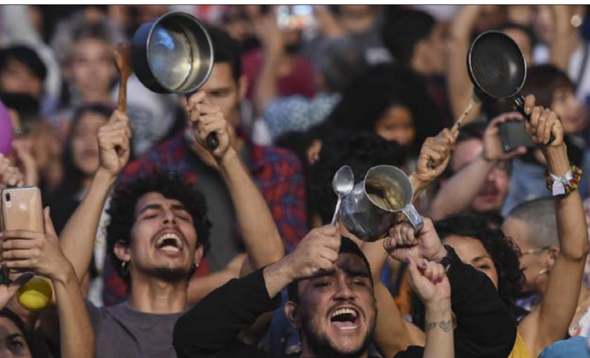
قرع الاواني احتجاجا