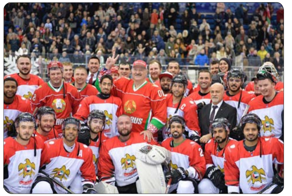
منتخبنا الوطني لهوكي الجليد يواجه فنلندا اليوم على برونزية كأس رئيس بيلاروسيا