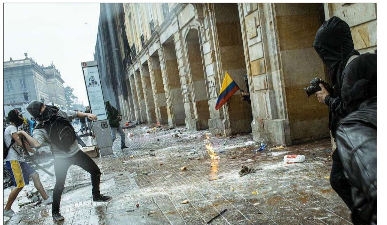
مظاهرات ضد اصلاحات الرئيس