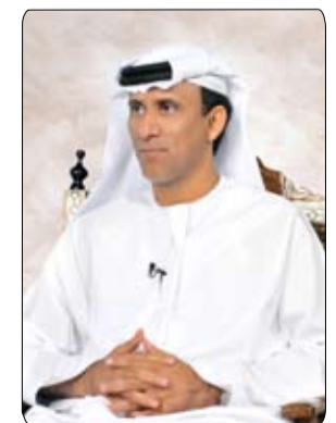
القيروان - و.ام:

انتظم منتخبنا الوطني للجودو للفئات العمرية للشباب في معسكره الحالي بمدينة القيروان التونسية عقب وصوله إلى هناك أول مرة من أواخر الشهر الماضي، وذلك استعداداً للاستحقاقات العربية والخليجية والآسيوية المقبلة. وشهد التدريب الأول الذي جرى بصالة القيروان الرياضية على فترتين صباحية ومسائية بمشاركة منتخب تونس للناشئين حماساً كبيراً من لاعبي المنتخبين، استعداداً لبطولة العربية التي ستقام في دولة الكويت خلال الفترة من 29 يناير الحالي وحتى الثاني من فبراير المقبل، على مستوى الأبطال والناشئين والشباب، وضمت بعثة منتخبنا