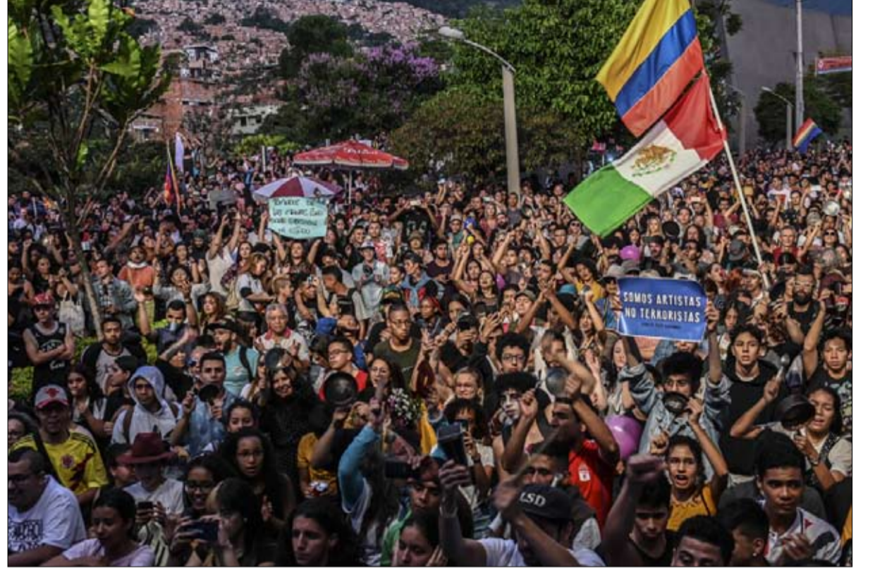
حراك يترجم تحولا اجتماعيا

في مجال حقوق الإنسان، في هذه الاحتجاجات، تغييرا بين الأجيال يحدث بشكل رئيسي بفضل نهاية النزاع المسلح، المجتمع الكولومبي في عملية اجتماعية، وفي تحول كبير، والدليل هو هذا الحراك الشعبي غير المسبوق.