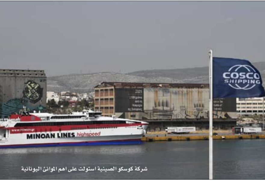
شركة كوسكو الصينية استولت على أهم الموانئ اليونانية