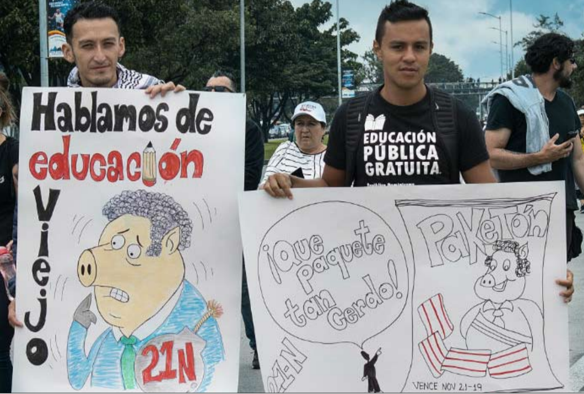
حراك ضم كل الشرائح والأجيال