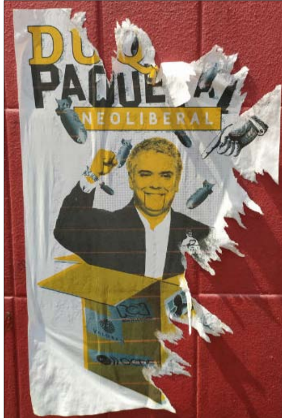
انتفاضة ضد الإجراءات النيولبرالية

ولإخضاع المقاتلين اليساريين، اعتمد أوريبى بشدة على هذه القوة الموازية الإضافية "التي اعتادت أن تنشر الرعب وتحجب الشكوك حول مسؤولية القوات المسلحة في انتهاك حقوق الإنسان أثناء النزاع"، تدين منظمة العفو الدولية. وهي جماعات