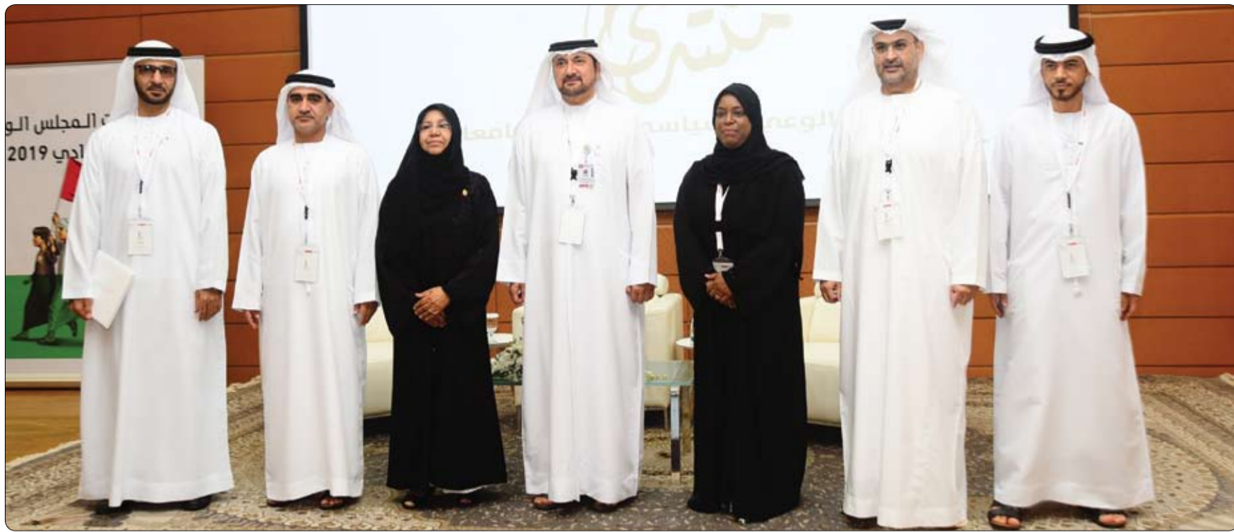
بهدف تعزيز مشاركة الشباب في العملية الانتخابية