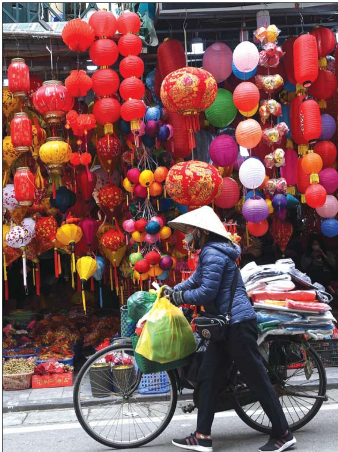
بائعة متجولة تدفع دراجتها عبر متجر يبيع الزينة في هانوي، قبل رأس السنة القمرية الجديدة. ا ف ب