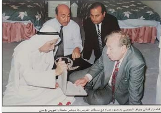
د. محمد بن زايد آل نهيان و سلطان العويس مع مجلس سلطان العويس في دبي

أولها العفوية، وثانها الصدق، وثالثها البساطة، ورابعها الوضوح، وخامسها المرافقة بصحرائها وشواطئها ورياضها وبوحها. فيأتي شعر سلطان العويس نسيجا فهو يحسن توظيف النبرة الشعرية الهادئة، مع إضفاء البساطة والشفافية على حركة المعاني ذات الدلالة المباشرة، التي لا تحتاج إلى إغواء التأويل، أو شغف الكشف، أو تعقيد المعنى، أو ارتياب المتاهات، وهذه العناصر عينها لا تتردد، وهي تجوب بساتين التراث وبواديه وفيافييه قفاره، وأزاهيره ورياضه، لتقطف الثمار ناضجة يانعة من الجزيرة العربية إلى بلاد الشام، وإلى أرض الرافدين، وإلى مصر