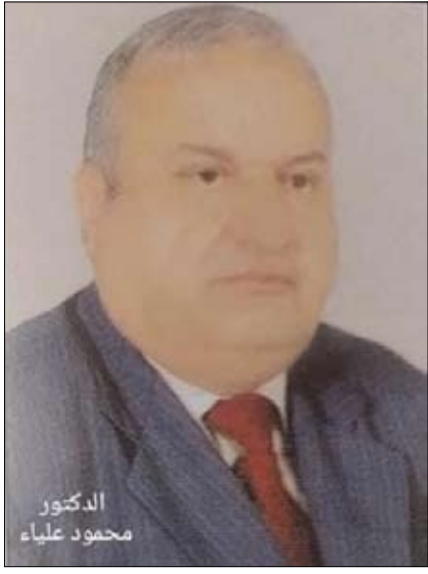
الدكتور محمود علياء

يوم الثلاثاء الماضي في الرابع من يناير مرت الذكرى الثانية والعشرين لوفاة الشاعر الكبير سلطان بن علي العويس والذي لا يزال حياً بيننا بآثاره وإنجازته وإبداعاته. ولا بد من التوقف في هذه الذكرى في رحاب شعره وإبداعه ومآثره التي لا تزال تضيء مشاعل الثقافة والفكر والإبداع، ليس في دولة الإمارات العربية المتحدة وحسب وإنما في العالم العربي قاطبة حيث يتوالى الإبداع المتواصل للفنانين بجوائزهم الأدبية سواء المحلية منها أو العربية تترى لرفد الفكر العربي والثقافة العربية والإبداع العربي بالمزيد والمزيد من العطاء يوماً بعد يوم.