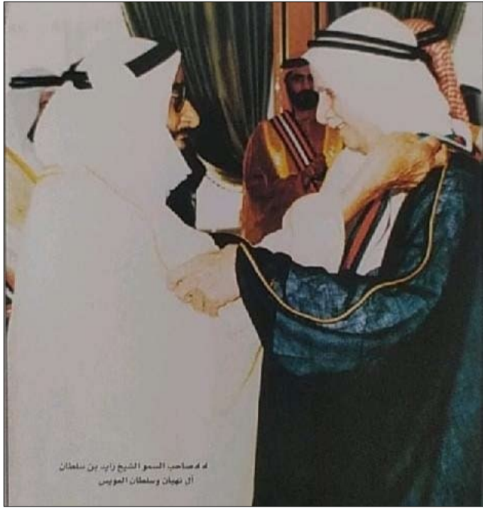
د. صاحب السمو الشيخ زايد بن سلطان آل نهيان و سلطان العويس