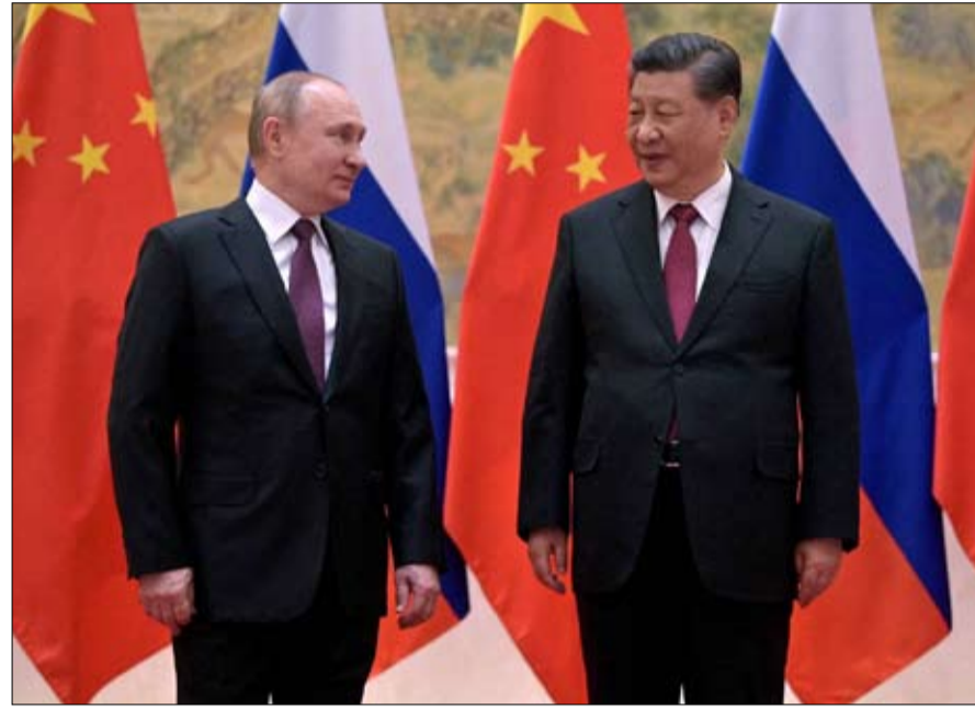
القريب منك بعيداً...