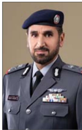
على الصعيد العالمي في مجال دعم المرأة وتمنحها المكانة التي تستحقها في المجتمع، إيماناً من القيادة الرشيدة بدورها وتأهيلها لتصبح قادرة على إشغال أعلى المناصب، منذ عهد المغفور له مؤسس الدولة الشيخ زايد بن سلطان آل نهيان /طيب الله ثراه/ إلى يومنا هذا".

استحقها في المجتمع، إيماناً من القيادة الرشيدة بدورها وتأهيلها لتصبح قادرة على إشغال أعلى المناصب، منذ عهد المغفور له مؤسس الدولة الشيخ زايد بن سلطان آل نهيان /طيب الله ثراه/ إلى يومنا هذا".