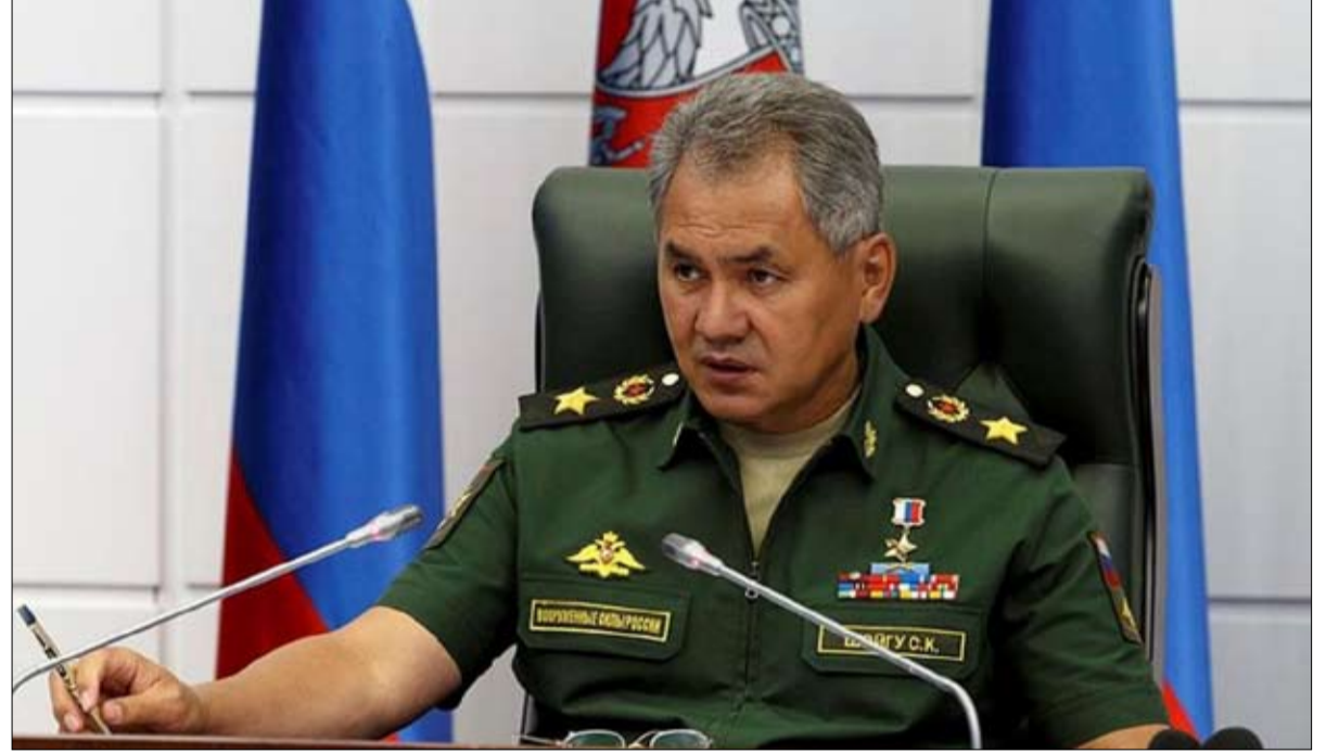
سيرغي شويغو يستمد رتبته وميدا لياته من مآثر جيشه