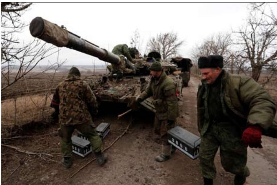
الحرب في أوكرانيا اربكت الصين

تبنت الجمعية العامة للأمم المتحدة، الأربعاء، 2 مارس، قراراً يطالب روسيا بالتوقف فوراً عن استخدام القوة ضد أوكرانيا".