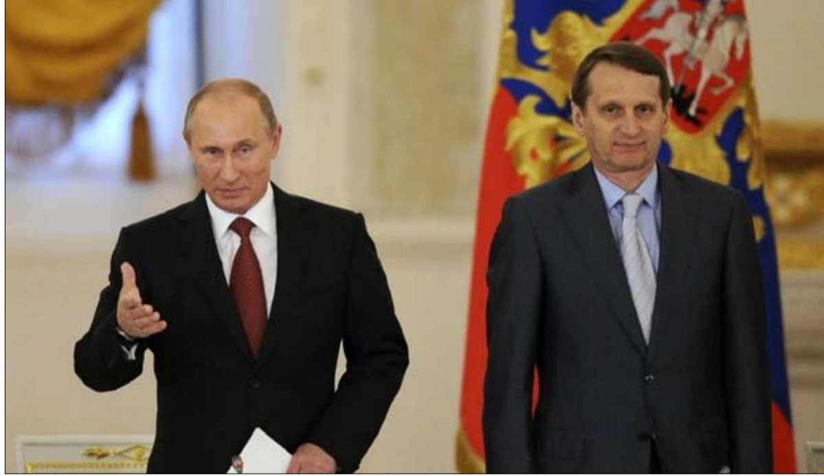
سيرغي ناريشكين تعرّف على بوتين في الكي جي بي

أتهمت وزارة الدفاع الأميركية (البنتاغون) روسيا بتجنيد مرتزقة سوريين وأجانب آخرين للقتال في أوكرانيا حيث يواجه غزو الجيش الروسي لهذا البلد مقاومة شرسة. وفي نيويورك أعربت الأمم المتحدة والصين عن قلقهما من استقدام مزيد من المقاتلين إلى أوكرانيا، لكن دون أن ينتقد أي منهما بصورة مباشرة روسيا. وتشارك موسكو في النزاع بسوريا منذ 2015 إلى جانب نظام الرئيس بشار الأسد، ويشهد هذا البلد قتالا داخل المدن منذ أكثر من عقد. وقال جون كيربي المتحدث باسم البنتاغون للصحافيين "تعتقد أن المعلومات التي تقيدهم بأنهم (الروس) يجنّدون مقاتلين سوريين لتعزيز قواتهم في أوكرانيا صحيحة". وأضاف "من المثير للاهتمام أن يكون بوتين مضطراً