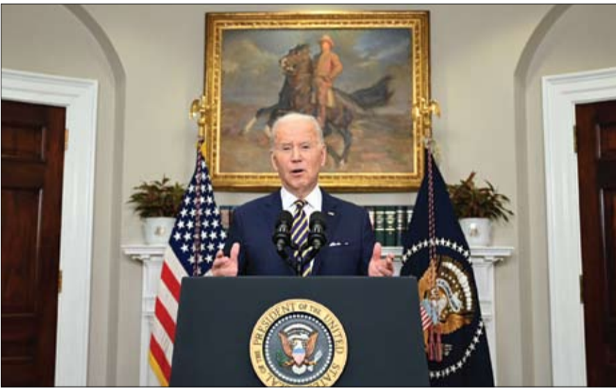
الرئيس الأمريكي يعلن أن النفط والغاز الروسيين لن يصلا مجدداً إلى الولايات المتحدة (رويترز)

وسط ذروة التوتر الروسي الغربي، وفيما تدخل العملية العسكرية الروسية على الأراضي الأوكرانية أسبوعها الثاني، طلب رئيس الأركان الأميركي الجنرال مارك ميلي من القوات الأميركية المتمركزة في أوروبا إبداء تصميمها على منع اندلاع حرب بين قوى عظمى. وقال ميلي الذي يجري جولة في أوروبا للتأكيد على عزم بلاده الدفاع عن الجناح الشرقي لحلف شمال الأطلسي بمواجهة الهجوم الروسي، للجند الأميركيين المنتشرين في قاعدة جوية قرب كونستانتسا في جنوب رومانيا علينا التأكد من قدرتنا على الاستجابة السريعة، وإظهار قوتنا وتصميمنا ودعمنا للحلف لمنع أي عدوان إضماره من الروس ومنع اندلاع حرب بين القوى العظمى. كما أضاف: منذ 1914، منذ بداية الحرب العالمية الأولى وحتى العام 1945، أي نهاية الحرب العالمية الثانية، قتل 150 مليون شخص.. لا نريد أن