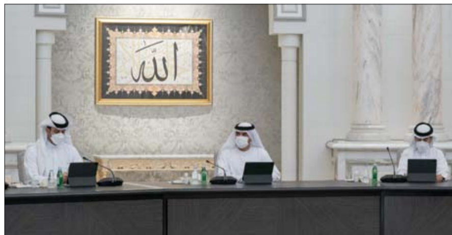
إمارة الشارقة. وتفيداً لتوجيهات صاحب السمو

جرى خلال الاجتماع مناقشة الموضوعات الحكومية المتنوعة، التي يسعى المجلس من خلالها إلى تطوير سير العمل الحكومي والارتقاء بكفاءة القطاعات في