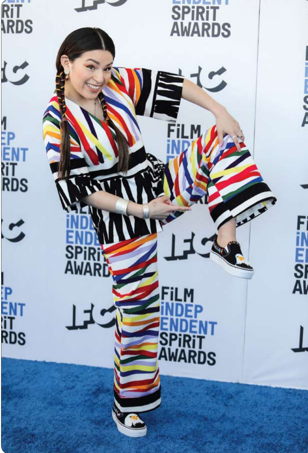
بولينا ألكسيس لدى وصولها إلى حفل توزيع جوائز إنديبندنت سبيريتر فيلم السابع والثلاثين في سانتا مونيكا، كاليفورنيا.

بين أجناب ومواطنين محليين، كان سباق مميّز ومختلف للحمير جرى في مدينة سار بالبحرين غربي المنامة، حضره الكثيرون. وتقام المسابقة منذ أكثر من 40 عاماً. بين شهري ديسمبر- كانون الأول ومارس- آذار، في طقس يصبح أكثر لطفاً للحيوانات، ومناسباً وملائماً لطبيعتها. وتعد المسابقة أحد أشكال التسليه والترفيه لشباب القرى، ممن يملكون حميرا ويرونها ويدربونها على تلك المسابقة، وهو أمر يستلزم رعاية جيدة، واهتماماً خاصاً، وطعاماً صحياً.