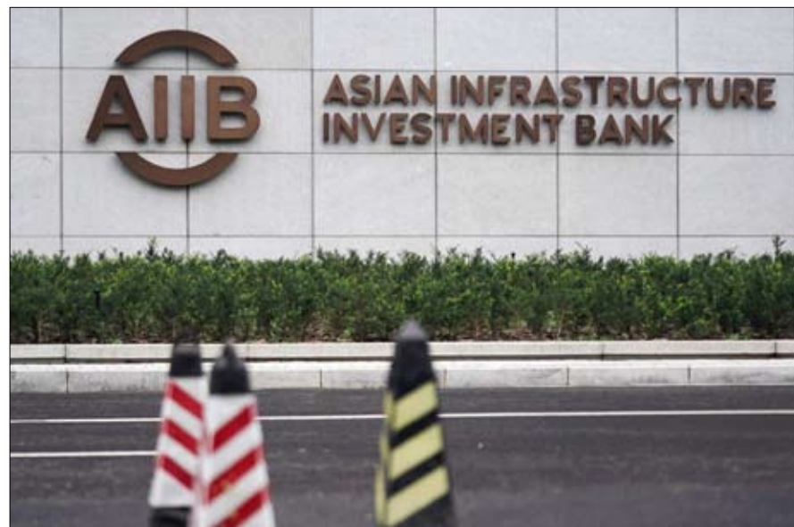
أعلن البنك الآسيوي للاستثمار في البنية التحتية، أن جميع أنشطته مع روسيا مجمدة