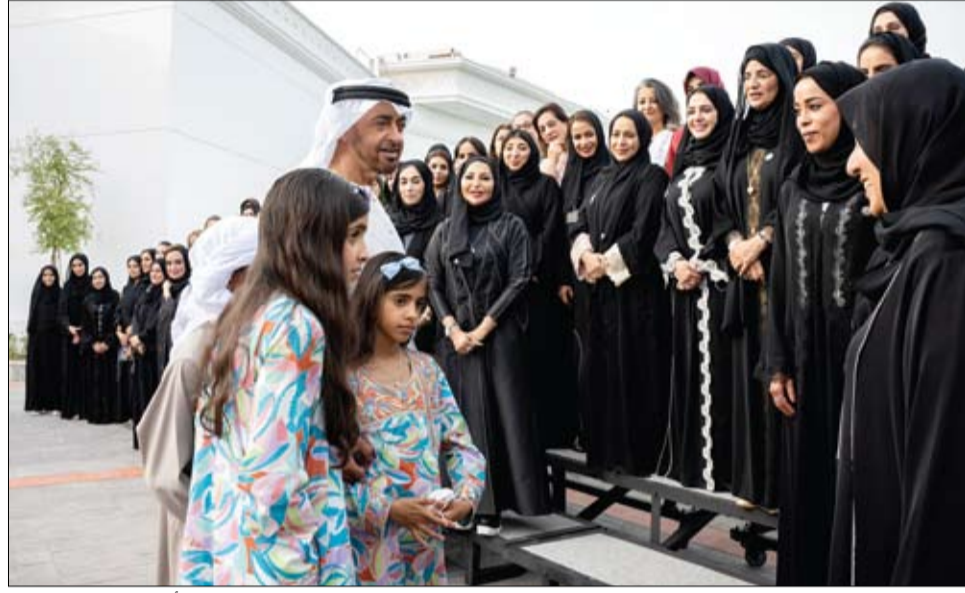
محمد بن زايد خلال استقباله مجموعة من بنات الإمارات بمناسبة اليوم الدولي للمرأة

هنأت المرأة الإماراتية ونساء العالم بمناسبة يوم المرأة العالمي فاطمة بنت مبارك، تحقيق النجاحات هو ما عاهدناه من بنات زايد المخلصات •• أبوظبي-وام: هنأت سمو الشيخة فاطمة بنت مبارك رئيسة الاتحاد النسائي العام رئيسة المجلس الأعلى للأمومة والطفولة الرئيسة الأعلى مؤسسة التنمية الأسرية «أم الإمارات»، المرأة الإماراتية وجميع نساء العالم بمناسبة يوم المرأة العالمي الذي يصادف الثامن من شهر مارس من كل عام، متمنية لهن مزيداً من التفوق والنجاح والريادة. وقالت سموها: تثبت المرأة يوماً بعد يوم، أنه لا مستحيل مع العمل والاجتهاد بروح يملؤها الإبداع والأمل لصياغة مستقبل أكثر ازدهاراً، بفضل دعم وتشجيع القيادة الرشيدة.. وبمناسبة اليوم العالمي للمرأة، يسرني القول بأن تحقيق النجاحات هو ما عاهدناه من بنات زايد المخلصات.. كلنا ثقة في قدرتنا على مضاعفة الإنجاز والحفاظ على مكتسبات الوطن ومقدراته، التي تدفعنا جميعاً لبذل مزيداً من العطاء سعيًا لرفعة وطننا الحبيب في الخمسين عاماً الجديدة من عمر الدولة بإذن الله.