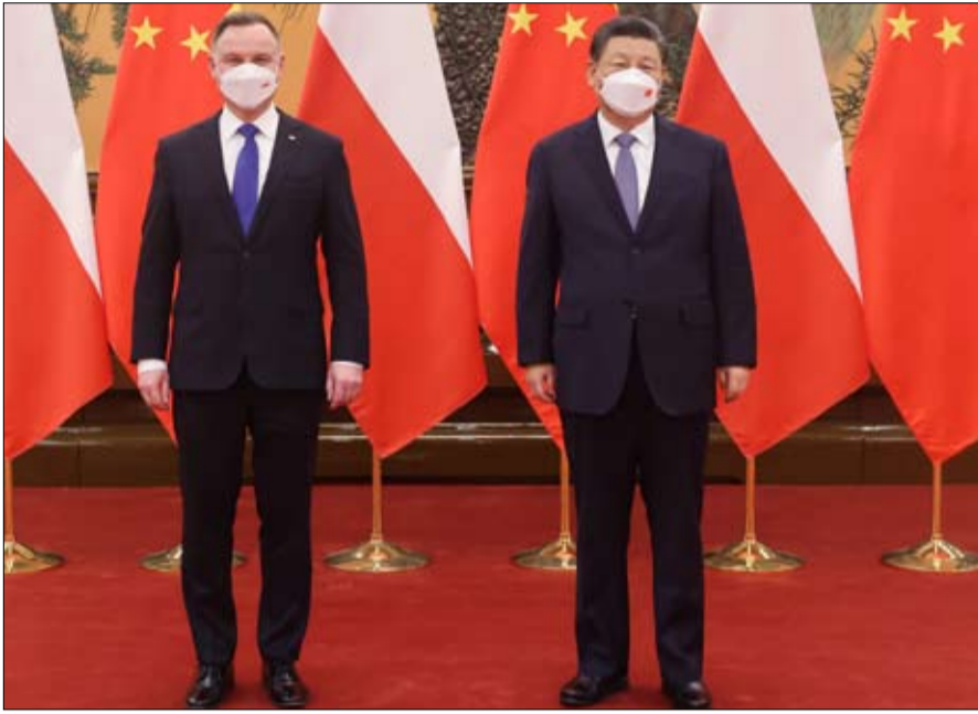
شي جين بينغ وأندريه دودا... الحزام والطريق يتعثر

في تصويت وافقت عليه بأغلبية ساحقة 141 دولة من أصل 193 عضواً في المنظمة. صوتت خمس دول فقط ضده، من غير المستغرب، روسيا، وكذلك بيلاروسيا وكوريا الشمالية وإريتريا وسوريا. وامتدت 35 دولة، منها الصين، عن التصويت. عشية هذا التصويت، قال السفير الصيني لدى الأمم المتحدة، تشانغ جون، مسبقاً: "يجب أن تكون أوكرانيا بمثابة جسر بين الشرق والغرب بدلاً من أن تكون ساحة معركة لسائل جيوسياسية". وأضاف بصراحة غير عادية على لسان دبلوماسي صيني بارز، الوضع في أوكرانيا شيء "لا تريد الصين رؤيته، وليس في مصلحة أي من الأطراف المعنية" رسالة تستهدف بشكل ضمني سيد الكرملين.