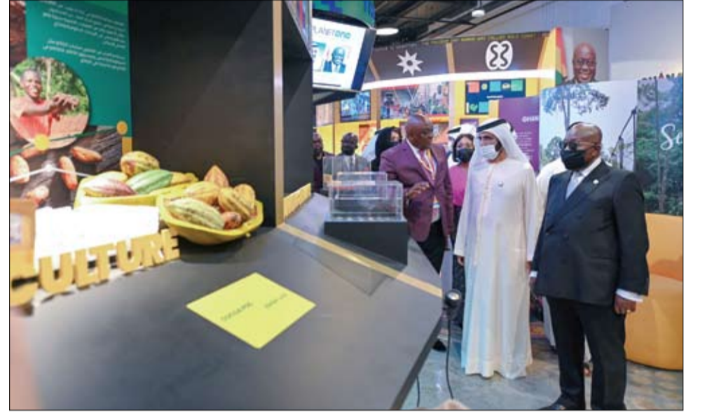
محمد بن راشد خلال لقائه رئيس جمهورية غانا، في جناح بلاده في معرض إكسبو 2020 دبي

•• أبوظبي-وام: الإسهام في بناء أوطاننا.. مشيراً إلى أن المرأة تحظى بمكانة وتقدير كبيرين في دولة الإمارات. وقال سموه، خلال استقباله مس مجموعات نسائية تمثل العديد من الجهات في الدولة في قصر البحر - إن تقدير دور المرأة المحوري في تنشئة أجيال صالحة وواعية قادرة على التعامل مع مختلف التحديات المستقبلية وتجاوزها