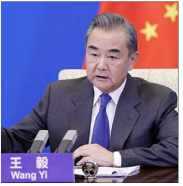
وزير الخارجية الصيني ذهب بعيداً في موقفه

الصين تريد أوكرانيا، جسرا بين الشرق والغرب وليس ساحة معركة