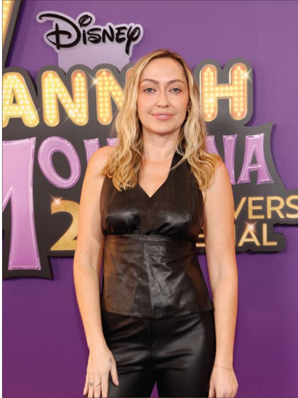
المثلة الأمريكية براندي سايبوس الذي حضورها العرض العالمي الأول لفيلم "هانا مونتان" من إنتاج ديزني، في مسرح إل كابيتان في هوليوود.