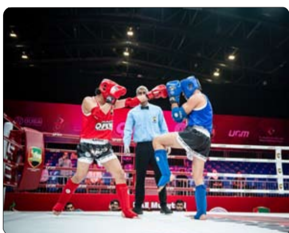
المواي تاي والكيك بوكسينج، والأمين العام للاتحاد العربي للمواي تاي، إن تنظيم البطولة

يمثل محطة مهمة في الخطط الداعمة لتطوير قاعدة اللعبة، والعمل على رفع مسيرتها بالأنشطة والمسابقات، التي تسهم بإضافة المزيد من الخبرات والتجارب لتنمية مهارات اللاعبين والمواهب الواعدة. وأضاف المهيري: تقام البطولة وفقاً لاجندة الاتحاد و ترجمة لتوجهات سعادة عبدالله سعيد النسيدي رئيس الاتحاد الآسيوي والعربي للمواي تاي رئيس اتحاد الإمارات للمواي تاي والكيك بوكسينج، وحرصه واهتمامه الكبيرين، لوضع الخطط النموذجية والبطولات والبرامج المتقدمة.