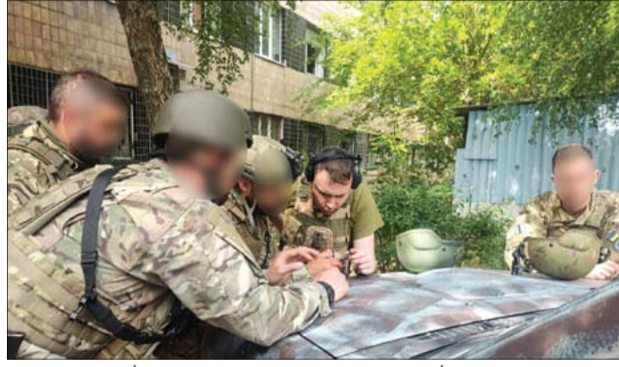
رئيس المخابرات العسكرية الأوكرانية في مهمة مع إخوانه في السلاح في أوكرانيا.

إسكندر-إم، وأطلقت 20 طائرة بدون طيار من طراز شاهد. وولفت إلى أن القوات الروسية شنت أيضا 52 غارة جوية وقصفت أراضي أوكرانية 50 مرة باستخدام أنظمة صواريخ متعددة الإطلاق على مواقع عسكرية هناك. وفشلت القوات الروسية هجمات على أوكرانيا، إذ شنت غارة جوية وهجوما صاروخيا باستخدام صواريخ كروز من طراز كاليب وصاروخ باليستي من طراز العسكرية هناك. وأضافت خلال الليلة قبل الماضية، فشلت القوات الروسية هجمات على أوكرانيا، إذ شنت غارة جوية وهجوما صاروخيا باستخدام صواريخ كروز من طراز كاليب وصاروخ باليستي من طراز العسكرية هناك. وفشلت القوات الروسية هجمات على أوكرانيا، إذ شنت غارة جوية وهجوما صاروخيا باستخدام صواريخ كروز من طراز كاليب وصاروخ باليستي من طراز العسكرية هناك. وفشلت القوات الروسية هجمات على أوكرانيا، إذ شنت غارة جوية وهجوما صاروخيا باستخدام صواريخ كروز من طراز كاليب وصاروخ باليستي من طراز العسكرية هناك.