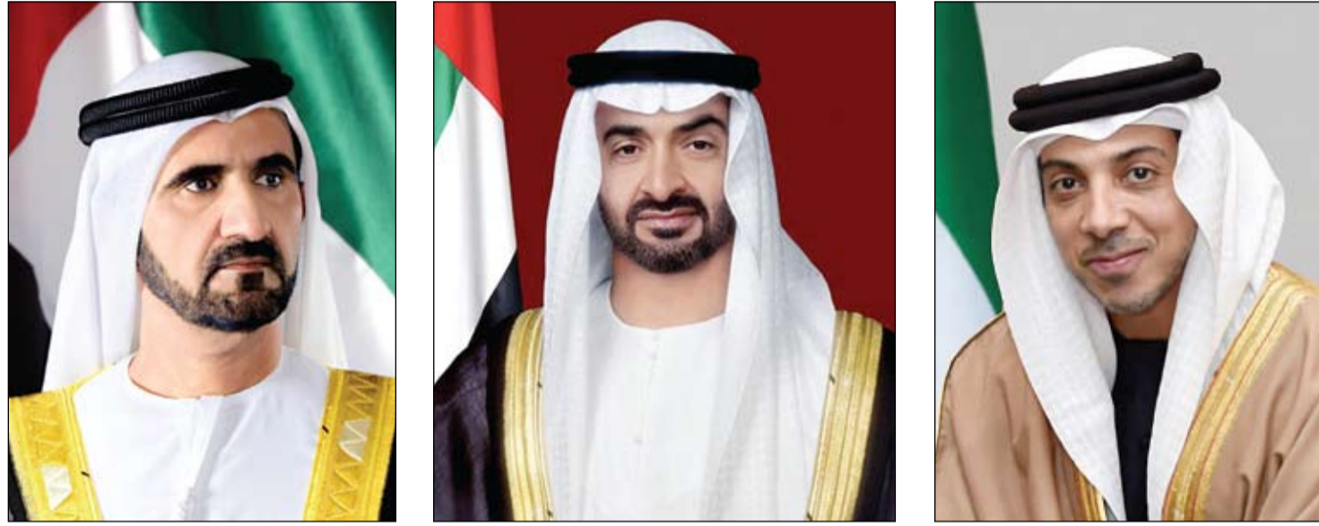
هناؤا الرئيس الفرنسي بذكرى اليوم الوطني لبلاده