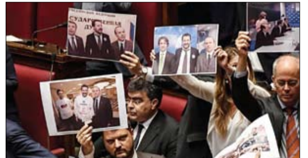
احتجاجات داخل البرلمان على القضية

• واشنطن-وكالات: أورتاغوس، أمس الأربعاء، إن واشنطن لم تتلق رسالة خاصة بشأن نية الإيرانيين للتفاوض حول البرنامج النووي. وأضافت أورتاغوس في مقابلة مع سكاى نيوز عربية، أنه ما من خيار أمام الإيرانيين سوى التفاوض، والا فإنهم سيظلون تحت العقوبات التي جرى فرضها. وفي مايو 2018، انسحبت واشنطن من الاتفاق النووي وأعادت فرض عقوبات صارمة على طهران، حتى تجلس مجدداً إلى طاولة المفاوضات وتباحث بشأن اتفاق جديد. وتأجج التوتر في منطقة الشرق الأوسط خلال الآونة الأخيرة، حيث سعت طهران إلى إرباك حركة الملاحة رداً على حظر الولايات المتحدة لاستيراد النفط الإيراني، لكن أورتاغوس أكدت أن واشنطن لن تسامح مع التهديدات الإيرانية في مضيق هرمز. فرضت الولايات المتحدة قيوداً صارمة على حركة أكثر من عشرة من الدبلوماسيين الإيرانيين وأسرهم الذين يعيشون في نيويورك، وفقاً لندكرة دبلوماسية أميركية أرسلت إلى البعثة الإيرانية للأمم المتحدة. وسيخضع الدبلوماسيون لنفس القيود التي فرضتها الولايات المتحدة على وزير الخارجية الإيراني محمد جواد ظريف، الذي وصل يوم الأحد وسط توترات متزايدة بين البلدين. وسيتاح لهم فقط التنقل بين الأمم المتحدة وبعثة طهران للمنظمة الدولية ومقر سفير إيران لدى الأمم المتحدة ومطار جون كينيدي. ولم يتضح بعد سبب ذلك. قالت المتحدث باسم الخارجية الأميركية، مورغان