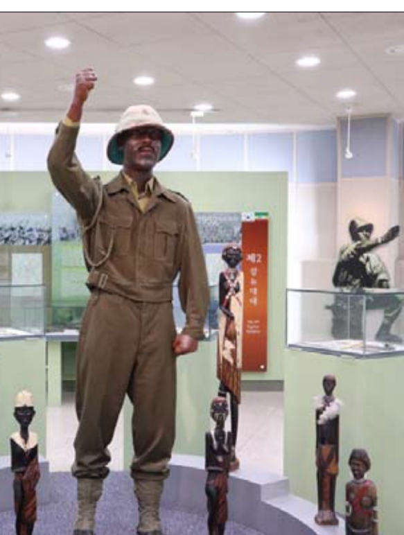
مجسمات داخل المتحف