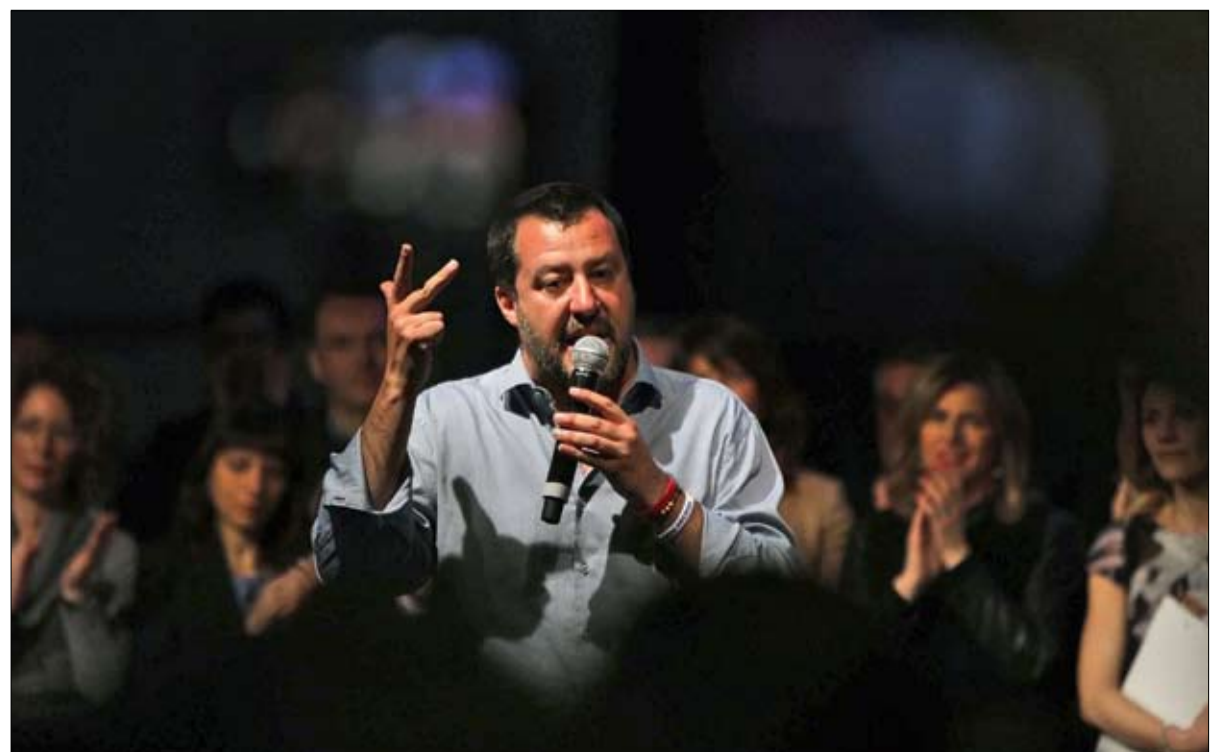
سالفيني ينفي التهمة عن حزبه