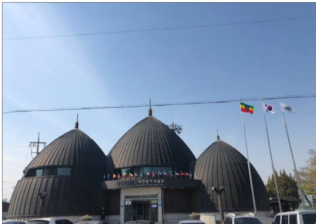
البناء التذكاري لقدامى المحاربين الإثيوبيين في الحرب الكورية