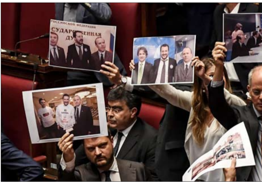
احتجاجات داخل البرلمان على الفضيحة

وتزاد هذه القضية إحراجاً حيث تُذكر بمقطع الفيديو الذي تم تصويره بكاميرا خفية تضمن استعداد القومي النمساوي هاينز كريستيان ستراش لتقديم تنازلات مقابل الحصول على تمويل روسي.. وكان عليه الاستقالة في مايو الماضي.