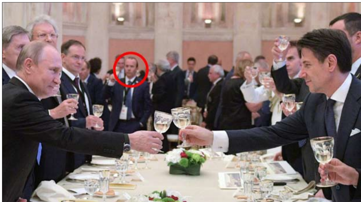
تمت دعوة سافونيني إلى العشاء الذي أقيم خلال زيارة بوتين لروما