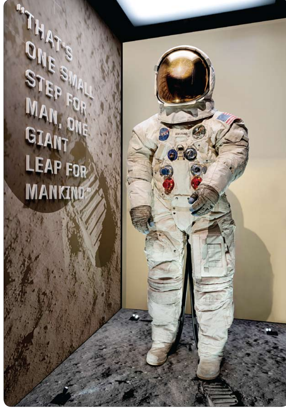
عرض بدلة نيل أرمسترونغ التي كان يرتديها للمشي على سطح القمر في 20 يوليو 1969 في المتحف الوطني للطيران والفضاء بواشنطن.

قال الجيش الأميركي إنه سيبدأ تنفيذ اختبارات للمركبات العسكرية الروبوتية التي يمتلكها في مناورات بالذخيرة الحية، العام المقبل. وذكر موقع "ذا فيرج" التقني، أن المركبات الهجومية الجديدة، جرى تصميمها بناء على تصميم ناقلة الجند التقليدية "إم 113"، وستكون المركبة الروبوتية مزودة بكاميرات متطورة وينظم تحكم، هذا إلى جانب شاشات تعمل باللمس، علما أنه سيتم اختبار المركبات الجديدة في مارس المقبل، بولاية كولورادو الأميركية.