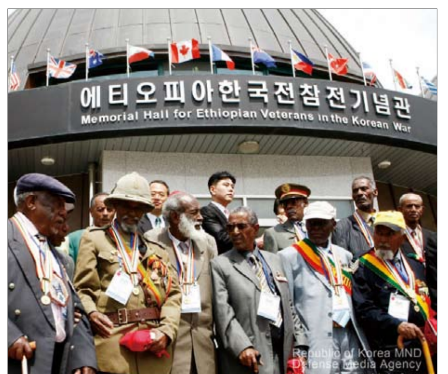
مجموعة من قدامى المحاربين الإثيوبيين أمام المتحف المخصص لهم