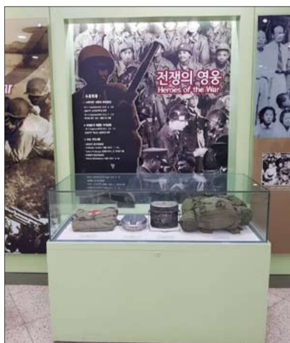
تخليداً للجنود الإثيوبيين

شاركوا في 253 معركة ولم يهزموا، ومات منهم 121 جندياً وأصيب حوالي 500، لكنهم لم يستسلموا أبداً