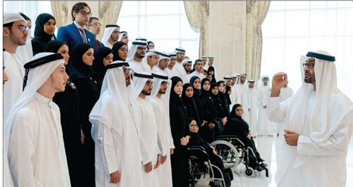
محمد بن زايد يخاطب أبناءه من الطلبة المتفوقين (وام)

• القاهرة - وأم: قرر مجلس وزراء الإعلام العرب في ختام اجتماعاته دورته الخمسين في مقر الجامعة العربية بالقاهرة أمس والذي انعقد برئاسة المملكة العربية السعودية اختيار دبي عاصمة للإعلام العربي لعام 2020 وذلك تأكيداً على الدور المهم لدولة الإمارات كحاضنة للإعلام العربي والدولي، وتقديراً للمكانة الإعلامية المتميزة لدبي. وقال معالي الدكتور سلطان بن أحمد الجابر وزير دولة رئيس المجلس الوطني للإعلام، خلال ترؤسه وفد الدولة المشارك في مجلس وزراء الإعلام العرب: تتقدم بالتهنئة إلى صاحب السمو الشيخ خليفة بن زايد آل نهيان رئيس الدولة حفظه الله، وإلى صاحب السمو الشيخ محمد بن راشد آل مكتوم نائب رئيس الدولة رئيس مجلس الوزراء حاكم دبي رعاه الله، وصاحب السمو الشيخ محمد بن زايد آل نهيان ولي عهد أبوظبي نائب القائد الأعلى للقوات المسلحة، بمناسبة اختيار دبي عاصمة للإعلام العربي لعام 2020. (التفاصيل ص 3)