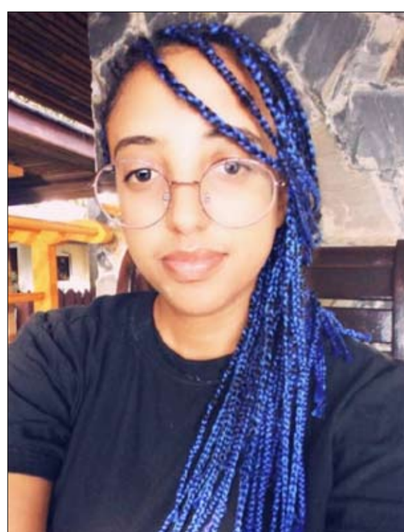
زارت بيثيل البلاد بعيون وذكريات جدها الذي شارك في الحرب الكورية