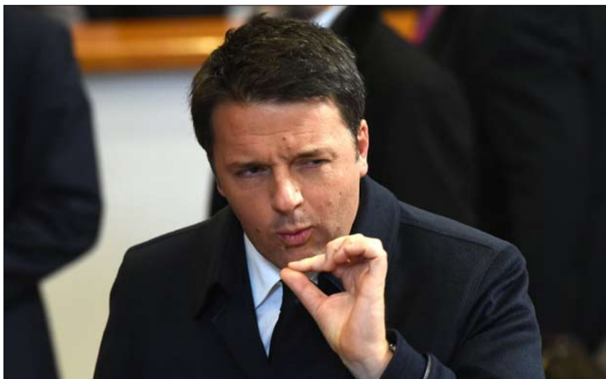
ماتيو رينزي: انها الخيانة