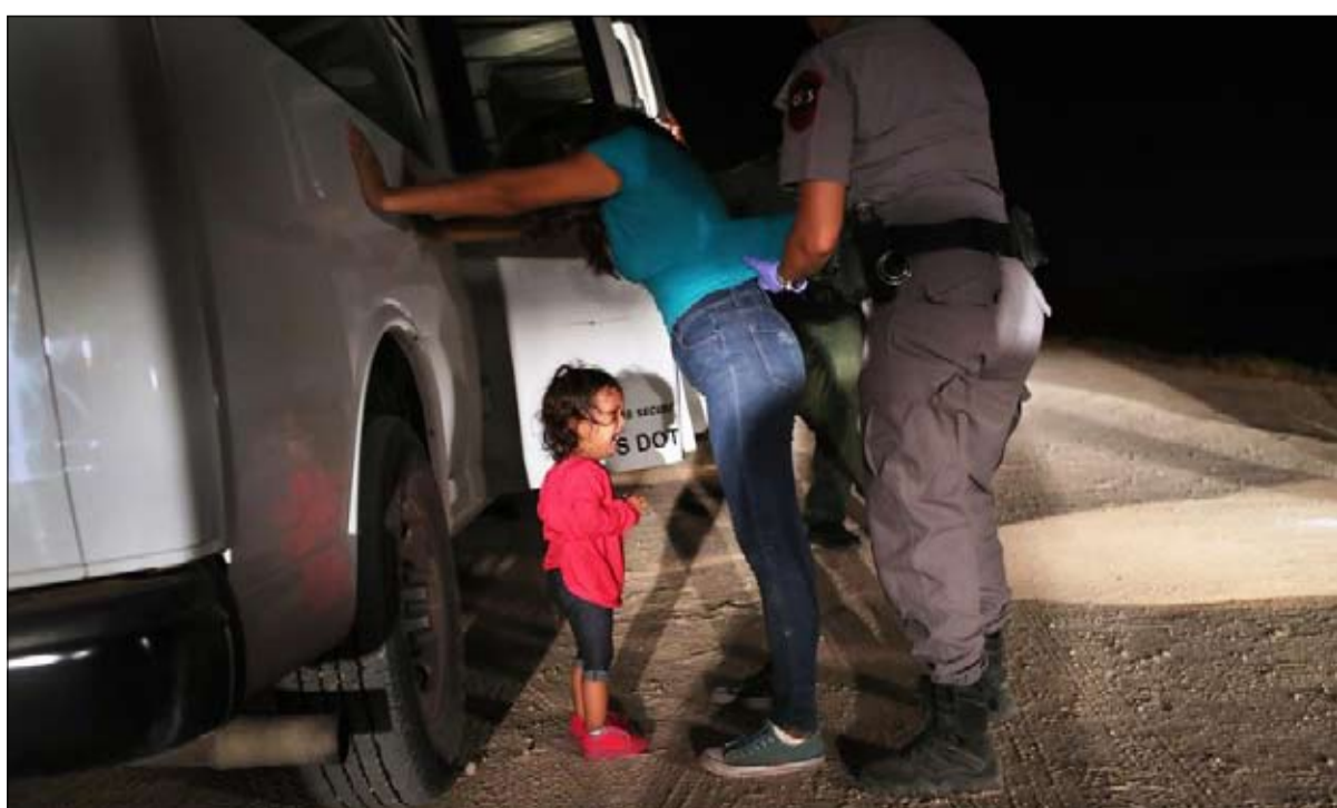
لا تسامح مع المهاجرين

استنكر قادة القطاعات التجارية والتكنولوجيات الجديدة هذا القرار الذي، من الناحية الاقتصادية، لا معنى له