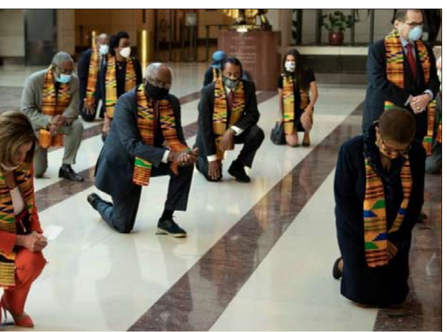
تعددت الحركات المناهضة للعنصرية