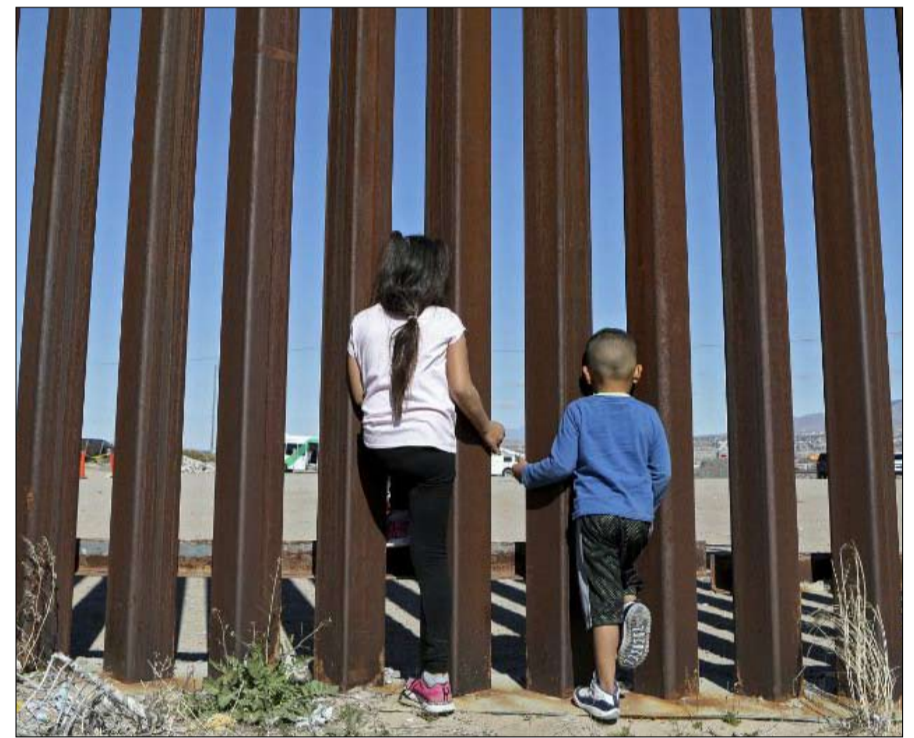
على الحدود بين المكسيك والولايات المتحدة بالقرب من سيوداد خواريز

قبل مسؤولي الهجرة، في أي مكان في البلاد، اعتباراً من 14 أغسطس القادم.