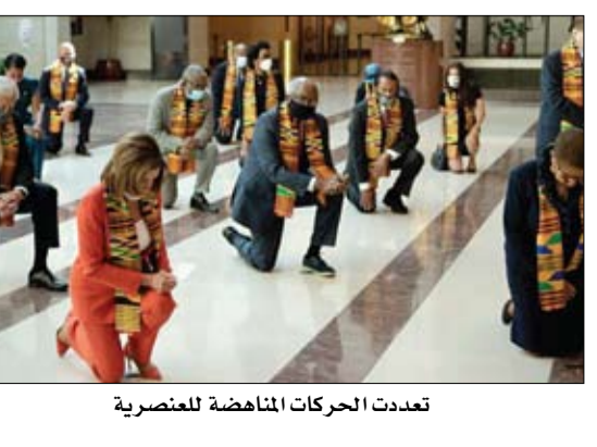
تعددت الحركات المناهضة للعنصرية

باتتهاك القوانين وتغييرها: أمريكا ترامب تعلق أبوابها أمام جميع أشكال الهجرة! الفجر - إلورا موخرجي - ترجمة خيرة الشيباني الاثنين 22 يونيو، وقع دونالد ترامب على مرسوم رئاسي للحد من الهجرة إلى الولايات المتحدة حتى نهاية عام 2020. هذه المرة، يشمل هدفه الأشخاص المؤهلين للحصول على تأشيرات H-1B - وهم من المهارات وأصحاب الشهادات الجامعية العليا وغالباً ما يعملون في مجالات الرياضيات أو الهندسة أو التقنيات الجديدة أو الطب والذين يسدون الفجوات الحرجة في سوق العمل الأمريكية. يعد النص الحظر المفروض على إصدار البطاقات الخضراء خارج الولايات المتحدة ويحظر دخول الكوادر الأجنبية العاملين في الشركات الأمريكية القيمة في دول أخرى. (التفاصيل ص11)