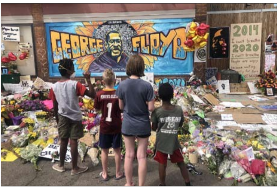
جريمة فحرت التناقضات