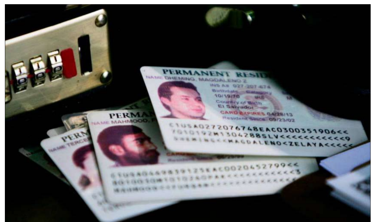
سيتم تعليق إصدار التأشيرات الدائمة