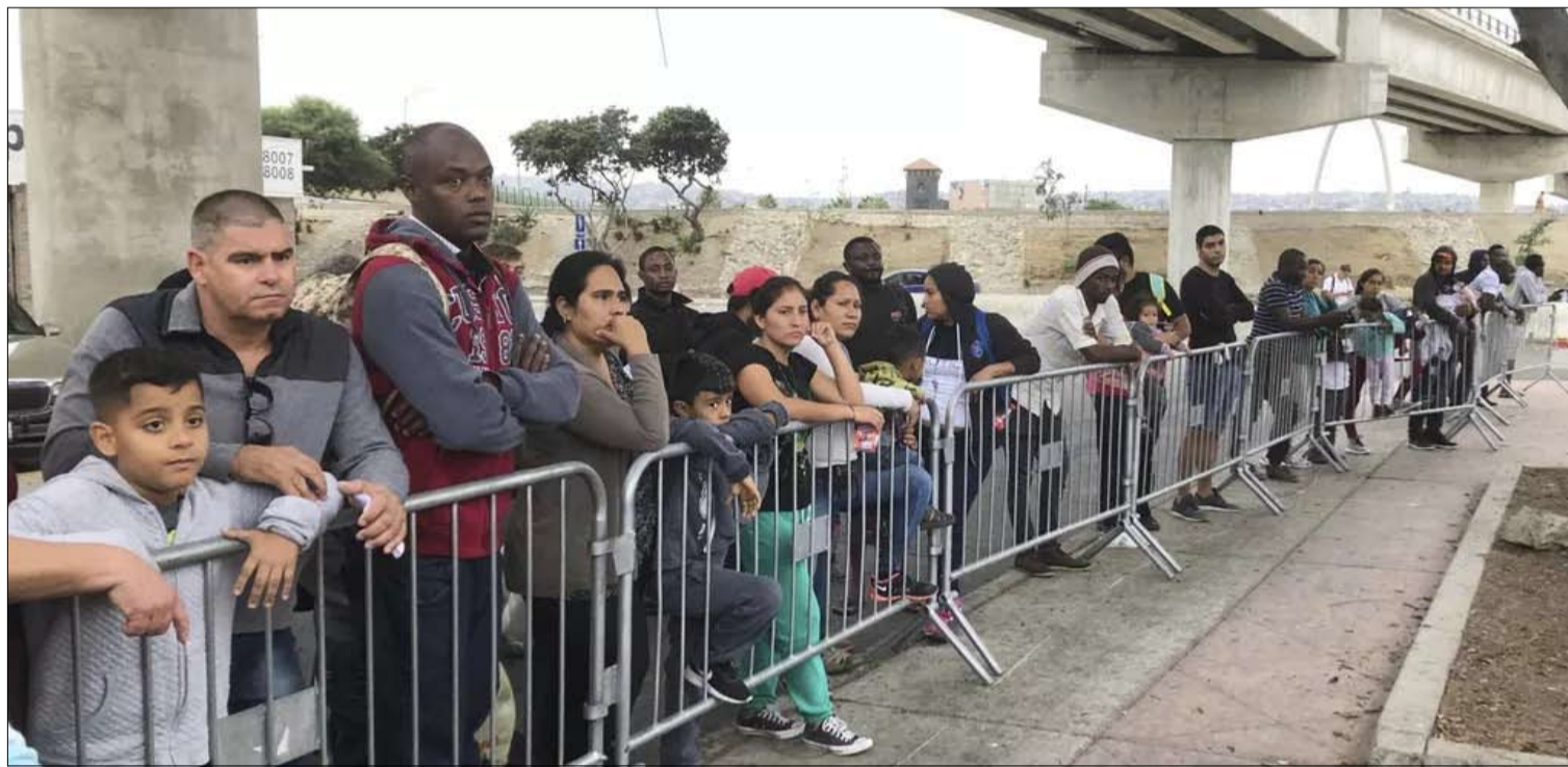
اللجوء بات صعباً للولايات المتحدة