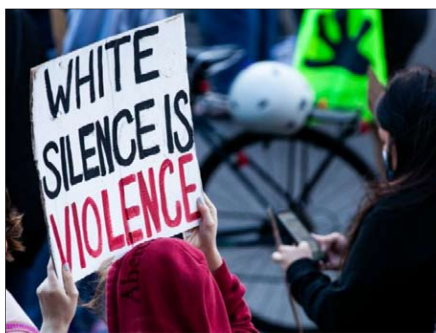
ملصق يحمل رسالة "الصمت الأبيض عنف، في مظاهرة مناهضة للعنصرية في شيكاغو