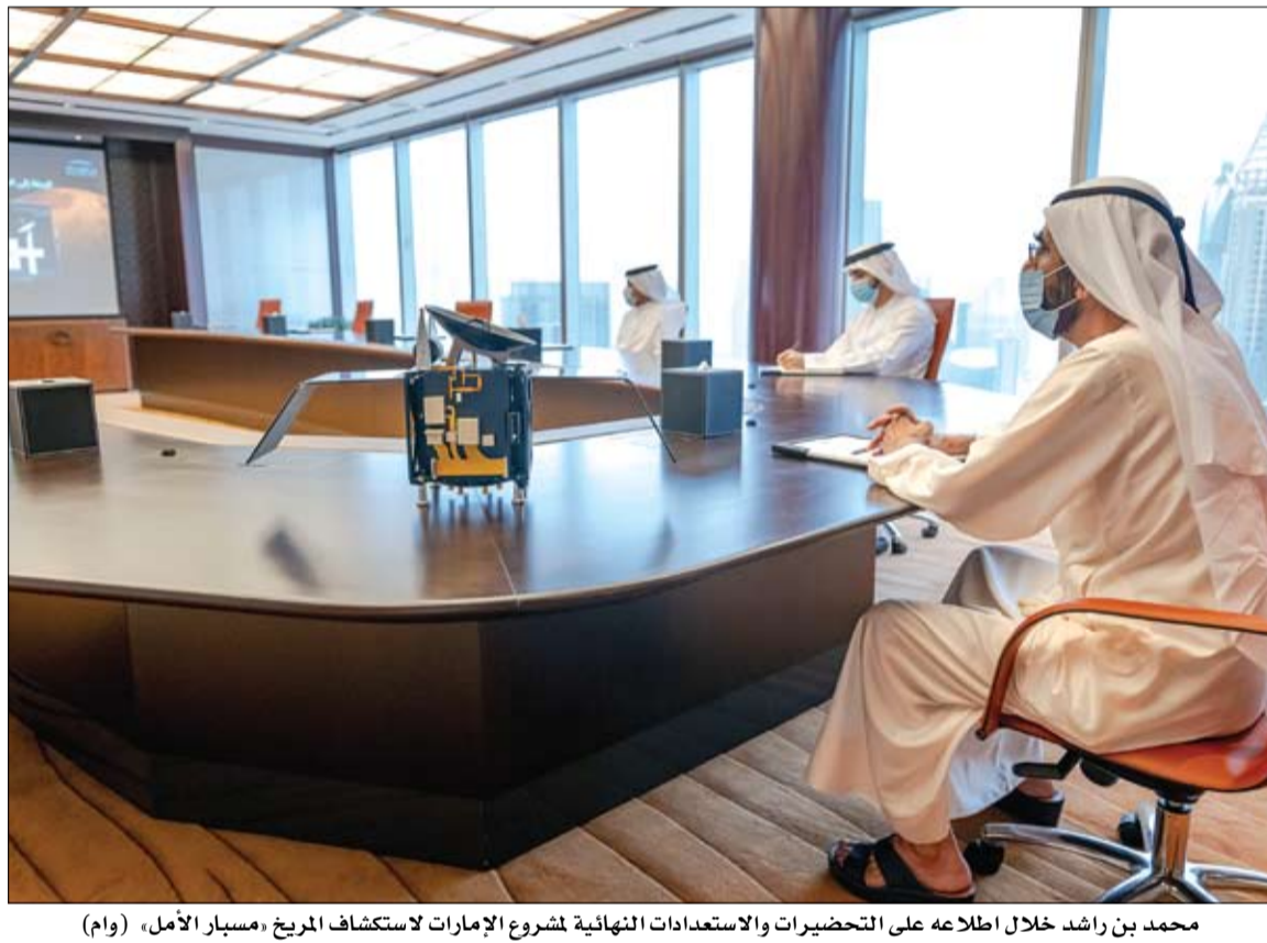
محمد بن راشد خلال اطلاعه على التحضيرات والاستعدادات النهائية لمشروع الإمارات لاستكشاف المريخ «مسبار الأمل» (وام)

دبي - وام اطلع صاحب السمو الشيخ محمد بن راشد آل مكتوم نائب رئيس الدولة رئيس مجلس الوزراء حاكم دبي رعاه الله، بحضور سمو الشيخ حمدان بن محمد بن راشد آل مكتوم ولي عهد دبي رئيس المجلس التنفيذي رئيس مركز محمد بن راشد للفضاء على التحضيرات والاستعدادات النهائية لمشروع الإمارات لاستكشاف المريخ مسبار الأمل المهمة العلمية التاريخية الأولى من نوعها في العالم العربي والمقرر انطلاقها في منتصف الشهر الجاري وسط ترقب عربي وعالمي لهذا المشروع الهادف إلى ترسيخ مكانة دولة الإمارات كمركز رائد في قطاع الصناعات الفضائية في المنطقة وبناء كوادر علمية إماراتية وعربية تشكل إضافة نوعية للمجتمع العلمي العالمي والمساهمة في دفع مسيرة المعرفة العالمية في مجال الفضاء. وقال صاحب السمو الشيخ محمد بن راشد آل مكتوم: إن مسبار الأمل ترجمة لثقافة الامتصاص التي كرستها دولة الإمارات منذ قيامها وتمارسها فكرياً وعملاً ومسيرة. ولفت سموه إلى أن: مسبار الأمل هو رسالة أمل بأننا لسنا أقل من شعوب الدول المتقدمة اجتهاداً وابتكاراً وإبداعاً، مؤكداً سموه أن: مسبار الأمل إنجاز لكل عربي وفخر لكل إماراتي ووسام إنجاز دائم لمهندسينا. وأضاف سموه: سوف تواصل الإمارات حشد جهودها ومواردها ووضع يدها بيد شعوب العالم الساعية إلى بناء معرفة بشرية أفضل. جاء ذلك خلال اجتماع صاحب السمو الشيخ محمد بن راشد آل مكتوم مع فريق مشروع الإمارات لاستكشاف المريخ وذلك مع بدء العد التنازلي لإطلاق "مسبار الأمل" في المهمة التاريخية المنتظرة وذلك من المحطة الفضائية بجزيرة تانغاشيما في اليابان بما يتفق مع الجدول الزمني المحدد رغم التحديات والصعوبات بسبب وباء فيروس كورونا المستجد كوفيد - 19 في العالم. (التفاصيل ص2)