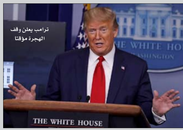
ترامب يعلن وقف الهجرة مؤقتا

المتحدة ويحظر دخول الكوادر الأجنبية العاملين في الشركات الأمريكية المقيمة في دول أخرى، والموظفين الموسمين في قطاع الفنادق، والشابات في التحاق الأقران، والطلاب المسجلين في برامج العمل -الدراسة لفصل الصيف. ورسالة الرئيس بهذا المرسوم واضحة : أمريكا مغلقة.