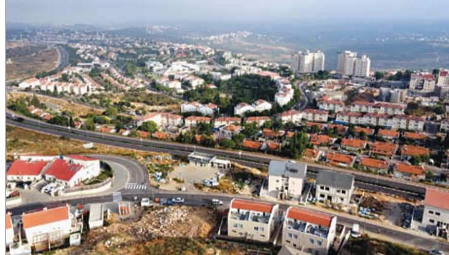
المستوطنات الاسرائيلية لتتلمع اراضي الضفة الغربية المحتلة

المقترحات في تحقيق الهدف منها وهو تأمين الحدود الإسرائيلية وأن تتعارض مع مصالح إسرائيل طويلة الأمد. من جانبه قال وزير الخارجية الفرنسي امين ان ضم إسرائيل لأي أراض في الضفة الغربية المحتلة سيكون انتهاكاً للقانون الدولي وستكون له عواقب. وقال جان إيف لودريان في جلسة برلمانية ضم أراض فلسطينية، مهما كانت مساحتها، من شأنه أن يلقي بظلال من الشك على أطر حل الصراع. وأضاف لا يمكن أن يمر قرار الضم دون عواقب ونحن ندرس خيارات مختلفة على المستوى الوطني وكذلك على المستوى شركائنا الأوروبيين الرئيسيين. واستبعد جابي أشكنازي وزير الخارجية الإسرائيلي التحرك بشأن الضم المقترح لأراض في الضفة الغربية المحتلة أمس الأربعاء، وهو التاريخ الذي حددته حكومة رئيس الوزراء بنيامين نتنياهو لبدء مناقشة هذه الخطوة.