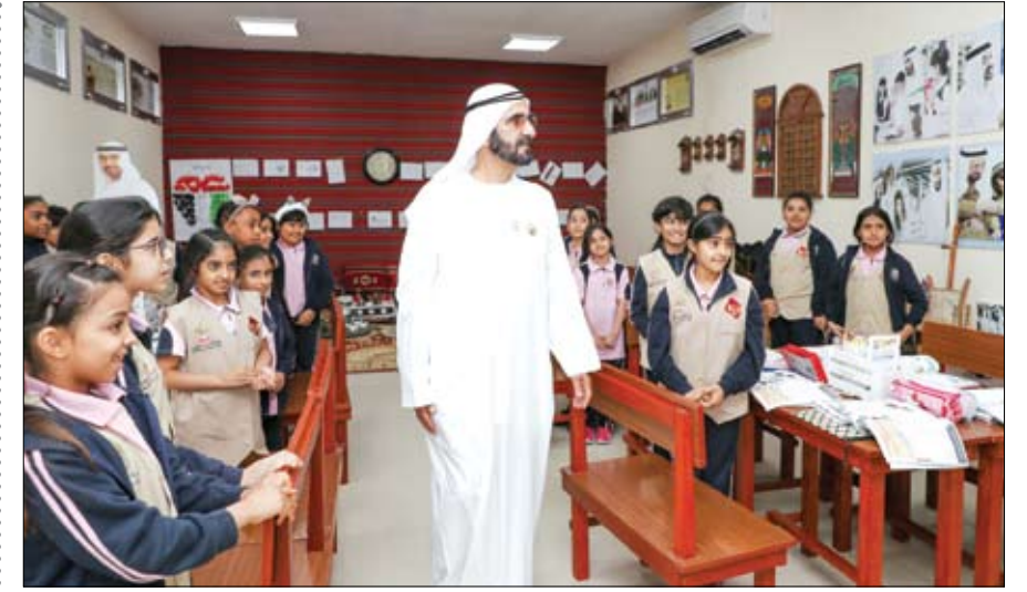
محمد بن راشد خلال جولته الميدانية في إحدى المرافق التعليمية

.. أبوظبي-وام: بتوجيهات صاحب السمو الشيخ خليفة بن زايد آل نهيان رئيس الدولة -حفظه الله،.. أمر صاحب السمو الشيخ محمد بن زايد آل نهيان ولي عهد أبوظبي نائب القائد الأعلى للقوات المسلحة بأن يحتضن مجمع قصر الرئاسة في أبوظبي مقرا