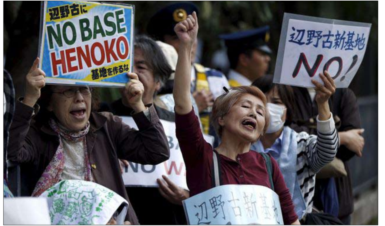
يابانيون يتظاهرون ضد الوجود العسكري الأمريكي

تحليل على علو منخفض تعود القصة إلى عام 1996. فقد تعهدت الدولتان بنقل هذه القاعدة،