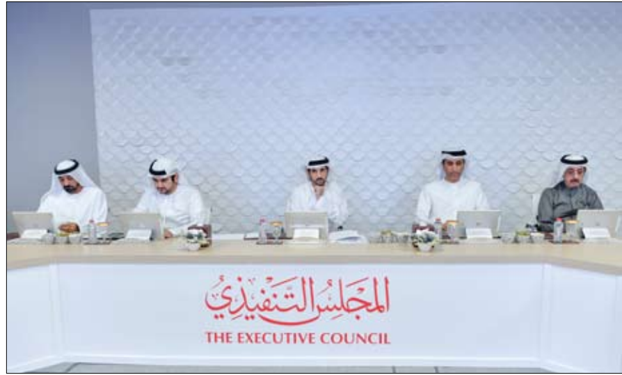
المجلس التنفيذي THE EXECUTIVE COUNCIL

ومنها تطوير مهارات المستقبل، وتطوير ملف تعليمي مركزي، وتنفيذ برامج توعوية، وإنشاء نظام رصد احتياجات سوق العمل والقوى العاملة، وذلك للتصدي للتحديات وتحقيق المستهدفات الوطنية. واطلع المجلس على عدد من المواضيع لتطوير العمل والخدمات الحكومية وعدد من السياسات الداعمة في هذا المجال.