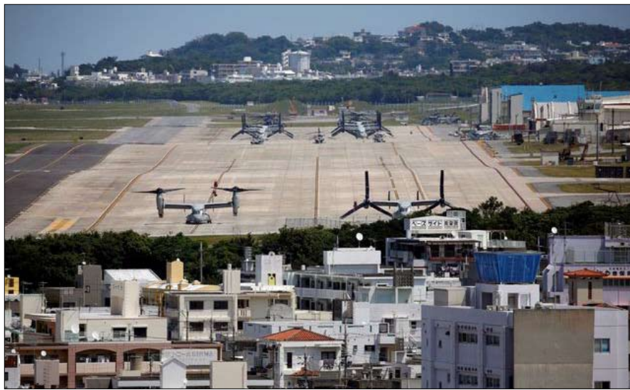
القاعدة الأمريكية في جنوب اوكنواوا

عكس القواعد الأمريكية الأخرى، تم بناء فورتينا على أرض خاصة. كل عام، تدفع الدولة اليابانية، في المتوسط، 16 ألف يورو إلى 3722 ملاكاً محلياً. نعمة للبعض، لعنة للآخرين. "عاش والسدي فترة طويلة على هذه الأرض، قبل أن يتم طرده، يشهد طوهاووا ايساو. منذ ثلاث وسبعين عاماً، تدفع الدولة لنا إيجاراً قيمته 800 يورو، ولكن يكفى! إنها أرض اجترادي، وأريد استعادتها، حيث أريد أن أدفن.."