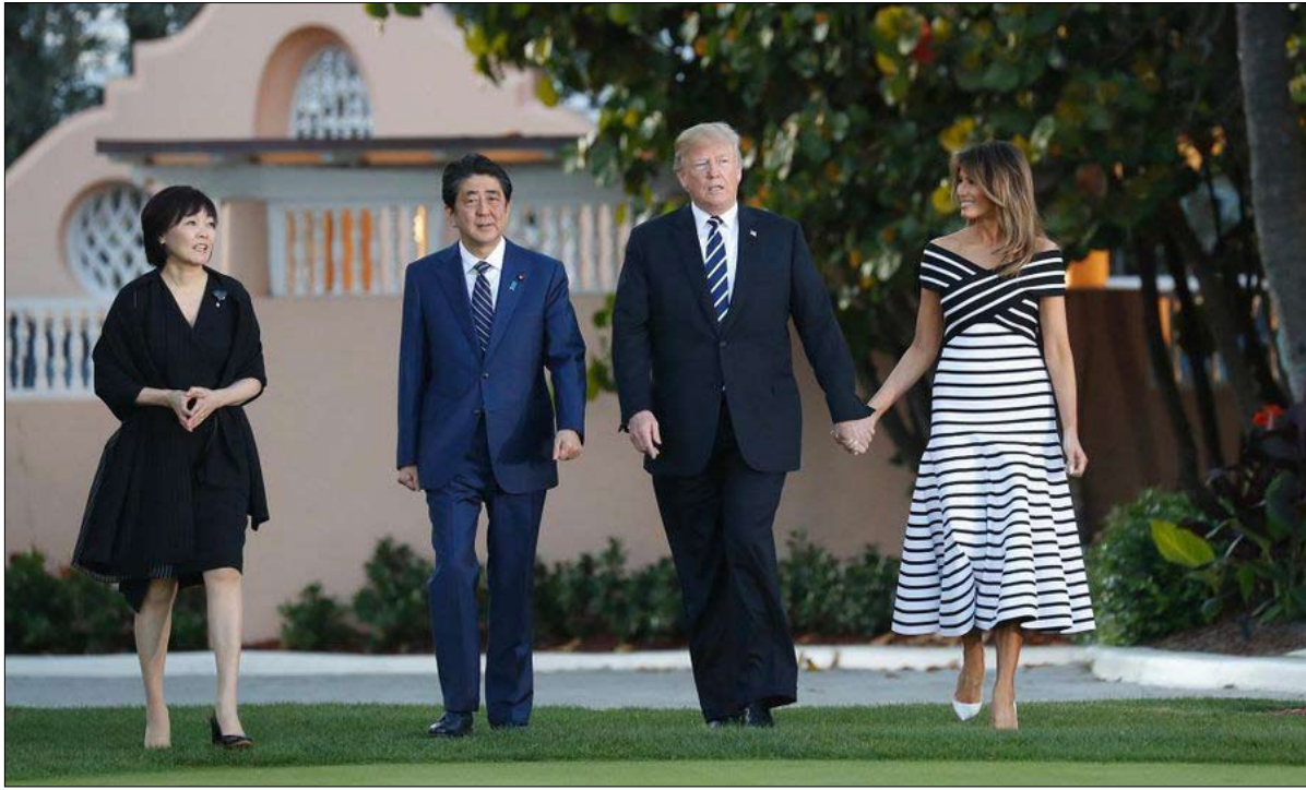
تقبيلات ترامب تثير قلق ابي

أراضيها، قال رئيس الوزراء الصيني ون جيا باو، حول قضايا السيادة، الحكومة والشعب الصينيين لن يتخليا أبداً عن سنتيمتر مربع.. هذه السلسلة من الجزر التي تضربها الرياح، لها العديد من المزايا والأوراق الراحبة. فمياها مليئة بالأسمالك، ويحتوي باطنها على احتياطات هيدروكربونية هائلة، وفقاً لتقرير الأمم المتحدة (1969)، الذي أكدته منذئذ شركة النفط الصينية. ويظل كنزها الحقيقي، خاصة، هو موقعها الجغرافي.