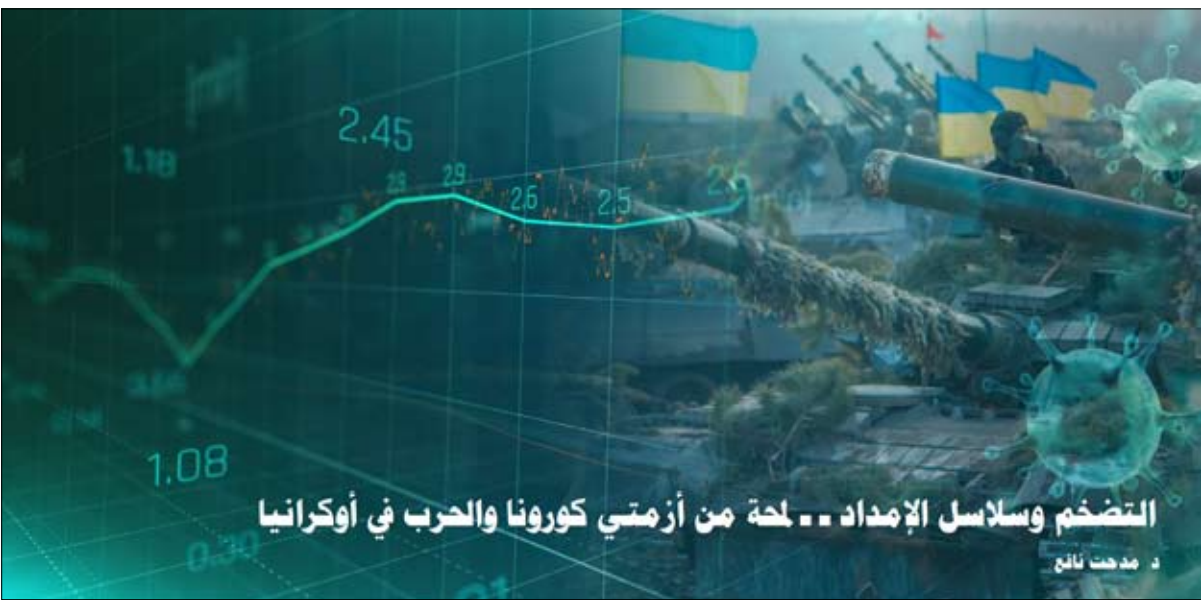
التضخم وسلاسل الإمداد .. لحة من أزمتي كورونا والحرب في أوكرانيا

وحذرت الدراسة من أن الزيادة الكبيرة في أسعار الطاقة (النفط والغاز) قد تحول الاستثمار مرة أخرى إلى الصناعات الاستخراجية وتوليد الطاقة القائمة على الوقود الأحفوري؛ ما يهدد اتجاهات التحول الإيجابية نحو