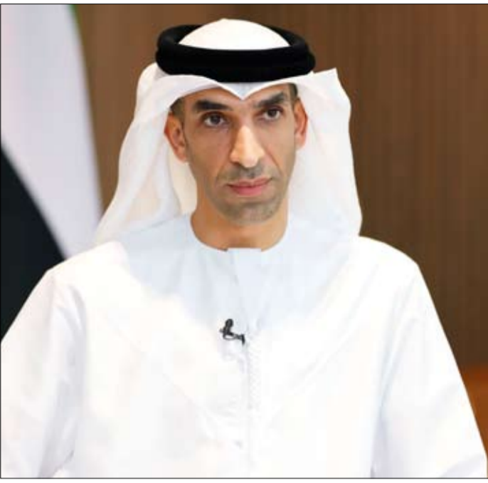
جورجيا والتي تم الإعلان عنها خلال فعاليات إكسبو 2020 دبي، كما تم توقيع الإعلان مع تشيلي والتسويق أبديت رغبتها، وبعض الدول الأخرى ..

واختتم الزيودي بالقول: "بدأنا مفاوضات مع بعض الدول الأفريقية وبعض الدول في شرق آسيا، وكذلك مع