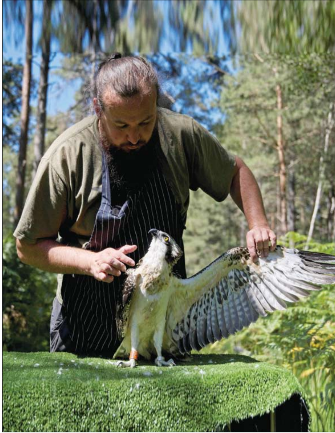
أحد دعاء الحفاظ على الغابات يتفقد جناح نسر نادر بعد وضع علامة عليه بحلقة معدنية برتقالية من متحف التاريخ الطبيعي في باريس، في حديقة شامبوراد الوطنية بفرنسا.

وأوضح: "تقدم هذه النتائج الأخيرة المزيد من الأدلة على أن مستخلص الكشمش الأسود النيوزيلندي يمكن أن يقدم فائدة أكبر للأشخاص الذين يعانون من زيادة الوزن، خاصة في الساقين. ولست مضطرا للذهاب إلى صالة الألعاب الرياضية أو القيام بتمارين شاقة لساعات في كل مرة، يمكنك الاستمتاع بتحسينات ذات مغزى أثناء الأنشطة العادية على مدار اليوم. ويمكن أن يشمل هذا المشي إلى المتجر أو البستنة أو القيام بالأعمال المنزلية، أو أي نشاط يندرج ضمن فئة الأنشطة منخفضة إلى متوسطة الشدة. ومعظمنا يفعل ذلك لبعض ساعات يوميا بشكل طبيعي، دون أن يعرق".