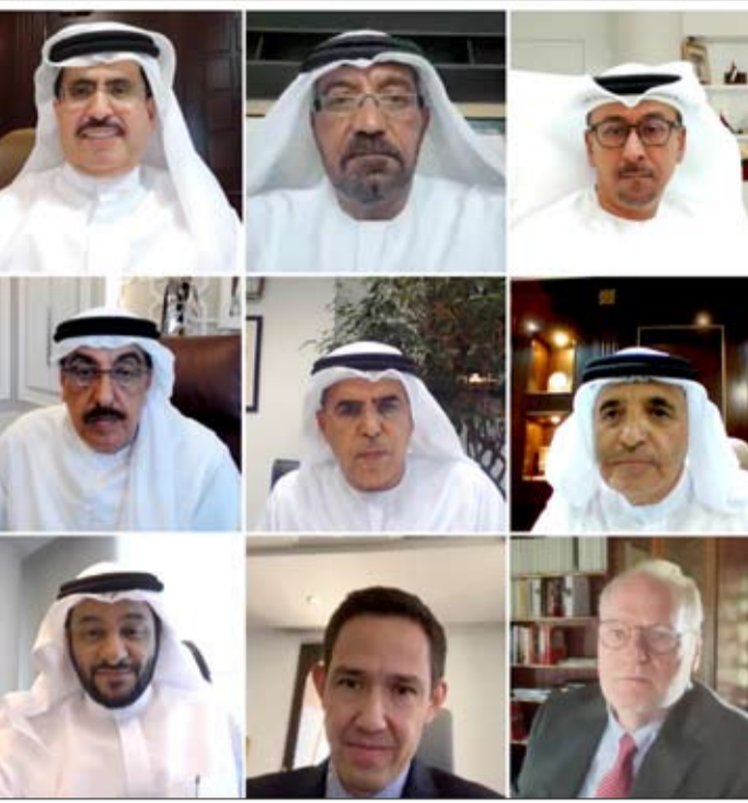
الذين كان لهم الدور الفعال في تحقيق هذه الإنجازات في إمارة دبي.

وقال معالي سعيد محمد الطاير: "انسجاماً مع رؤية وتوجيهات صاحب السمو الشيخ محمد بن راشد آل مكتوم نائب رئيس الدولة رئيس مجلس الوزراء حاكم دبي "رعاه الله"، في حماية البيئة والمجتمع وضمان تطبيق أعلى معايير الأمن والسلامة، استعرض المجلس تشكيل لجنة دائمة لمراقبة تداول وبيع المواد البترولية في إمارة دبي، حيث أصدر سمو رئيس المجلس الأعلى للطاقة في دبي القرار رقم 3 لسنة 2021 لوضع الإطار التنظيمي والاستراتيجيات والتشريعات لتوزيع غاز البترول المسال ومشتقاته في إمارة دبي ليكون متوافقاً مع أعلى المعايير العالمية في هذا المجال، كما نهدف إلى تنظيم ممارسات الأعمال وتطبيق أعلى المعايير العالمية في الأمن والسلامة، وضمان تداول غاز البترول المسال من نقل وتخزين وتوزيع في الإمارة طبقاً للمواصفات المعتمدة في الدولة". وأضاف معاليه: "أشترط المجلس الأعلى للطاقة في قراره وجوب الحصول على موافقة منه لإصدار التصريح كإذن