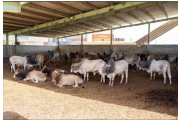
•• دبي - وام:

أعلنت وزارة التغير المناخي والبيئة جاهزيتها الكاملة لاستقبال موسم الأضاحي، من خلال تنفيذ خطة متكاملة تهدف إلى ضمان سلامة الأضاحي والحيوانات الحية، وتعزيز منظومة الأمن الغذائي والصحة العامة، عبر تطبيق أعلى المعايير الصحية والبيطرية المعتمدة في مختلف مناهذ الدولة.