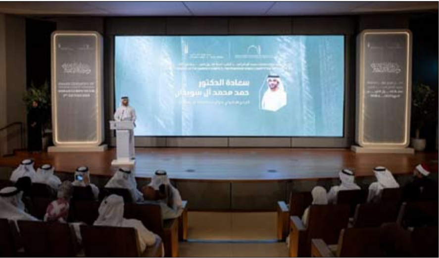
•• أبو ظبي - وام:

نظم مسجد الإمام أحمد الطيب في بيت العائلة الإبراهيمية، حفل تكريم الفائزين في الدورة الثالثة من مسابقة القرآن الكريم لهذا العام، وذلك في أجواء احتفالية تعكس أهمية المسابقة ودورها في دعم حفظة كتاب الله وتشجيعهم على التميز.