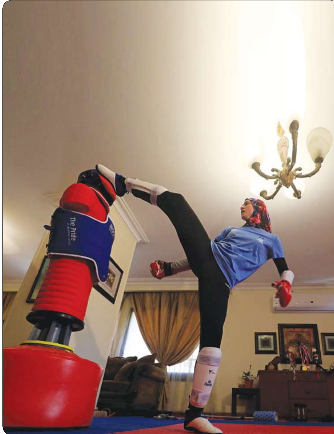
هداية ملاك بطلة التايكوندو المصرية الحائزة على ميدالية برونزية في أولمبياد ريو 2016، تتدرب في منزلها لتمثيل بلادها في دورة الألعاب الأولمبية في طوكيو المؤجلة بسبب فيروس كورونا.

عندما يزور الأشخاص أي متحف، يتلامسون مع ثقافات مختلفة، وهو ما يعود بالنفع عليهم بصورة ما.