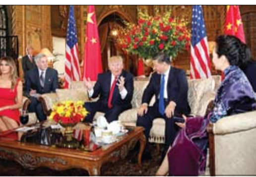
ترامب... لا يريد غير الأذعان والاستسلام

يأتي ذلك في ظل ارتفاع التوتر بالمنطقة، حيث أعلنت المملكة المتحدة إرسالها قطعة بحرية ثانية إلى الخليج العربي، بعد محاولة إيران احتجاز ناقلة نفط بريطانية.