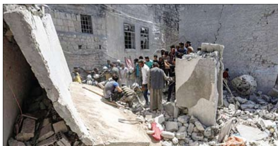
سوريون يفتشون عن أحياء تحت الانقاض عقب غارة في ادلب

روسيا تواصل استهداف مناطق في ريف ادلب الجنوبي، مشيرا إلى أن القصف الروسي طال منذ أكثر من شهرين، تزامنا مع شيوخ، بعد منتصف ليل الجمعة السبت. وأدت الضربات، وفق المصدر نفسه، إلى مقتل ثمانية مدنيين بينهم