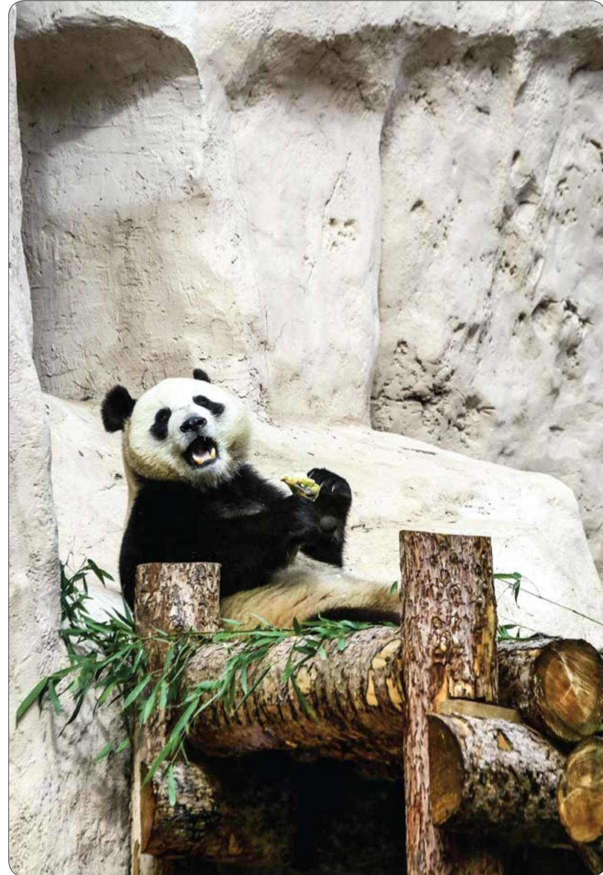
صورة للباندا العملاقة تآكل الفواكه في حديقة حيوان موسكو وسط العاصمة الروسية.

وعلى المرشح الناجح أن يكون شغوفاً بالتحف والأواني الفضية والمجوهرات، وقادراً على معرفة القيمة منها. والأهم من ذلك أن يكون مساوماً ماهراً، للحصول على أدنى سعر ممكن للتحف.