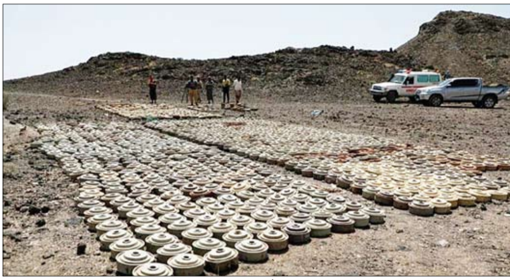
المليشيات الحوثية تزرع الألغام في المناطق السكنية بالحديدة

ومن جهتها، أكدت منظمة العفو الدولية، أن الأحكام التي أصدرتها مليشيا الحوثي الانقلابية على 30 أكاديميا وسياسيا يمنيا معتقلين لديها منذ 3 سنوات تعد استهزاء بالعدالة، وتأكيدا على تحول القضاء إلى أداة للقمع في المناطق التي تسيطر عليها المليشيات.