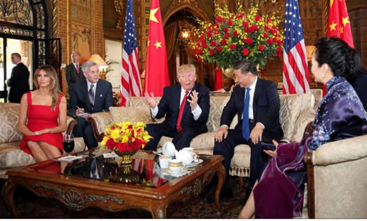
ترامب... لا يريد غير الأذعان والاستسلام