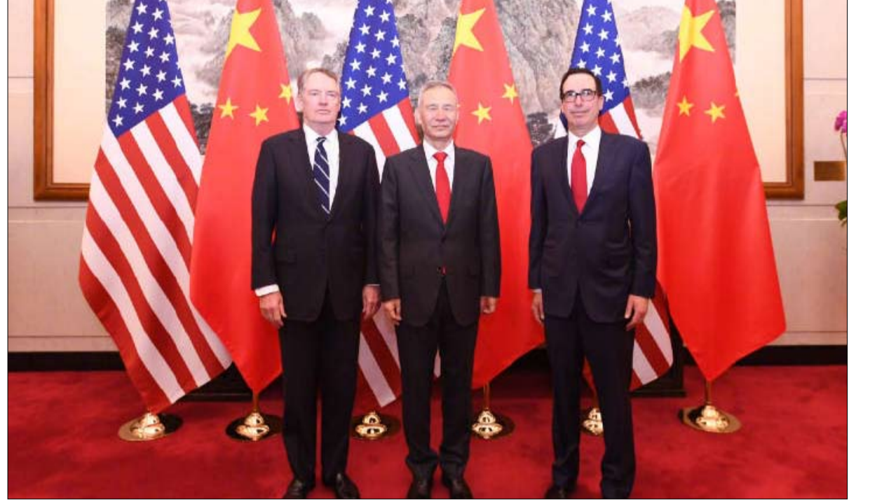
اسلوب مختلف في التفاوض