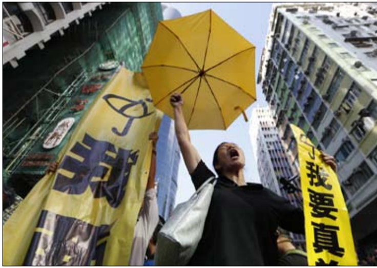
صرخ الصراخ وصمت المشاهير والنجوم

استمر في الصراخ لإدانة عنف الشرطة، وخيانة الصين لمبدأ "دولة واحدة، نظامان"، الذي أعطى منطقتهم الحكم الذاتي الكامل حتى عام 2047. ومع ذلك، في صخب المطالب هذا، هناك صوت لا يكاد يسمع: صوت مشاهير