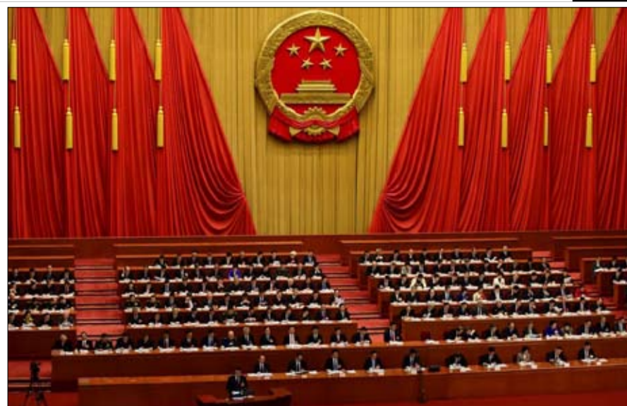
ما مصير الحزب الشيوعي إذا حكم اقتصاد السوق؟

باحث مستقل، محامياً متخصصاً في العلاقات الدولية لفترة طويلة. ومؤلف كتاب "الصين 2020"، وهم الازدهار الذي لا نهاية له" "مانيتويا، 2019.