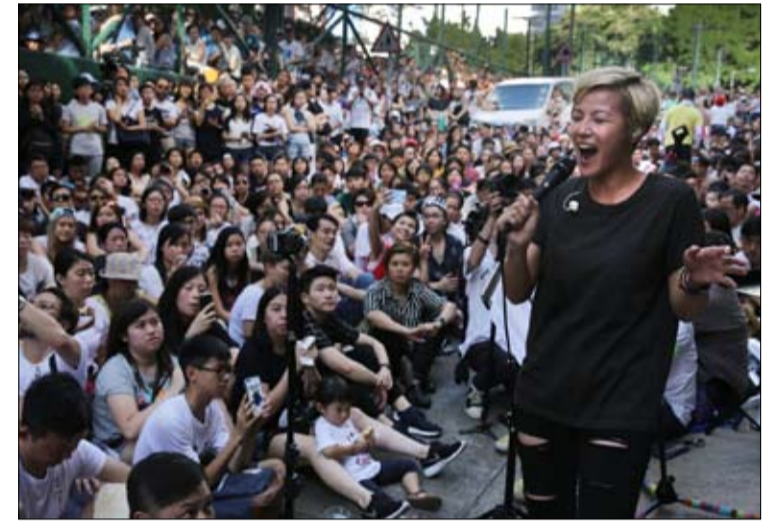
دينيس هو دفعت الثمن باهظا