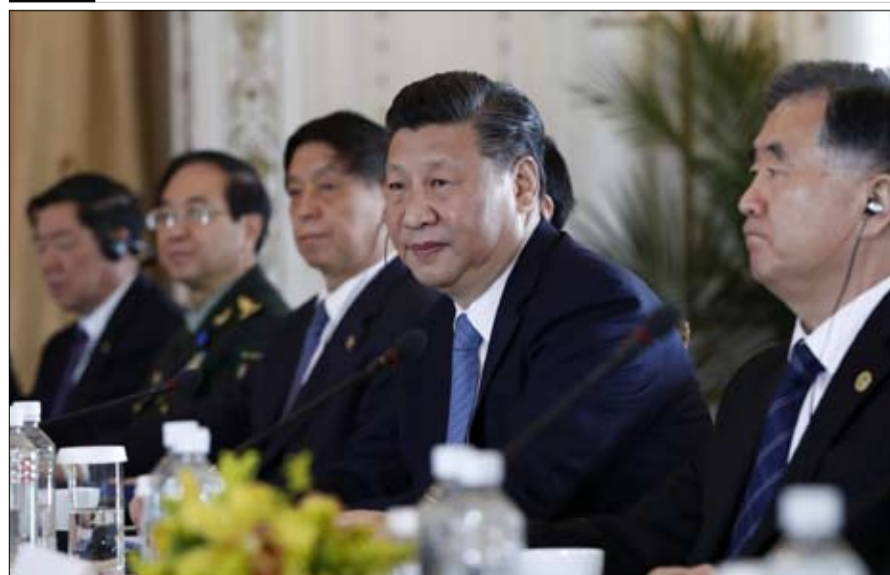
هل تحول الحلم إلى كابوس؟