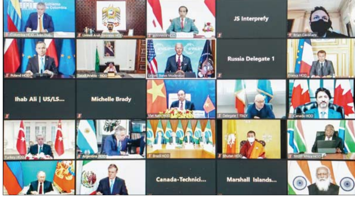
محمد بن راشد خلال مشاركته في قمة القادة حول المناخ

أعربت دولة الإمارات عن إدانتها واستنكارها الشديدين لمحاولات ميليشيات الحوثي الإرهابية المدعومة من إيران، استهداف المدنيين والأعيان المدنية بطريقة منهجية ومعتمدة في خميس مشيط بالمملكة العربية السعودية الشقيقة، من خلال طائرة مفخخة، اعترضتها قوات التحالف. وأكدت دولة الإمارات - في بيان صادر عن وزارة الخارجية والتعاون الدولي - أن استمرار هذه الهجمات الإرهابية لجماعة الحوثي يعكس تحديها المسافر للمجتمع الدولي واستخفافها بجميع القوانين والأعراف الدولية. (التفاصيل ص 3)