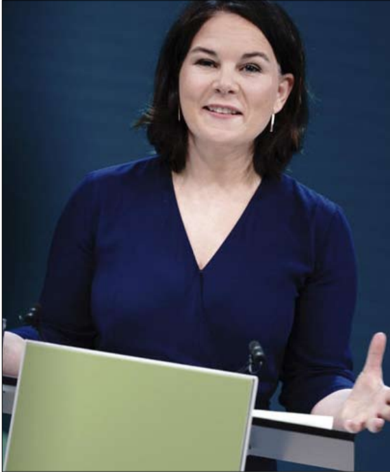
أنالينا بيربوك مرشحة الخضر

عوائق بالجملة ان رئيس الحزب المسيحي الديمقراطي، أرمين لاشيت، زعيم ذو قاعدة هشة، وطريقته إلى المستشارية سيكون مليئاً بالعقبات. وقبل خمسة أشهر من الانتخابات التشريعية، يظل السؤال الحقيقي لهذا الوريث المحتمل لأنجيلا ميركل، هو ما إذا كان "سيتمكن من فرض نفسه بحزم كبير، وما إذا كان سيتمتع بنفس قوة الشخصية"، يلخص البروفيسور هانز بيتر ستارك، ويخلص هذا الأخير إلى القول: "من السابق لأوانه الحكم".