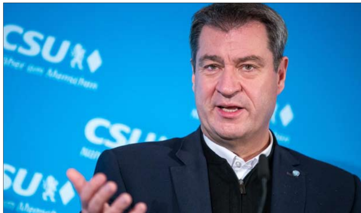
ماركوس سودر ألم يكن الجدير.