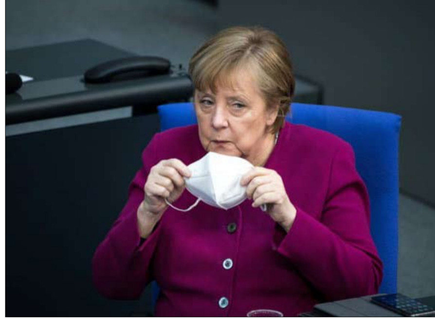
ميركل والخلافة المازق