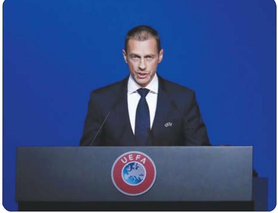
ريال وبرشلونة حتى الآن. وأوضح تشيفيرين أنه في ما يتعلق

بالأندية البريطانية "ستأخذ في الاعتبار حقيقة أنها اعترفت بخطئها". وأضاف "إذا أراد الآخرون المشاركة في مسابقتنا، فسيتمتع عليهم الاتصال بنا وسنحل المشاكل". في إشارة إلى المشاورات الجارية مع القسم القانوني بالاتحاد الأوروبي. وانتقد السلوفيني مجدداً "الشفع القوي للغاية" لدرجة أنه يمكن أن يؤدي إلى "نظرية مؤامرة" مماثلة في خضم المناقشات حول إصلاح دوري أبطال أوروبا بعد عام 2024. وقال تشيفيرين "بكل غيابة، لم أصدق أن من أحاورهم يومياً كانوا في الواقع يعدون مشروعاً آخر خلف ظهورنا. لا بد أنني كنت ساذجاً، لكن من الأفضل أن أكون ساذجاً من أن أكون كاذباً".