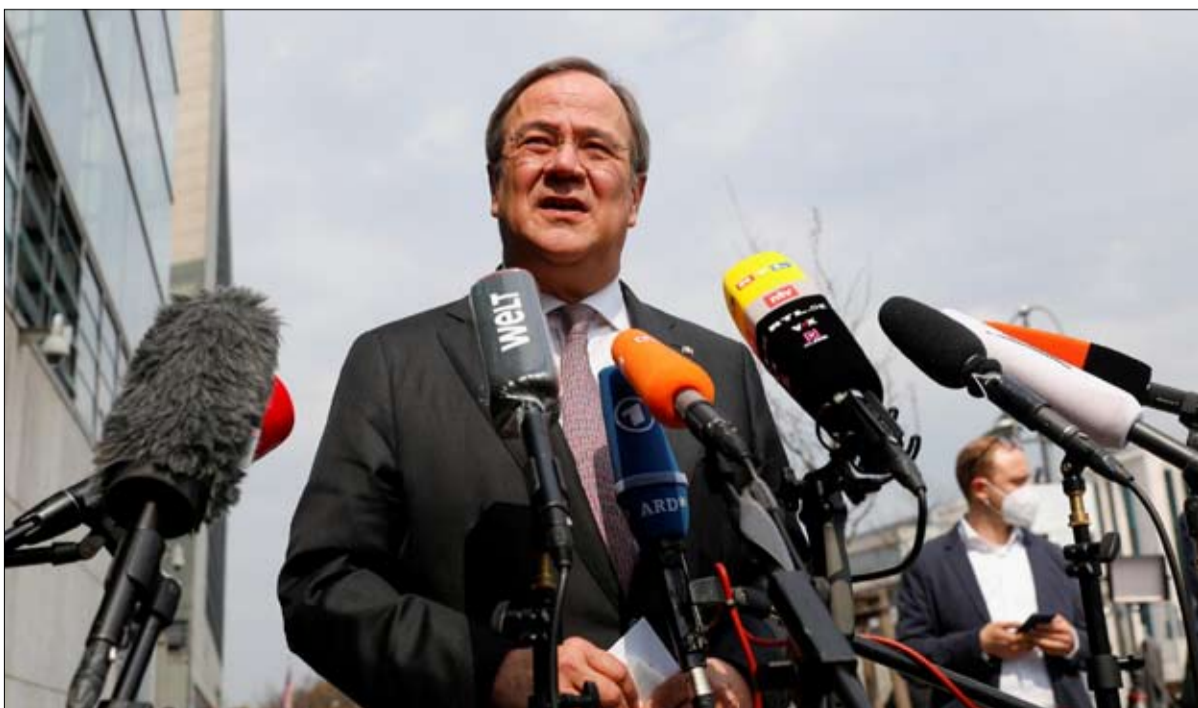
أرمين لاشيت الإمكان الصعب