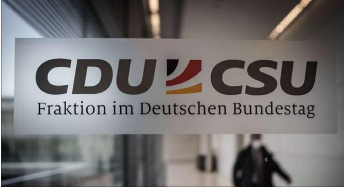
التفاف يواجه مصيره بعد زعيمته