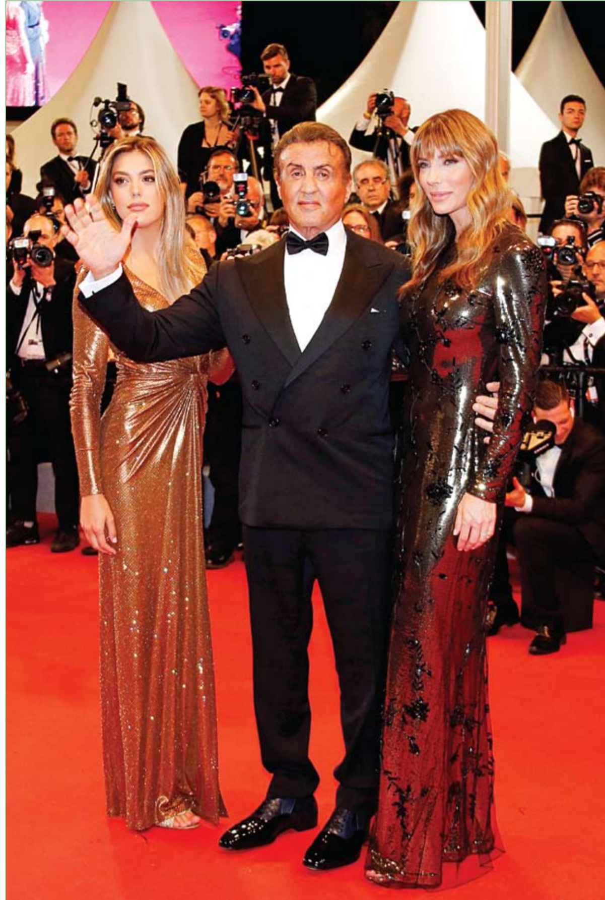
سيلفستر ستالون مع زوجته جينيفر فلافين وابنتهما سيسلين روز خلال تكريمه في مهرجان، كان، السينمائي وعرض فيلمه "رامبو: أول دم.. روبرتوز،

نجا رجل إيطالي من الموت بشكل لا يُصدق، بعد أن تمكن الأطباء من إزالة سهم اخترق قلبه ورثته في عملية جراحية معقدة ومحفوفة بالمخاطر. ونشر المستشفى صورة صادمة، يظهر فيها السهم الذي يصل طوله إلى نحو 12 بوصة، وقد استقر في الناحية اليسرى من صدر الرجل البالغ من العمر 47 عاماً، قبل أن يتم نقله إلى غرفة العمليات، وأصيب السهم بالصدمة، لأن المصاب كان مستيقظاً طوال الوقت، ولم يعان من موت فوري، عندما اخترق السهم البطن الأيسر والرئة اليسرى، في الحادث الذي وقع في مدينة أوستا الإيطالية. وقال المتحدث باسم مستشفى مولينيت في تورينو "بشكل لا يصدق، بالإضافة إلى الجدار الصدري، اخترق السهم البطن الأيسر - أهم حجرات القلب - ووصل إلى الرئة اليسرى دون أن يسبب الموت الفوري للمصاب.."