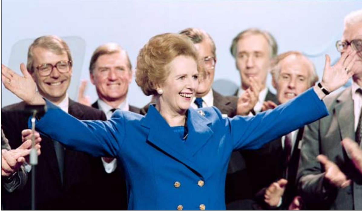
تاتشر... من أبرز ضحايا المحافظين