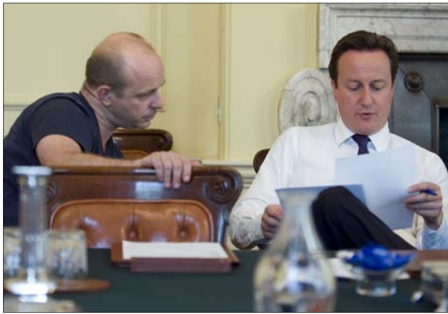
ديفيد كامبرون... استفتاء الضريبة القاضية

السياق من أجل زعامة اليمين الإنجليز، وسيتمتع على من موارد الدبلوماسية لحاوله التوفيق بين معسكري حزب محافظ مزق بين مؤيدي أوروبا ومعارضين لها. اليوم، كما هو الحال بالأمس، تبدو مهمة إعادة رفق الفتح، الذي تريه الدائرة.