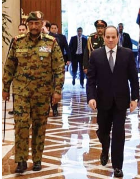
السياسي خلال استقباله رئيس المجلس العسكري السوداني

وبينما تواصل قوى الحرية والتغيير التحضير لإضراب عام يومي الثلاثاء والأربعاء القادمين تستمر التحركات السرية والعلنية لتقريب الشقة بين الجانبين. وآخر الدعوات للخروج من مآزق المجلس السيادةي مقترحات جريئة قدمها الصادق المهدي زعيم حزب الأمة، وهي أن تحتوي تركيبة المجلس على أغلبية مدنية يرأسها عسكري، وتأتي أهمية مقترح المهدي بوصف حزبه أحد أهم مكونات قوى إعلان الحرية والتغيير نفسها، ولكن الاقتراح يواجه تحديا كبيرا لقبوله من المعتصمين وبعض القوى الأخرى التي ترفض من الناحية الميدانية وجودا عسكريا على رأس المجلس السيادةي. وكانت مصادر في السودان قد أفادت في وقت سابق امس أن قوى الحرية والتغيير ستعقد اجتماعا الاثنين لبحث تكوين المجلس القيادي كمرجعية سياسية، وذلك بعد انتهاء اجتماع الخميس دون التوصل لنتيجة. وبحسب مصادر، فإن الآراء في الاجتماع السابق انقسمت حول مدى ضرورة تكوين المجلس وبين استمرار التنسيقية التي تدير التحالف حاليًا، فضلا عن تباينات في وجهات النظر حول النسب والتوزيع وإدخال الموقعين على الإعلان، وغير المثقلين في التنسيقية وأحجام الكتل. وتم تحديد موعد آخر للاجتماع مزيد من التفاوض. ودعا تحالف قوى الحرية والتغيير، الذي يقود الاحتجاجات في السودان، مساء الجمعة، إلى إضراب عام في عموم أنحاء البلاد يومي الثلاثاء والأربعاء المقبلين طالبة المجلس العسكري الحاكم بتسليم السلطة للمدنيين.