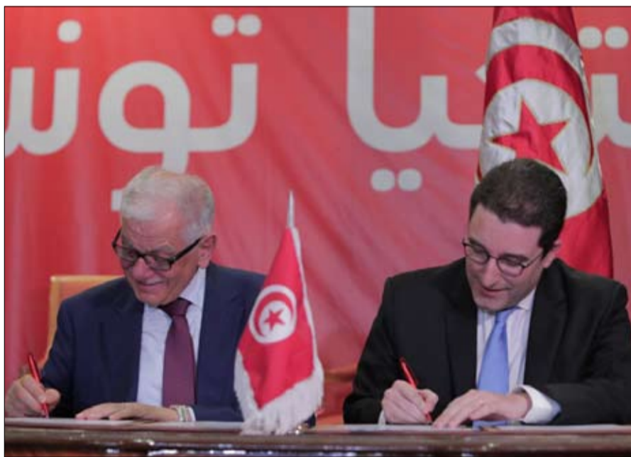
الاندماج بين العزابي ومرجان (2)

لديها شخصية مثل كمال مرجان مرشح للانتخابات الرئاسية. وقال إن كل المسائل ستحل وتناقش صلب هياكل حركة تحيا تونس، وفق قوله.