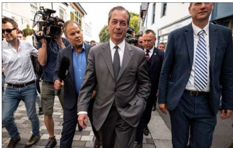
نايجل فاراج.. حضور بريطاني مؤقت