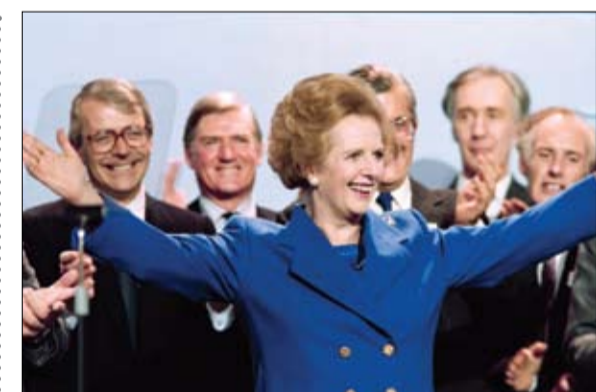
تاتشر... من أبرز ضحايا المحافظين

أكد نائب وزير الخارجية الروسي سيرغي ريابكوف، أن موسكو تؤيد عقد اجتماع للجنة تنفيذ خطة العمل المشتركة بشأن البرنامج النووي الإيراني في أقرب وقت. وقال ريابكوف في تصريحات لوكالة «سبوتنيك» الروسية: تؤيد عقد هذا الاجتماع في أقرب وقت ممكن، لكن الإدارة الخارجية الأوروبية هي المسؤولة عن الخدمات اللوجستية والقضايا التنظيمية كمنسق للجنة.