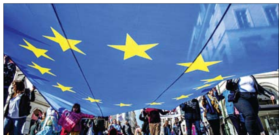
أوروبا الموحدة.. حلم يترنح

أجرى رئيس المجلس العسكري الانتقالي في السودان الفريق أول عبد الفتاح البرهان السبت محادثات في القاهرة مع الرئيس المصري عبد الفتاح السيسي في أول زيارة له خارج بلاده منذ توليه منصبه. واستقبله السيسي بقصر الاتحادية الرئاسي في ضاحية مصر الجديدة (بشرق القاهرة). وقال المتحدث الرسمي باسم الرئاسة بسام راضي لفرانس برس إن السيسي «عقد جلسة مباحثات مع الفريق أول عبد الفتاح البرهان رئيس المجلس العسكري الانتقالي بالسودان، حيث تم التوافق على اولوية دعم الارادة الحرة للشعب السوداني واختياراته». وأتت زيارة البرهان الى القاهرة قبل أيام من اضراب عام دعا اليه قادة حركة الاحتجاج في السودان الثلاثاء والأربعاء لمطالبة المجلس العسكري بتسليم السلطة للمدنيين. وهي الزيارة الأولى للبرهان خارج السودان منذ إطاحة الرئيس السابق بمرحمة في 11 نيسان أبريل الماضي. وكان الرئيس المصري عقد قمة تشاورية حول الأوضاع في السودان في حضور بعض الدول الأفريقية في 23 أبريل. جاء هذا في الوقت الذي يتوقع فيه أن تبدأ صباح اليوم الأحد، سلسلة من الوقفات الاحتجاجية دعا لها تجمع المهنيين السودانيين للضغط على المجلس العسكري الانتقالي لنقل السلطة إلى المدنيين فيما لا تزال المفاوضات متوقفة بين المجلس العسكري الانتقالي وقوى إعلان الحرية والتغيير.