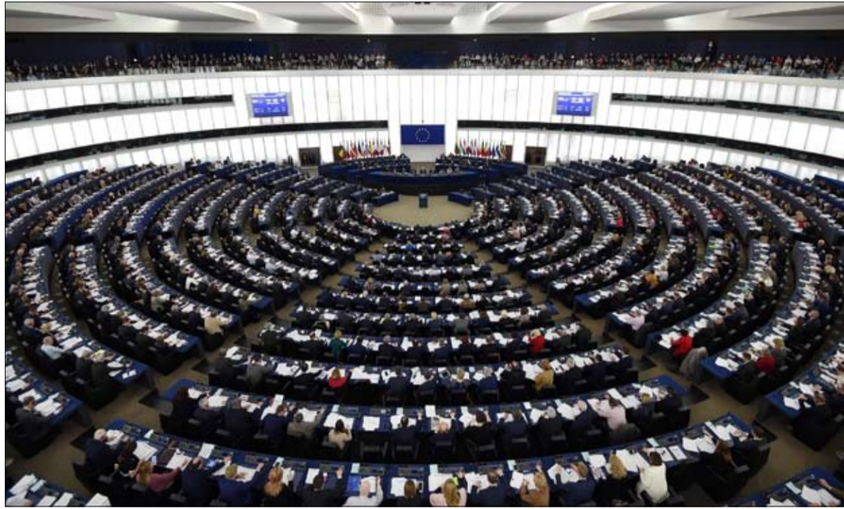
البرلمان الاوربي.. اعادة تشكّل في الافق