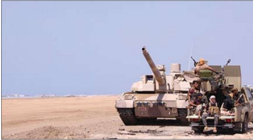
قوات الجيش الوطني اليمني تواصل تقدمها وسيطرتها على عدد من المواقع في حجة