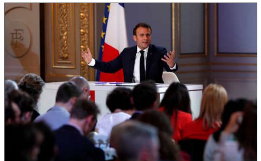
هل يكسب ماكرون رهانه الاوربي ما بين 140 و 155. وهكذا لن يكونا معا قادرين على جمع أغلبية 376 نائبا أوروبيا (في لبرلمان يضم 751).

هل سيحتفظ اليسار بمكانته؟ احتمال شبه مستحيل، رغم الانتصارات المتوقعة، ولكن المتواضعة، في إسبانيا والبرتغال، فإن اليسار الأوروبي قد يخسر وزناً كبيراً في هذه الانتخابات. سيدفع ضمن التراجع الحاد لعدم التوافق الاشتراكيين الديمقراطيين المنتخبين في فرنسا وإيطاليا وألمانيا، وهم أكبر الفرق. فمن المتوقع أن يخسر الحزب الاشتراكي الديمقراطي الأثاني حوالي 15 مقعداً، والاشتراكيون الفرنسيون، الموزعون بين عدة قوائم، قد يخفون من التمثيل. وفي المجموع، من المنتظر أن تنقلص المجموعة الاشتراكية في البرلمان الأوروبي من 187 مقعداً اليوم، إلى حوالي 140 غداً الاثنين. من جهته، أقصى اليسار مهدد بالتنازل، وستكون المقاعد الإضافية القليلة التي يمكن أن تفوز بها الأحزاب البيئية القريبة من اليسار غير كافية لتغيير الصورة العامة. وفي المجموع قد يخسر هذا الجناح اليساري، حسب التوقعات،