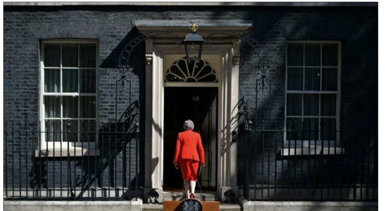
تيريزا ماي... انتهت اللعبة

الولايات المتحدة 200 جندي في قاعدة "موقف السلطي الجوية". في سوريا، أنشأت أمريكا قواعد عسكرية مختلفة بهدف محاربة تنظيم داعش الإرهابي، وأبرزها قاعدة "قرية الجلابة" جنوب عين العرب في ريف حلب الشمالي، وتحوي مهبطاً للحوامات ومدجج، وكتيبة مدفعية "هاوترز" بعيدة المدى. إلى جانب قواعد فرعية في الحسكة مثل تل بيدر والرميلان والشاداي، وقاعدة "عين عيسى" شمال الرقة والتي تعد من أكبر القواعد الأمريكية، وفي الجنوب أنشأت أمريكا قاعدتي "التنف" و"الزكف" في حمص لتدريب وتسليح قوات التحالف المشاركة في محاربة داعش.