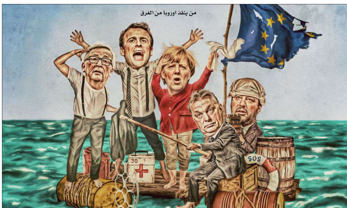
من يتنقذ أوروبا من الفرق