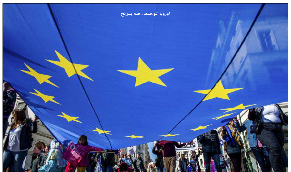
أوروبا الموحدة.. حلم يتبرع