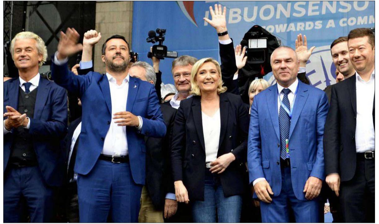
الائتلاف للقوميين... هل هو ممكن