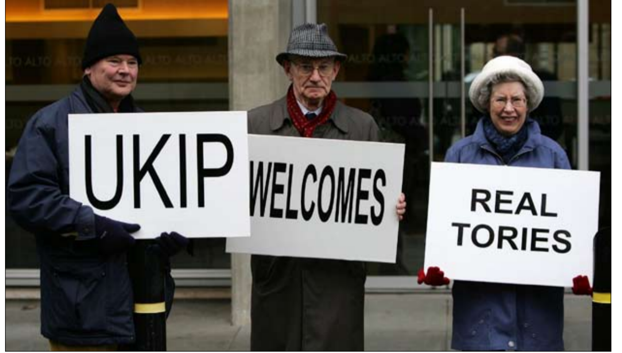
القواعد ضد الاق الاوروبي