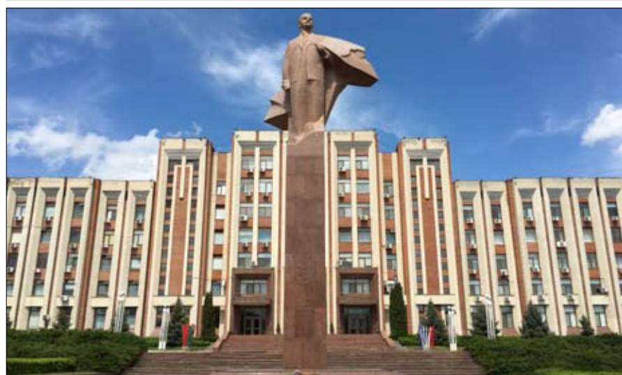
سياسة الاموات تفعل في الاحياء

المناطق الريفية الروسية نادمة على الفترة الشيوعية حيث الشغل مضمون مدى الحياة للجميع