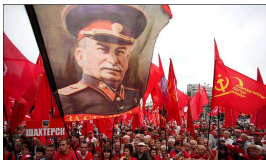
تشهد عودة عبادة ستالين

كيف نفسر هذه الملاحظة؟ - أدى سقوط النظام الاشتراكي الشيوعي عام 1991 إلى إعادة توزيع الأوراق، وعلى هذا النحو، لا تظهر بعض الدول أي حنين لتلك الفترة، بينما تأسف دول أخرى على الاستقرار الاقتصادي والاجتماعي لأنظمة تلك الحقبة.