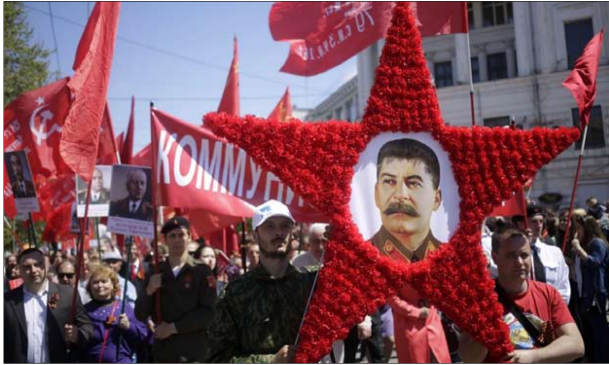
الحنين الى زمن الشيوعية في شرق اوكرانيا