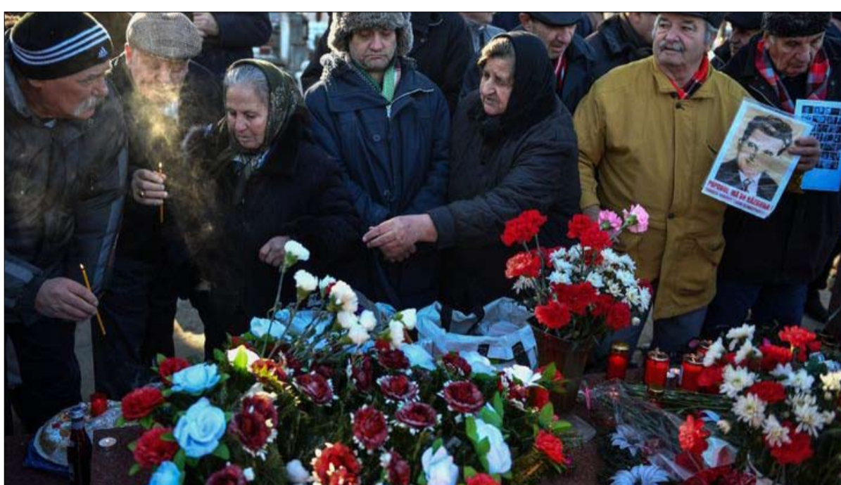
رومانيا الحنين الى النظام الاقتصادي الاشتراكي

المناطق الريفية الروسية نادمة على الفترة الشيوعية حيث الشغل مضمون مدى الحياة للجميع