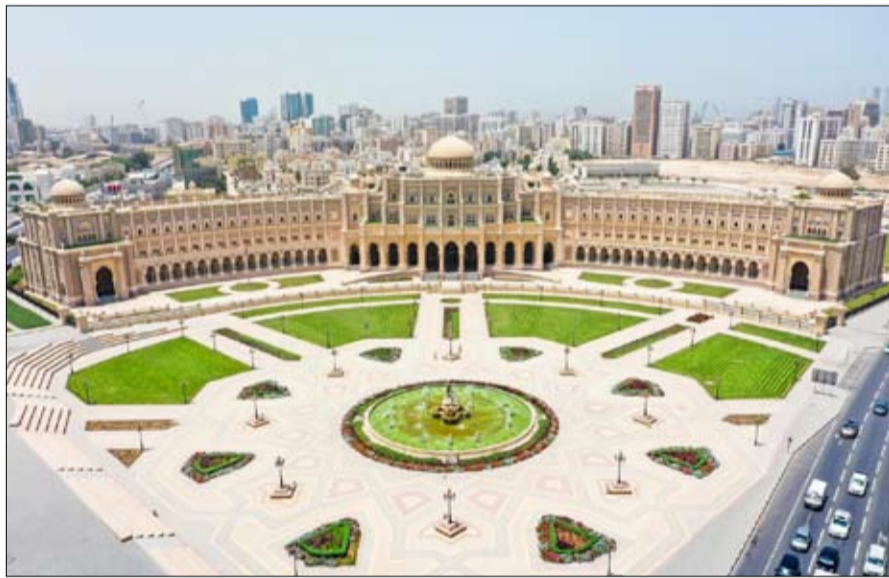
بين استفسارات عامة وبلاغات وطلبات مختلفة تم متابعة وفرص تحسين واقتراحات مواضعها.

كشفت بلدية مدينة الشارقة عن تنظيم أكثر من 1763 زيارة تفتيشية على المنشآت الغذائية وصالونات الحلاقة ومراكز التجميل خلال عيد الأضحى المبارك ضمن جهودها وخططها خلال فترة العيد لتأكيد من التزام هذه المنشآت بكافة المعايير والضوابط الصحية المنظمة لسير العمل والالتزام كذلك بالإجراءات الوقائية والتدابير الاحترازية التي تم الإعلان عنها سابقاً وجرى تميمها وتوعية العاملين في هذه المنشآت بها وبأهمية تطبيقها. وكادت الشريحة هذا المعلماً مساعد