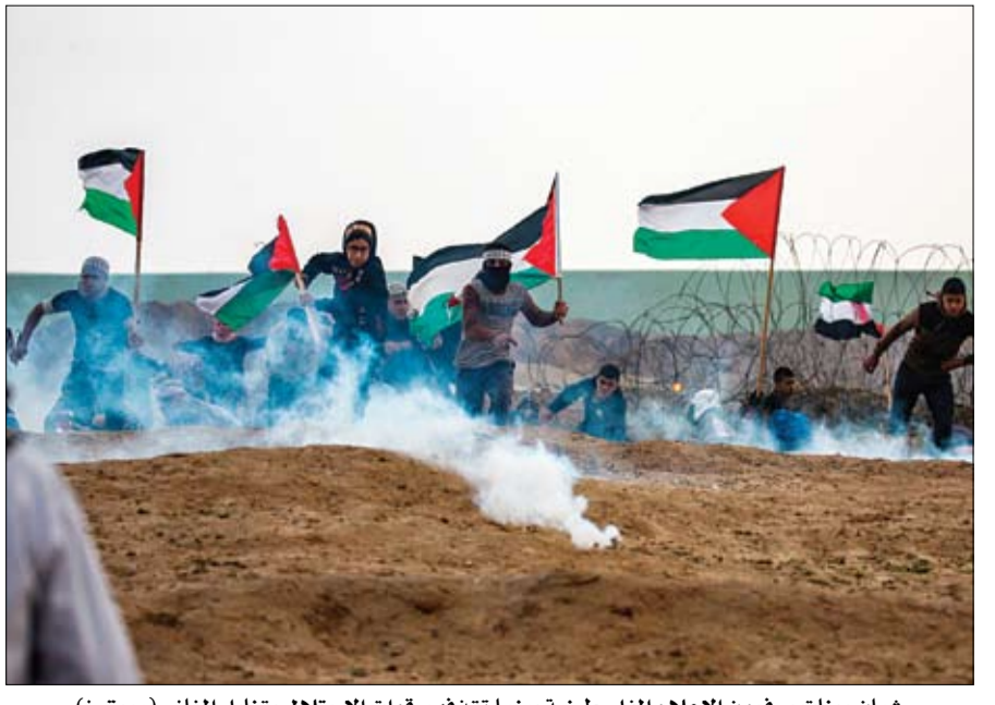
شبان وبنات يرفعون الاعلام الفلسطينية بينما تقدمهم قوات الاحتلال بقنابل الغاز

أطلقت السعودية بنجاح أمس القمرين الصناعيين "سعودي سات 15" و "سعودي سات 5 ب" من على متن الصاروخ الصيني Long March 2D من قاعدة جيوغوان في الصين. وأوضح الدكتور تركي بن سعود بن محمد رئيس مدينة الملك عبدالعزيز للعلوم والتقنية أن تحقيق هذا الانجاز يأتي كمحصلة للجهود التي بذلتها مدينة الملك عبدالعزيز للعلوم والتقنية على مدى سنوات في نقل وتوطين وتطوير العديد من التقنيات المتقدمة ومنها تقنيات الأقمار الصناعية وبناء الكوادر الوطنية القادرة على التعامل مع هذه التقنيات وإنشاء البنى التحتية المتطورة، مما مكن المدينة من تطوير وتصنيع القمرين الصناعيين "سعودي سات 15" و "سعودي سات 5ب" في معاملها بأبوظبي وطنية. وقال إنه سيتم الاستفادة من هذين القمرين في تزويد الجهات الحكومية بالصور الفضائية عالية الدقة التي تضاهي مثيلاتها في الدول المتقدمة وذلك لاستخدامها في شتى مجالات التنمية الوطنية مشيراً إلى أنه سيتم إدارة وتشغيل هذين القمرين من محطة تحكم متطورة تقع في مقر مدينة الملك عبدالعزيز للعلوم والتقنية بالرياض.