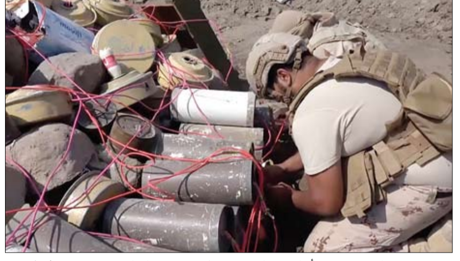
قوات التحالف العربي تنزع ألغام الميليشيات الحوثية في المدن المحررة بالساحل الغربي لليمن

وفدي الشرعية والانقلابيين. وحدد وفد الشرعية اليمنية بمشاورات السويد، أمس، شروطه المتعلقة بإعادة فتح مطار صنعاء وتشغيل ميناء الحديدة. وأشار الوفد إلى أن إعادة فتح مطار صنعاء لن يتم دون إية واضحة، وإشراف من الحكومة. وفيما يتعلق بميناء الحديدة، أكد الوفد على ضرورة إشراف الحكومة على الميناء، وذلك لضمان وصول المساعدات للمدنيين. ومن جانب آخر، قال وفد الشرعية، إن عدم تحقيق إنجاز في إجراءات بناء الثقة بمشاورات السويد مع المتمردين الحوثيين سيعقد الأزمة اليمنية، وسيصعب مناقشة الملفات الأخرى. وصرح عضو وفد الحكومة اليمنية وزير الدولة، عثمان مجلي لـ "سكاى نيوز عربية" قائلا: "إن نجاح مشاورات السلام في السويد مرهون بالتزام الطرف الحوثي بتفني ما تم بحثه في إجراءات بناء الثقة". وبين أن المشاورات لا تزال تتركز في ملفات محددة وأجراءات بناء الثقة، مضيفاً "طالبنا بانسحاب الميليشيات الحوثية من الحديدة وتسليمها لقوات وزارة الداخلية التابعة للحكومة الشرعية".