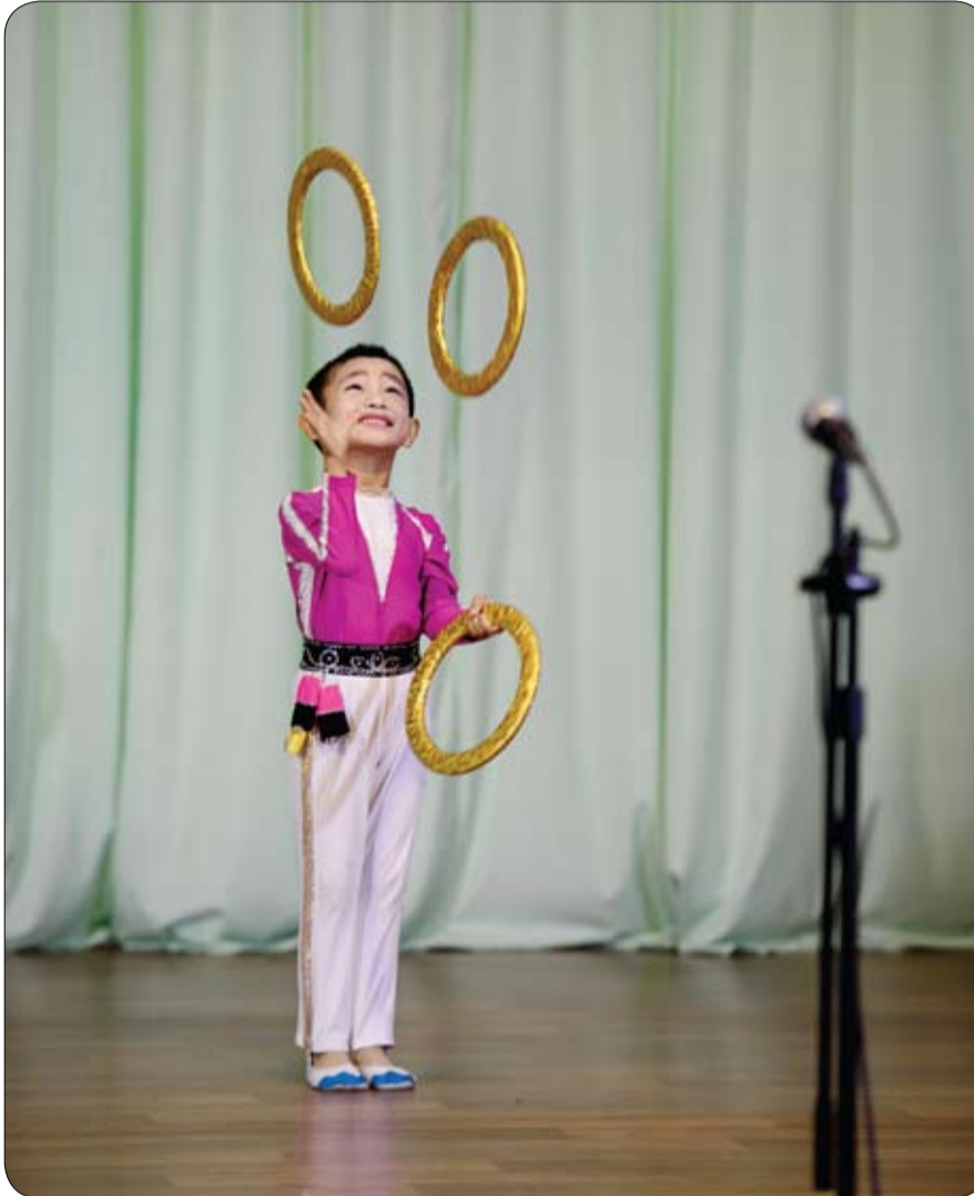
طفل في روضة سينويجو سيتي الحدودية في كوريا الشمالية يقدم عرضا ضمن مجموعة من الأطفال استمر لمدة ساعة. (أ ف ب)

قال علماء إن الحواصل لا ينبغي أن يتعرضن، ولو بكميات قليلة، لمبيدات حشرية مصنوعة من مجموعة كيميائيات ترتبط باضطرابات في النمو العصبي لدى الأطفال. وهذه المبيدات المعروفة بالمبيدات العضوية الفوسفاتية جرى تطويرها في الأساس كعازات للأعصاب وأسلحة حرب وأصبحت تستخدم اليوم في مكافحة الحشرات في المزارع وملاعب الجولف ومراكز التسوق والمدارس. ويمكن أن يتعرض الإنسان لهذه الكيمائيات عن طريق الغذاء أو الماء أو حتى الهواء. وقال علماء في بيان نشرته دورية (بلوس) الطبية إنه يتعين حظر هذه الكيمائيات تماما لأنه على الرغم من السماح باستخدامها في الزراعة بمستويات منخفضة في الوقت الراهن فإنها ترتبط بإعاقة ذهنية دائمة لدى الأطفال. وقالت إيفا إرتس بنتشوتو التي قادت فريق البحث وهي مديرة مركز علوم الصحة البيئية في كلية ديفيس للطب بجامعة كاليفورنيا لرويترز هيلث إنه على الرغم من زيادة الأدلة على وجود أضرار فإن العديد من الناس مازالوا يستخدمون المبيدات العضوية الفوسفاتية على نطاق واسع. وأضافت أن هذا قد يرجع لأسباب منها أن التعرض المستمر بمستويات منخفضة لا يسبب أعراضا ملحوظة في الأمد القريب مما يؤدي لافتراض خاطئ بأن التعرض لهذه المستويات المنخفضة لا يستدعي الاهتمام.