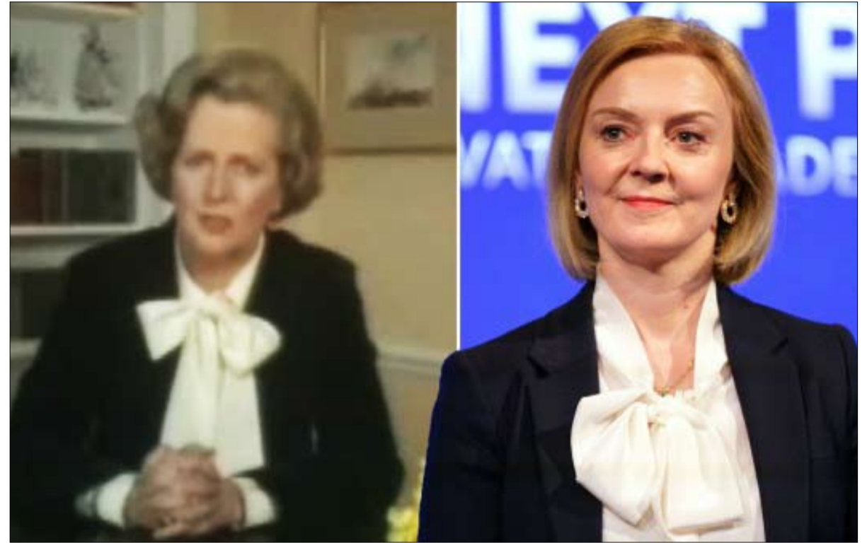
استعادة مارغريت تاتشر

سيتضرر الاتحاد البريطاني من عدم مرونة حكومة تروس. يُذكر أن القوميون الإيرلنديين الشماليين والإسكتلنديين هم الآن في السلطة في بلفاست واندنبر، ويهددون بمغادرة المملكة المتحدة.