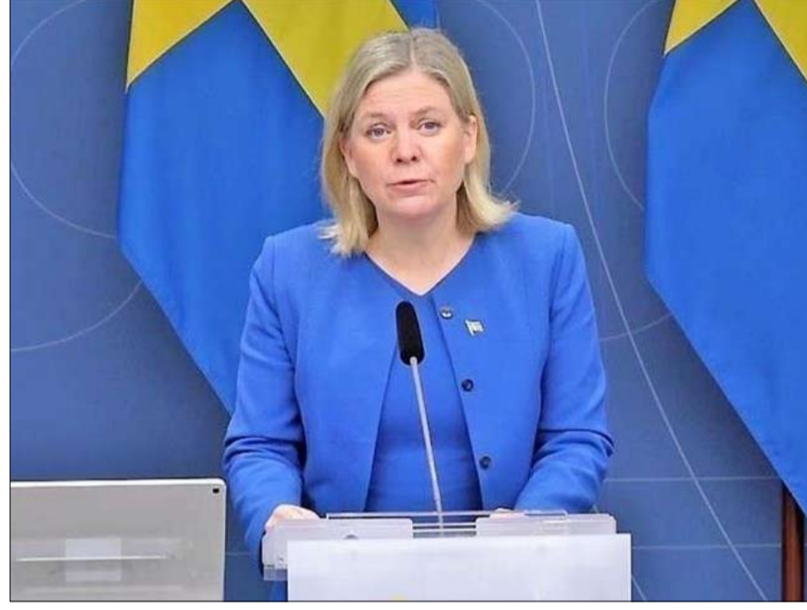
رئيسة الحكومة تعترف بهزيمتها

تخلق الأحداث اليومية شعوراً بعدم الأمان تجاه النظام العام