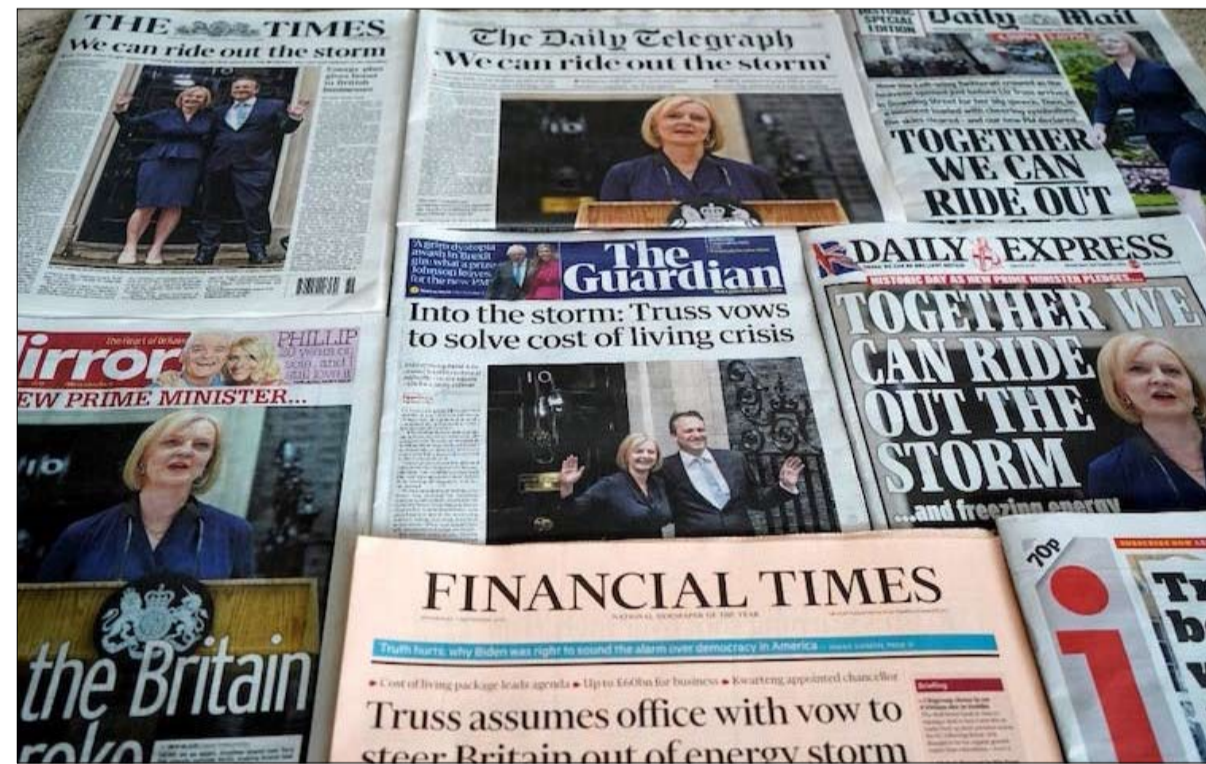
الصفحات الأولى للجراند البريطانية الرئيسية بعد انتصار ليز تروس