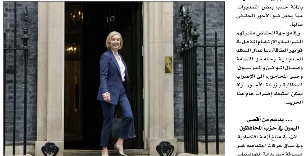
ليز تروس... أيام صعبة مع الاتحاد الأوروبي