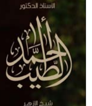
الاستاذ الدكتور شيخ الأزهر

كل مكان وهي أن كل لقاء جاد ومسؤول بين رموز الأديان يتحول -لا محالة - إلى طوق نجاة واقتلاعها من جذورها.