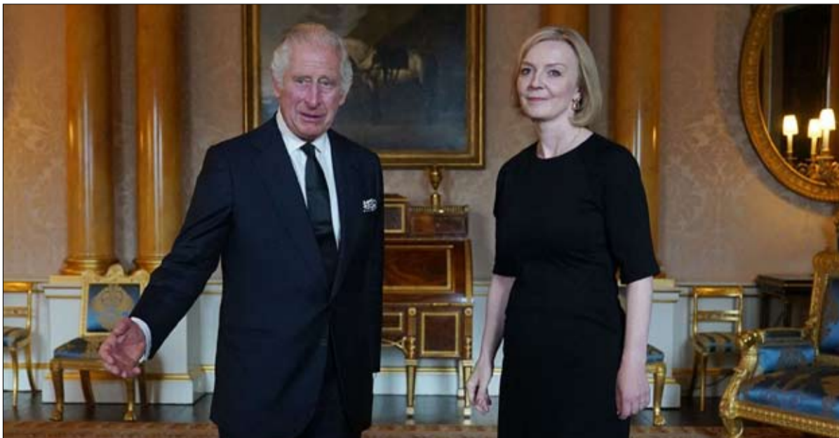
ملك جديد ورئيسة وزراء جديدة... بريطانيا تتغير