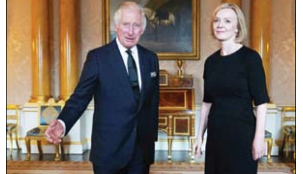
ملك جديد ورئيسة وزراء جديدة... بريطانيا تتغير

الروسية شمال شرق أوكرانيا، لاسيما في إقليم خاركيف. وقالت إن التقارير العديدة عن تصفيات فذتها الخدمات الخاصة والتشكيلات المسلحة للنازيين الجدد في الأراضي الأوكرانية التي انسحبت منها القوات الروسية تثير القلق، في إشارة إلى القوات الأوكرانية. كما اتهمت كييف بتصفية وقتل مدنيين، واصفة ما يحدث في خاركيف بأنه «خروج مطلق عن القانون ولا يتناسب مع أي قاعدة من قواعد القانون الدولي»، وفق تعبيرها. بالتزامن مع تحذيرات زاخاروفا، أعلن مجلس الأمن القومي الأمريكي أنه يحضر لحزمة مساعدات عسكرية جديدة من أجل دعم كييف. وكانت وزارة الدفاع الأمريكية أعلنت الشهر الماضي، مساعدة عسكرية جديدة لتلواوكران بقيمة 775 مليون دولار، تشمل خصوصاً منظومات مدفعية دقيقة من طراز هيمازس. يذكر أنه منذ انطلاق العملية العسكرية الروسية على أراضي الجارة الغربية، في 24 فبراير الماضي، اصطف الغرب، وفي مقدمتهم الولايات المتحدة، إلى جانب أوكرانيا داعماً إياها بالسلاح والعتاد.