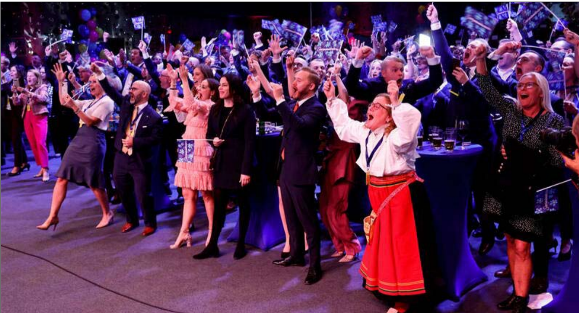
فرحة أنصار اليمين المتطرف في السويد

لقد وضعوا أنفسهم في مواجهة مع شريحة من السكان يعتبرونها مستحيلة الاندماج