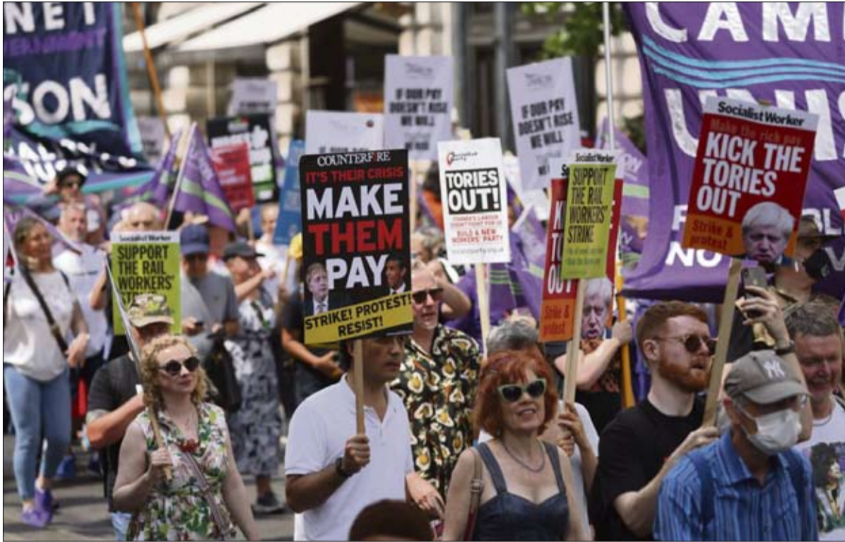
اضرابات وشتاء ساخن في بريطانيا