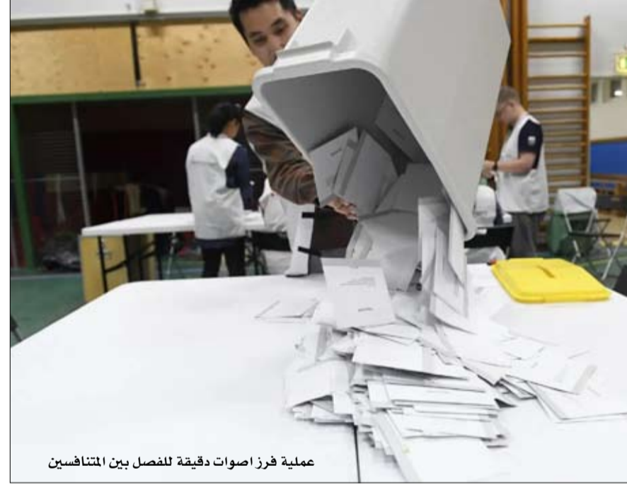
عملية فرز أصوات دقيقة للفصل بين المتنافسين

«ماذا يتحول سكان الشمال إلى اليمين المتطرف؟» - هناك مسألة الاندماج، وهي عملية تستغرق وقتاً. تتجدد الهجرة باستمرار، أولاً مع اللاجئين من أمريكا اللاتينية وجنوب غرب آسيا، ثم من الشرق الأدنى والشرق الأوسط وإفريقيا والبلقان... وهذا