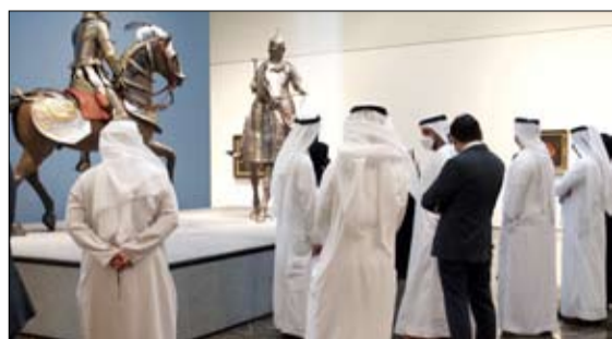
•• أبوظبي - الفجر

تزامناً مع اليوم العالمي للمهندس، نظمت بلدية مدينة أبوظبي، من خلال قطاع خدمات الدعم والمساندة ممثلاً في إدارة الموارد البشرية، زيارة خاصة للمهندسين المتميزين إلى متحف اللوفر أبوظبي، احتفاءً بجهودهم وتفانيهم وتميزهم في العمل. وهدفت الزيارة إلى مواكبة اليوم العالمي للمهندس والاحتفاء بمهندسي البلدية، وتقدير المهندسين المتميزين المرشحين من قطاعاتهم وتكريمهم على جهودهم للموسم في أداء مهامهم، ولرفع نسبة سعادة الموظفين وتشجيعهم على تقديم الأفضل ضمن بيئة العمل.