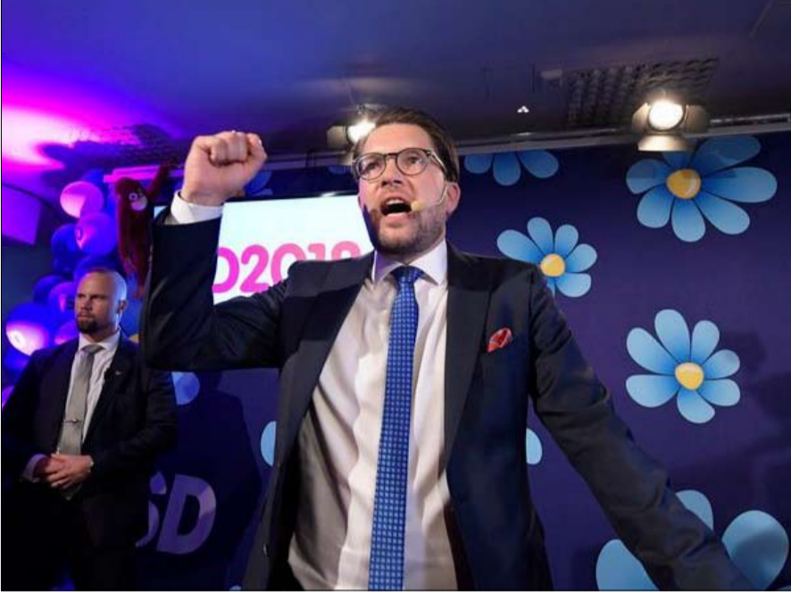
زعيم حزب الديمقراطيين السويديين الفائز الأكبر

نتيجة تاريخية. في السويد، تميزت الانتخابات العامة باختراق الحزب اليميني المتطرف، "ديمقراطي السويد"، وذلك بفضل تحالفهم مع تشكيله من اليمين التقليدي. وبـ 176 مقعداً،