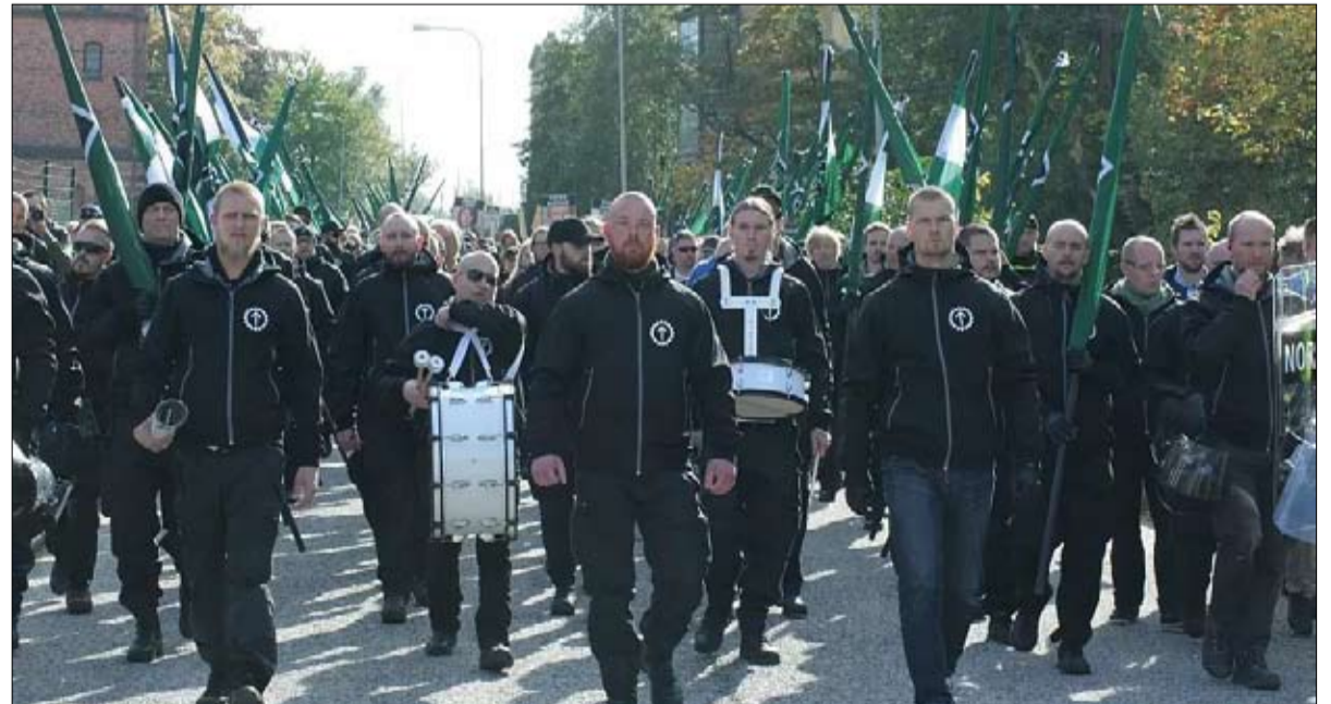
اليمين المتطرف يكتسح الشمال الأوروبي

وفي كل مرة، كان هؤلاء القراصنة يستغلون عيوباً في النظام لتشفير بيانات ضحاياهم ومطالبة هؤلاء بدفع آلاف الدولارات مقابل تزويدهم بمفتاح فك التشفير. وبعض ضحاياهم وافق على دفع الفدية المالية، ومن هؤلاء ملجأ للنساء المعتنفات في ولاية بنسلفانيا وقد دفع 13 ألف دولار لاستعادة بياناته ومنع الكشف عنها. وقال كريستوفر راي مدير مكتب التحقيقات الفدرالي في رسالة مصورة نشرت على موقع الـ "إف بي آي" الإلكتروني إن المتهمين الثلاثة "فقدوا عمليات قرصنة وسرقة معلوماتية وابتزاز، لتحقيق مكاسب شخصية في المقام الأول.. وفي الولايات المتحدة، شملت أهدافهم شركات صغيرة بالإضافة إلى شركة كهرباء ومستشفى للأطفال في بوسطن وبلديات واتحاد المحامين الأمريكيين إيه بي آيه.