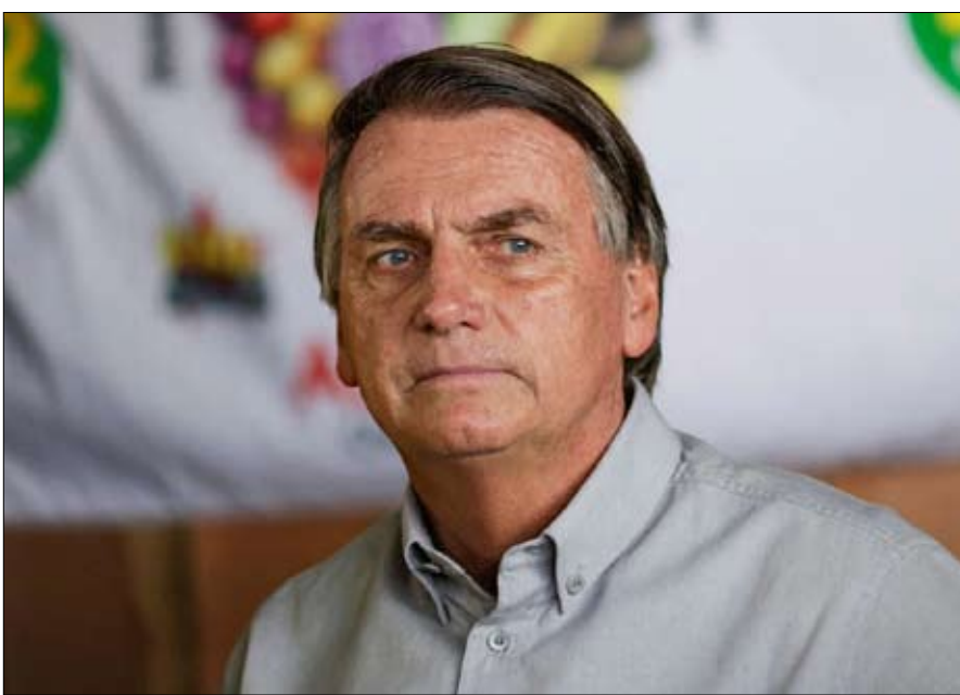
هل يرفض بولسونارو نتائج الصندوق؟