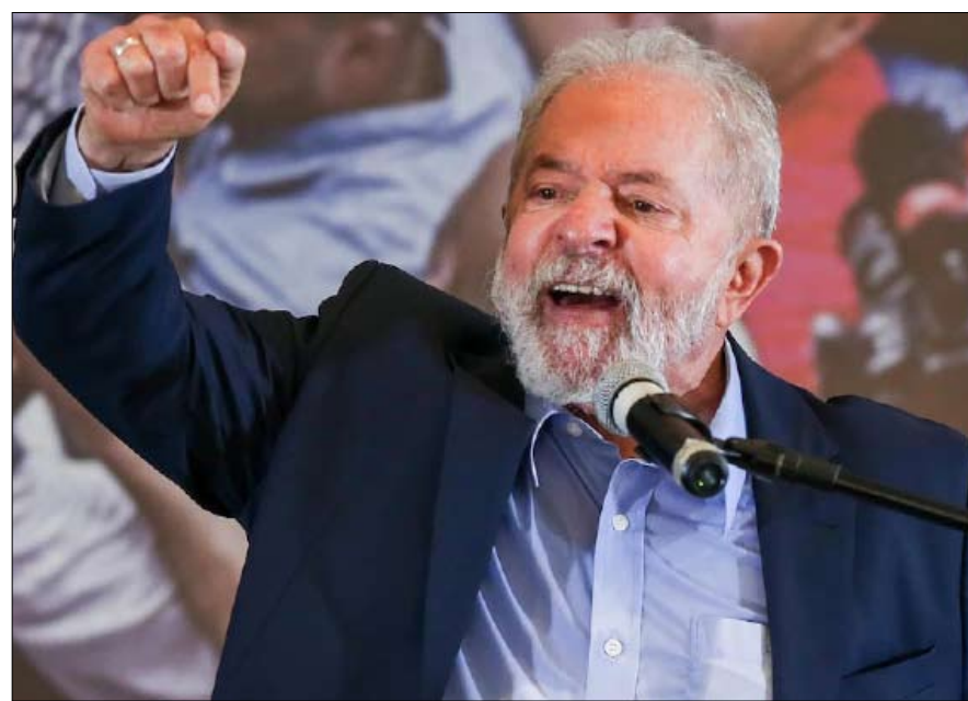
فوز لولا لن يلغي نفوذ منافسه