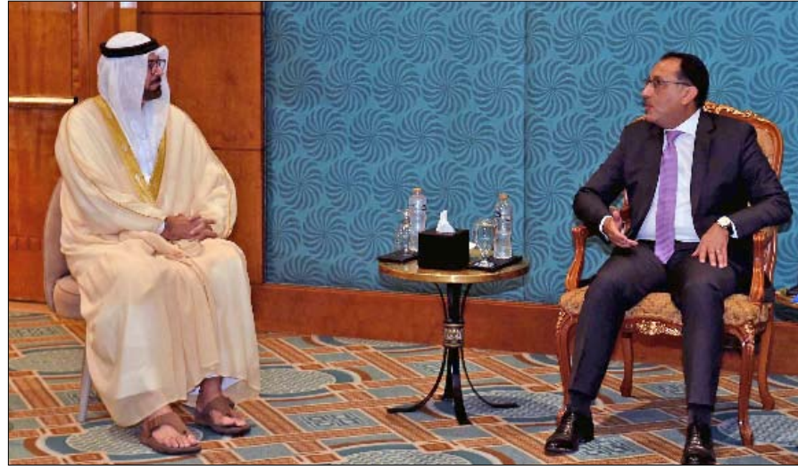
إضافة إلى نخبة من الشخصيات والإعلام والاقتصاد في البلدين، ضم بجانب الأهرامات يحضره الألاف من الشخصيات.

الأعمال والمتقنين والإعلاميين على مدار 3 أيام شعار الفعالية بأن الشعبين المصري والإماراتي.. دائماً على قلب رجل واحد وسيظل هذا التوافق والانسجام عنوان مسيرة العلاقات بينهما دائماً". يذكر أن فعاليات "مصر والإمارات قلب واحد" والتي تأتي في إطار الاحتفال بمرور 50 عاماً على تأسيس العلاقات بين البلدين، قد انطلقت في العاصمة المصرية، واستمرت لمدة 3 أيام، بحضور شخصيات دبلوماسية ووزراء من الجانبين الإماراتي والمصري،