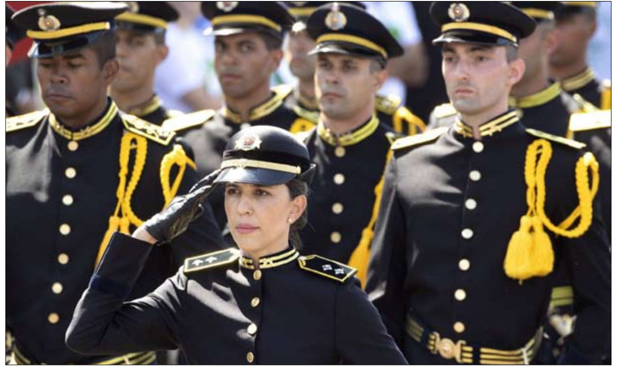
الجيش في كل مفاصل الادارة والدولة