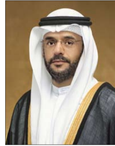
الذهبي، بما تتحلى به قواتنا المسلحة من بسالة وشجاعة في الذود عن تراب الوطن

أكد سمو الشيخ سلطان بن محمد بن سلطان القاسمي ولي عهد ونائب حاكم الشارقة، بمناسبة اليوبيل الذهبي للذكرى توحيد القوات المسلحة، أن هذا القرار التاريخي شكّل حجر الأساس في مسيرة بناء الوطن وترسيخ دعائم الاتحاد، حيث أسهم توحيد القوات المسلحة في تعزيز القدرات الدفاعية للدولة وتكامل منظومتها الأمنية، بما يواكب تطورات القيادة الرشيدة نحو مستقبل أكثر استقراراً وازدهاراً. وأضاف أن هذا الإنجاز مثل على مدار 50 عاماً نموذجاً رائداً في العمل المؤسسي المشترك، ورسخ مفاهيم الوحدة والتلاحم الوطني، التي كانت ولا تزال أساس قوة دولة الإمارات ونهضتها الشاملة. وأشاد سموه بمناسبة الاحتفال باليوبيل