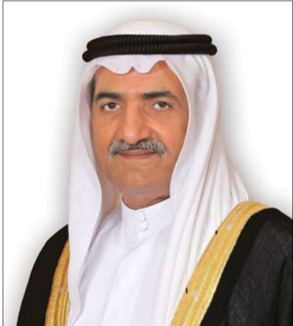
مكافة دولة الإمارات عربياً ودولياً، برؤية استراتيجية متزنة تجمع بين الحكمة والحزم، وترتكز على ترسيخ السلام، وبناء الشراكات

قيادة وشعباً، وأدام عليها نعمة الأمن والأمان".