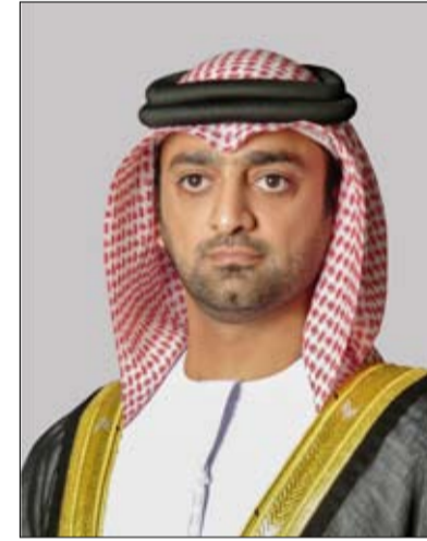
الشيخ عمار بن حميد النعيمي ولي عهد عجمان، إنه في هذا اليوم المبارك السادس من مايو، نقض بكل فخر واعتزاز أمام محطة وطنية خالدة في تاريخ دولتنا، نحتفي فيها بمرور خمسين عاماً على توحيد قواتنا المسلحة، ذلك القرار الذي جسد إرادة الوطن ورسخ دعائم الاتحاد، ووضع الأساس المتين لمسيرة أمن واستقرار بلادنا. وأضاف سموه في كلمة بمناسبة الذكرى الخمسين لتوحيد القوات المسلحة، أن السادس من مايو 1976 شكل لحظة فارقة في مسيرتنا الوطنية، يوم التفت فيه الرؤية الحكيمة بالإرادة الصادقة، حين اتخذ المغفور له الشيخ زايد بن سلطان آل نهيان، طيب الله تراه، وإخوانه حكام الإمارات، قرارهم التاريخي لتوحيد القوات المسلحة ضمن كيان عسكري موحد يعكس وحدة الرؤية وصلابة الموقف، ليكون ذلك تعبيراً حقيقياً لعنق الاتحاد وترجمة عملية لحرصهم على بناء قوة تحمي الوطن وتضامن منجزاته وتحفظ مستقبله. ورفع بهذه المناسبة الوطنية الغالية، أسمى آيات التهاني والتبريكات إلى مقام صاحب السمو الشيخ محمد بن زايد آل نهيان رئيس الدولة، القائد الأعلى للقوات المسلحة، "حفظه الله"، وإلى صاحب السمو الشيخ محمد بن راشد آل مكتوم نائب رئيس الدولة رئيس مجلس الوزراء حاكم دبي "رعاه الله"، وإلى إخوانهم أصحاب السمو الشيخ أعضاء المجلس الأعلى للاتحاد حكام الإمارات، وإلى سمو الشيخ منصور بن زايد آل نهيان نائب رئيس الدولة، نائب رئيس مجلس

قال سمو الشيخ عمار بن حميد النعيمي ولي عهد عجمان، إنه في هذا اليوم المبارك السادس من مايو، نقض بكل فخر واعتزاز أمام محطة وطنية خالدة في تاريخ دولتنا، نحتفي فيها بمرور خمسين عاماً على توحيد قواتنا المسلحة، ذلك القرار الذي جسد إرادة الوطن ورسخ دعائم الاتحاد، ووضع الأساس المتين لمسيرة أمن واستقرار بلادنا. وأضاف سموه في كلمة بمناسبة الذكرى الخمسين لتوحيد القوات المسلحة، أن السادس من مايو 1976 شكل لحظة فارقة في مسيرتنا الوطنية، يوم التفت فيه الرؤية الحكيمة بالإرادة الصادقة، حين اتخذ المغفور له الشيخ زايد بن سلطان آل نهيان، طيب الله تراه، وإخوانه حكام الإمارات، قرارهم التاريخي لتوحيد القوات المسلحة ضمن كيان عسكري موحد يعكس وحدة الرؤية وصلابة الموقف، ليكون ذلك تعبيراً حقيقياً لعنق الاتحاد وترجمة عملية لحرصهم على بناء قوة تحمي الوطن وتضامن منجزاته وتحفظ مستقبله. ورفع بهذه المناسبة الوطنية الغالية، أسمى آيات التهاني والتبريكات إلى مقام صاحب السمو الشيخ محمد بن زايد آل نهيان رئيس الدولة، القائد الأعلى للقوات المسلحة، "حفظه الله"، وإلى صاحب السمو الشيخ محمد بن راشد آل مكتوم نائب رئيس الدولة رئيس مجلس الوزراء حاكم دبي "رعاه الله"، وإلى إخوانهم أصحاب السمو الشيخ أعضاء المجلس الأعلى للاتحاد حكام الإمارات، وإلى سمو الشيخ منصور بن زايد آل نهيان نائب رئيس الدولة، نائب رئيس مجلس