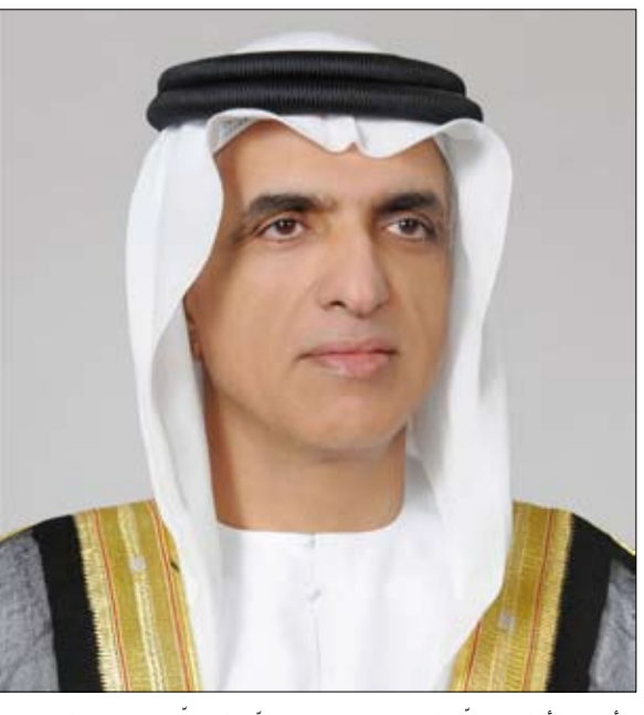
والأمن والأمان والعز والاستقرار، ويحفظ قواتنا المسلحة، ويؤيدها بنصره، ويعينها على واجباتها الوطنية، ويرحم شهداء وطننا الأبرار".

الثاقبة ويعد نظره الذي عزز الثقة لدى جميع أفراد المجتمع بأن دولة الإمارات "وطن أمن"، قادر بسواعد