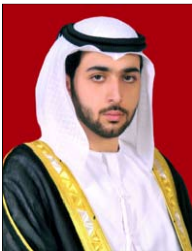
الشيخ محمد بن زايد آل نهيان

أكد سمو الشيخ راشد بن سعود بن راشد المعلا ولي عهد أم القيوين، أن ذكرى توحيد القوات المسلحة الإماراتية تشكل علامة فارقة ومحطة أساسية في مسيرة دولة الإمارات، إذ جسد يوم السادس من مايو 1976 النظرة الثاقبة والرؤية الاستشرافية للأبء المؤسسين، الذين أرسوا قواعد الاتحاد وقيمه الوطنية النبيلة، ووفرنا الضمانات التي تكفل للوطن رفقته وأمنه واستقراره. وقال سموه، في كلمة بمناسبة الذكرى الخمسين لتوحيد القوات المسلحة، إنه في السادس من مايو من كل عام يمر علينا حدث كبير ونستذكر نقطة تحول مهمة في تاريخ دولة الإمارات، وركيزة أساسية قام عليها صرح الاتحاد، حيث يصادف هذا التاريخ ذكرى قرار توحيد القوات المسلحة الإماراتية، لتبدأ بعدها مرحلة جديدة ويسواعد أبناء الإمارات الذين بنوا وعصرو وأرسوا أسس وقواعد الدولة الفتية، واستطاعوا أن يجعلوها نموذجاً تنموياً فريداً بإنجازات كبيرة نالت تقدير العالم واحترامه في مختلف المجالات". وأضاف، أننا نذكر اليوم بقواتنا المسلحة حيث