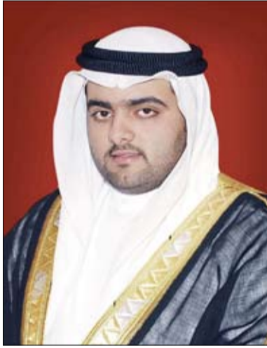
الشيخ محمد بن زايد آل نهيان

قال سمو الشيخ محمد بن حمد بن محمد الشرقي ولي عهد الفجيرة، إنه في ذكرى توحيد قواتنا المسلحة الإماراتية، نجدد عهد الولاء والإخلاص في القول والعمل لاتحاد دولة الإمارات، ورايتها الشامخة، وسيادتها الراسخة توحدنا عزيمة لا تلين، وتدفعنا للذود عن أرض إماراتنا الغالية همة عالية، تنتهج قيماً تجذرت في قلوبنا، هي قيم المغفور له الشيخ زايد بن سلطان آل نهيان، طيب الله تراه، وتواصل المسير تحت قيادة صاحب السمو الشيخ محمد بن زايد آل نهيان رئيس الدولة "حفظه الله"، مخلصين للعهد، وموفين الوعد، لتبقى راية الاتحاد ترفرف بالعز والشموع بين أمم العالم. وأضاف سموه في كلمة له بمناسبة الذكرى الخمسين لتوحيد القوات المسلحة، أنه في هذه الذكرى الوطنية الغالية، نعتز بجنود قواتنا المسلحة في البر والبحر والجو، صفور الإمارات وأبطالها الأوفياء، الذين بذلوا أرواحهم وواصلوا الليل بالنهار تنعم هذه الأرض ومن عليها بالأمم والأمان والاستقرار رغم كل الظروف.