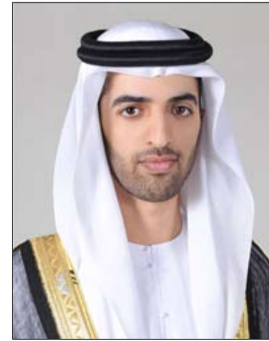
الشيخ محمد بن سعود بن صقر

أكد سمو الشيخ محمد بن سعود بن صقر القاسمي ولي عهد رأس الخيمة، أنه في هذا اليوم المجيد، السادس من مايو، نستحضر بكل اعتزاز مرور خمسين عاماً على توحيد قواتنا المسلحة؛ خمسة عقود رسّخت خلالها هذه المؤسسة الوطنية صروح العزة والمنعة، وشكلت الركيزة الراسخة لاتحادنا، والحصن الحصين لصون سيادتنا واستقلالنا. والقوات المسلحة، إننا، إذ نحيي هذه المناسبة الخالدة، نستذكر بإجلال الرؤية الحكيمة للأبء المؤسسين، وفي مقدمتهم المغفور له الشيخ زايد بن سلطان آل نهيان "طيب الله تراه"، الذي أرسى منذ البدايات دعائم جيش وطني موحد، مؤمناً بأن حماية المكتسبات وصناعة المستقبل لا تتحققان إلا بوحدة الصف وقوة السلاح، تحت راية واحدة وعقيدة راسخة تدود عن حيض الوطن وتضامن مقدراته. وتقدم سموه في هذه المناسبة العزيزة، بأسمى آيات التهاني والتبريكات إلى مقام صاحب السمو الشيخ محمد بن زايد آل نهيان، رئيس الدولة، القائد الأعلى للقوات المسلحة "حفظه