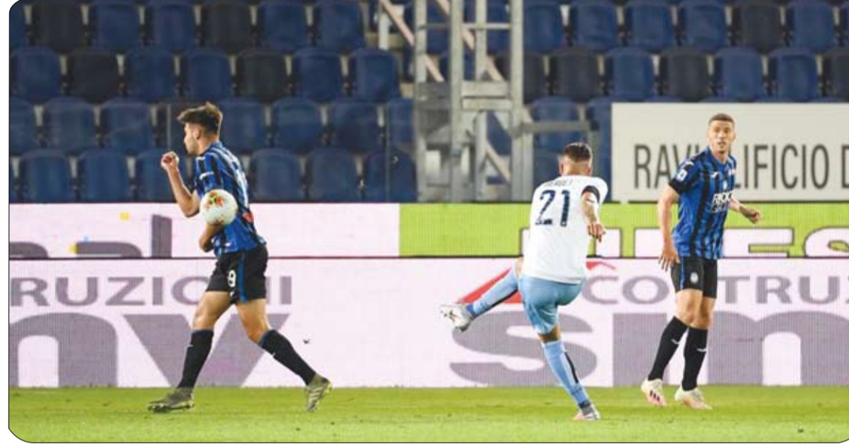
ضيفا على لاتسيو في مباراة قوية بين الفريقين الوحيدين الى سيمودوريا السبت الى فوز 3-2. وفي مباراة أخرى، يحل أتالانتا

أن حلاً في المركزين الثالث والرابع تواليا بفارق خمس نقاط فقط عن فريق "السيدة العجوز" (أتالانتا ثالثاً بفضل المواجهتين المباشرتين). وقاد لاتسيو هدف الدوري في الموسم الماضي تشيرو ايبوبيلي وصاحب الحذاء الذهبي الاوروبي (36 هدفاً) الذي جدد عقده مع نادي العاصمة حتى عام 2025. وساهم امبولي في فوز فريق المدرب سيموني انزاغي -2 صفر أمام كالياري في المرحلة الثانية بتسجيله الهدف الثاني في اللقاء. ويدرك لاتسيو مدى صعوبة المهمة أمام أتالانتا الذي أعلن عن نواياه منذ بداية الموسم بتفوقه 4-2 على تورينو، هو الذي قدم كرة قدم استثنائية الموسم الماضي بقيادة مدربه جان بييرو