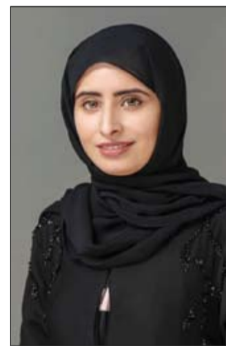
صممت برنامجاً تدريبياً لأطباء مراكز الرعاية وطاقم التمريض، لتدريبهم على كيفية استخدام الأداة وتطبيق سياسة الإحالة والكشف المبكر

• دبي - الفجر البرامج النوعية التي أطلقتها المؤسسة ونفذت من خلاله نظاماً إلكترونياً لبرنامج الكشف المبكر للتوحد حيث تم إدراج أداة القياس المعتمدة M-CHAT-R وتبنيها تلقائياً وتحديد آلية التحويل للحالات الإيجابية إلكترونياً للمنشآت المختصة في أواخر عام 2022، كما استحدثت سياسة الكشف المبكر عن اضطراب طيف التوحد في مراكز الرعاية الصحية الأولية، ويتضمن برنامج الكشف المبكر عن التوحد على تنفيذ التقييم الأولي في مراكز الرعاية للأطفال ما بين عمر 18 إلى 24 شهراً، وبالتالي تقييم الحالات وتوفير التدخل المبكر للحالات التي تستدعي ذلك، وتوفير الدعم اللازم لذوي الطفل. وأكدت المهيري أن البرنامج يعمل على الكشف المبكر لاضطراب طيف التوحد