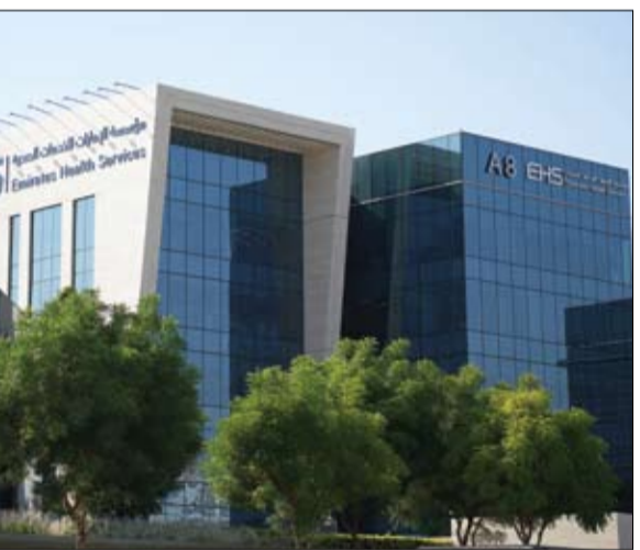
لاضطراب طيف التوحد. وأضافت أن المؤسسة تعتبر من الجهات الصحية الرائدة في مجال الكشف المبكر عن التوحد، لتسهيل وتسريع البدء

بالعلاج المبكر، مشيراً إلى الإعلان عن أعداد الفحوصات من خلال البرنامج جاء في شهر التوحد الذي ترتفع فيه جهود المؤسسة نحو تعزيز الوعي المجتمعي بهذا الاضطراب، وتنظم إلى جانب جهودها الطبية العملية من حيث الفحوصات والعلاج، باقة من الفعاليات والأنشطة والبرامج والمحاضرات التي تستهدف جميع الكوادر الطبية والتمريضية، والمنعنين بطبقات الرعاية الصحية، إضافة إلى مختلف أفراد المجتمع. كما نظم قسم التمريض في مستشفى أم القيوين احتفالية اليوم العالمي للتوحد خلال شهر أبريل الحالي من خلال إرسال نشرات توعوية لجميع العاملين على مدار الأسبوع، حول اضطراب طيف التوحد، وذلك في إطار رفع الوعي به وكيفية العناية بهذه الفئة، كما قام قسم الخدج بعمل توعية باضطراب التوحد لجميع زوار ومراسلي المستشفى، وتعريفهم بهذه الفئة وما هي الأعراض التي يمكن أن يلاحظها الأهل بشكل مبكر لتسهيل العلاج.