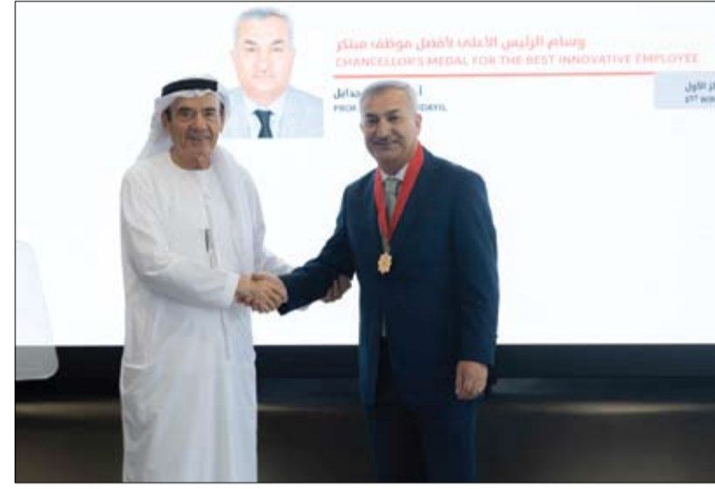
لوطننا نحو المستقبل تستدعي منا مضاعفة الجهود للوصول إلى أعلى مستويات الكفاءة والتميز. ومُنحت الجوائز في ثلاث فئات رئيسية شملت

• العين - الفجر نظمت جامعة الإمارات العربية المتحدة حفل تكريم للفائزين بجائزة الرئيس الأعلى للتميز المؤسسي في دورتها الرابعة لعام 2024، بحضور معالي زكي أنور نسيبة - الرئيس الأعلى للجامعة، المستشار الثقافي لصاحب السمو رئيس الدولة، وسعادة العميد الشيخ محمد عبد الله العلاء - مدير الإدارة العامة للتميز والريادة في شرطة دبي، وقيادات الجامعة والفائزين. وأكد معالي زكي نسبة على الدور الاستراتيجي الذي تلعبه الجامعة في تعزيز مسيرة التميز والابتكار في الدولة، مشيراً إلى الالتزام الثابت برؤية الإمارات 2031 وأهداف مئوية الإمارات 2071، وأثنى معاليه على الجهود المبذولة من قبل الفائزين للمساهمة في رفع مستويات الأداء والتميز في الجامعة. وفي ختام كلمته، أشار معاليه إلى أن الجامعة ستستمر في دعم وتحفيز جميع العاملين والطلاب على الابتكار والتطور المستمر،