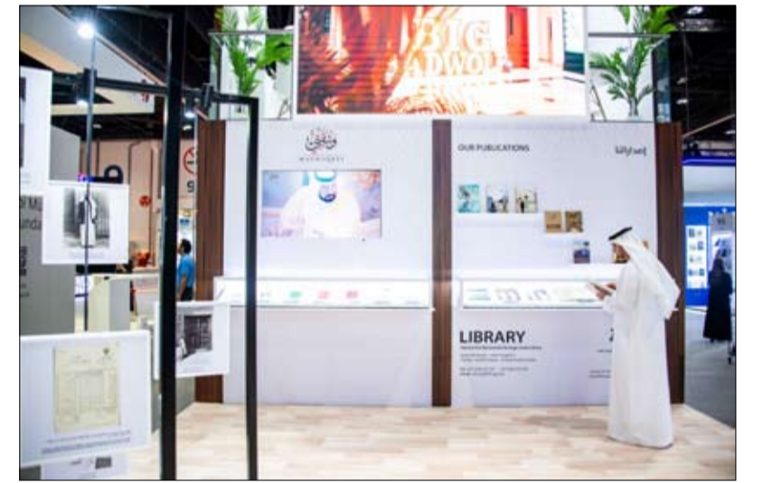
فاطمة بن حريز: منصة هدفها الاستدامة