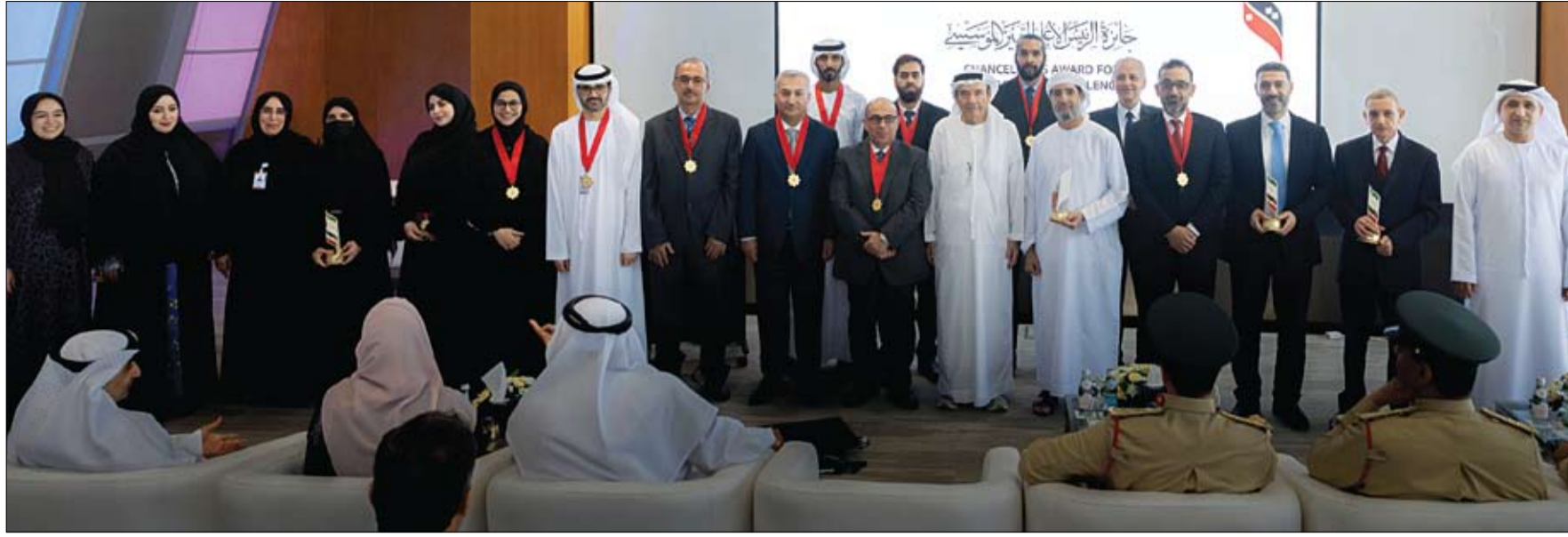
في دورتها الرابعة لعام 2024