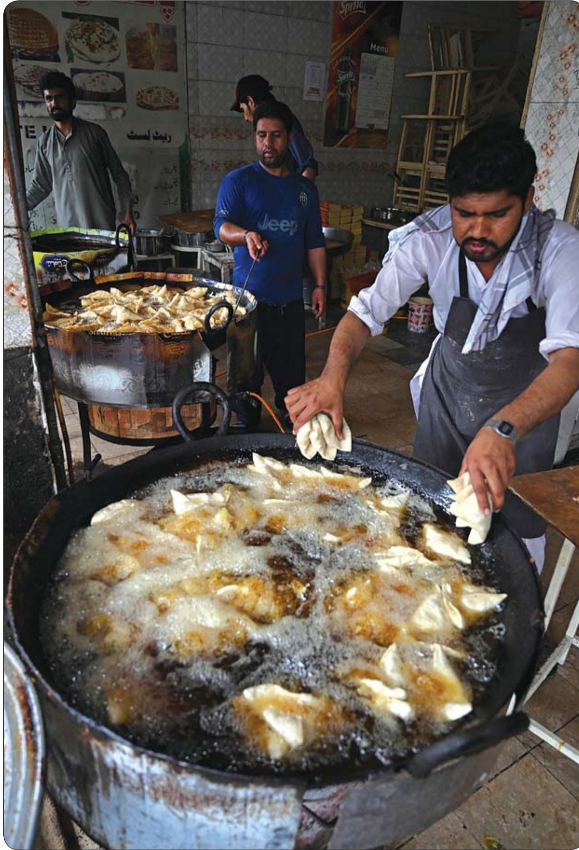
خيازون يعدون طعام الإفطار للمسلمين المصلين لتناول الإفطار في اليوم الأول من شهر رمضان المبارك، في متجر في إسلام آباد