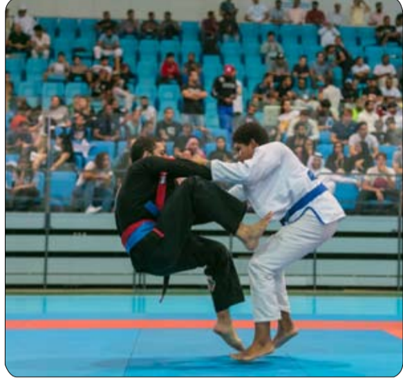
مناطق مختلفة من مدينة محمد بن راشد يومي الخميس والجمعة 28 و29 مارس في الصالة الرئيسية، وتقام منافسات الدراجات الهوائية في شارع ميدان 30 و31 مارس.

على مستوى العالم، ومنذ الإعلان عن موعد انطلاق البطولة، كان هناك إقبالاً كثيفاً على التسجيل من قبل لاعبي الأندية والأكاديميات من الجنسين والفئات الوزنية المختلفة. وانطلقت مساء أمس منافسات بطولة البادل وتستمر حتى يوم الأحد 9 أبريل، على أن تقام منافسات بطولة القوس والسهم في الصالة الرئيسية بمجمع ند الشبا الرياضي على مدار يومي الأحد والاثنين 26 و27 مارس في الصالة الرئيسية، وتقام منافسات ند الشبا الرياضية، تعقبها منافسات بطولة المبارزة التي تقام يومي