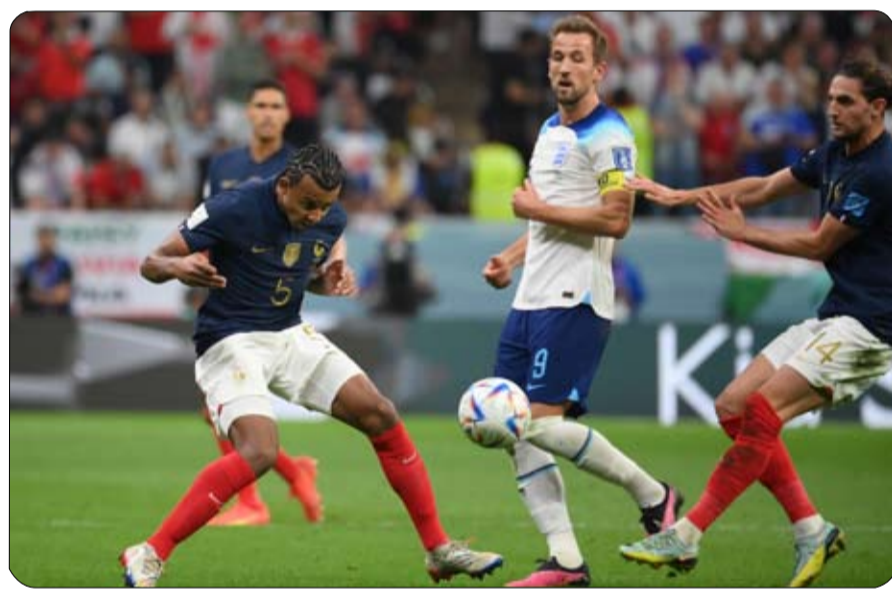
القيادة حفازاً إضافياً لمبابي الذي توج هدافاً لوندبال 2022 برصيد 8 أهداف، ويبدو مرشحاً لتحطيم العديد من الأرقام القياسية مع منتخب بلاده في السنوات المقبلة. وفيما فقد المنتخب الفرنسي فرصة الدفاع عن لقبه العالمي بالخسارة أمام المنتخب الأرجنتيني، ودع المنتخب الهولندي بقيادة مديره الفني السابق لويس فان جال البطولة من دور الثمانية بالهزيمة أمام المنتخب الأرجنتيني

بركلات الترحيح أيضاً. ويخوض المنتخب الهولندي تصفيات يورو 2024 بإدارة فنية جديدة من خلال عودة رونالد كومان لمنصب المدير الفني خلفاً للمدرب فان جال. وسبق للمنتخبين الفرنسي والهولندي أن التقيا مراراً، وكانت آخر المواجهات بينهما في دور المجموعات لبطولة دوري أمم أوروبا عام 2018، وفاز المنتخب الفرنسي 2-1 على ملعبه ذهاباً ثم فاز المنتخب الهولندي 2-0 على ملعبه إياباً. وإلى جانب هذه المباراة، تشهد المجموعة الثانية غداً أيضاً مباراة أخرى بين منتخبين جيل طارق اليونان. وفي باقي المباريات غداً، تلحق السويد مع بلجيكا، والنمسا مع أذربيجان في المجموعة السادسة، وبلغاريا مع مونتenegro (الجيل الأسود)، وصربيا مع ليتوانيا في المجموعة السابعة، والتشيك مع بولندا، ومولدوفا مع جزر فارو في المجموعة الخامسة.