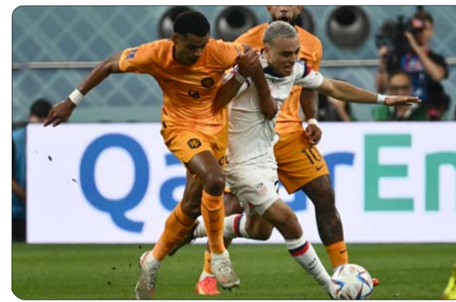
أمس قبل الأول الثلاثاء منح شارة قائد الفريق إلى مبابي بعد اعتزال زميله حارس المرمى هوجو لوريس في أعقاب كأس العالم. وتمثل شارة الذي يمثل أحد أهم العناصر التي يعول عليها الفريق في هذه التصفيات، وقرر ديدييه ديشان المدير الفني للمنتخب الفرنسي

بعد 3 شهور فقط من خسارته المباراة النهائية لبطولة كأس العالم 2022 لكرة القدم، سيكون المنتخب الفرنسي بطل العالم السابق على موعد مع مواجهة صعبة في بداية رحلة البحث عن مقعد له في بطولة كأس الأمم الأوروبية القادمة (يورو 2024). ويستضيف المنتخب الفرنسي نظيره الهولندي اليوم الجمعة في افتتاح مسيرته بالتصفيات، لتكون مواجهة مبكرة على صدارة المجموعة الثانية، طبقاً لعظم التوقعات التي سبقت هذه التصفيات. وتستحوذ المباراة بين منتخبين فرنسا وهولندا على معظم الاهتمام من بين جميع المباريات الثمانية، التي تقام اليوم ضمن منافسات الجولة الأولى من التصفيات، وتأتي المباراة بعد 3 شهور من خسارة المنتخب الفرنسي أمام نظيره الأرجنتيني بركلات