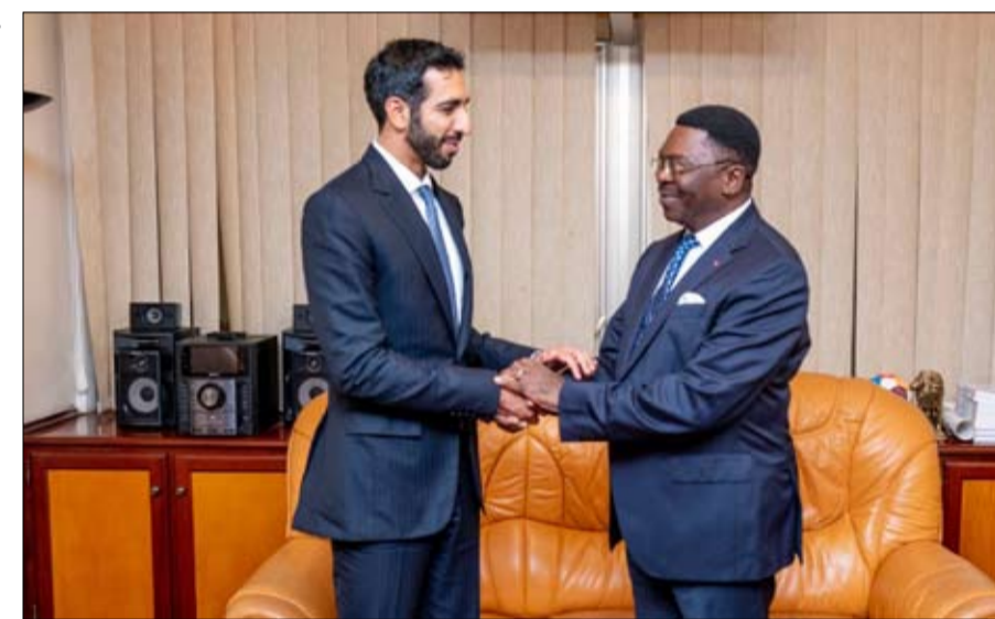
شخبوط بن نهيان خلال لقائه رئيس الوزراء والأمين العام للرئاسة في الكامبيرون

سلطت معالي مريم بنت محمد المهيري، وزيرة التغير المناخي والبيئة الضوء على جهود دولة الإمارات لتوسيع نطاق العمل الجماعي والتعاون الدولي، وتطوير حلول مبتكرة لمواجهة التحدي العالمي المتمثل في ندرة المياه، وذلك خلال ترأس معاليها وفد دولة الإمارات خلال أعمال مؤتمر الأمم المتحدة للمياه 2023 الذي انطلقت فعالياته أمس الأول في مدينة نيويورك الأمريكية، وتستمر فعالياته حتى اليوم الجمعة الموافق 24 مارس.