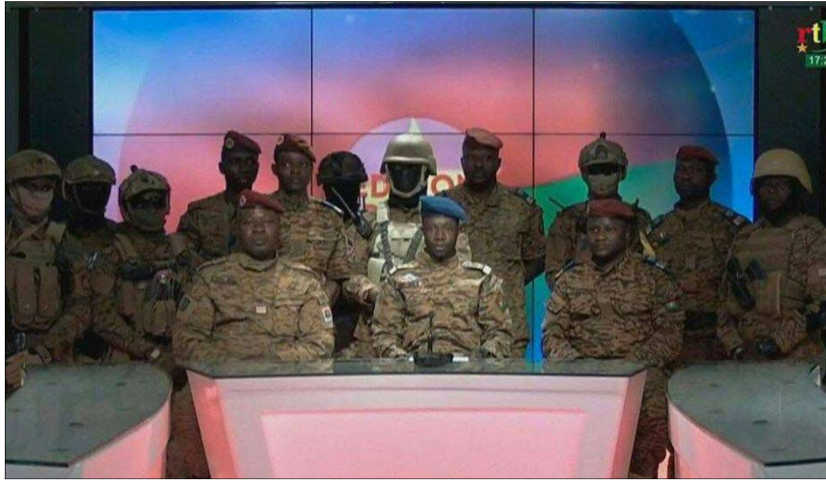
جنود يعلنون في راديو وتليفزيون بوركينا استيلاءهم على السلطة

أكد الزميل الباحث في دراسات الدفاع والسياسة الخارجية تيد غالين كارينتر في مجلة "ناشيونال إنترست" أن حكومات حلف شمال الأطلسي ووسائل الإعلام الغربية مستاءة من الرئيس الروسي فلاديمير بوتين بسبب مطالبته بالحصول على ضمانات أمنية. ويريد الكرملين على وجه الخصوص ضمانات بخفض الحلف انتشاره العسكري في أوروبا الشرقية، ورفض عضوية أوكرانيا فيه. ومن المنير للدهشة في الجوهر والشكل، أن يكون موقف موسكو وقع الفاجأ على الولايات المتحدة ومسؤولي حلف شمال الأطلسي، علماً أن القادة الروس كانوا غاضبين من تجاوز حلف الأطلسي للمنطقة الأمنية التي تقيدها روسيا، منذ سنوات. وفي الواقع، اشكى الرئيس الروسي السابق بوريس يلتسين من التوسع الأول للحلف الذي شملت بولندا، وتشيكيا، والمجر في 1998.