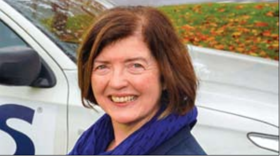
سو جري هي المسؤولة عن التحقيق في بارتني غيت

تم اختيار سو جري للتحقيق في بارتني غيت، وسيكون للنتائج التي ستوصل إليها تأثير حاسم على الحياة السياسية في المملكة المتحدة. إن السلطة السياسية البريطانية معلقة على شفتيها، فكبيرة الموظفين سو جري هي المسؤولة عن قيادة التحقيق في السهرات التي نظمت في داوونج ستريت في عز الحجر الصحي شامل. (التفاصيل ص15)