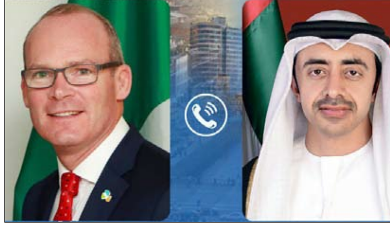
وتقدم معاليه بالتعازي إلى دولة الإمارات في ضحايا الهجوم الإرهابي - الذي وقع يوم 17 يناير الجاري - وأعرب عن تمنياته بالشفاء للعاجل لجميع المصابين.

أدانت جمهورية إيرلندا الهجوم الإرهابي لميليشيا الحوثي الإرهابية على مناطق ومنتشآت مدينة على الأراضي الإماراتية وذلك خلال اتصال هاتفي بين سمو الشيخ عبدالله بن زايد آل نهيان وزير الخارجية والتعاون الدولي ومعالي سيمون كوفيني وزير الخارجية والدفاع في جمهورية إيرلندا. وأكد معاليه خلال الاتصال الهاتفي إدانته الشديدة للاعتداءات الإرهابية لميليشيا الحوثي والتي تشكل تهديداً للأمن واستقرار المنطقة بأسرها.