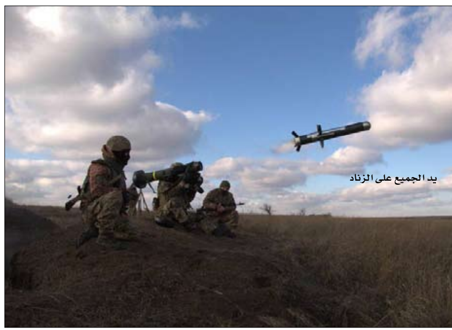
يد الجميع على الرزاق