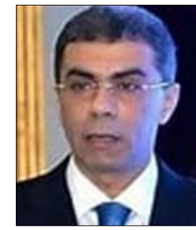
ورئيس تحرير جريدة الاخبار الاسبق عضو مجلس إدارة جائزة الصحافة العربية، الذي انتقل إلى

رحمة الله تعالى صباح امس، داعين المولى عز وجل أن يتغمد الفقيد بواسع رحمته وأن يدخله فسح جناته ويلهم أهله وذويه الصبر والسلوان. وأكدت الجمعية على الدور الكبير الذي ساهم به الراحل في الصحافة المصرية والعربية ودوره الثقافي في مجلس نقابة الصحفيين المصريين التي أسست 12 عاماً، وحسه للضحايا تجاه وطنه وأمة العربية، وأدى رسالته على الوجه الاكمل. إن الله وإنا إليه راجعون ..