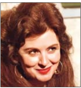
غوغل يحتفل بالذكرى ميلاد

كانت سفينة سياحية في طريقها إلى مدينة ميامي بولاية فلوريدا الأمريكية، لكنها غيرت طريقها إلى جزر البهاما. وجاء قرار قبطان السفينة بعدما أصدر القضاء الأمريكي مذكرة لتوقيف السفينة، نتيجة لتراكم فواتير الوقود غير المسددة، على ما أوردت شبكة "سي إن إن" الأمريكية. وفي حال واصلت السفينة "Crystal Symphony" مسارها إلى مدينة ميامي، فسيكون مصيرها المصادرة على أيدي السلطات الأمريكية. ولذلك، حوّل طاقم السفينة المسيرة نحو ميناء بيميني في جزر البهاما، حيث لا تزال راسية هناك، بحسب ما يظهر موقع تتبع حركة السفن.