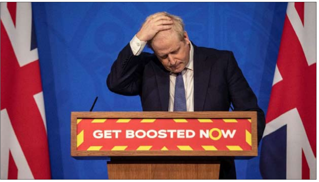
بوريس جونسون على كرسي هزاز