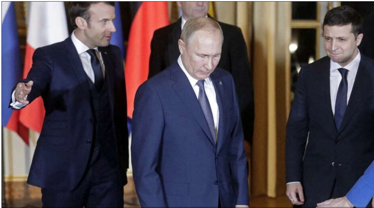
ماذا يريد القيصر بوتين؟