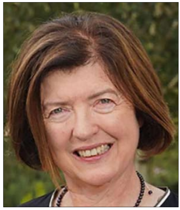
سو جراي هي المسؤولة عن التحقيق في بارتني غيت

•• الفجر -خيرة الشيباني تم اختيار سو جراي للتحقيق في بارتني غيت، وسيكون للنتائج التي ستتوصل إليها تأثير حاسم على الحياة السياسية في المملكة المتحدة. إن السلطة السياسية البريطانية معلقة على شفتيها، فكبيرة الموظفين سو جراي هي المسؤولة عن قيادة التحقيق في السهرات التي نُظمت في داونونغ ستريت في عزّ الحجر الصحيّ الشامل. تتالت الفضائح، ويتعلق الكشف الأخير، هذا الإثنين، بحفل عيد ميلاد نظمته زوجة بوريس جونسون خلال فترة الحجر الصحي الأول عام 2020، وفقاً لما ذكرته قناة أي تي في.