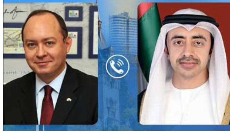
الاجتماع الهاتفي .. وأعرب عن تمنياته بالشفاء وسلامة مواطنيها وسيادة أراضيها. وتقدم بالتعازي إلى دولة الإمارات في ضحايا هذا الهجوم الإرهابي .. وأعرب عن تمنياته بالشفاء للعاجل لجميع المصابين.

أدانت جمهورية رومانيا الهجوم الإرهابي لميليشيا الحوثي الإرهابية على مناطق ومنتشآت مدينة على الأراضي الإماراتية - الذي وقع يوم 17 يناير الجاري - وذلك خلال اتصال هاتفي بين سمو الشيخ عبدالله بن زايد آل نهيان وزير الخارجية والتعاون الدولي ومعالي بوغدان أوريسكو وزير خارجية رومانيا. وأدان معاليه واستنكر بشدة الهجوم الإرهابي لميليشيا الحوثي الإرهابية الذي أسفر عن سقوط ضحايا مدنيين .. مؤكداً أن استمرار هذه الاعتداءات الإرهابية يقوض جهود تحقيق الأمن والاستقرار في المنطقة.