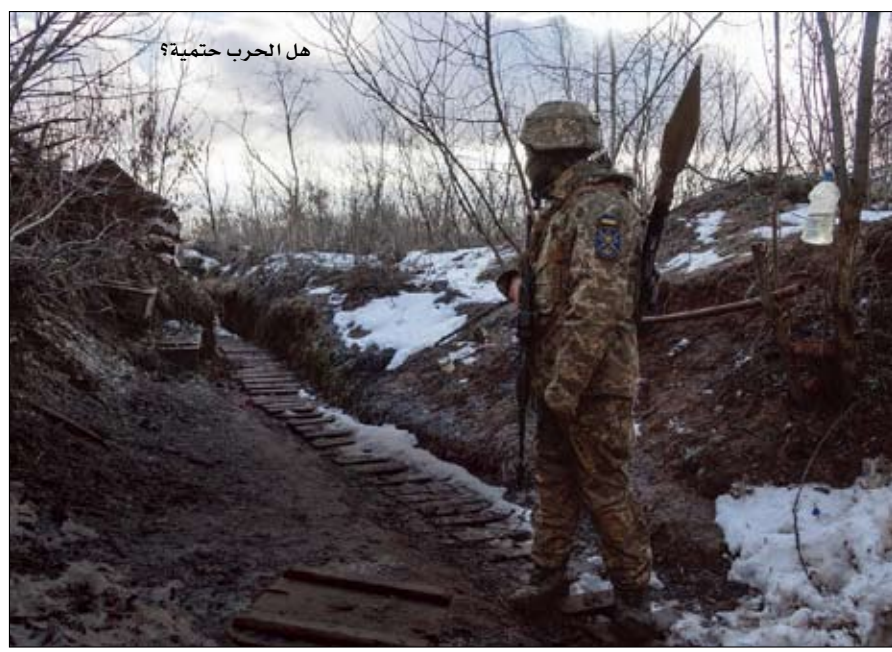
هل الحرب حتمية؟