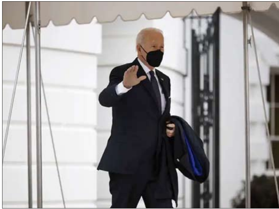
بايدن بين المطرقة والسندان

وهو بذلك يأخذون المشكلة من الزاوية الخطأ لأن الهدف النهائي لروسيا سياسي، وهو