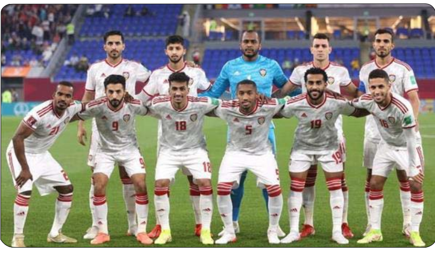
وممثلي المنتخبين، وتم خلاله والتتنظيمية، وتقرر أن يرتدي منتخبنا الوطني اللون الأبيض الأحمر.