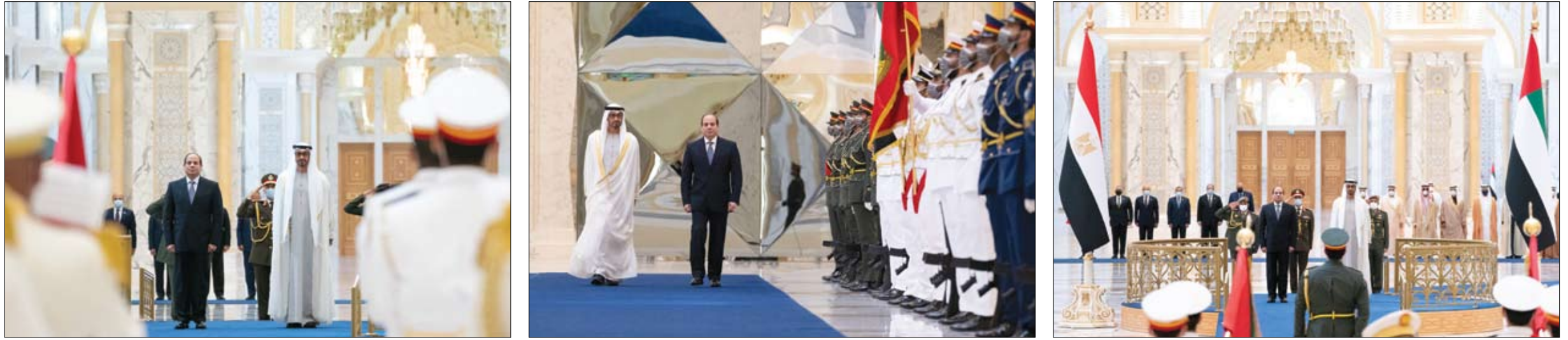
الرئيس المصري يؤكد تضامن بلاده مع الإمارات جراء الهجوم الإرهابي الأخير

بعث صاحب السمو الشيخ خليفة بن زايد آل نهيان رئيس الدولة حفظه الله برقية تهنئة إلى فخامة رام نات كوفيند رئيس جمهورية الهند وذلك بمناسبة يوم الجمهورية لبلاده. كما بعث صاحب السمو الشيخ محمد بن راشد آل مكتوم نائب رئيس الدولة رئيس مجلس الوزراء حاكم دبي "رعاه الله" وصاحب السمو الشيخ محمد بن زايد آل نهيان ولي عهد أبوظبي نائب القائد الأعلى للقوات المسلحة برقيتي تهنئة مماثلتين إلى فخامة رئيس جمهورية الهند. وبعث صاحب السمو الشيخ محمد بن راشد آل مكتوم وصاحب السمو الشيخ محمد بن زايد آل نهيان برقيتي تهنئة مماثلتين إلى دولة ناريندرا مودي رئيس وزراء جمهورية الهند.