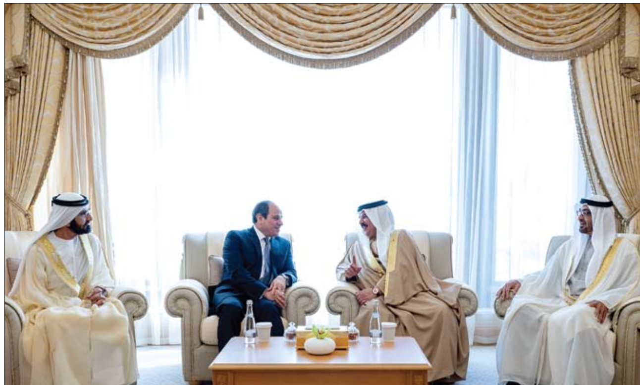
محمد بن راشد ومحمد بن زايد وحمد بن عيسى والسيسي خلال قمتهم

وتطرق القادة خلال قمتهم التي عقدت في قصر الوطن في أبوظبي - إلى الهجمات الإرهابية التي نفذتها ميليشيا الحوثي على مواقع ومنشآت مدنية في دولة الإمارات واطلاقها صاروخين بالستين تجاه الدولة مواصلة اعتداءاتها التي تشكل تهديداً خطيراً لأمن المنطقة واستقرارها.. مؤكداً أن هذه الممارسات العدوانية تنتهك كل القوانين والأعراف الدولية وتمس بالأمن والسلم الدوليين.. ودعوا المجتمع الدولي إلى اتخاذ موقف موحد وحازم تجاه هذه الميليشيات وغيرها من قوى الإرهاب وداعميها. (التفاصيل ص3)