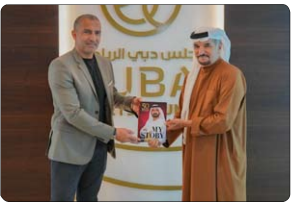
مع العديد من الأندية الخليجية حيث لعب مع أندية الريان وأم صلال والخريطات، وبدأت مسيرته التدريبية حينما تولى مهمة تدريب