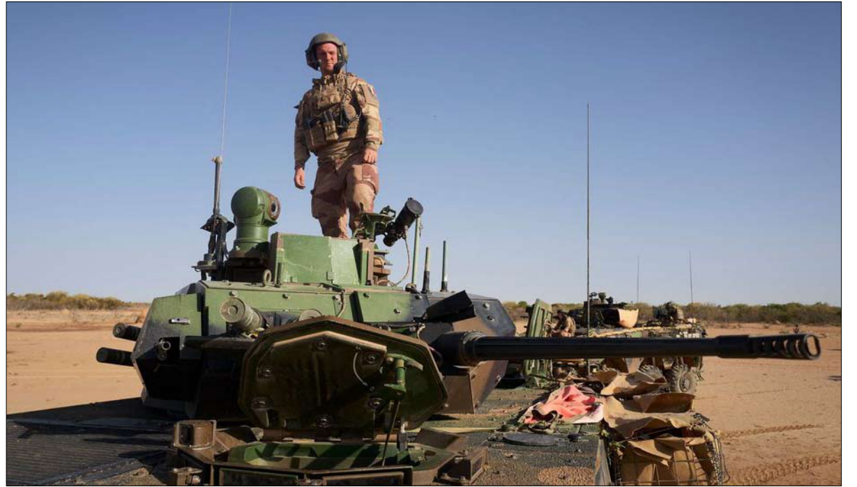
جندي فرنسي من عملية برخان شمال بوركينا فاسو