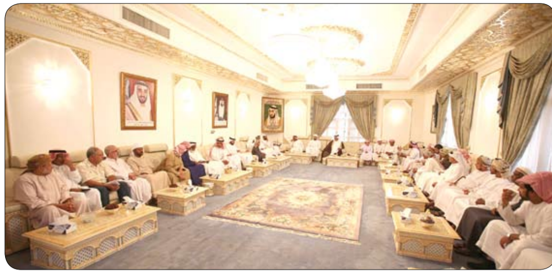
في مجلس بن حم بالعين