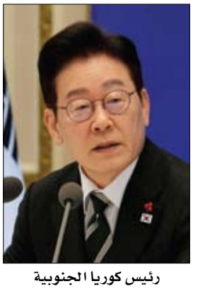
رئيس كوريا الجنوبية

•• سيول-وكالات: أعرب الرئيس الكوري الجنوبي لي جاي ميونج الاثنين، عن أسفه ليونج يانج بشأن إطلاق طائرات مسيرة إلى كوريا الشمالية في وقت سابق من هذا العام، واصفاً ذلك بأنه تصرف غير مسؤول ومتهور. في البداية، نفت سيول أي دور لها في عملية التوغل الجوي التي وقعت في يناير وقالت إنها من فعل مدنيين، لكن تحقيقات رسمية كشفت عن تورط مسؤولين حكوميين. وكانت كوريا الشمالية قد حذرت في فبراير من رد عنيف في حال رصدها المزيد من الطائرات المسيرة تعبر أجواءها من الجنوب. واستقبلت بيونج يانج في أوائل يناير طائرة مسيرة تحمل معدات مراقبة، وأظهرت صور نشرتها وسائل إعلام رسمية حطام طائرة متناثر على الأرض وأجزاء رمادية وزرقاء يزعم أنها تحتوي على كاميرات. وقال لي جاي ميونج خلال اجتماع مجلس الوزراء إنه تأكد تورط مسؤول في جهاز الاستخبارات الوطنية وجندي في الخدمة الفعلية. وأضاف: نعر عن أسفنا لكوريا الشمالية إزاء التهورات العسكرية غير المبررة التي سببتها تصرفات غير مسؤولة ومتهوره من بعض الأفراد. من جانبها وصفت كوريا الشمالية أمس إبداء الرئيس الجنوبي الأسف لبيونجيانج بشأن واقعة توغل مسيرات بأنه حسن حظ وحكمة بالغة، في خطوة تصاحبه نادرة تجاه خصم شهدت العلاقات معه توتراً شديداً.