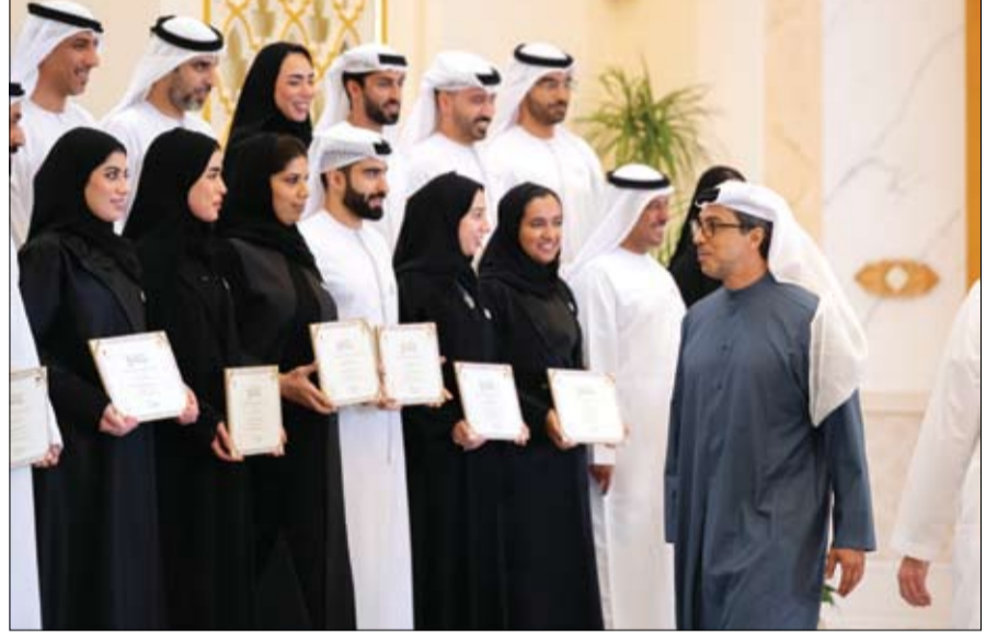
منصور بن زايد خلال تخريج الدفعة الثانية من برنامج (ياداف نافس) (وام)

•• أبوظبي-وام: تنفيذاً لتوجيهات صاحب السمو الشيخ محمد بن زايد آل نهيان رئيس الدولة حفظه الله، أعلن سمو الشيخ منصور بن زايد آل نهيان، نائب رئيس الدولة، نائب رئيس مجلس الوزراء، رئيس ديوان الرئاسة، رئيس مجلس إدارة مجلس تنافسية الكوادر الإماراتية، تمديد برنامج (نافس) حتى عام 2040، في خطوة تعكس حرص القيادة الرشيدة على استدامة برامج التوظيف، وتوفير بيئة عمل جاذبة ومستقرة للمواطنين، وترسيخ دورهم شريكاً رئيسياً في مسيرة التنمية الاقتصادية والاجتماعية الشاملة لدولة الإمارات. ووافق مجلس إدارة مجلس تنافسية الكوادر الإماراتية، خلال اجتماعه الذي عقد مس الاثنين في قصر الوطن، على حزمة من التحديثات على برنامج (نافس) تزامناً مع عام الأسرة 2026، شملت تعديل علاوة الأبناء لستغدي البرنامج من المواطنين دون تحديد حد أعلى لعدد الأبناء، تماشياً مع توجهات الدولة في تمكين الأسرة باعتبارها الركيزة الأساسية للمجتمع، وتضمنت التحديثات أيضاً إضافة برنامج دعم أبناء المواطنين العاملين في القطاع الخاص، وبرنامج دعم زوجات المواطنين العاملات في القطاع الخاص، في إطار حرص القيادة الرشيدة على تعزيز الاستقرار الأسري، وتمكين مختلف فئات المجتمع من المشاركة الفاعلة في سوق العمل ودعم مسيرة التنمية الاقتصادية. (التفاصيل ص3)