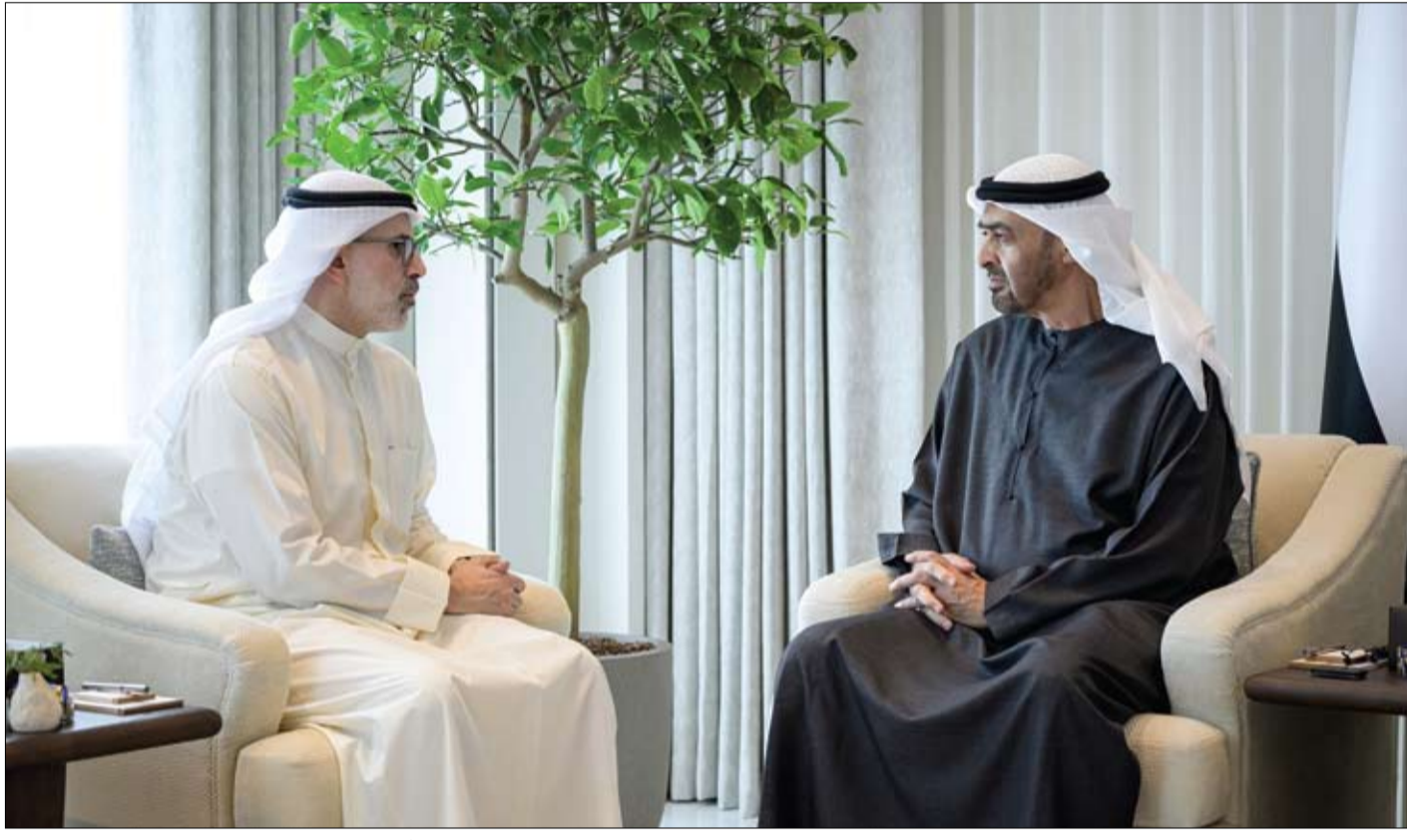
رئيس الدولة خلال مباحثاته مع وزير الخارجية في دولة الكويت الشقيقة

الدفاعات الجوية الإماراتية تعاملت مع 12 صاروخاً بالبستيا وصاروخين جوالين و19 طائرة مسيرة قادمة من إيران.. •• أبوظبي-وام: تعاملت الدفاعات الجوية الإماراتية أمس الاثنين مع 12 صاروخاً بالبستيا وصاروخين جوالين و19 طائرة مسيرة قادمة من إيران. وأعلنت وزارة الدفاع أنه منذ بدء الاعتداءات الإيرانية السافرة، تعاملت الدفاعات الجوية الإماراتية مع 519 صاروخاً بالبستيا، و26 صاروخاً جوالاً، و2210 طائرات مسيرة. وأدت هذه الاعتداءات إلى إصابة 4 بإصابات تتراوح بين البسيطة والمتوسطة والبلغة، وبذلك يبلغ إجمالي عدد حالات الإصابات 221 إصابة، من جنسيات متعددة تشمل الإماراتية، والصربية، والسودانية، والإثيوبية، والفلبينية، والباكستانية، والإيرانية، والهندية، والبنغلاديشية، والسريلانكية، والأذربيجانية، واليمنية، والأوغندية، والإريتريّة، واللبنانية، والأفغانية، والبحرينية، وجزر القمر، والتركية، والعراقية، والنيبالية، والنيجيرية، والعمانية، والأردنية، والفلسطينية، والفغانية، والإندونيسية، والسويدية، والتونسية، والمغربية، والروسية. ولم تسجل أي حالات استشهاد أو وفيات خلال الساعات الماضية، وبدلاً من ذلك، منذ بدء الاعتداءات الإيرانية السافرة، بلغ إجمالي عدد الشهداء شهيدتين إضافة إلى استشهاد مدني من الجنسية المغربية متعاقد مع القوات المسلحة، فيما بلغ إجمالي عدد القتلى 10 مدنيين من الجنسيات الباكستانية، والنيبالية، والبنغلاديشية، والفلسطينية، والهندية، والمصرية.