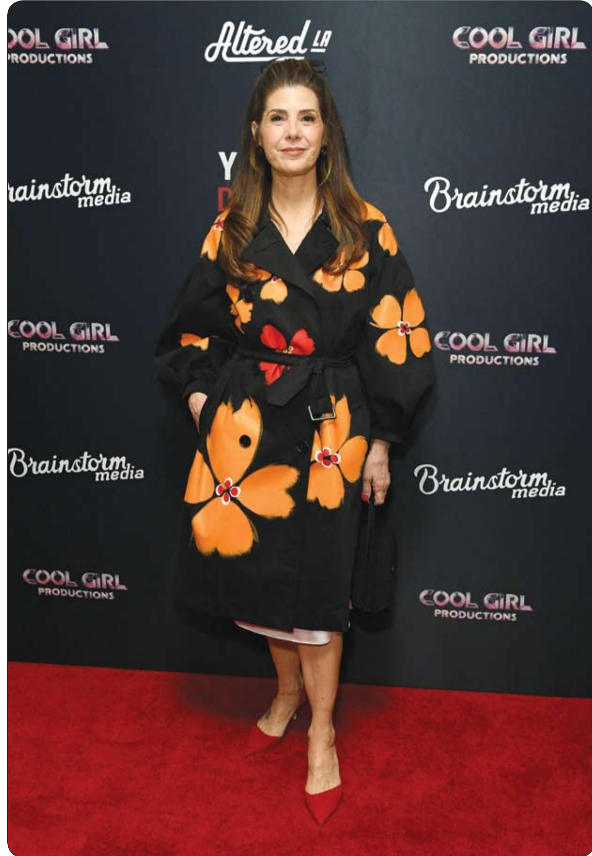
الممثلة الأمريكية ماريسا تومي لدى حضورها العرض الأول لفيلم «أنت تواعد نرجسيًا» في ويست هوليوود.

بدأت محكمة جنبايات المنصورة يوم أمس الأول الأحد محاكمة سيدة بتهمة الاتجار بالبشر، بعد كشف مخططها للاستيلاء على تركة زوجها المتوفى، عبر تزوير نسب طفلين مجهولين. وتعود جذور الجريمة إلى عام 2014، حينما قررت المتهمة شراء طفلين، هما «لين ومحمد» بالتعاون مع مجهول، تمهيداً لنسبهما زوراً إلى زوجها الراحل. ولم يكن الهدف من تلك الجريمة الأمومة، بل كان غرضاً مادياً بحثاً لاحتمال الميراث بالكامل وإقضاء باقي الورثة الشريكين. وكشفت تحقيقات النيابة العامة عن كواليس اختراق المتهمة للمؤسسات الرسمية، إذ استغلت موظفاً عاماً «حسن النية» لاستخراج شهادتي ميلاد مزورتين. ولم يتوقف الأمر عند هذا الحد، بل تمكنت من استصدار قرار وصاية رسمية رقم 117 لسنة 2022 من نيابة شؤون الأسرة، مستخدمة تلك الأوراق المزيفة لترسيخ وضعها كـ «أم أمام القانون». ووجهت النيابة العامة للسيدة اتهامات مباشرة من بينها الاتجار بالبشر، عبر شراء واستغلال أطفال لتحقيق منفعة مادية، والتزوير في محركات رسمية، بعد اتهامها بالتلاعب في شهادات الميلاد وقرارات الوصاية.