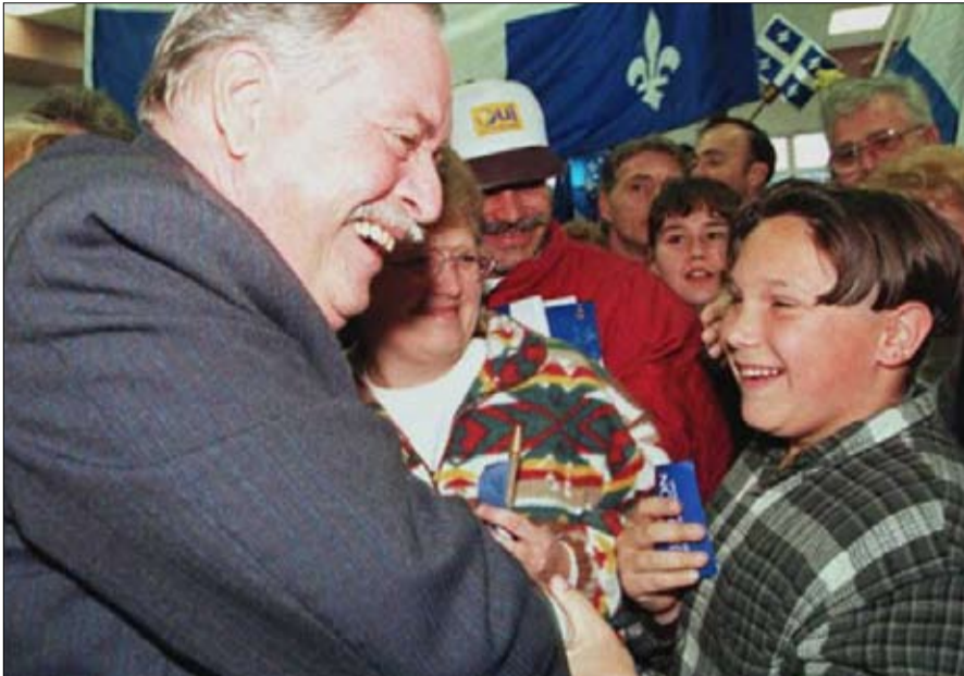
جاك باريزو خلال مظاهرة مؤيدة للسيادة

عضو مرصد الراديكاليات السياسية في مؤسسة جان جويس، باحث في العلوم السياسية، متخصص في البيوع والإعداد الثقافية للسياسة، ومؤلف العديد من البحوث منها "إلى اللقاء غرامشي" (منشورات سارف 2015).