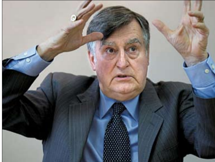
لوسيان بوشار من رموز كيبيك