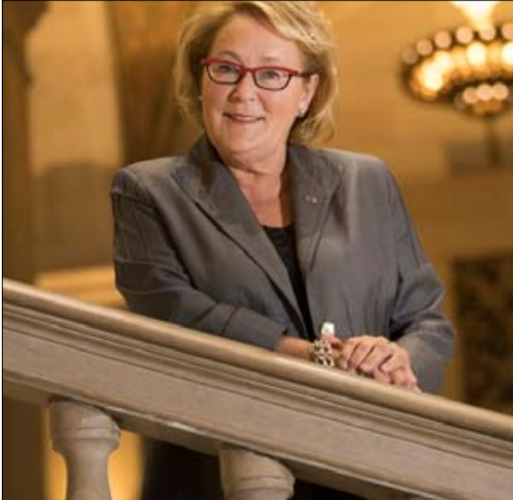
حاولت حكومة بولين ماروا إطلاق ميثاق قيم كيبيك