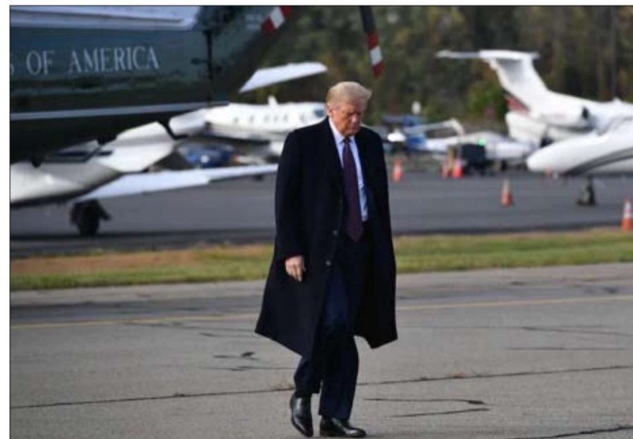
ترامب أيضا يصاب بالفيروس اللعين

كان رئيس الوزراء البريطاني أول من دفع الثمن في 27 مارس. بعد رهانه على المناعة الجماعية، ورفضه التوقف عن مصافحة معاونيه، أصيب بوريس جونسون، 56 عاماً، بفيروس كورونا الجديد. وكان لا بد من إدخاله إلى وحدة العناية المركزة، وعانى لعدة أيام من سعال مزمن وحُمى. على بعد 9 آلاف كيلومتر من لندن، أثبت الرئيس البرازيلي نتائج إيجابية في 7 يوليو لما أسماه "الأنفلونزا"، ولايات حالته الصحية الجيدة، لم يتردد جاير بولسونارو، 65 عاماً، من نزع كمامته عند اعلان الخبر: "هكذا، يمكنكم رؤية وجهي، وترون أنني بخير، وأنتي ما زلت هادئة وفي سلام"، قال الصحفي اليميني المتطرف لصحيفتين تفاعلا وبدر ما كانوا في حالة ذعر.