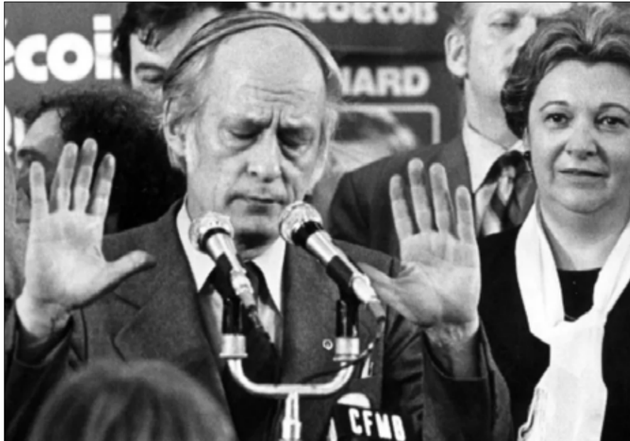
رينيه ليفيك أبو كيبيك الحديثة