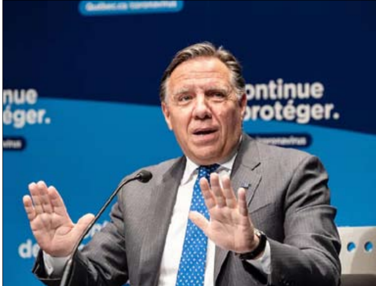
فرانسوا ليغو يؤكد إنه لا يريد سيادة كيبيك

إن تزامن الأسئلة الاجتماعية، والتطلع إلى تحديث مجتمع مقاطعة لايبيل، والتأكيد الدولي لامة كيبيك، سيحلل في جرابه حزياً جديداً، حزب كيبيك، إلى السلطة الإقليمية عام 1976. تولى الصحفي والنجم السابق في التلفزيون الكندي، الوزير الذي يتمتع بشعبية لتناميه الكهرباء، رينيه ليفيك، في وقت مبكر جداً دور القائد الكاريزمي للسيادة الوليدة. أما جاك باريزو، سليل الطبقة الوسطى العليا الناطقة بالفرنسية ولكنه تكون بشكل خاص في كلية لندن للاقتصاد، فقد سعى منذ البداية ليثبت لأهل كيبيك أن السيادة مفيدة اقتصادياً.