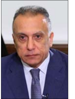
• بغداد- وكالات

بينما كان رئيس الوزراء العراقي مصطفى الكاظمي في طريقه إلى واشنطن في منتصف أغسطس (آب) مناقشة الدور الأمريكي في العراق، كانت صفقة هواتف ذكية تسلك الاتجاه العكس لصحة الجنود الأمريكيين في العراق.