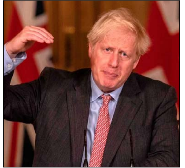
جونسون تراجع بعدما كتمت