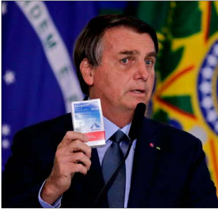
بولسونارو... السير عكس التيار

بركست شعارها الرئيسي، موجة هجرة مع تسجيل عدد قياسي من محاولات عبور نهر الماش انطلاقا من فرنسا في مراكب مترملة. وتعمدت وزيرة الداخلية بريتي باتل الأحد بالقيام "السنة المقبلة" بأكبر إصلاح لنظام طلبات اللجوء الذي عرفته بريطانيا في العقود الماضية "بدون إعطاء مزيد من التفاصيل". وأضافت "لكن للصراحة هذا الأمر سيستغرق وقتا" واعدة في الإثناء "بتسريع الرد العملي في مواجهة الهجرة غير الشرعية". وأوردت الصحافة من بين الخيارات التي تبحثها بريطانيا لثني المهاجرين عن القدوم إليها إرسال طالبي اللجوء إلى إحدى أراضيها في وسط المحيط الأطلسي أو تحويل عبارات قديمة أو حتى منصات غير مستخدمة في بحر الشمال إلى مراكز للمهاجرين. وبحسب السلطات الفرنسية فإن 6200 مهاجر حاولوا عبور المانش في الأشهر الثمانية الأولى من السنة على متن قوارب مطاطية. وساهم انتشار فيروس كورونا المستجد في تثفيف هذه الحركة بحسب الوكالة البريطانية لمكافحة الجريمة.