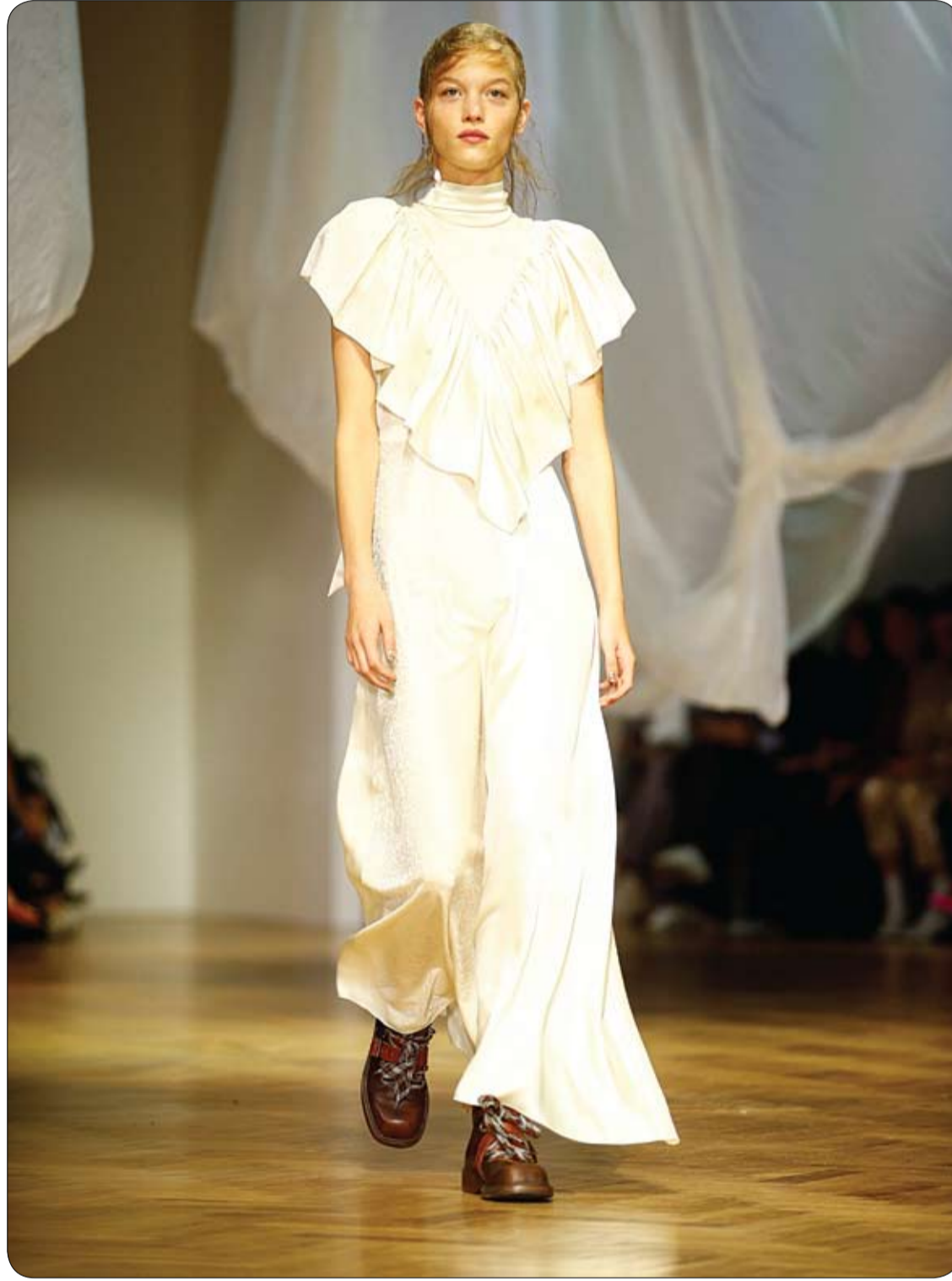
عارضة أزياء تعرض فستاناً من مجموعة برين باي ثورنتون بريغاتزي خلال أسبوع الموضة في لندن

قررت غوغل إيقاف العمل بتطبيق صندوق البريد الخاص بها "Inbox"، وسيتمتع على المستخدمين التحول إلى اعتماد تطبيق وخدمات "Gmail" التابع للشركة، قبل التاريخ المحدد لإيقاف التطبيق. وكتب فريق "Inbox" على تويتر قائلا: "على مدى السنوات الأربع الماضية، ساعدتونا على تحسين البريد الإلكتروني، لقد قدمنا ميزات Inbox الناشئة إلى Gmail لمساعدة المستخدمين على إنجاز المزيد من المهام، شكرا. سنركز على Gmail وسنقول وداعا إلى Inbox في نهاية مارس 2019". ويعد فريق "Inbox" في غوغل جزءا من فريق "Gmail" الأوسع، وأشار موقع "ذي فيرج" المتخصص في الأخبار التقنية، إلى أن التخلي عن هذا التطبيق لن يفقد أيًا من الموظفين عمله. وطرح تطبيق وخدمات Inbox في أكتوبر 2014، للمساعدة على تحسين خدمة البريد الإلكتروني Gmail. كما طرحت الشركة التطبيق كمنصة تجريبية لاختبار الميزات الجديدة التي سيتم طرحها لاحقا على Gmail. ثم في ماي 2015، قدمت الشركة إصدارا محسنا من التطبيق، صمم لجعل تصفح البريد الإلكتروني تجربة أكثر إنتاجية وسهولة. وذكر المتجر الإلكتروني "غوغل بلاي" أنه تم تنزيل تطبيق "Inbox" أكثر من 10 ملايين مرة منذ إنطلاقه، مقابل مليار تنزيل لتطبيق Gmail الذي يتم تضمينه في معظم أجهزة أندرويد. وتتمتع غوغل بتاريخ طويل مع إغلاق الخدمات التي لا تعتبرها شائعة، وقد أثار هذا الخبر امتعاض عدد كبير من المستخدمين.