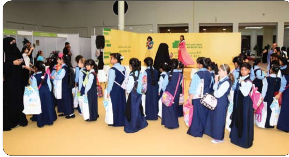
تصاحبه عروض موسيقية من الشعوب