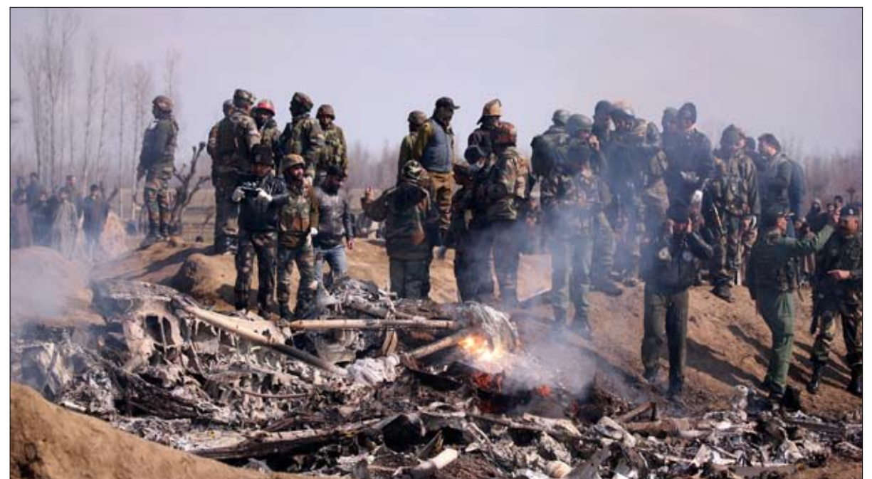
تصعيد محدود استسرع رغبته؟