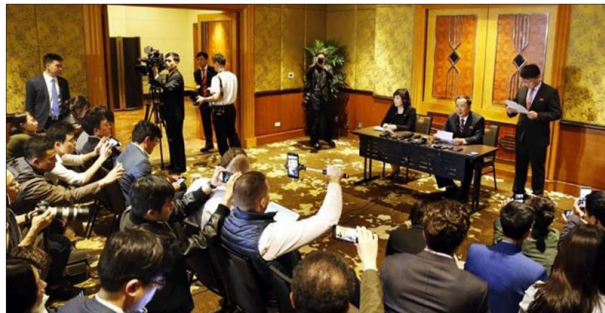
وزير خارجية كوريا الشمالية ينفي ادعاء ترامب

طالبت بيونغ يانغ برفع عقوبات خمس من عشر قرارات مجلس الأمن، انخفضت عقابا على هروبها اليابستي إلى الأمام عام 2016 و2017، حسب مصادر دبلوماسية، وهذا أقل مما صرح