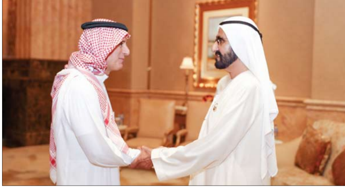
محمد بن راشد خلال استقباله الجبير

لم يتأخر رد كيم جونج أون، طويلًا في هانوي. بعد ساعات من إقلاع طائرة دونالد ترامب في ختام قمة اختزلت قسرا، فوض الزعيم الكوري الشمالي وزير خارجيته بتفكيك اتهامات الرئيس الأمريكي الذي أراد أن يلبس عباءة الفضل. نضى ري يونغ هو، مسؤوليية بلاده عن فشل المحادثات النووية، وذلك خلال مؤتمر صحفي نادر عقد على عجل ليلا في فندق ميليا، أين يقبع كيم. لا، بيونغ يانغ لم تطلب رفع جميع العقوبات الدولية، على عكس ما قاله ترامب: «في الواقع، أراد الكوريون رفع العقوبات بالكامل، ولكن لا يمكننا أن نفعّل ذلك»، قال سيد البيت الأبيض في مؤتمر عقد قبل أن يغادر فينتام. وهكذا ظهرت، في أعقاب القمة الثانية بين وحشي الدبلوماسية العالمية، ظهرت، تفاصيل عملية لي الذراع، واحتدمت المعركة الاتصالية، فقد تمسك كل بموقفه، مما جر المفاوضات إلى طريق مسدود. طالبت بيونغ يانغ برفع عقوبات خمس من عشر قرارات لمجلس الأمن، اتخذت عقابا على هروبها الياليسي إلى الأمام. (التفاصيل ص 2)