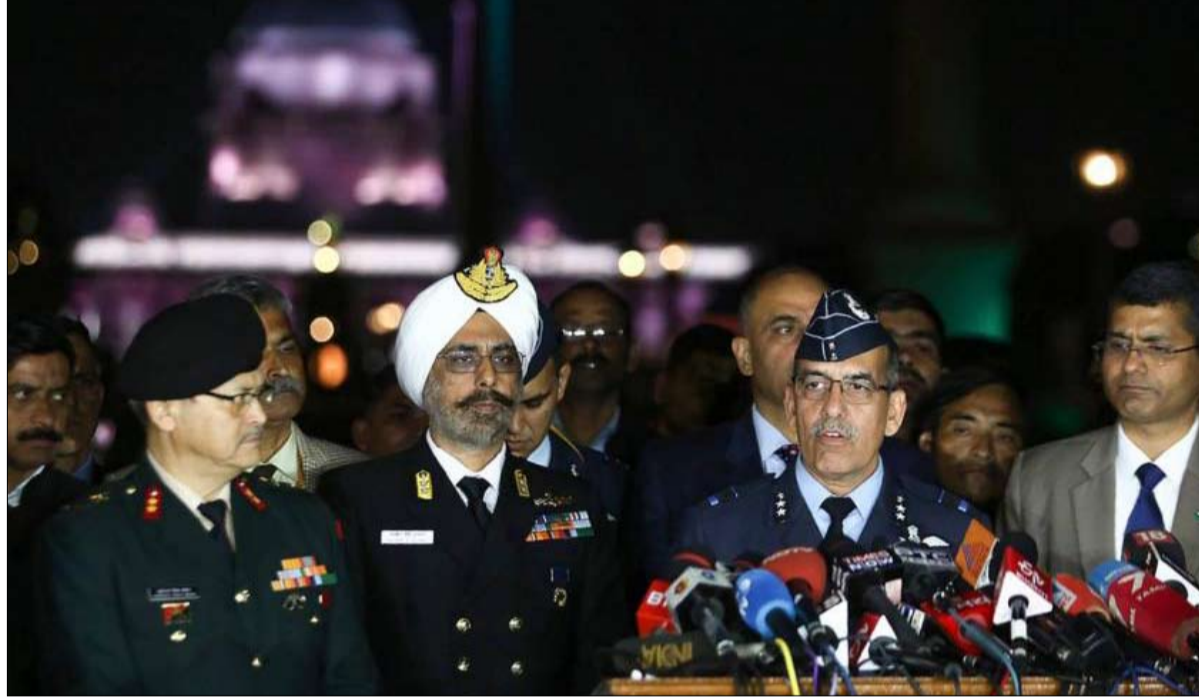
الهند تعلن الطوارئ