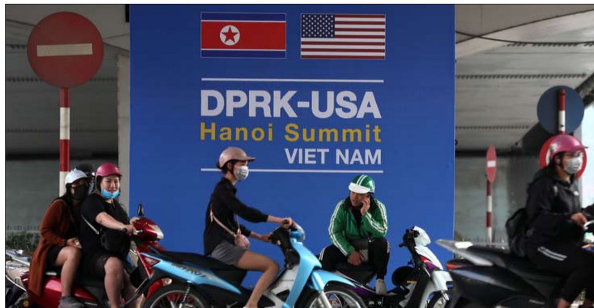
قمة فيتنام قمة الفشل