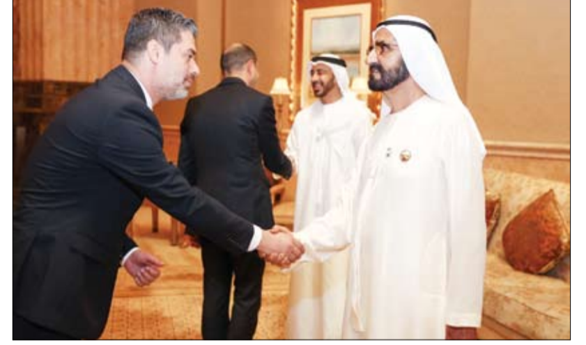
استقبل وزراء خارجية الدول الإسلامية بقصر الإمارات