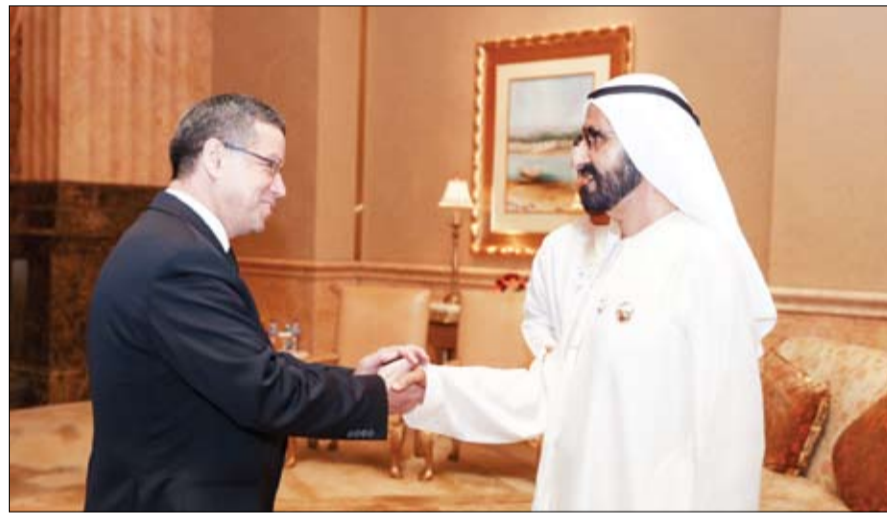
في اجتماعاتهم والتوصل إلى اقتراحات وتوصيات تصب في خدمة قضايا الشعوب الإسلامية خاصة ما يتصل بالتمنية الاقتصادية والبشرية وغيرها من المواضيع التي تهم الدول

الأعضاء وأمنها واستقرارها. حضر اللقاء معالي الدكتور أنور بن محمد قرقاش وزير الدولة للشؤون الخارجية ومعالي ريم بنت إبراهيم الهاشمي وزيرة دولة لشؤون التعاون الدولي ومعالي الدكتور سلطان بن أحمد الجابر وزير دولة ومعالي زكي أنور نسيبة وزير دولة ومعالي الدكتور يوسف بن أحمد العثيمين أمين عام منظمة التعاون الإسلامي وسعادة خليفة سعيد سليمان مدير عام دائرة التشرريفات والضيافة في دبي إلى جانب سفراء الدول العربية والإسلامية المحتمدين لدى الدولة.