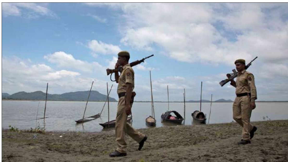
حدود كشمير مشتتة باستمرار