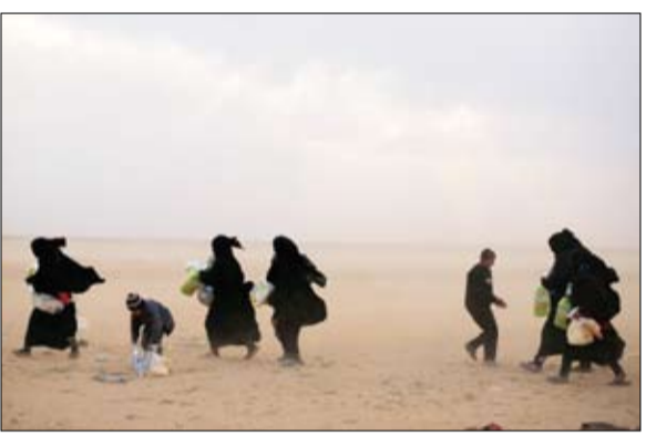
عائلات سورية تنزح من قرية الباغوز

• عواصم - وكالات: قالت الأمم المتحدة أمس الجمعة إن ما لا يقل عن 84 شخصاً، لثناهم أطفال، لاقوا حتفهم منذ ديسمبر (كانون الأول) وهم في طريقهم إلى مخيم الهول في شمال شرق سوريا بعد أن هربوا من تنظيم داعش الإرهابي بمحافظة دير الزور. وقال المتحدث باسم مكتب الأمم المتحدة لتنسيق الشؤون الإنسانية ينس لايركه، خلال إفادة صحفية، «هناك تقرير عن ملاح 175 طفلاً بمستشفيات من أعراض طبية ناجمة عن سوء حاد في التغذية». من جانب آخر، أعلن مدير المكتب الإعلامي لقوات سوريا الديمقراطية، مصطفى بالي، في تصريحات لرويترز، أمس، أن قواته تتوقع «معركة شرسة»، مع مقاتلي تنظيم «داعش»، الذين لا تزال قواتها تتقدم في شرق سوريا، وتعلن تحريرها قبل أن تتأكد تماماً من مغادرة المدنيين لها، مؤكداً: «توقع معركة شرسة». وكان القائد العام لقوات سوريا الديمقراطية، مظلوم كوياني، قد توقع أن تعلن قواته بعد أسبوع خلال الفترة الماضية 24 مقاتلاً.