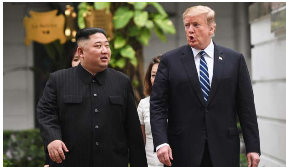
هل كان كيم ونهما.. أم إن ترامب بخيل؟