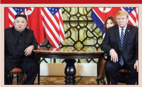
نظرة تلخص حالة العشق المنوع

السيب 2 مارس 2019 م - 25 جمادى الآخرة 1440 العدد 12568 Saturday 2 March 2019 - Issue No 12568