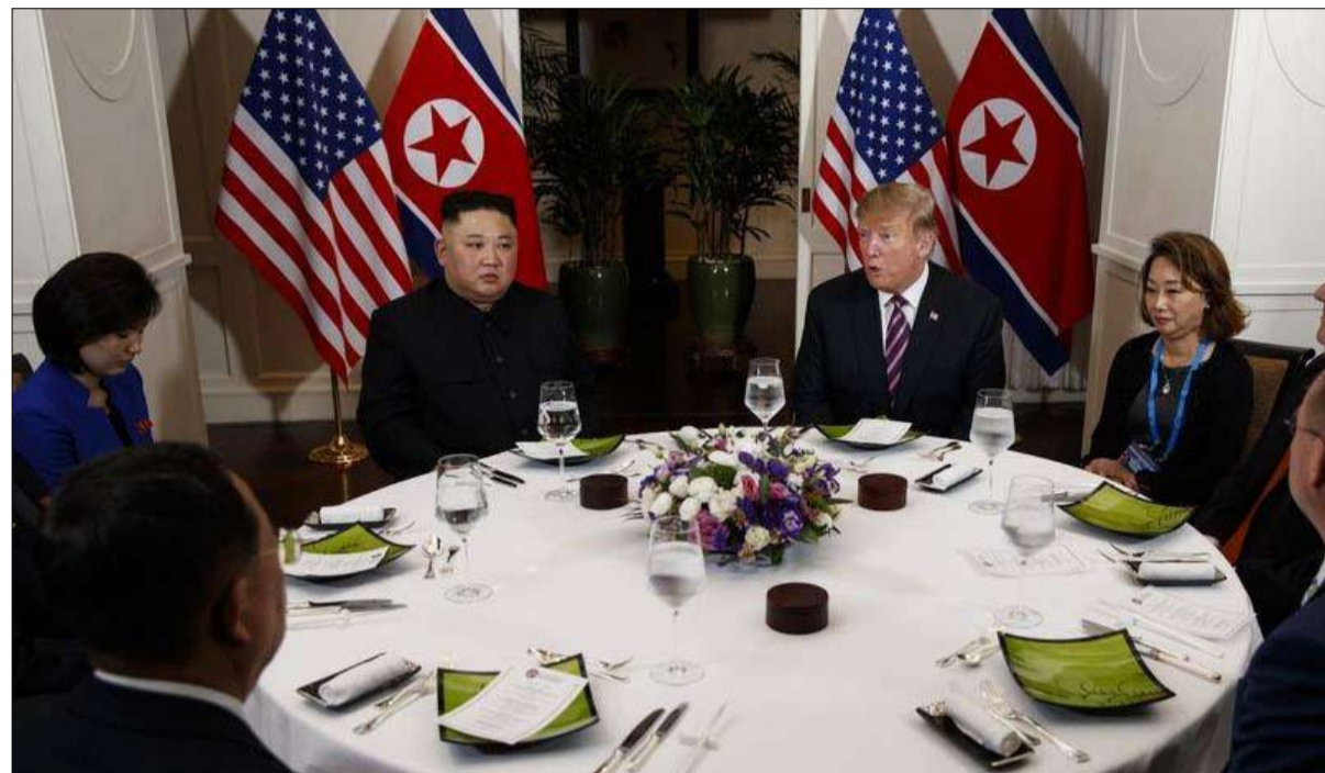
العودة الى نقطة الصفر