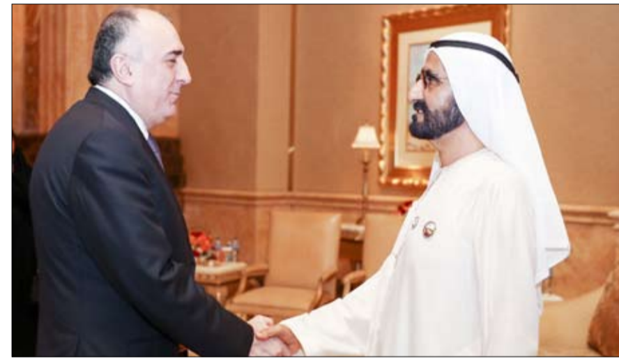
وتمنى صاحب السمو الشيخ محمد بن راشد آل مكتوم لوزراء خارجية دول منظمة التعاون الإسلامي النجاح والتوفيق

•• أبوظبي-وام: استقبل صاحب السمو الشيخ محمد بن راشد آل مكتوم نائب رئيس الدولة رئيس مجلس الوزراء حاكم دبي (رعاه الله) بقصر الإمارات مساء أمس بحضور سمو الشيخ عبدالله بن زايد آل نهيان وزير الخارجية والتعاون الدولي.. أصحاب المعالي وزراء خارجية الدول الإسلامية الذين بدأوا أعمال اجتماعهم في العاصمة أبوظبي. وقد رحب صاحب السمو الشيخ محمد بن راشد آل مكتوم بالوزراء الذين تفلوا لسموه تحيات زعماء ورؤساء حكومات دولهم متمنين