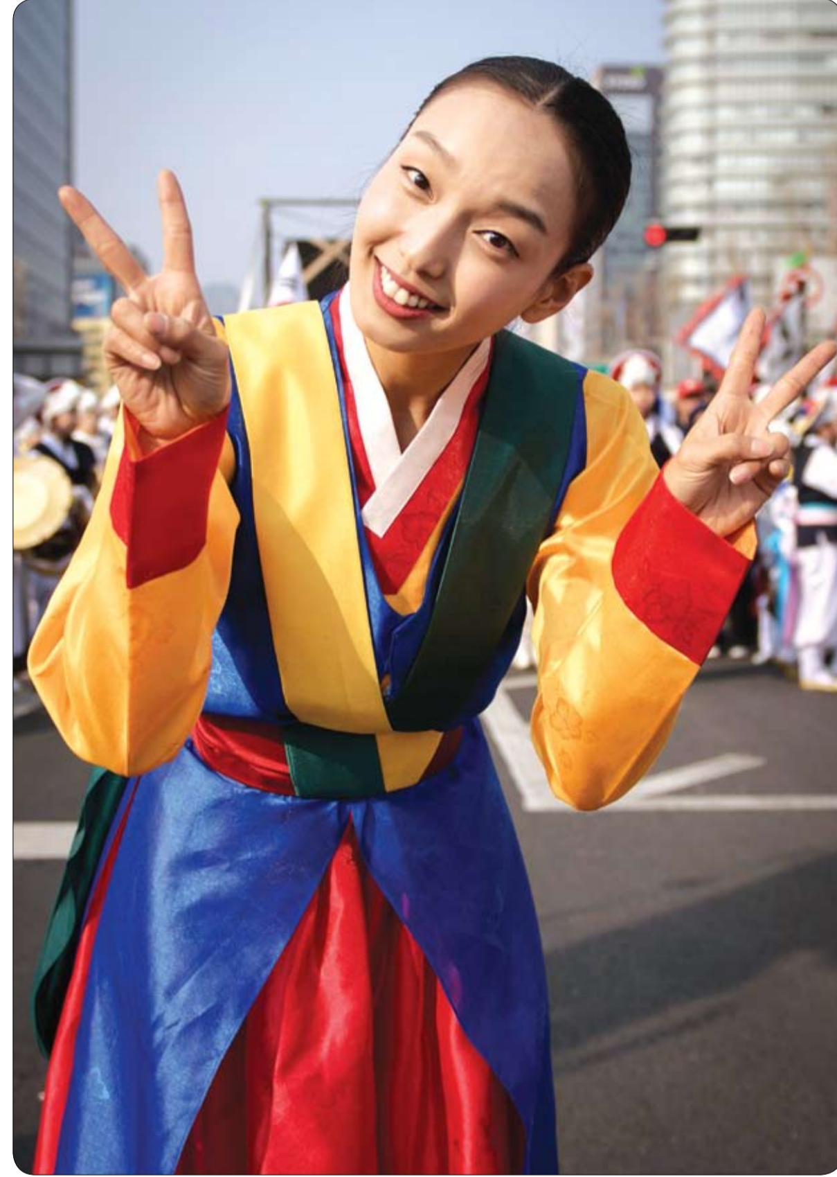
راقصة ترتدي اللباس التقليدي بعد تأديتها رقصة شعبية تقليدية بمناسبة احتفال كوريا الجنوبية بمرور مئة

قال اختصاصي العلاج النفسي الألماني أندرياس زيببيك إن الميسوفونيا "Misophonia" هي اضطراب عصبي يتميز بردة فعل سلبية تجاه سماع بعض الأصوات، خصوصاً الأصوات في الفم كالضغغ والسعال، وغيرها من الأصوات كصوت الكتابة على لوحة المفاتيح وصيرير القلم. وأضاف زيببيك أن الميسوفونيا المعروفة أيضاً "بمتلازمة حساسية الصوت الانتقائية" تصنف ضمن رهاب القنارة، مشيراً إلى أن سببها غير معلوم، ولكن يعتقد الأطباء أنها ترجع إلى وجود خلل في النظام السمعي في الدماغ، أو إلى عوامل وراثية.