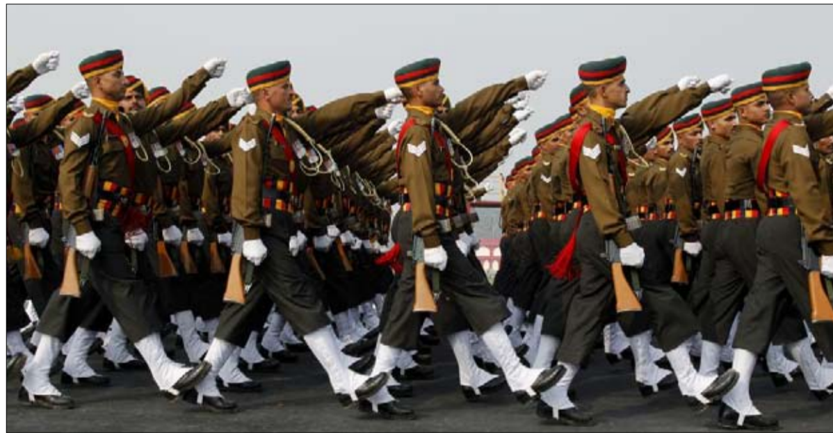
عقيدتان عسكريتان مختلفتان

هناك خطر كامن في أي أزمة؛ سوء تفسير نية الخصم في وقت ما، ونقص المعلومات، والحوادث غير المتوقعة