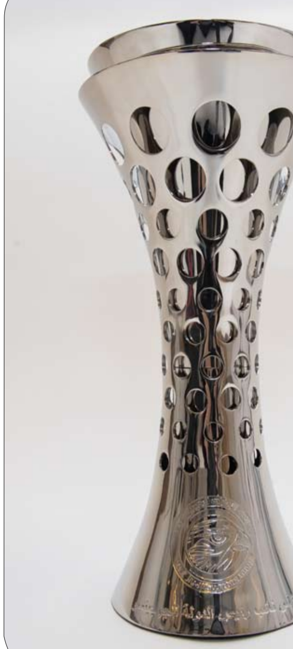
للجوجيتسو، سعياً لحصد أكبر عدد من الميداليات المونة ونيل كأس البطولة في التصميم الفريد، من بطولة كأس صاحب السمو في الجولة الختامية منها.