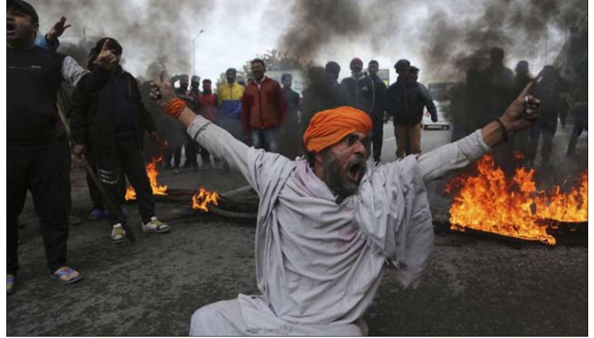
الراي العام الهندي يضغط