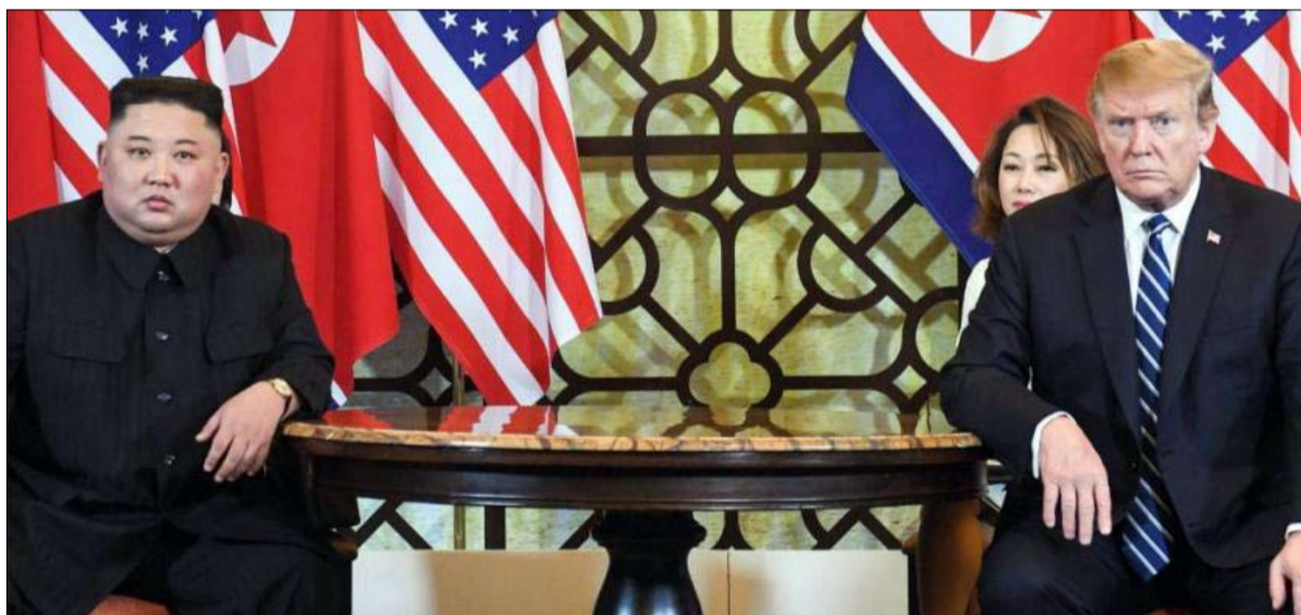
نظرة لتلخص حالة العشق المنوع

أدى تنازل. وقال دنيا ديفيز الخبير في مؤسسة "بريموشن اسونيسيز"، وهي مؤسسة فكرية أمريكية، "طلب كيم الكثير وكان نهما للغاية". كما إنها أيضاً عودة إلى الأرض بالنسبة لدبلوماسية ترامب، التي حلمت بحدوث اختراق تاريخي، حيث فشل أسلافها. إن طريقها، التي تميزت بقمة أعادت على عجل، في غضون بضعة أسابيع، قد تحلمت على الواقع الصلب للصفحة، حيث كسر أوباما ويوش أسنانها.