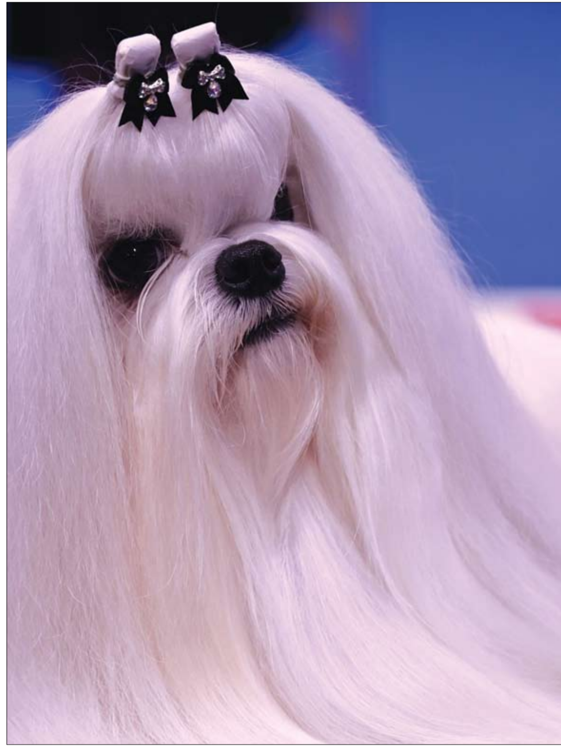
كلب مالطي يتم تجهيزه وتزيينه للمشاركة في (معرض شنغهاي العالمي للكلاب) في شنغهاي