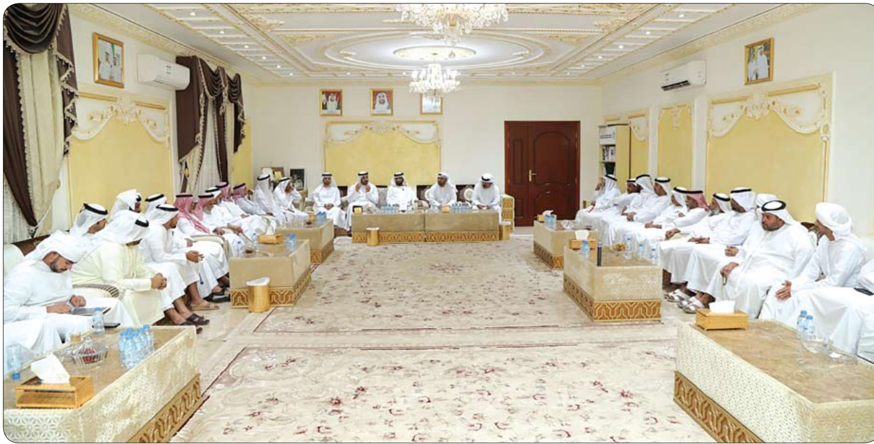
خلال محاضرة توعوية نظمتها في مجلس سالم بن كبيبة الراشدي