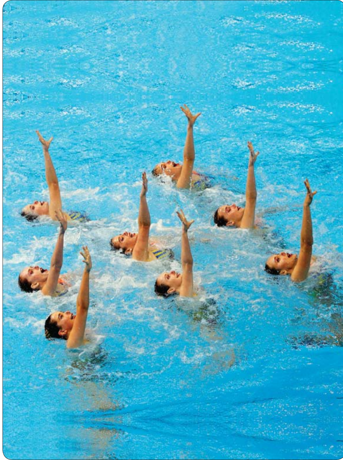
فتيات فريق نيوزيلاندا يؤدين عرضاً في السباحة الإيقاعية ضمن بطولة العالم الثامنة عشرة للسباحة بكوريا الجنوبية.

- النساء الحوامل أكثر عرضة للأوردة الدوالي يمكن أن تشمل الأعراض ألم الساقين والكاحلين المتورمتين - الأشخاص الذين يعانون من زيادة الوزن لديهم خطر متزايد من الدوالي - تتأثر الأوردة البعيدة عن القلب مثل الموجودة في الساقين بالجاذبية التي تجعل تدفق الدم إلى القلب أكثر صعوبة وفي حالة ممارسة الضغط على البطن يؤدي للإصابة على الدوالي مثل الحمل والإمساك الخبراء ليسوا متأكدين من سبب امتداد جدران الأوردة أو سبب خلل الصمامات في كثير من الحالات يحدث ذلك دون سبب واضح ولكن هناك عوامل تؤدي إلى الإصابة بها وهي: - سن اليأس عند السيدات - الحمل - الوقوف لفترات طويلة - وجود تاريخ عائلي للإصابة الدوالي - السمنة المفرطة الدوالي تصيب النساء أكثر من الذكور نتيجة لأن الهرمونات عند الإناث تؤدي إلى الاسترخاء الأوردة ويؤدي تناول تناول حبوب منع الحمل أو العلاج الهرموني إلى ظهورها . النساء أكثر عرضة للإصابة بالدوالي أثناء الحمل أكثر من أي وقت آخر في حياتهم فالنساء الحوامل لديهن المزيد من الدم في الجسم هذا يضع ضغطاً إضافياً على الدورة الدموية، بالإضافة إلى ذلك، يمكن أن تؤدي التغييرات في مستويات الهرمونات إلى استرخاء جدران الأوعية الدموية، هذان العاملان يزيدان من خطر الإصابة بالدوالي.