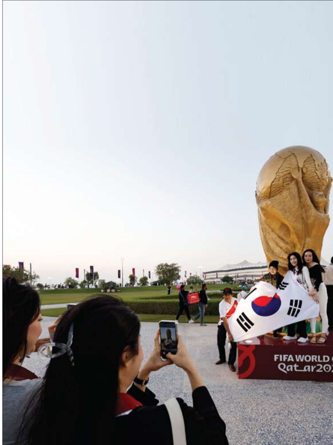
جماهير من كوريا الجنوبية يقفون لالتقاط صورة أمام نسخة طبق الأصل من كأس العالم في قطر

على الرغم من أن ارتفاع الكوليسترول في الدم يمكن أن يتراكم بهدوء في الشرايين دون ظهور العديد من العلامات التحذيرية، فقد تتمكن من اكتشاف الجاني بمجرد تقدم الحالة. ويمكن أن يسد تراكم الكوليسترول الشرايين ويحد من تدفق الدم إلى ساقيك. وتوضح NHS أن هذا يشار إليه أيضا باسم مرض الشرايين المحيطية (PAD). وهذه الحالة قادرة على إطلاق إشارة تحذير كريهة الرائحة، وإذا كان تدفق الدم إلى ساقيك "مقيدا بشدة"، فقد تتعرض لخطر الإصابة بنقص تروية الأطراف الحرجة (CLI). ويصف CLI مضاعفات "خطيرة للغاية" يمكن أن يكون "من الصعب معالجتها". وفقا لـ NHS، ويمكن أن تتسبب هذه الحالة أيضا في ظهور علامة كريهة. وتوضح الخدمة الصحية أن الجلد الموجود على أصابع قدميك أو أطرافك السفلية يمكن أن يصبح باردا وخدرا، ويتحول إلى اللون الأحمر ثم الأسود، و/أو يبدأ في الانتفاخ وينتج عنه القرح. ويمكن أن تسبب هذه المضاعفات ألما شديدا ويجب معالجتها "على الفور". ومع ذلك، من المهم ملاحظة أن ارتفاع الكوليسترول نادرا ما يتسبب في ظهور علامات تحذيرية. وهذا هو السبب في أن الطريقة الأكثر موثوقية لتحديد مستوياتك هي من خلال فحص الدم.