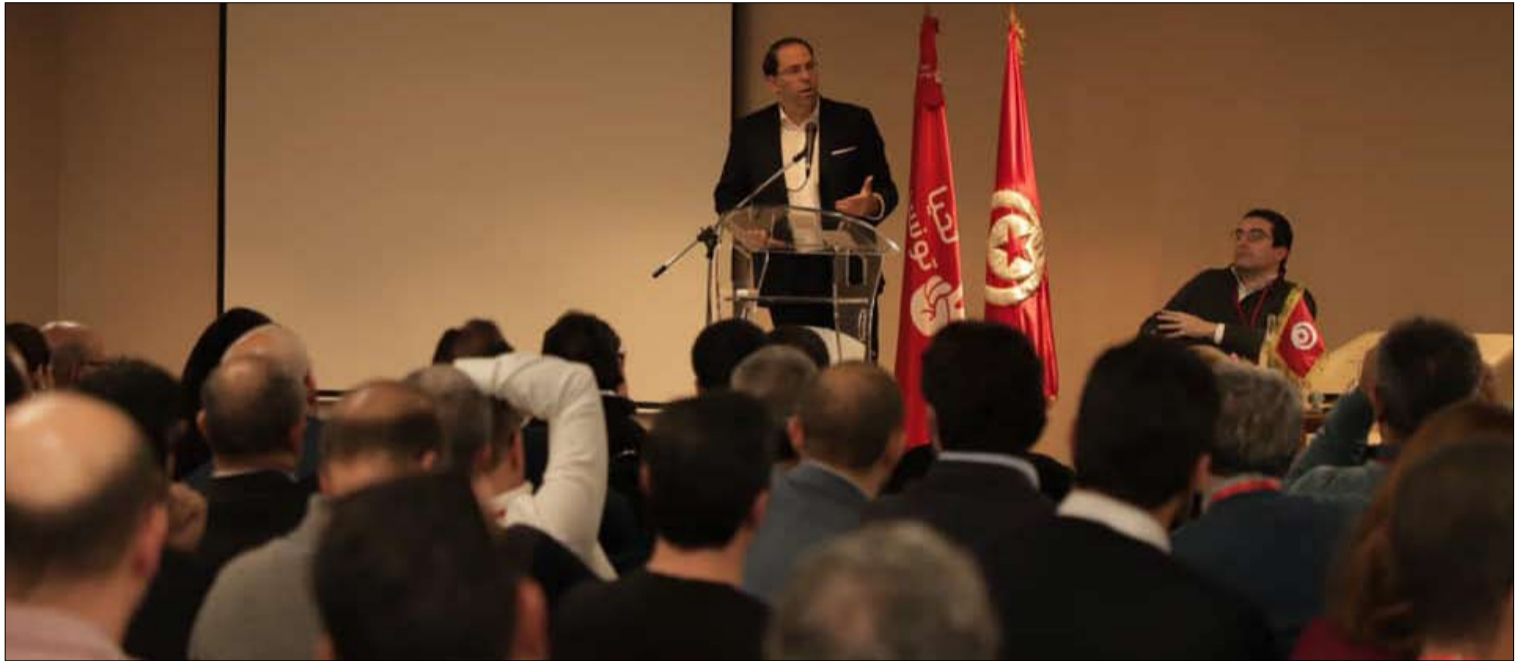
تحيا تونس... لن تصوت للحكومة