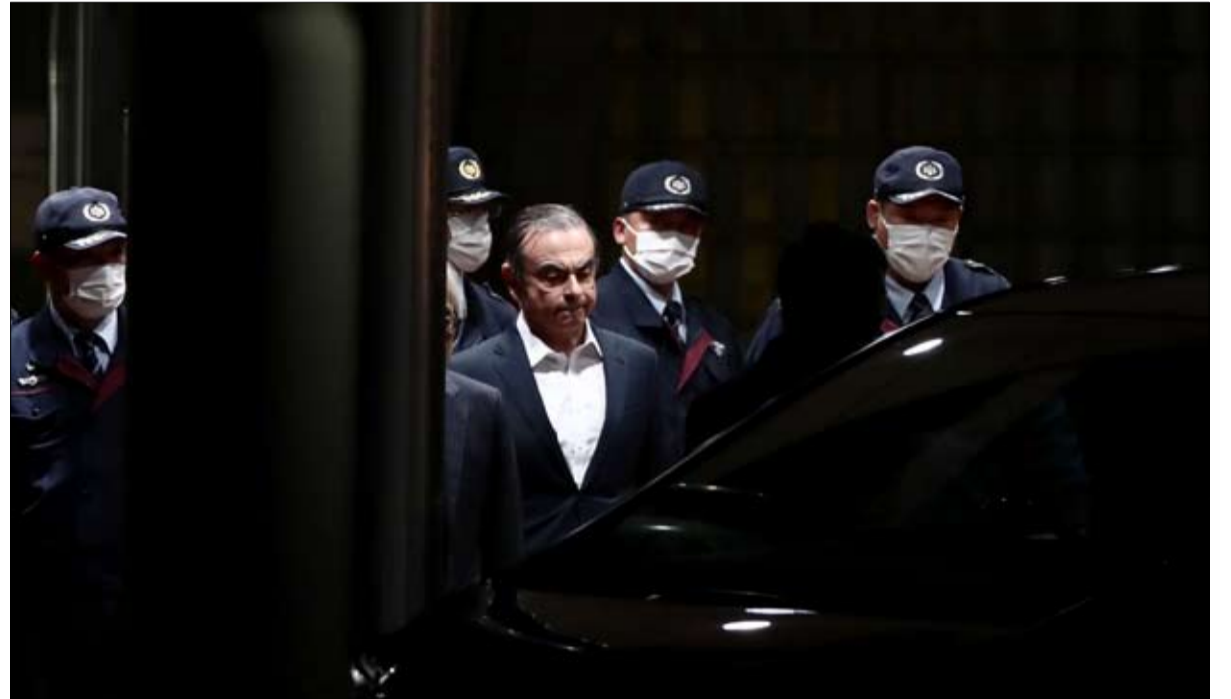
كارلوس غصن... قصة هروب سينمائية

في العين والساق. وحلقت تلك الاصابات اثارها، فهو اليوم يعرج. كتوم، عمل جورج زايبك كثيرا في العراق، خاصة لصالح القوات الأمريكية خلال حرب عام 2003. كان مسؤولاً عن حماية فصائل الأجهزة العسكرية، كما قام بمهام حساب شركات، حيث قام بتنظيم حماية المواقع الصناعية الحساسة في العراق وبلدان الشرق الأوسط الأخرى. يوصف بأنه رجل شجاع يحب العيش في خطر، واليوم، قد يكون متخماً... فقد كان عليه تناول جرعة جيدة من الأدرينالين خلال تلك الليلة الخاصة جداً، من الأحد 29 إلى الاثنين 30 ديسمبر.