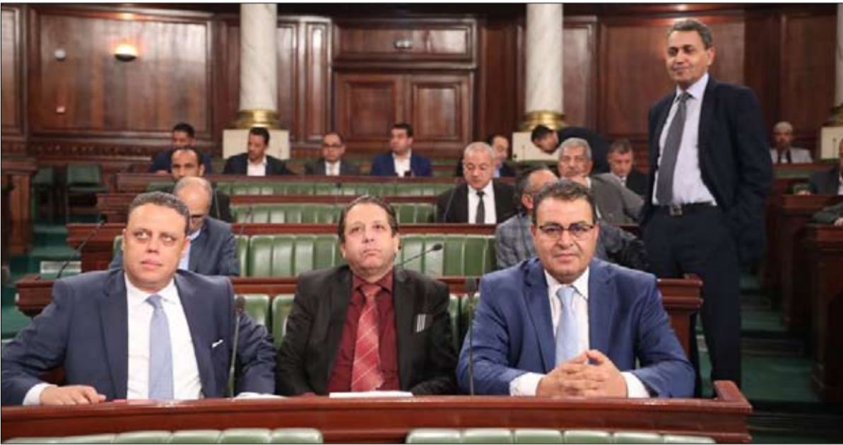
حركة الشعب... خطر على الدولة