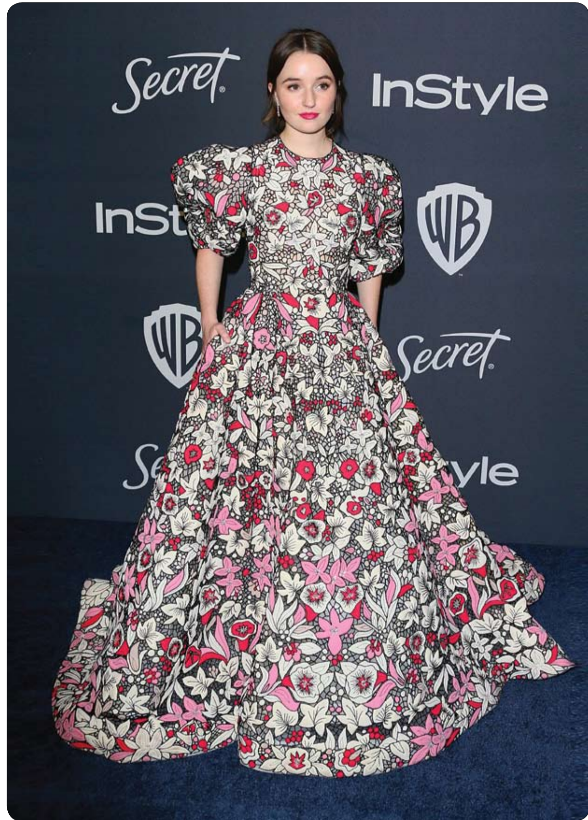
الممثلة الأمريكية كايتلين ديفر خلال حضورها الحفل السنوي الحادي والعشرين لشركة InStyle and Warner Bros. في بيغزلي هيلز، كاليفورنيا.

تطرح شركة Kholer الأمريكية رأس دش ذكي مدمج به ميكروفون "Moxie AI" يدعم مساعد أمازون الافتراضي "أليكسا"، ليتيح سماع الموسيقى ومعرفة الأخبار والتسوق الإلكتروني عبر موقع أمازون، من داخل الحمام. ويبلغ سعر رأس الدش بين 99 و 229 دولارا أمريكيا، ويمكن شراء ميكروفون صوت "Moxie AI" مع أو دون رأس الدش، ودمجه داخل الحمام، مع مجموعة كبيرة من خيارات "أمازون أليكسا" وهو مقاوم للماء بفضل دعمه لمعيار "IPX67"، ويمكن التحكم فيه الكبير بأزرار التحكم باللمس ويُسحب لاسلكيا، حسب ما ورد في موقع "غادغيت" الإلكتروني المعني بالأخبار التقنية. ويعمل ميكروفون الصوت المدمج في الدش الذكي من 6 إلى 7 ساعات متواصلة، وسيتاح للطلب المسبق في وقت لاحق من العام الجاري، وتستهضر الشركة منتجها الجديد في معرض الإلكترونيات الاستهلاكية CES 2020" في لوس أنجلوس في الولايات المتحدة، بين 7 و 10 يناير "كانون الثاني" الجاري.