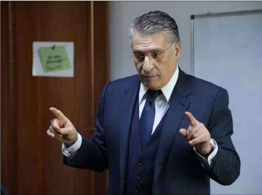
نبيل القروي .. حكومة النهضة