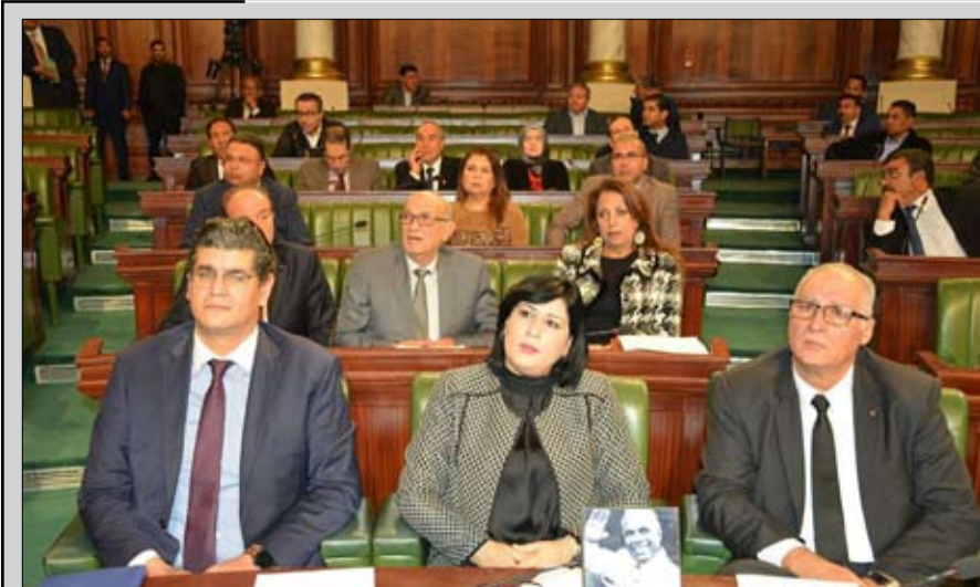
كتلة الدستوري الحر... تدخل يمس من الأمن القومي التونسي

وكشف ان الجملي لم يتشاور مع قلب تونس حول التركيبة والاسماء، وأنه لم يتجاوب لا مع اقتراحاته ولا مع برنامجها، مبينا أن الحزب يعتبر ان الحكومة ضخمة العدد، وأن هيكلتها وتوزيع الحقائب فيها لا يمكن اعادة تاخبي 2019. ودعا إلى اقرار اجراءات وتعديلات ومراجعات للحكومة شكلا ومضمونا، مبرزا ان التوجه الاقرب بالنسبة للحزب في صورة اصرار الجملي على موقفه سيكون عدم التصويت للحكومة. يشار إلى ان الحبيب الجملي كان شدد على انه لن يجري أية تغييرات على تركيبة حكومته المقترحة. وكان مكتب المجلس قد حدد يوم الجمعة 10 يناير كموعدا لجلسة منح الثقة لحكومة الجملي المقترحة.