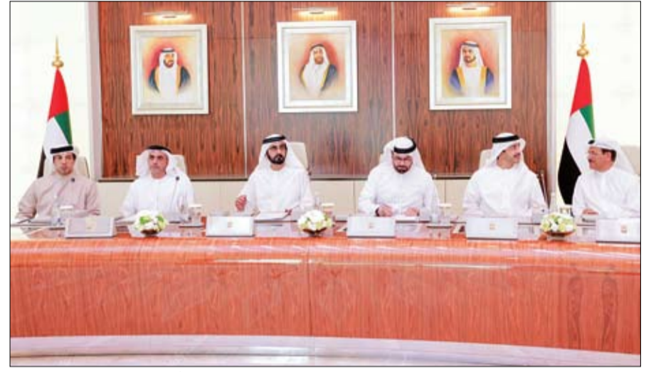
محمد بن راشد خلال ترؤسه اجتماع مجلس الوزراء (وام)

محمد بن زايد يؤكد حرصه على أن تتحول مبادئ وثيقة الأخوة الإنسانية إلى واقع تعيشه شعوب العالم أبوظبي-وام: استقبل صاحب السمو الشيخ محمد بن زايد آل نهيان ولي عهد أبوظبي نائب القائد الأعلى للقوات المسلحة أعضاء اللجنة العليا لتحقيق أهداف وثيقة الأخوة الإنسانية التي تعقد اجتماعها الخامس في العاصمة أبوظبي. ورحب سموه بأعضاء اللجنة - خلال اللقاء الذي