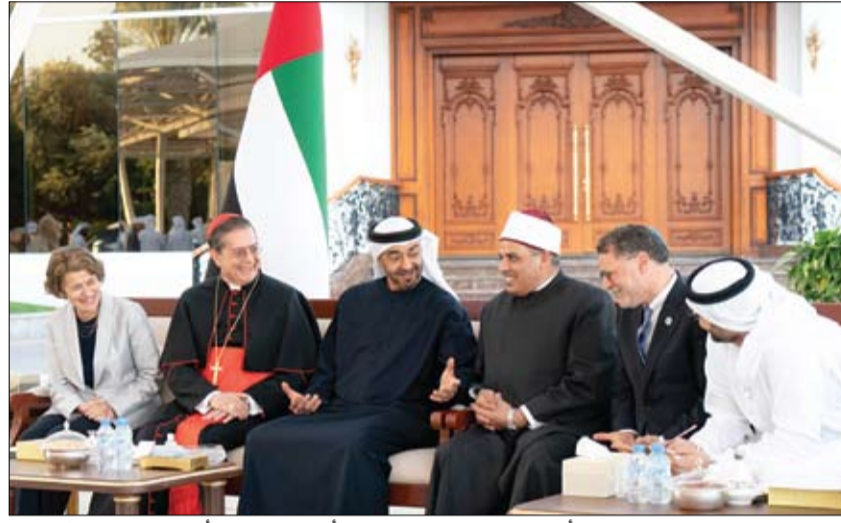
محمد بن زايد خلال استقباله أعضاء اللجنة العليا لتحقيق أهداف وثيقة الأخوة الإنسانية (وام)

الإمارات تدين بشدة الهجوم الإرهابي على قاعدة عسكرية في كينيا أبوظبي-وام: أدانت دولة الإمارات بشدة الهجوم الذي نفذته حركة الشباب الإرهابية على قاعدة عسكرية تستخدمها قوات أمريكية في لامو بشمال كينيا، وأدى إلى سقوط قتلى وجرحى. وأكدت وزارة الخارجية والتعاون الدولي في بيان لها أن دولة الإمارات تعرب عن استنكارها الشديد لهذه الأعمال الإجرامية، ورفضها الدائم لجميع أشكال العنف والإرهاب الذي يستهدف زعزعة الأمن والاستقرار ويتنافى مع القيم والمبادئ الدينية والإنسانية. وأعربت الوزارة عن خالص تعازيها ومواساتها لأهالي وذوي الضحايا جراء هذه الجريمة الشكراء وتمنياتها بالشفاء للعاجل لجميع المصابين. الإمارات ترحب بتأسيس مجلس الدول العربية والإفريقية المطلة على البحر الأحمر وخليج عدن أبوظبي-وام: رحبت دولة الإمارات بالإعلان عن تأسيس مجلس الدول العربية والإفريقية المطلة على البحر الأحمر وخليج عدن بما يعزز الأمن والاستقرار في المنطقة، وقالت وزارة الخارجية والتعاون الدولي في بيان لها إن من شأن هذا المجلس أن يعزز من آليات الاستقرار والتعاون والتنسيق بين الدول المطلة على البحر الأحمر والمنطقة بأكملها. وأكدت أن مجلس الدول العربية والإفريقية المطلة على البحر الأحمر وخليج عدن يمثل بعدا مؤسسيا ضروريا للتنسيق بين جميع هذه الدول والتعاون فيما بينها بما يعود بالفائدة عليها وعلى شعوب المنطقة. وشملت وزارة الخارجية والتعاون الدولي جهود المملكة العربية السعودية الدبلوماسية ودورها المحوري في الوصول إلى تأسيس المجلس والتوقيع على ميثاقه.