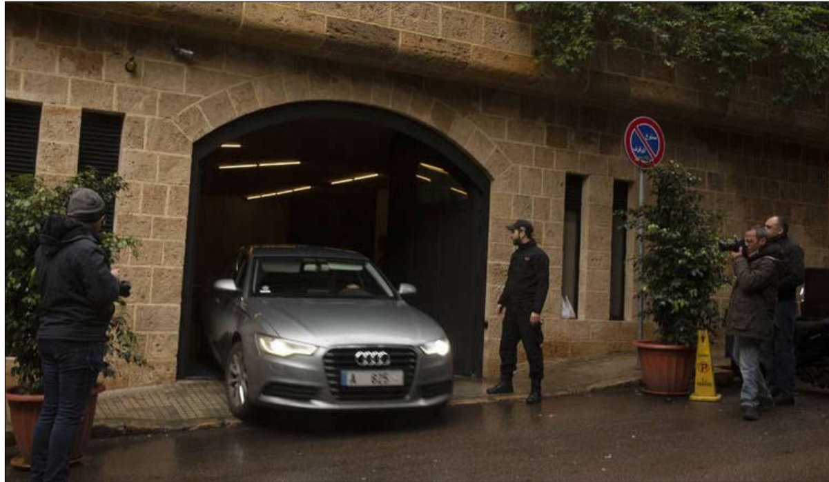
مقر إقامة غصن في بيروت

انتفض العراقيون في وجه البرلمان بعد قرار إنهاء الوجود الأجنبي في العراق، مطالبين بفضه لما قد يجلبه من عقوبات اقتصادية على البلد الذي يعاني أصلاً من ظروف اقتصادية متردية، وبعد أن هدد الرئيس الأمريكي دونالد ترامب بفضها على بغداد. ونقل موقع قناة "الحرة" أمس الاثنين، أن عراقيين يرون أنه في الوقت الذي تعاني فيه إيران من أزمة اقتصادية خانقة بسبب العقوبات الأمريكية، تجر مليشياتها في العراق، البلاد إلى المصير نفسه، وربما أسوأ بعد أن قال ترامب إن "عقوباته المنتظرة لم يروا مثلها من قبل.. وأشار ترامب إلى أن الولايات المتحدة لن تغادر العراق قبل استعادة كلفة قواعدها العسكرية هناك، بعقوبات قاسية على بغداد، وقال في تصريحات